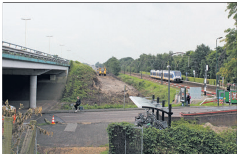
In Hollandsche Rading worden voorbereidingen getroffen zoals het verleggen van kabels en leidingen en kappen van bomen. In november 2017 zal een begin worden gemaakt met de inrichting van het werkterrein bij de Onderdoorgang Vuursche Dreef.