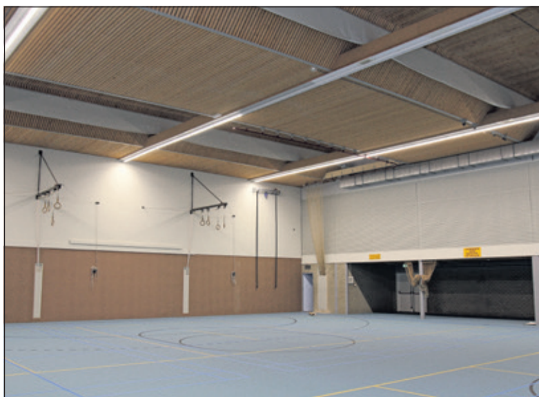
In de herfstvakantie komt er nog een nieuwe vloer in de vernieuwde sportzaal.

Volgens planning wordt op 25 augustus het pand opgeleverd aan Gemeente De Bilt. Voor die tijd rondt het bedrijf de laatste werkzaamheden af; zoals bijvoorbeeld het ophangen van de laatste LED-verlichting, het afmaken van het schilderwerk en een grote schoonmaakbeurt. Tussen 26 augustus en 4 september zorgen de gebruikers van het pand dat hun materialen weer terug komen in De Vierstee. De officiële heropening vindt plaats na de laatste werkzaamheden op 27 oktober 16.00 uur. Meer informatie over het programma volgt op een later moment.