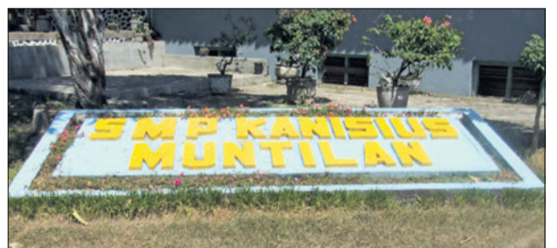
De basisschool Kanisius in Moentilan.