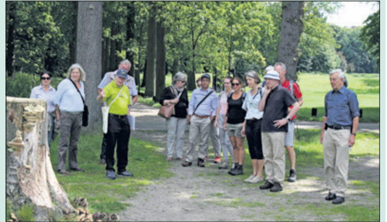
Het Utrechts Landschap organiseerde zondag 6 augustus voor 15 personen een wandelexcursie over Landgoed Houtringe, dat voornamelijk uit bos en open grasland bestaat. Er staan dikke eiken en beuken met een doorsnede van meer dan een meter en van ruim 225-jarige leeftijd.