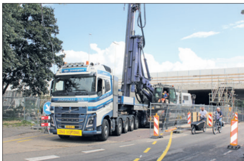
Ter hoogte van de A27/Groenekansweg (onderdoorgang Groenekansweg) wordt het viaduct met 4 meter verbreed. Voor deze verbreding worden de zijkanten aan de westzijde van het viaduct gesloopt.

derkalender en planning. Er is ook een filmpje gemaakt over wat het project inhoudt 'A27/A1 in 5 minuten'. Kijk op www.facebook.com/devierklank om het filmpje te bekijken. De werkzaamheden aan de Onderdoorgang Groenekansweg met