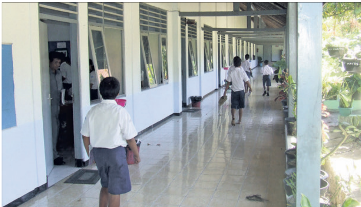
Het voormalige jappenkamp in Moentilan is nu een katholieke basisschool.

de ziekenboeg goed verzorgd werd. Er waren nog veel nonnen en daar hadden de Jappers toch wel respect voor. Het was in Moentilan niet zo hard als later in Ambarawa. Als kind beleef je de honger en dorst anders. Mijn moeder ruilde 's nachts haar sieraden voor eten. Ze zei later dat haar trouwring het enige was dat ze bewaard heeft. We moesten het meestal doen met een tapiocapapje.