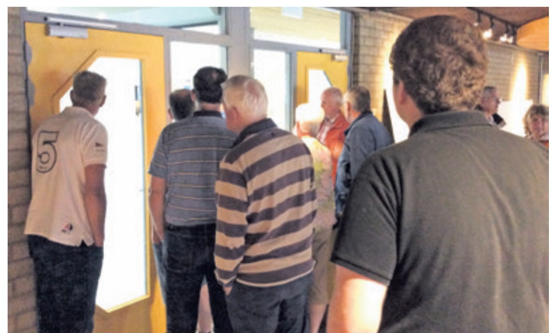
Een select gezelschap neemt alvast een kijkje in De vierstee.