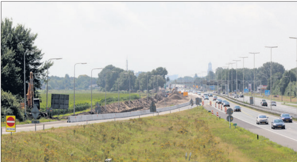
Gezien vanaf ovonde in Nieuwe Wetering: Op de A27 komt een spitsstrook van de aansluiting Utrecht-Noord naar de aansluiting Bilthoven.

Gemeld werd dat de storing nog tot ruim in het weekeinde zou kunnen duren. Sylvia de Bres berichtte zaterdag 5 augustus hierover nog: 'Tijdens het aanbrengen van damwanden zijn in Groenekan zes glasvezelkabels geraakt van KPN en Ziggo. Ondanks zorgvuldige voorbereidingen om te kunnen bouwen, komt het voor dat kabels geraakt worden. Monteurs zijn vanaf vrijdagmiddag direct gestart om het zo snel mogelijk te verhelpen'.