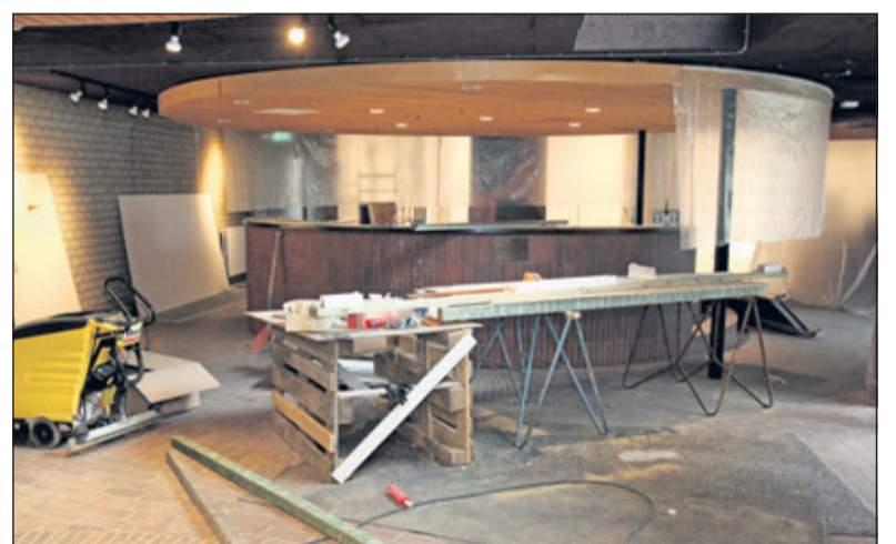
De bar wordt straks weer de centrale ontmoetingsplek.