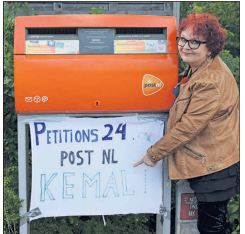
Al meer dan 1.000 mensen tekenden de petitie.

Voor wie de petitie wil ondertekenen: www.petitions24.com .