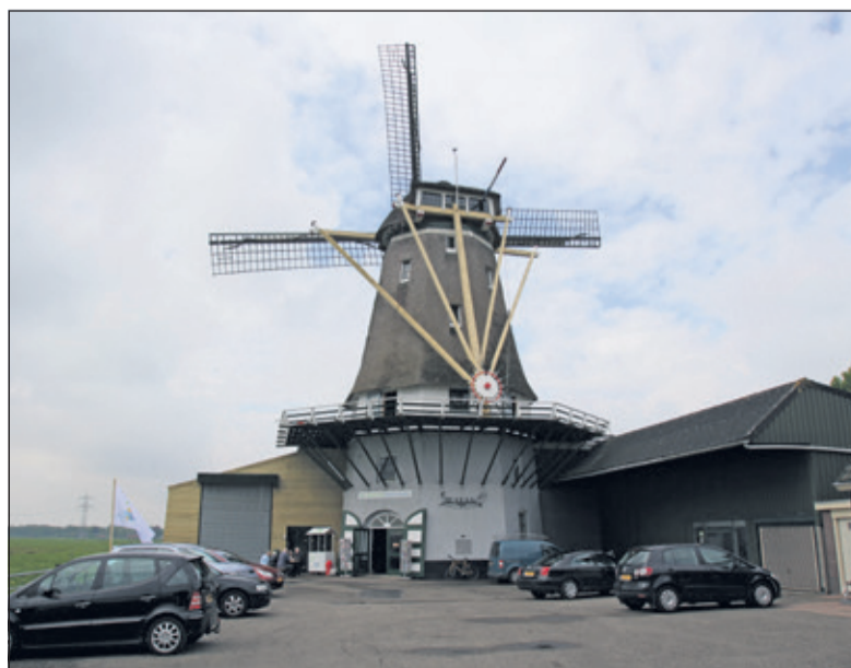
Op open monumentendag valt een boerenlunch, ludiek theater en folkmusic bij molen de Kraai te verwachten.