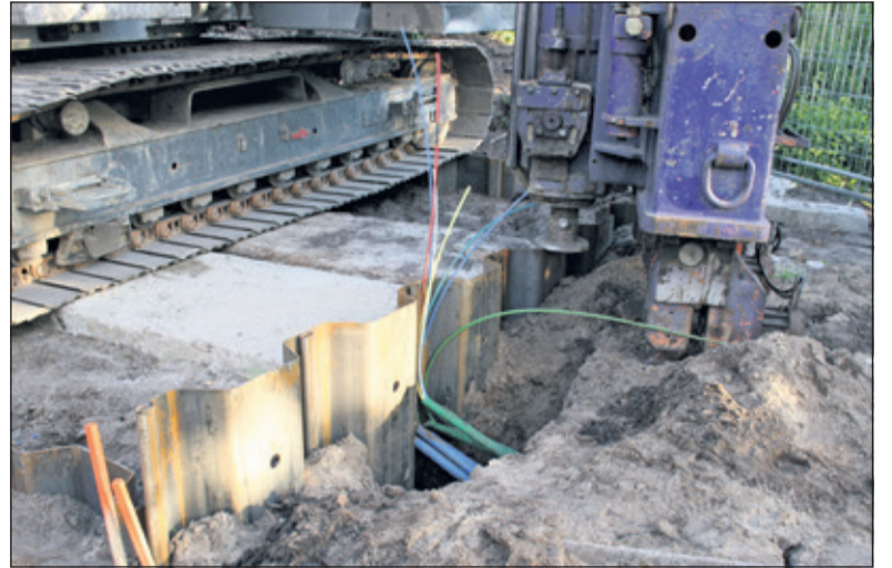
Bij het plaatsen van een damwand werden de glasvezelkabels van Ziggo en KPN doorgesneden en zaten veel inwoners een dag zonder internet, televisie en telefoon.