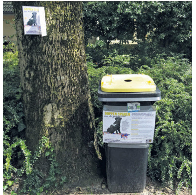
De kliko staat prominent aan de Prinsenlaan 15. Op het pamflet wordt uitgelegd wat het belang is van het inzamelen van doppen.