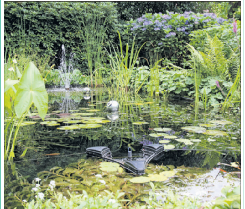
De afdeling Groei en Bloei De Bilt-Bilthoven bood afgelopen zaterdag een bezoek aan de Open Tuin van Henriëtte Heim aan de Bilthovense Lassuslaan aan: een tuin met vaste planten, een vijver, en verschillende terrassen. De tuin nodigt uit om een wandelingetje te maken omdat niet alles vanaf het grote terras te zien is.