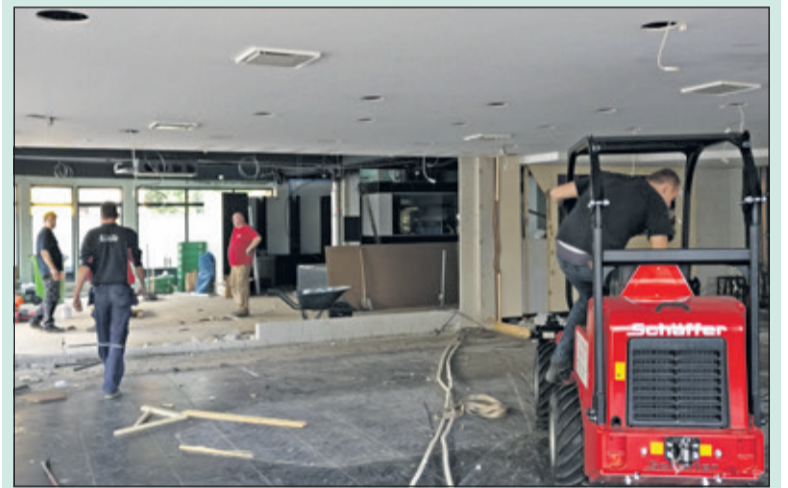
Vrijdag 4 augustus was de oude winkel al geheel ontmanteld en werd er direct al een doorbraak naar de naastgelegen ruimte gerealiseerd.

Landwaart Culinaire verbouwt de winkel; de naastgelegen ruimte wordt bij de huidige winkel getrokken, die daardoor bijna in oppervlakte verdubbeld. De (huidige) zaak is gesloten van 4 augustus t/m woensdag 30 augustus. [HvdB]