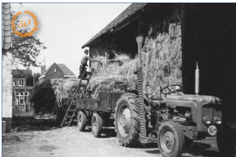
Het begon allemaal met het boerenbedrijf aan de Utrechtseweg.

momenteel lastiger om werk binnen te krijgen. Er heeft een duidelijke verschuiving plaatsgevonden in de verdeling van het werk tussen particulieren en bedrijven c.q. overheid. Momenteel ligt dat zowel voor onderhoud als aanleg op zo'n 50% waarbij het werk voor de particulieren is toegenomen. Dat heeft, denken we, wel met de crisis te maken. Mensen verhuizen nu niet zo snel meer en besluiten dan toch wat