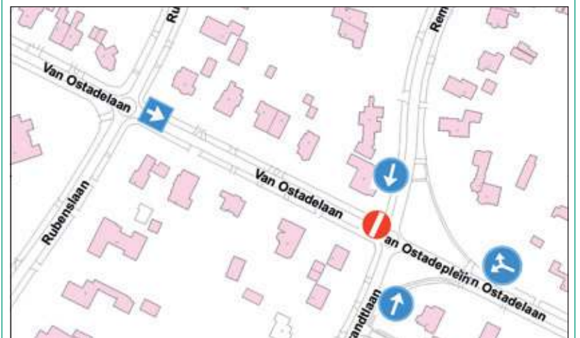
Straks wordt de situatie zo.