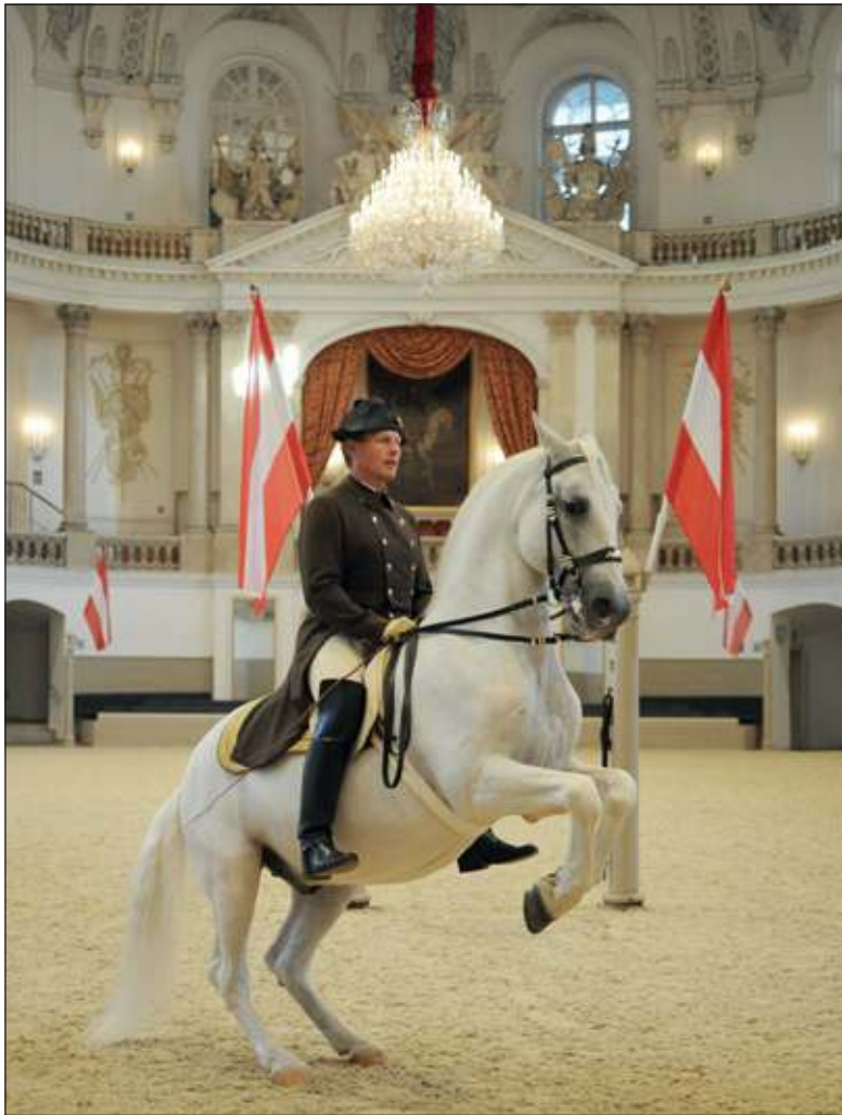
Heel bijzonder is het optreden van de Spaanse Rijsschool uit Wenen, dat maar eens in de vijf jaar plaatsvindt in de Ahoy.