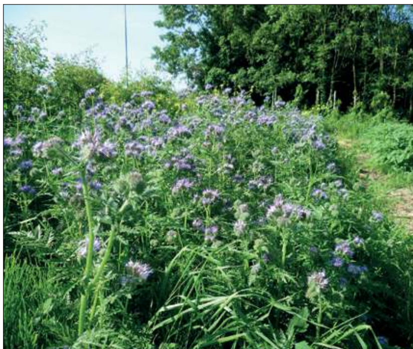
Phacelia: Najaarsbloem met meerdere functies.

in de voorbije regenmaanden vaak niet uitvliegen. Er is dan ook nog niet veel honing geslingerd, maar de afgelopen zomerse week kan dat misschien wel helemaal goedmaken. Wilt u meehelpen aan het verbeteren van de bijenstand én uw moestuin biologisch bemesten geef dan via debijenwij@gmail.com of 0346 213473 door hoeveel m2 phacelia u wilt inzaaien. De actiegroep zorgt dan dat u de benodigde hoeveelheid zaad in huis krijgt.