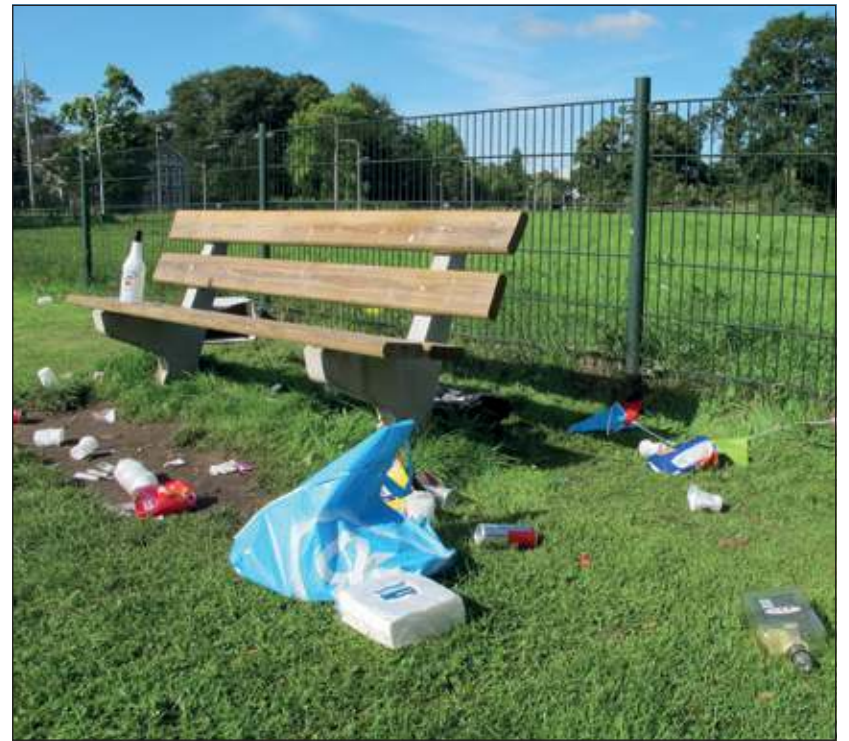
De resultaten van een feestje bij de JOP in het Van Boetzelaerpark liggen er niet om en de meeste gebruikers van het park ergeren zich er behoorlijk aan.

Twee mannen die hun honden aan het uitlaten zijn, staan te praten op het gras tussen de JOP en de bankjes. Ze komen allebei dagelijks in het park, vertellen ze. Een van hen woont wel aan het park, maar meer aan de kant van de Hessenweg. 'Deze rommel is incidenteel. Over het algemeen valt het wel mee. Normaal wordt die opgeruimd door mensen van de gemeente. Ze rijden hier vaak met busjes.' De andere man woont dichterbij. 'Ik vind het een rotzootje. Het