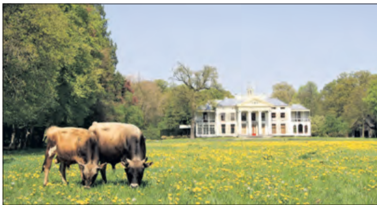
Stiertjes genieten tegenover Eyckenstein.