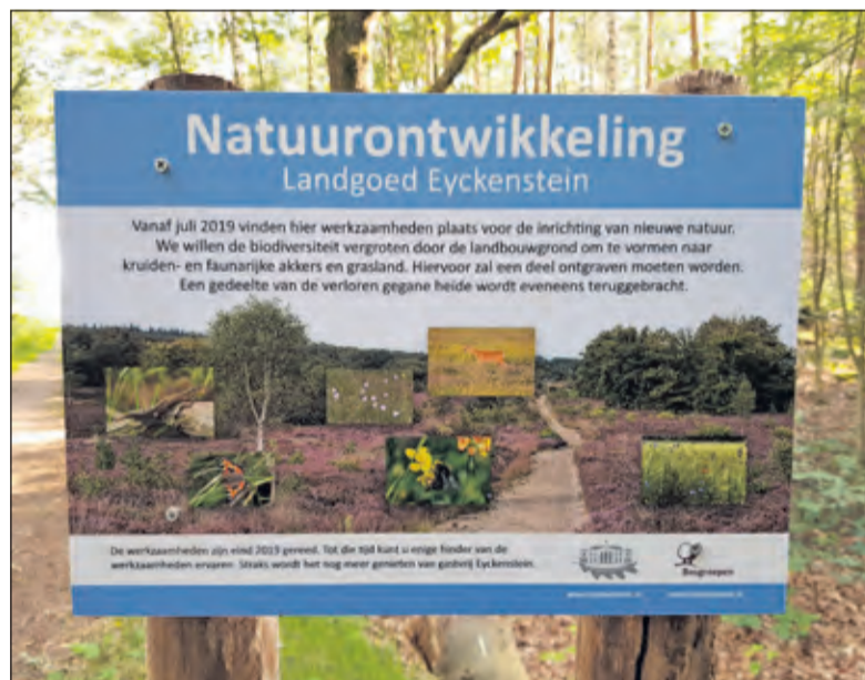
In de omgeving van het gebied verklaren bordjes de werkzaamheden.

worden bebouwd. Naar het westen toe wordt met groepjes bomen en struiken een mooi overganggebied naar het naastgelegen Utrechts Landschap gecreëerd. Tussen de bomen en struiken kunnen kruiden en ruigtes ontstaan. Het overige binnen het landgebied wordt ontwikkeld als kruiden- en faunarijke grasland. Langs de oostzijde in het gebied komt een wandelpad, die het gebied recreatief aantrekkelijk maakt.