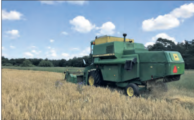
De nieuwe (1985) combine aan het werk in de wintergerst op het Boetzelaersveld in Hollandsche Rading.