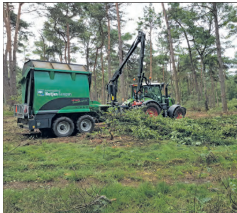
Het versnipperde hout wordt afgevoerd omdat er schrale grond over moet blijven waar de heide goed kan groeien.

Tijdens de vele jaren van intensief landbouwgebruik is er een dikke voedselrijke bodemlaag ontstaan. Dat klinkt misschien goed, maar gevarieerde natuur gedijt juist beter op een voedselarme bodem. Van het landbouwgebied zal daarom zo'n 12.000 m 3 voedselrijke grond afgevoerd moeten worden. Op verschillende plaatsen kan er gewerkt worden met uitmijnen van de gronden, maar in het middengedeelte zitten er te veel meststoffen in de grond, zodat daar wel 20-25 cm uit moet. De grond en het plagsel zullen via Hollandsche Rading worden afge-