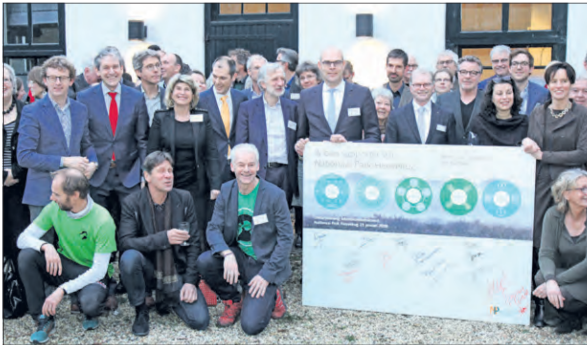
Eerder dit jaar werd een samenwerkingsagenda opgesteld en een Intentieovereenkomst ondertekend.

Park Utrechtse Heuvelrug. De Bilt is overeengekomen om voor 2019 en 2020 8.000 euro per jaar bij te dragen in de stichtingsbegroting van in totaal 400.000 euro per jaar. In de loop van 2020 zal het College de samenwerking evalueren en beslissen over een verdere deelname. [HvdB]