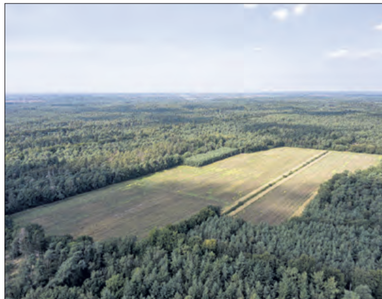
Sinds begin augustus wordt er op Landgoed Eyckenstein hard gewerkt aan het omvormen van het Boetzelaersveld naar natuur. Deze luchtfoto toont het huidige landbouwgebied.