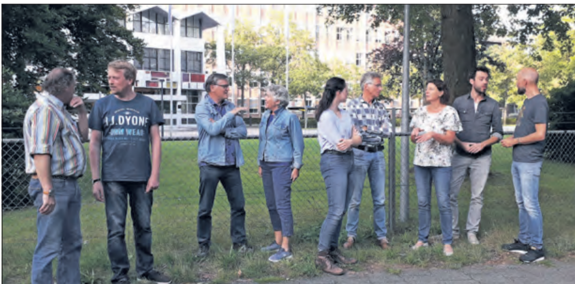
Een aantal van de spelers voor de locatie waar 'Mariecken uit Nijmegen' gespeeld gaat worden raakt er niet over uitgesproken.

De voorstellingen van 'Mariecken uit Nijmegen' vinden plaats van 16 tot en met 22 september op het USPB-terrein, Anthonie van Leeuwenhoeklaan 9 in Bilthoven. De aanvang is om 20.30 uur. Kaarten kunnen worden besteld via www.theaterinhetgroen.nl . Wie daarnaast ook nog wil komen kijken naar 'Meester Moenens Masterclass' kan dit doen door een mail te sturen naar info@theaterinhetgroen.nl . Deze introductie begint elke avond om 19.30 uur. Een laatste opmerking van de makers: 'De tribune is dit jaar niet overdekt, dus neem in geval van twijfel zeker een regenjas mee!' [HvdB]