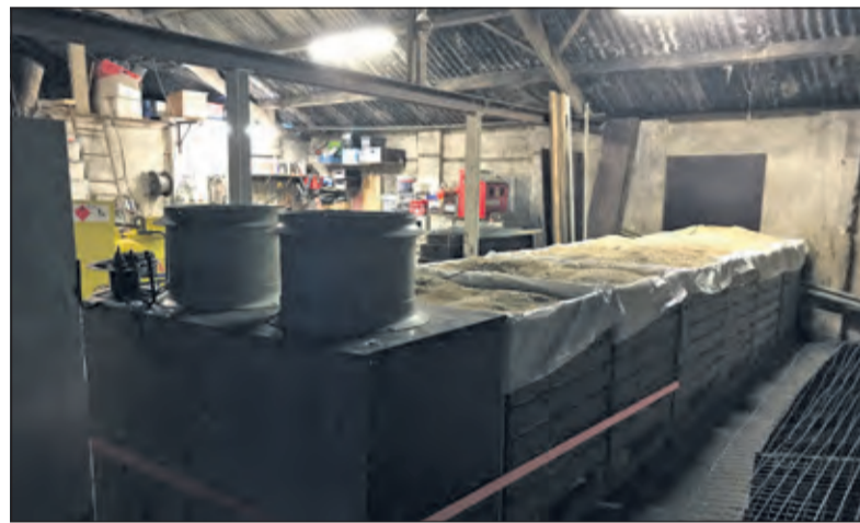
Beluchten en drogen van haver en tarwe.

weilanden maken we daarom graag ruimte voor kruiden, die bijdragen aan de gezondheid en weerstand van de stier. De grondsoort maakt het mogelijk om het grootste deel van het jaar de dieren buiten te houden en op sommige percelen zelfs jaar rond. In de akkerbouwpercelen telen we verschillende granen, zoals haver, tarwe, spelt en emmer in mengculturen. Hierbij werken we het liefst ploeg-loos en met innovatieve technieken, zoals het toevoegen van effectieve micro-organismen die het bodemleven verbeteren'.