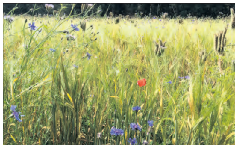
Mengcultuur van klaver, klaproos, korenbloem en phacelia als onderzaai in zomergerst op de Klievekamp (land tussen Eyckenstein en Rustenhoven). Goed voor boer, bodem en bij.

bied loopt van De Bilt, Maartensdijk tot aan Lage Vuursche'.