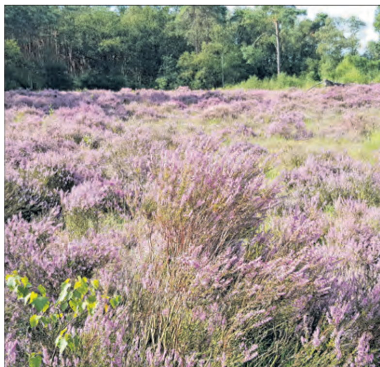
Het huidige heidegebied wordt uitgebreid.