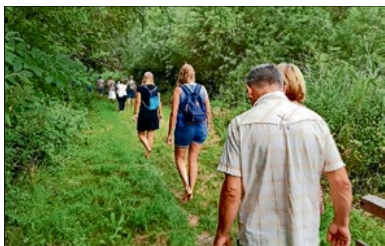
■ Barefootwandelen op zondag 6 september in Blaricum.

► Ook weer begonnen met activiteiten? Meld deze dan via Gooiagenda.nl .