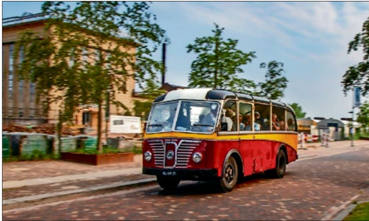
■ Workshop Panning bij De Gooische Fotoschool Huizen op zaterdag 5 september.

Kom twee keer per week trainen in een kleine groep onder begeleiding van een gediplomeerde trainer. Er zal veel aandacht zijn