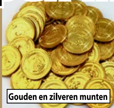
Gouden en zilveren munten