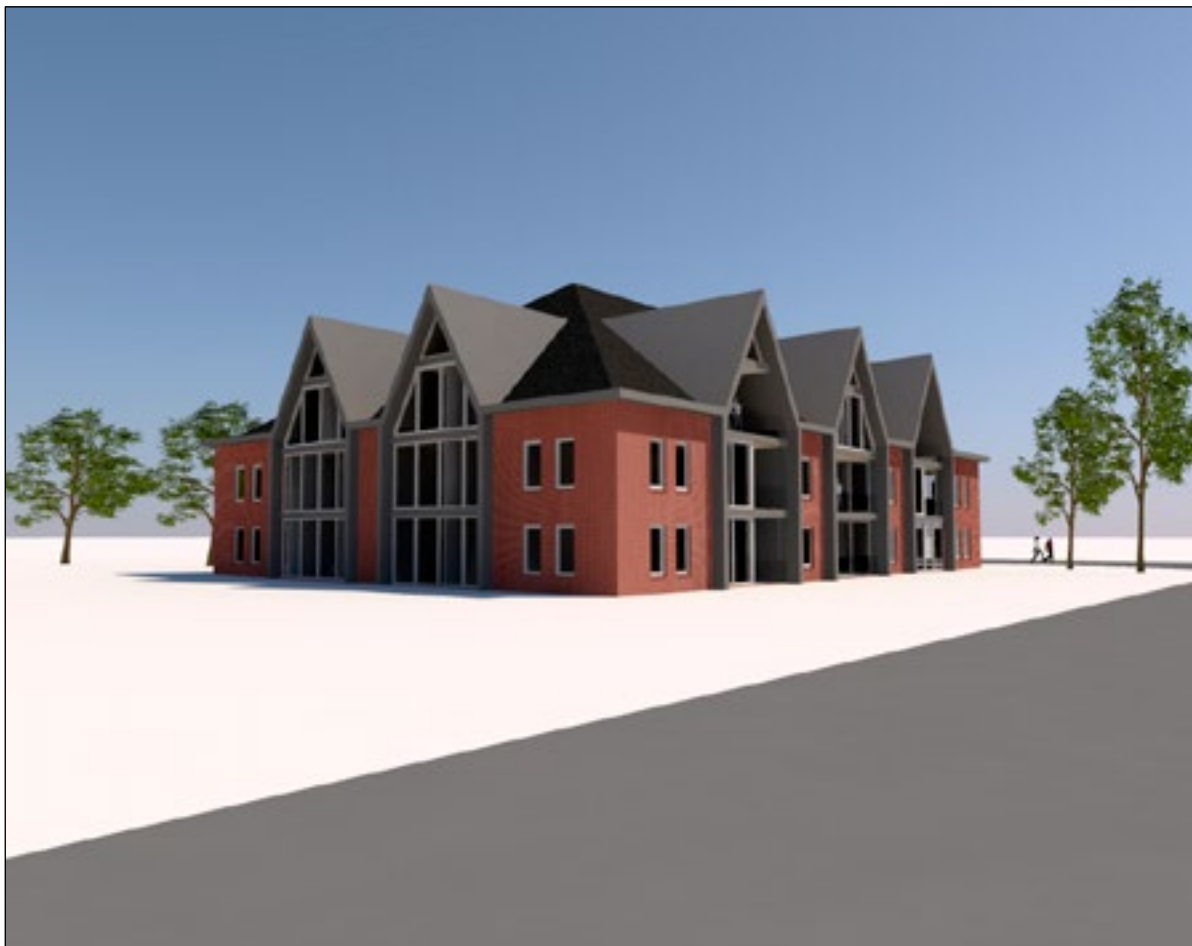
■ Het tweede ontwerp voor de Driftweg dat is ingediend.