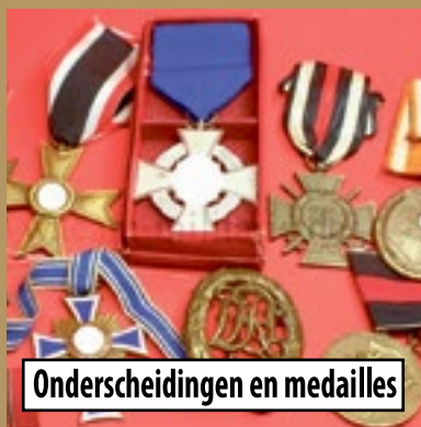
Onderscheidingen en medailles