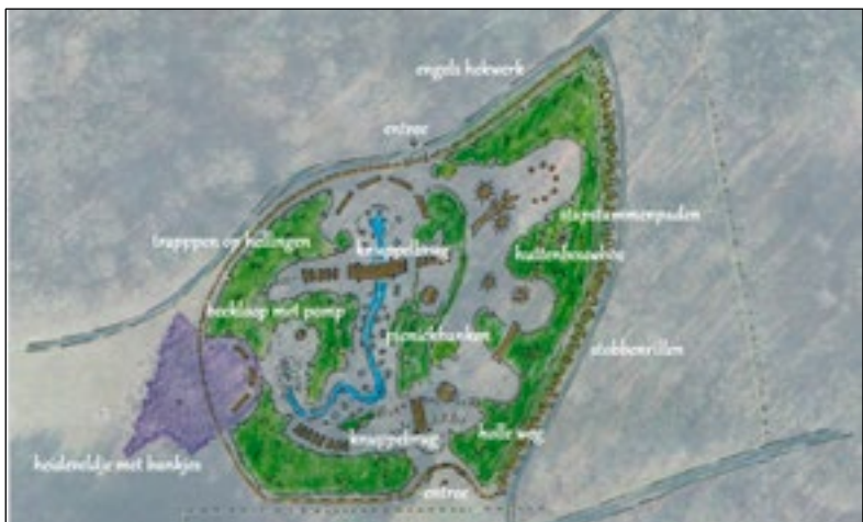
Een impressie van hoe het speelbos er uit kan gaan zien.

“Tijdens de bijeenkomst heeft het GNR een filmpje van Speelbos 't Laer in Laren laten zien. Dit gaf een indruk van hoe een speelbos eruit kan zien. Daarna was er ruimte voor vraag en antwoord over het beoogde plan van het speelbos bij de Sijsjesberg. Nu de bijeenkomst heeft plaatsgevonden, gaat het GNR de voorbereiding voor de aanvraag omgevingsvergunning afronden. In de bijeenkomst is een korte toelichting gegeven op de procedure die daarop volgt.”