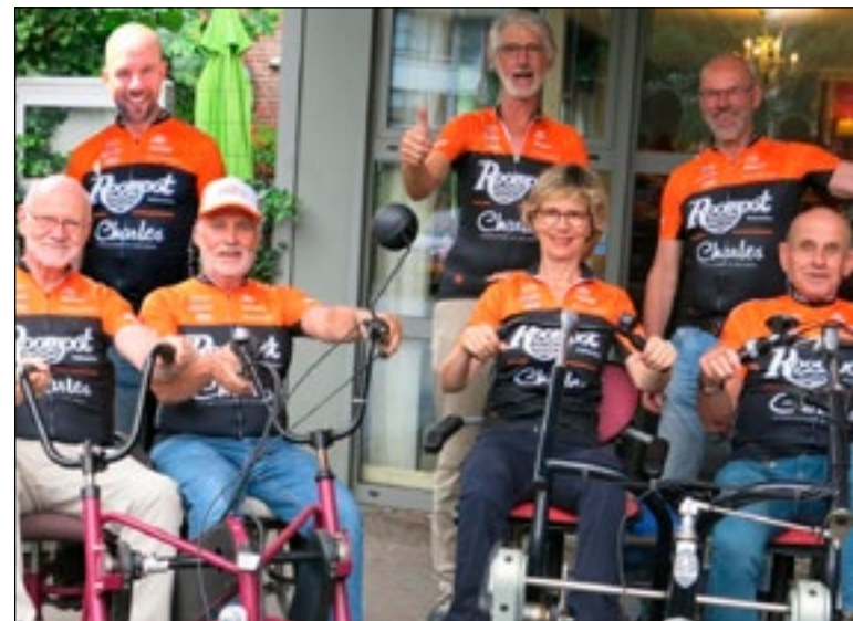
Het fietsteam van De Bolder met hun duofietsen.

Zo'n nieuwe duofiets kost 6000 euro en dat is het streefbedrag voor deze fietsactie. Doneren kan via voordeouderen.nl . Bij 'bekijk inzamelacties' kijken bij 'Fietsen voor een duofiets'. Er is al ruim 4.800 euro opgehaald. Aanmoedigen kan 19 september tussen 4.00 en 20.00 uur op de Akkerweg 57.