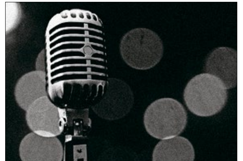
■ Dichters en schrijvers kunnen voordragen uit eigen werk.

Er is een vrije inloop en het Open Podium vindt plaats in de Huiskamer op de tweede etage van de bibliotheek aan Plein 2000 nummer 1.