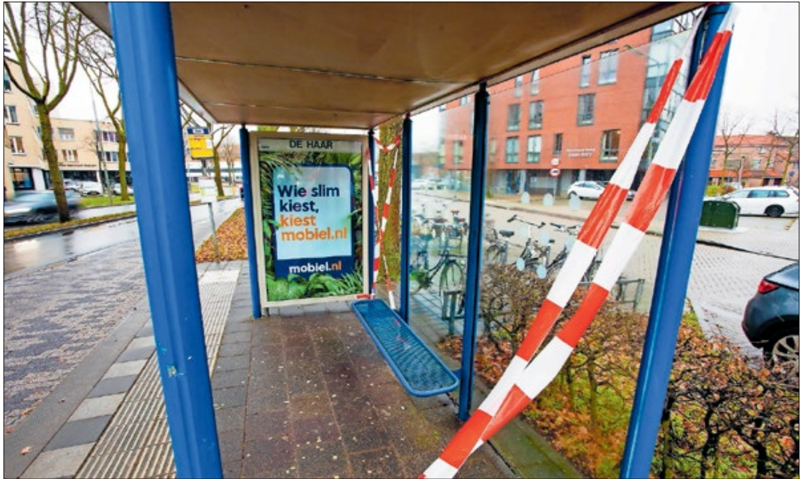
■ In de nacht van oud en nieuw werden elf bushokjes vernield. De burgemeester wil dat de daders zich melden.

“Dan moet er ook een alternatief zijn, zoals een vuurwerkshow. In het coalitieakkoord staat dat dit onderzocht gaat worden. Daar wachten we op”, aldus Ruben. Hij gaat nu alle gegevens van het meldpunt verzamelen en een rapport samenstellen, waarbij hij namens het CDA ook weer een aantal aanbevelingen zal doen. “Eerder werden al vuurwerkzone inggericht dankzij aanbevelingen naar aanleiding van meldingen bij het vuurwerkmeldpunt. Ook is er inmiddels meer handhaving en meer voorlichting op scholen over vuurwerk.”