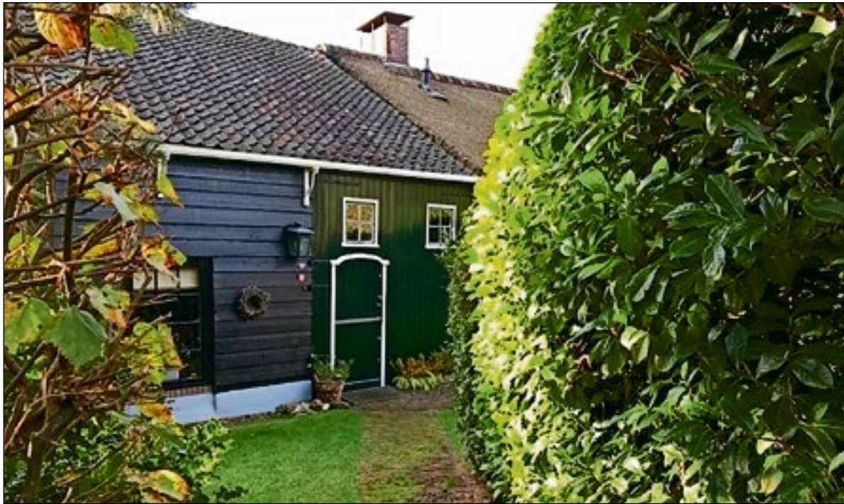
Zaterdag 11 januari Winterwandeling door Huizen onder leiding van een gids.