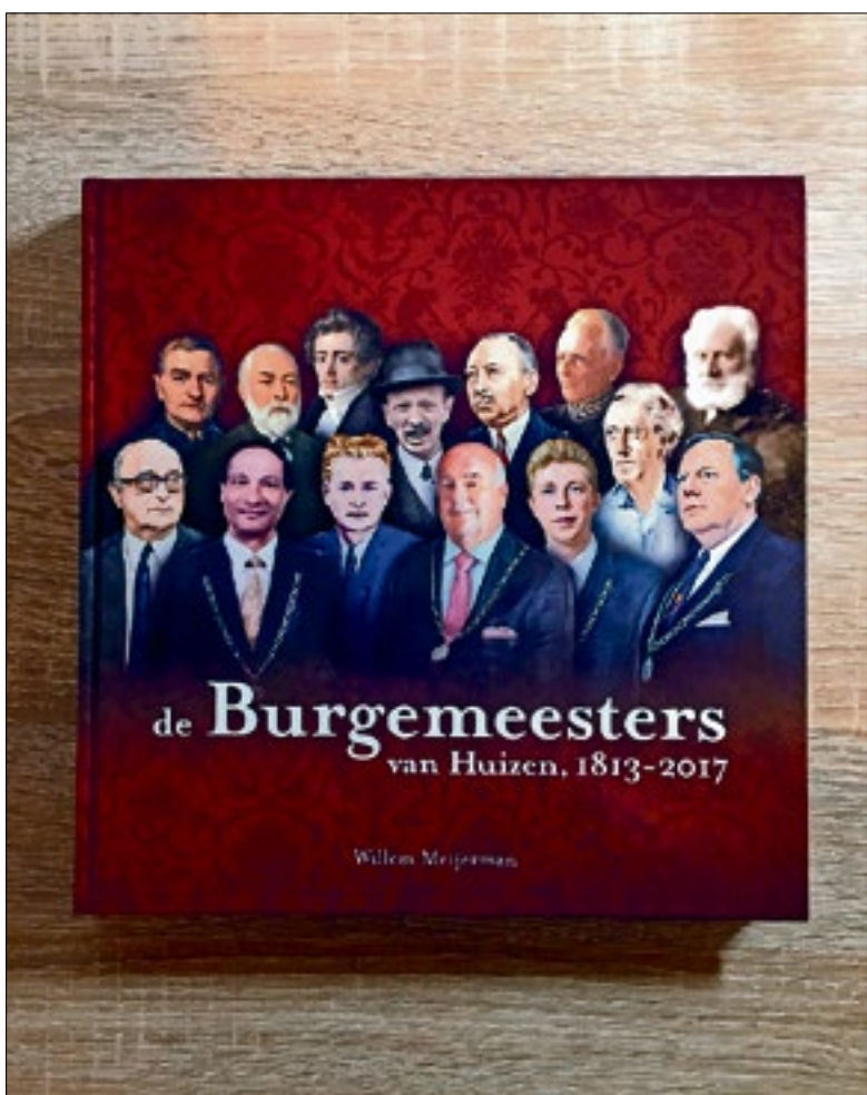
Het naslagwerk over de Huizer burgemeesters.

Het rijk geïllustreerde historische naslagwerk 'de Burgemeesters van Huizen van 1813-2017', geschreven door Willem Meijerman, is te koop voor slechts € 19,50 en voor HKH-leden € 15,- (hardcover, 191 pagina's).