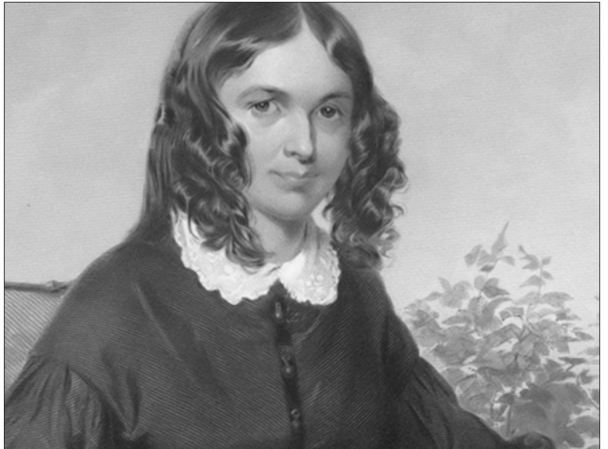
■ Het te vertalen sonnet komt van de vrouwelijke dichter Elizabeth Barrett Browning (1806-1861).