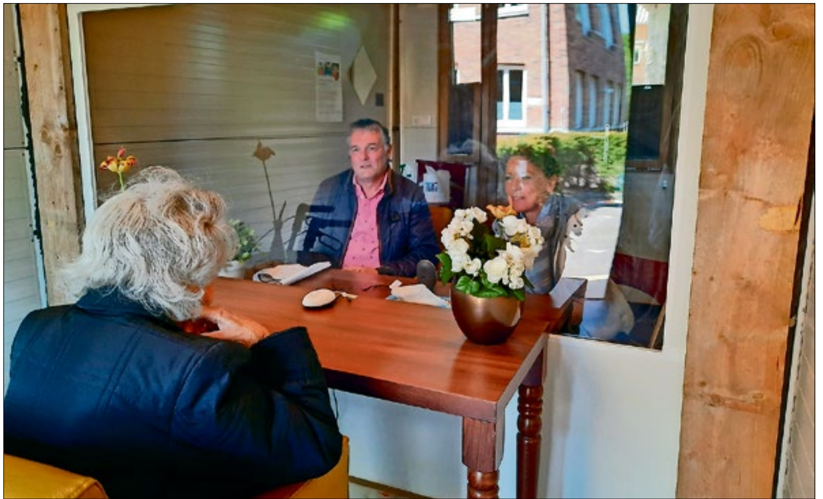
■ Een ontmoeting bij één van de Vivium-locaties.