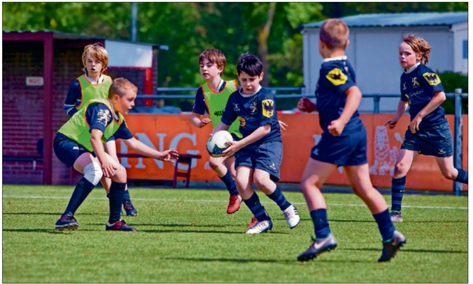
■ De jeugd mocht zondag weer het veld op.

Dat was een fikse tegenvaller, erkent de voorzitter. “We hebben daarop contact gezocht met NVC en de Hockeyclub Naarden. Onze goede burens hebben de helpende hand geboden. We mogen twee velden van de voetbalclub gebruiken en één hockeyveld. Daar hun jeugd ook op vaste dagen en tijden traint, is het logisch dat wij ons daarop moeten aanpassen. Dat betekent dat wij voor onze jeugd de trainingsdagen en -tijden moeten wijzigen. Dat was even puzzelen en organiseren. Maar geen probleem: we zijn allang blij dat er in goed overleg met onze burens een