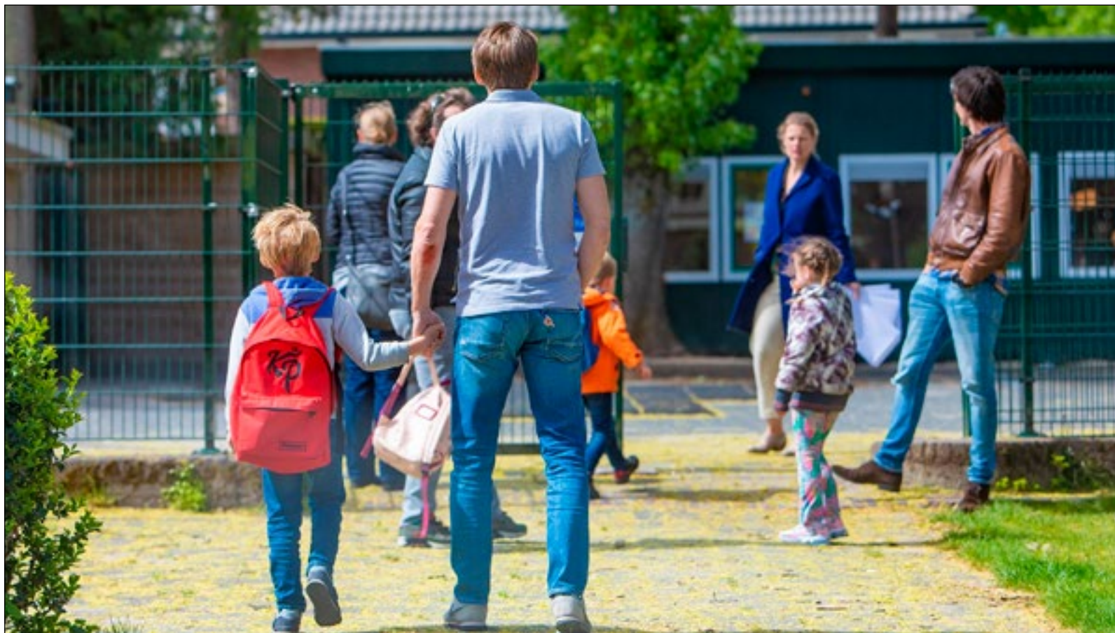
Kinderen worden gebracht bij de Juliana Daltonschool in Bussum.