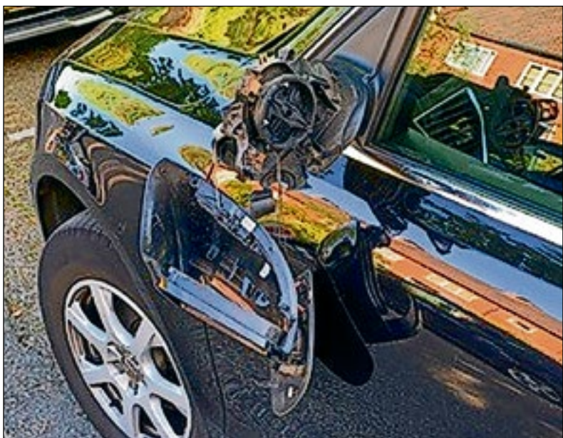
■ Gewoon door opgeschoten jongens kapot getrap.

het risico niet nemen, dat is dan misschien moeilijk te accepteren. We moeten goed opletten wat dit met de bewoners doet en daarop blijven inspelen. Dat doen we nu natuurlijk ook, maar hoe goed we ook voor de bewoners zorgen: wij kunnen nu eenmaal niet de plek van de familie innemen. Sommige bewoners voelen zich best eenzaam, terwijl een ander juist blij is om samen met leeftijdsgenoten in een zorgcentrum te wonen waar alles goed geregeld is. Eenzaam hoeft je hier eigenlijk niet te zijn, maar dat neemt niet weg dat sommige bewoners zich nu toch eenzaam voelen.”