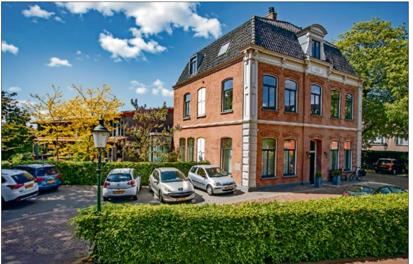
■ De Oude Pastorie in Huizen.