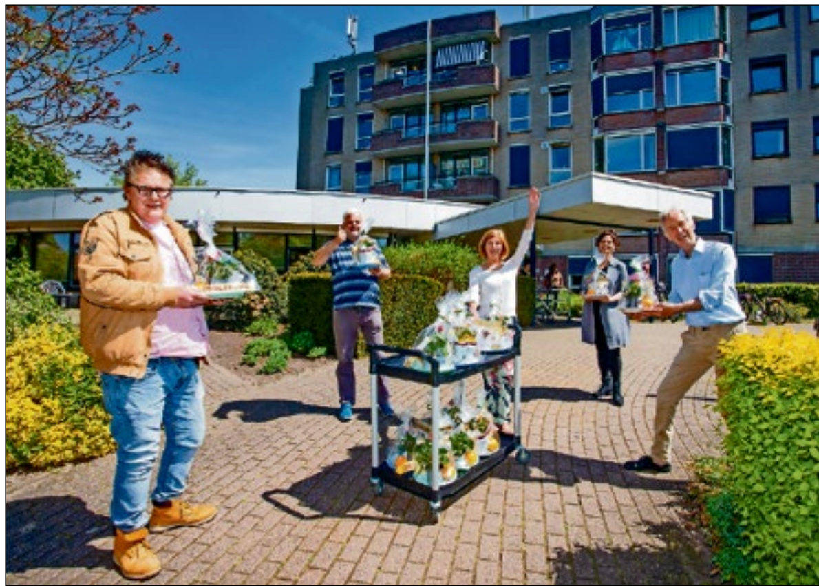
■ Op de locatie Lorentzweg in Bussum werden de pakketten afgeleverd.

"De bewoners mogen in verband met de hygiëne ook niet meer zelf en/of samen koken, en dat gaat ten koste van de onderlinge saamhorigheid. We doen er alles aan opdat het virus niet verspreid kan worden." Godzijdank is er slechts één bewoner besmet geraakt. "Deze persoon is naar onze