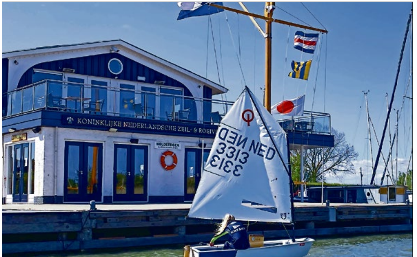
■ Jeugd lid KNZ&RV in de Optimist voert het vlagsignaal.