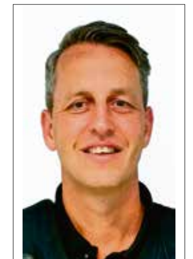
Muiderberg en Naarden (Componistenbuurt, Bos van Bredius, Valkeveen, Naardereiland, Naarderwoonbos, Fortlanden, Naardermeerkwartier) Martin Treur