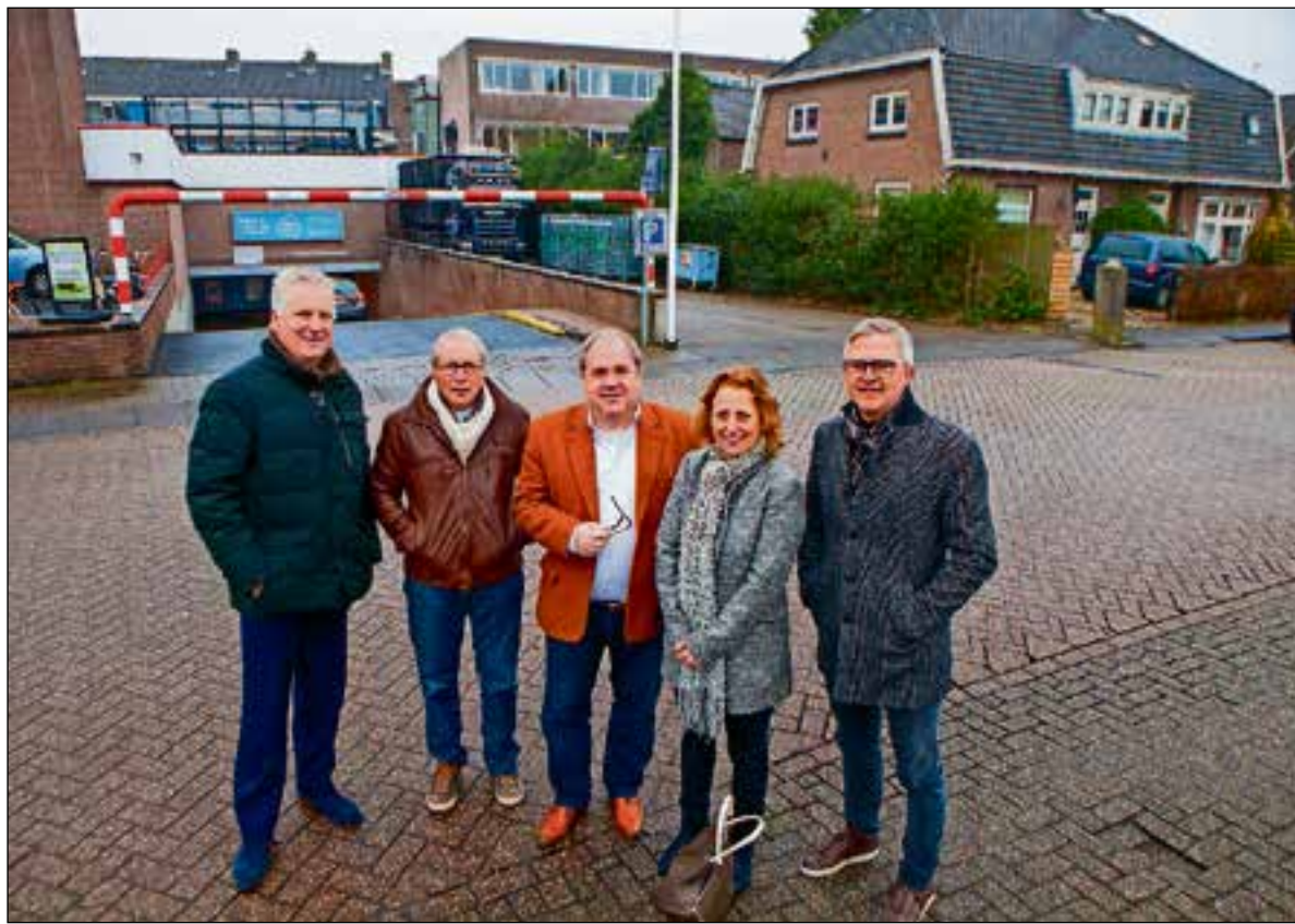
■ Een aantal leden van de participatiegroep van het project-Keucheniussterrein.

Participatie draagt volgens het onderzoek wel bij aan resultaten voor de samenleving. 'We zien dit onder meer bij Homerun in de wijk Stand en Lande, De Wijngaard, Driftweg-Botterstraat. Dit geldt ook voor de casussen Keuchenius-