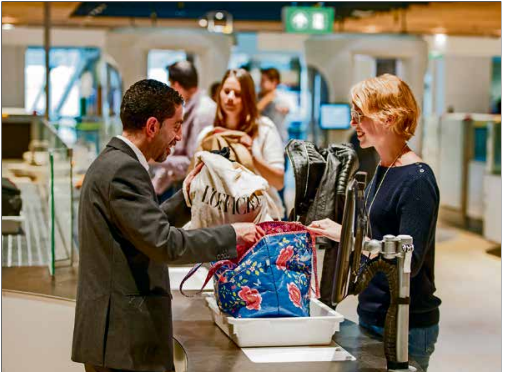
■ Miguel (niet de jongen op deze foto) werkt nu als luchthavenbeveiliging op Schiphol.