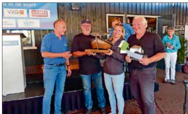
■ De 1e prijs en wisseltrofee ging naar croonwolter&dros|TBI 5.

De Taeje Bôkkesrace is een businessvent met in totaal twintig deelnemende botters. Het winnende bedrijf deed met maar liefst 8 teams mee. Het winnende