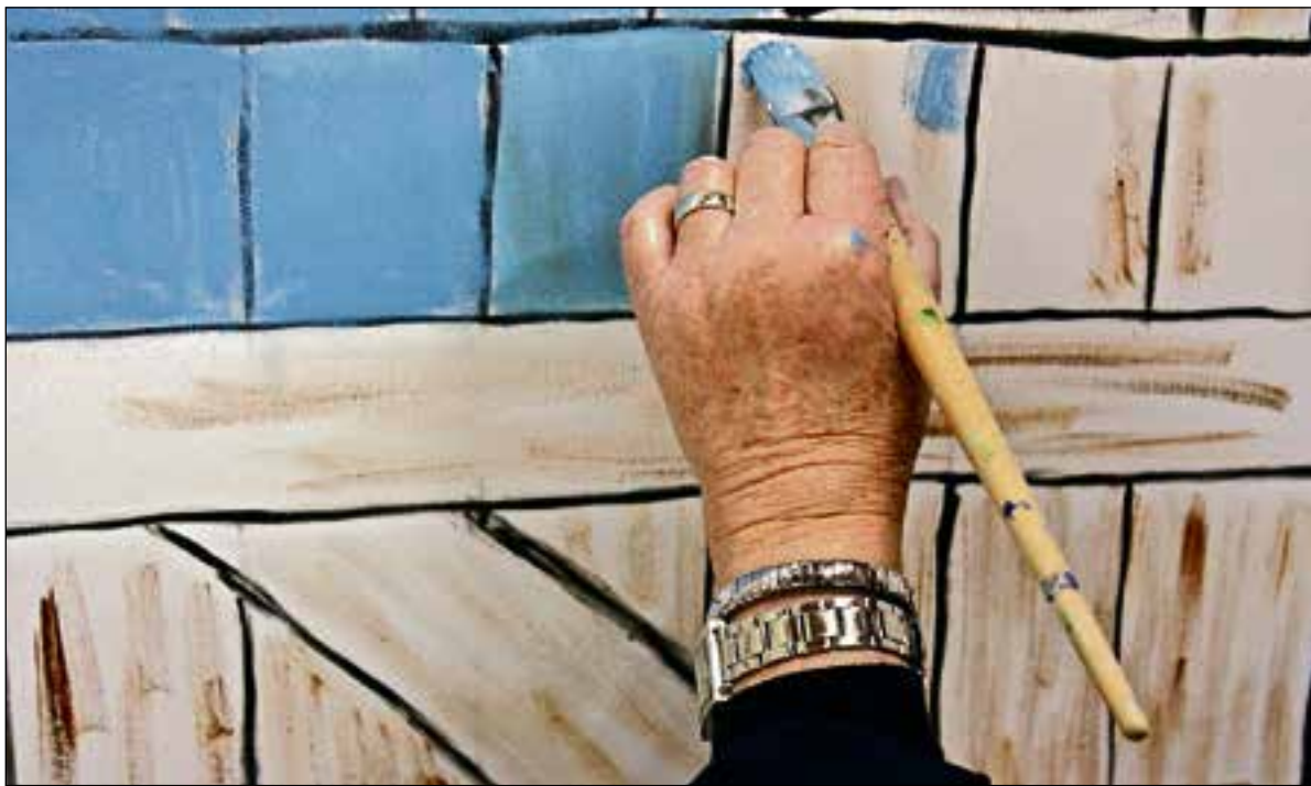
Dinsdag is er weer een inloopatelier bij Simone Stawicki.