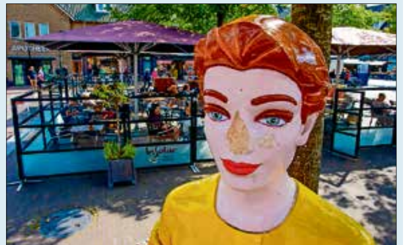
't Huizere Melkmaisen.

De Mathäus-Passion wurdt are jaar april oëk weer èhouwen in de Ouwe Kerk, en daer kaj-je audisie vur dooën, da's steeds vur effen laeten horen hoo of je zingen kunnen. 'k Wou d'r oëk óp an, mar m'n mins het 't m'n verbeujen, 'k mag alléënieg 's zaeterdas in de tail zingen van d'r, zoë snóbbig nij.