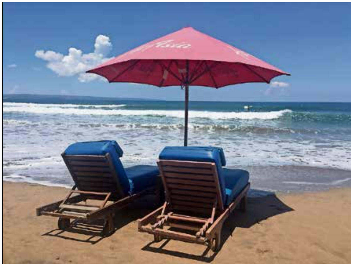
■ Vrijheid kan je op allerlei manieren in beeld brengen.

Fotoclub Flevo Huizen heeft zich bereid getoond om samen met leden van de Amnestygroep een