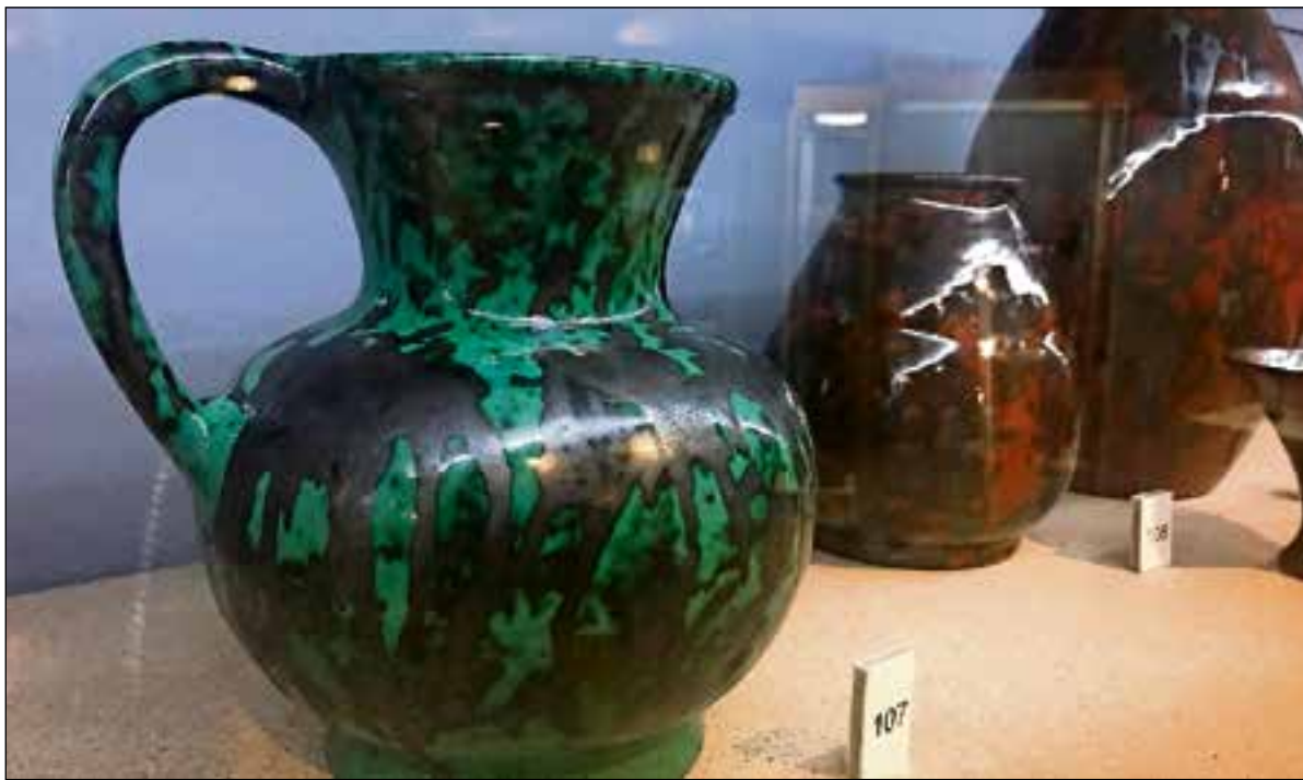
Lezing Wim Spitzten. Donderdag 15 augustus om 19.30 uur in het Huizer Museum