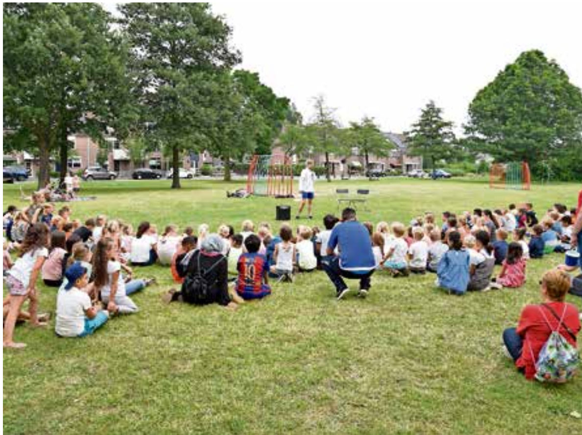
In de pauze werd er over het geloof gesproken.

In het artikel over de moord op Ronald Bakker vorige week is een paar keer een verkeerde voornaam genoemd. De redactie betreurt deze fout en wil deze hiermee rechtzetten.