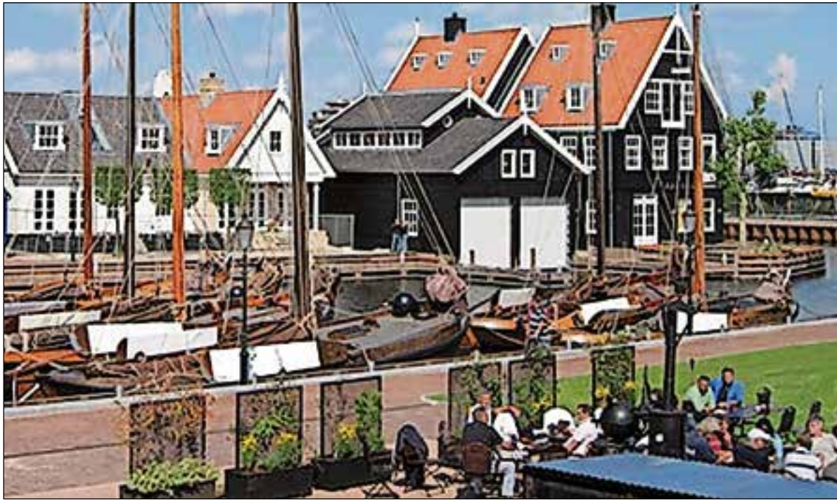
■ Fietstocht over de geschiedenis van Huizen. Donderdag 1 augustus om 11.00 uur. Start vanaf het Huizer Museum.