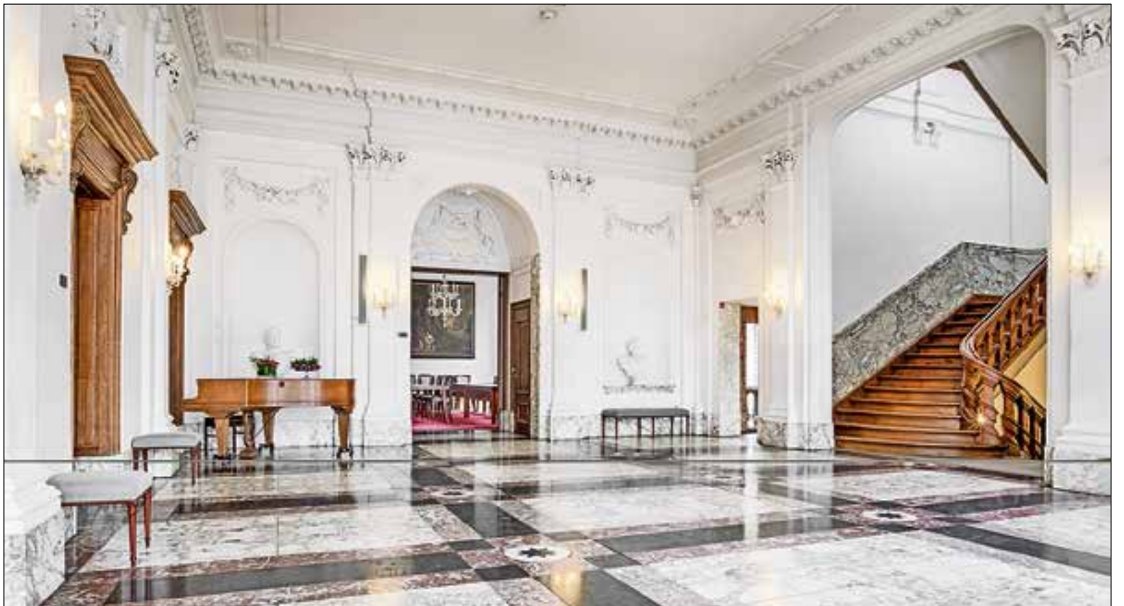
In de burgerzaal met de marmeren vloer ontvangt het stadsbestuur nog steeds de burgers.