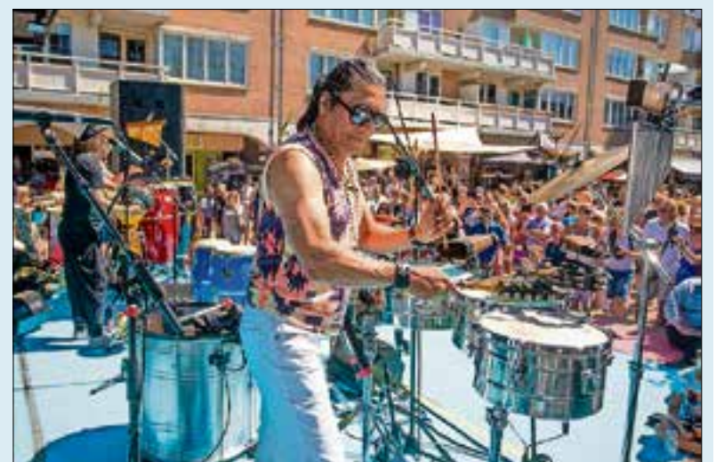
Ze hemmen vurral vuul trommels.

Teugenover de Lidl, bij dat lulléke gebouwd wat ove ze ‘n disco neumen, wullen ze nijwe woëningkies gaen bouwen. ‘t Is nou zoë’n vertesteweerd zeutjen,