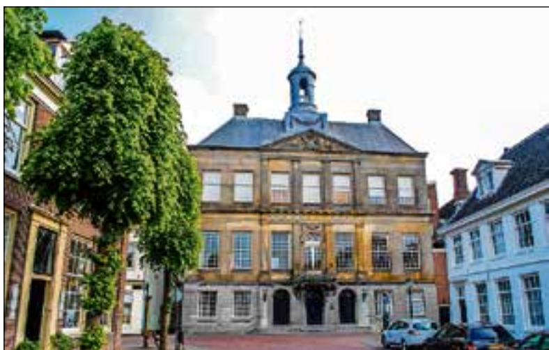
Het stadhuis in Weesp aan het Grote Plein.

De wisseltonstelling is te zien tot en met 3 november. De speciale rondleidingen starten elke zondag om 15.00 uur. Alle informatie is te vinden op museumweesp.nl .