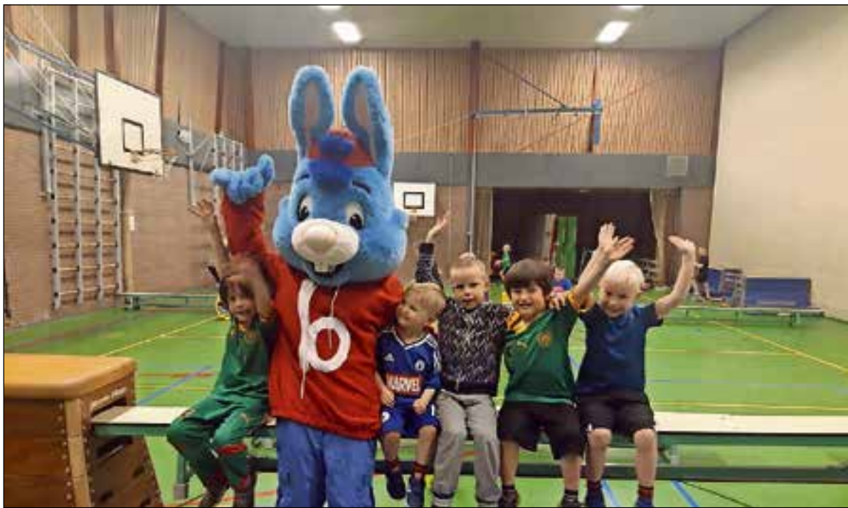
Bobo vakantiedagen. Maandag 15 juli, Sportcentrum de Meent in Huizen.

com | annekehuizinga@hotmail.com | 035-8873470.