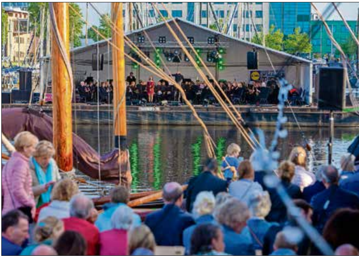
■ De gemeenteraad wil een onderzoek om te kijken of een havenconcert in 2020 weer mogelijk is.

SGP en Dorpsbelangen Huizen stemden tegen. SGP vond het voorstel wel sympathiek, maar is van mening dat het niet alleen de gemeente moet zijn die geld hiervoor beschikbaar stelt. Dorpsbelangen Huizen was van mening dat als er eenmaal om geld wordt gevraagd en dit wordt toegekend, er dan alleen maar om meer en meer wordt gevraagd. Daarom stemde de partij tegen. Het college moet nu in de begrotingsvergadering van de gemeen-