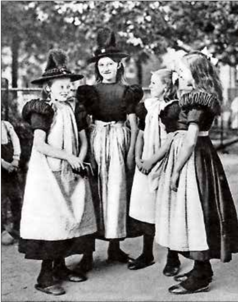
Huizen was in de jaren 20 en 30 een toeristische bestemming.