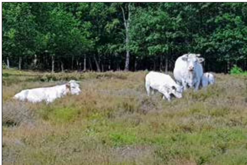
■ De Charolais koeien zijn echte natuurbeheerders.

tussen 15 juli en 15 november alle honden op het Ericaterrein en de Nieuw Bussumerheide aan de lijn.