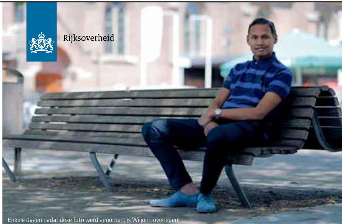
Enkele dagen nadat deze foto werd genomen, is Wiljohn overleden.