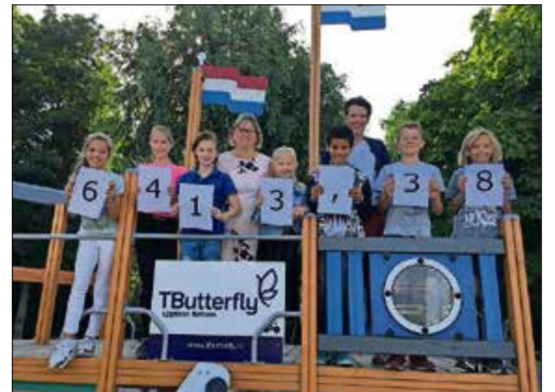
■ De bekendmaking van het bedrag.

De grote wens van de leerlingen is dat de stichting het met de gemeente rond gaat krijgen om een gedeelte van de opbrengst in te zetten om een verkeerslicht te plaatsen. Dit licht is door de stichting speciaal ontwikkeld om fietsers te waarschuwen hun telefoon niet te gebruiken in het verkeer. Als de fietser de stoplichtknop indrukt wordt tijdens het wachten het verhaal van Tommy-Boy op een schermje verteld en speelt er een van de 24 liedjes uit zijn Spotify playlist. De gele drukknop is de shuffleknop. Op deze manier wordt spelenderwijs geprobeerd bewustwording te creëren.