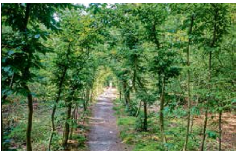
■ De berceau is een bijzondere plek in het bos.