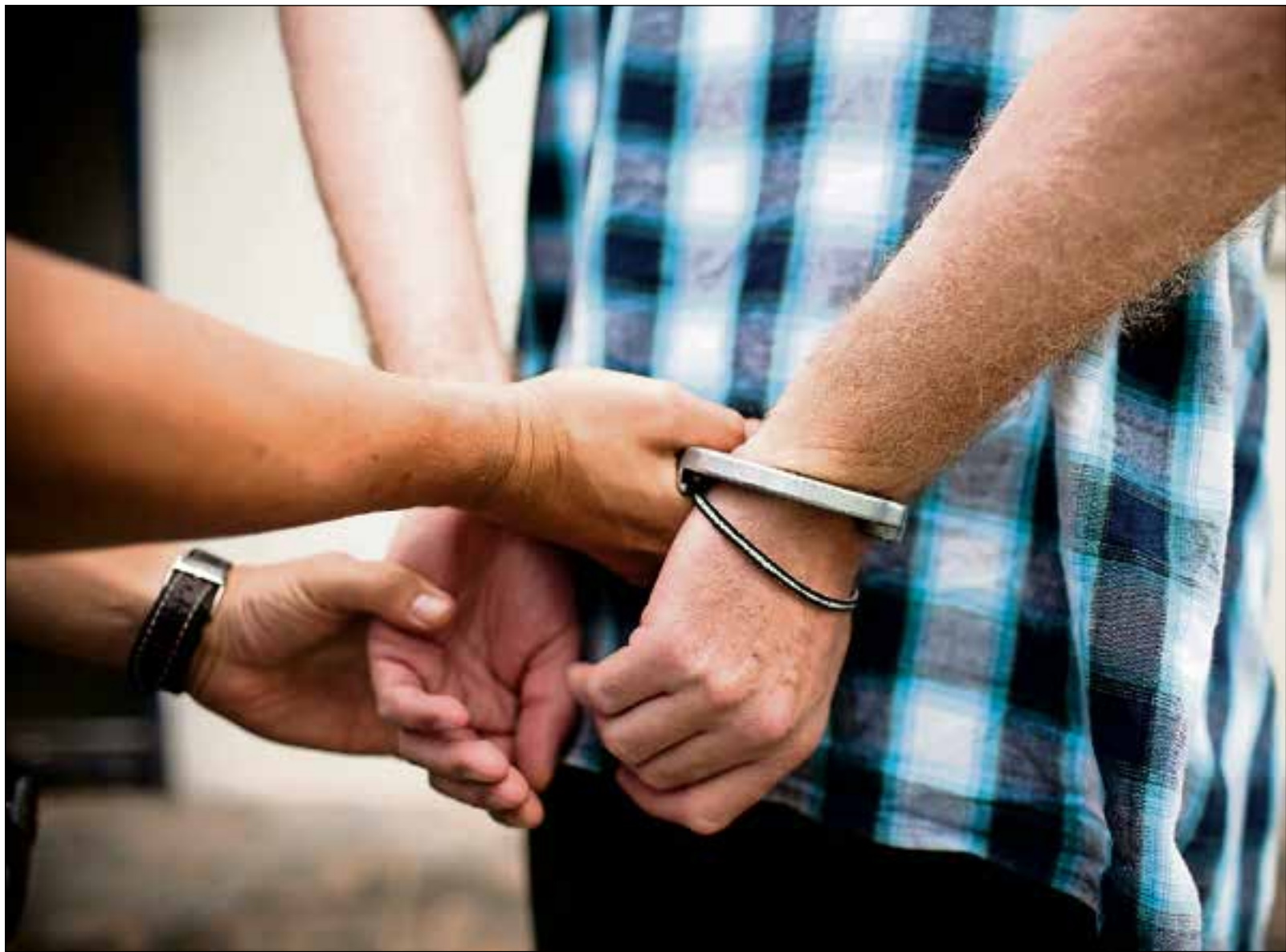
■ De politie kreeg in Huizen te maken met een grote stijging van meldingen over verwarde personen.