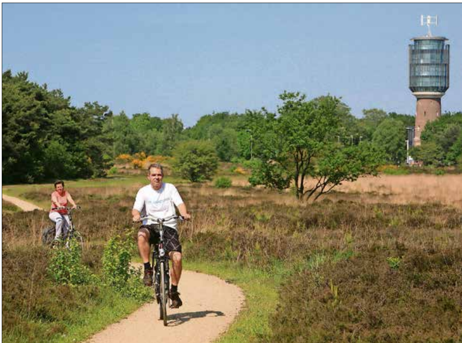
■ Elke avond wordt er een tocht van maximaal 25 kilometer gefietst door Huizen en omgeving.