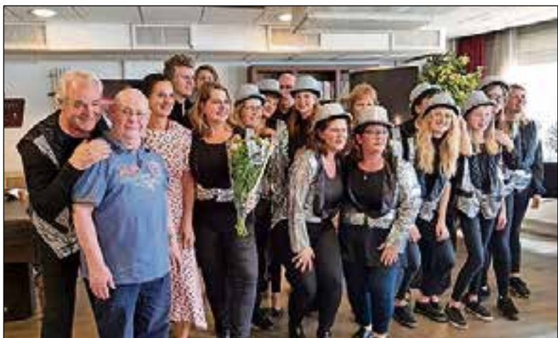
■ Staccato bij De Marke-De Meenthoek.

Wie een keer koffie wil komen drinken op zondag van 14.30 uur tot 15.30 uur tijdens de buurtestafette of vrijwilliger wil worden, kan mailen naar vandenbergem-