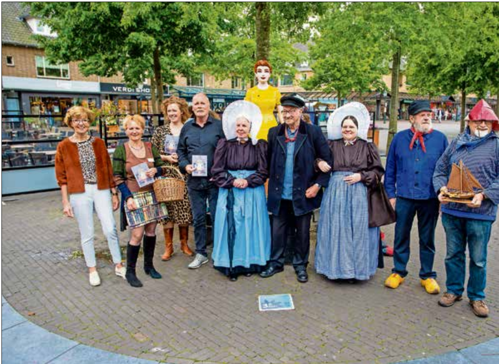
■ Bij het Huizer Melkmeisje werd door de deelnemende partijen het educatieve programma symbolisch gepresenteerd.

Er kan bijvoorbeeld gekozen worden voor een 'Boek-appetizer' bij de bibliotheek, met een voorgerecht van de Stichting Huizer Boters 'Too dee tijd' oftewel 'terug in de tijd' van het vissersleven. Het hoofdgerecht bij Historische Kring Huizen: 'Hoo praat je in 't Huizers', waar leerlingen aan de slag gaan met het Huizer dialect via het woordenboek of een rap in dialect. Het Huizer Museum sluit