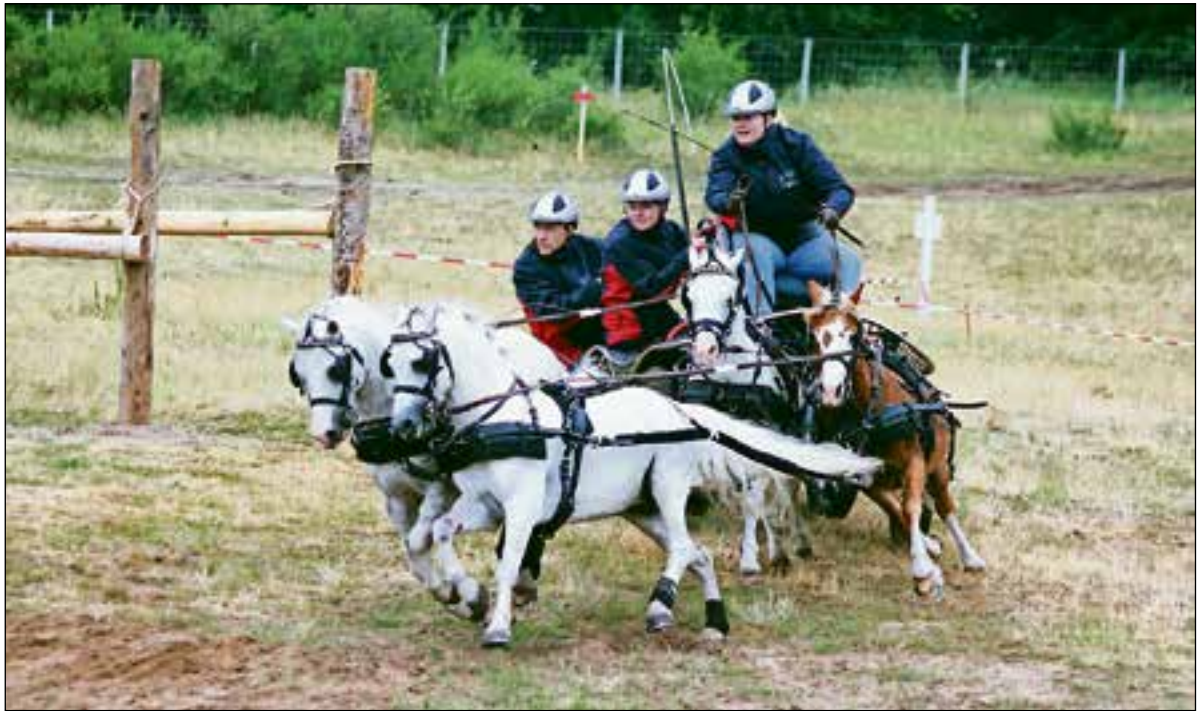
■ Spectaculaire menwedstrijd op 't Harde, Blaricum. 31 mei en 1 juni.

ciaal voor vrouwen, verbeter je onder begeleiding van een fitnessinstructeur je conditie. Meer informatie: 06-57370520. Kosten: € 1,- per les. Meenemen: matje en makkelijke kleding. Aanmelden niet nodig.