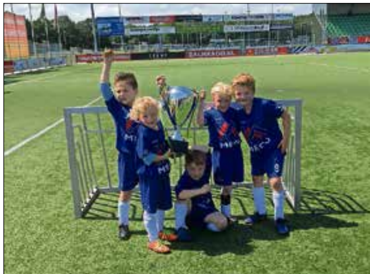
■ De spelertjes van Chelsea met de cup.

Het winnende team is op de foto gegaan met de wedstrijdscup. Helaas mag deze niet mee naar huis, maar de Chelsea-spelers hebben wel een wedstrijdbeker mee gekregen. Ook hebben de andere spelers als aandenken aan deze dag een beker gekregen.