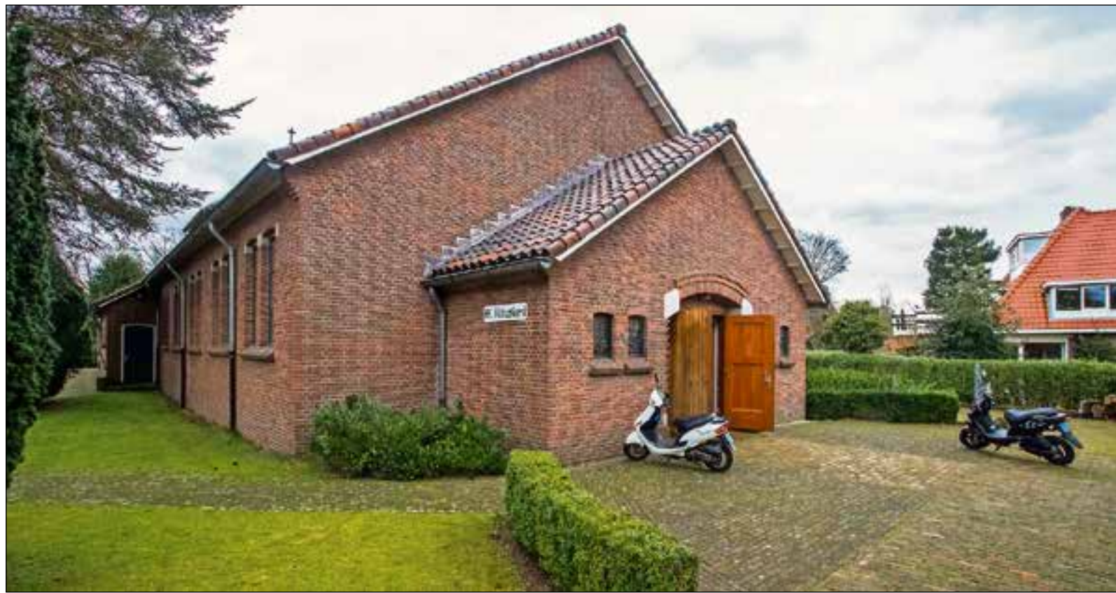
■ De Vituskerk sloot vorig jaar zijn deuren en wordt nu verhuurd.