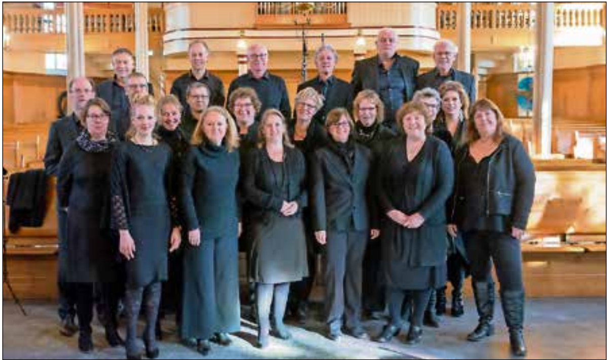
■ Avondmuziek in Engelse sfeer. Vrijdag 24 mei in de Nieuwe kerk in Huizen

ruime sortering dames-, heren- en kinderkleding.