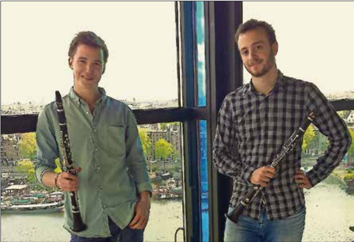
■ Het Orzán Trio.