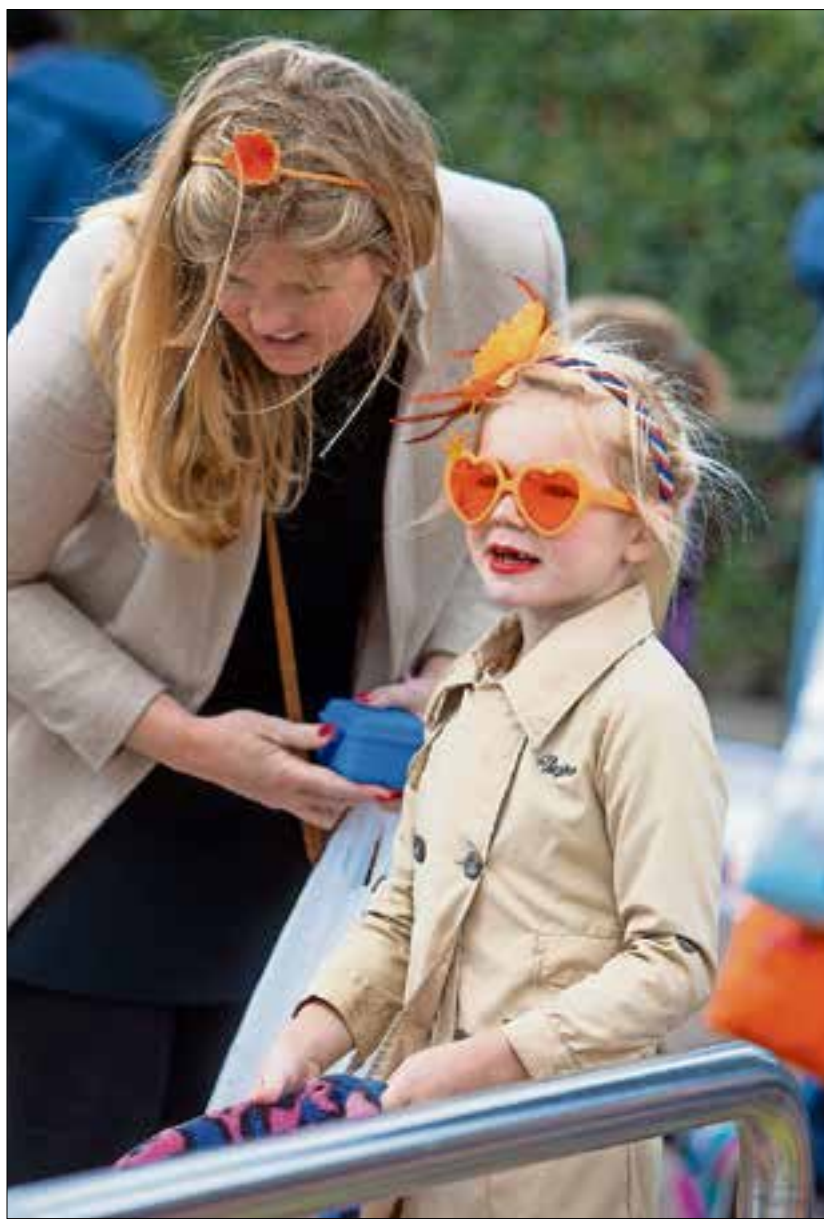
■ Deze jongedame zag Koningsdag toch nog zonnig in.