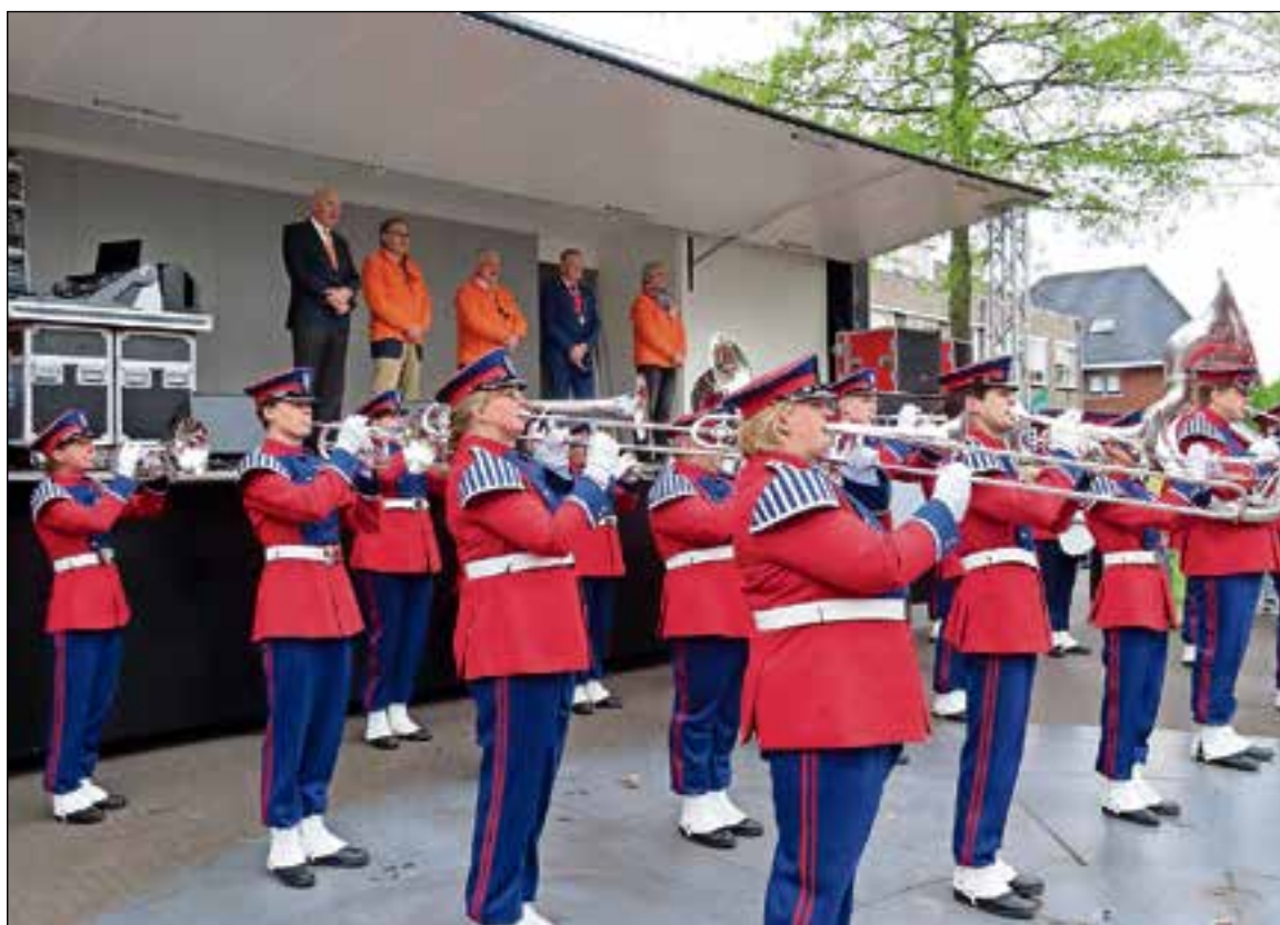
■ MCC speelt het Wilhelmus tijdens de officiële opening.