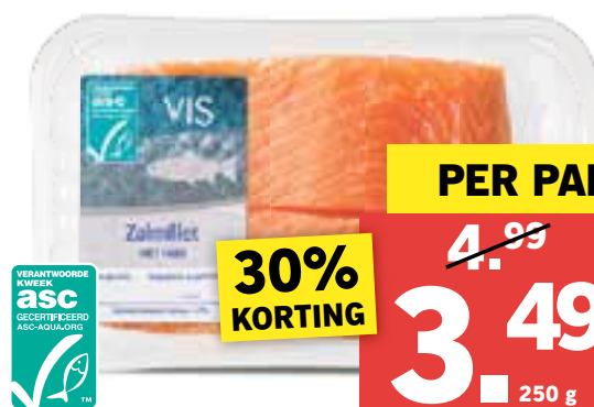
Zalmfilet met huid