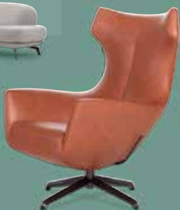
DESIGN ON STOCK NOSTO Relaxfauteuil in leer v.a. €1999,-

Hamseweg 18 Amersfoort/Hoogland 033 4801441 kokwooncenter.nl