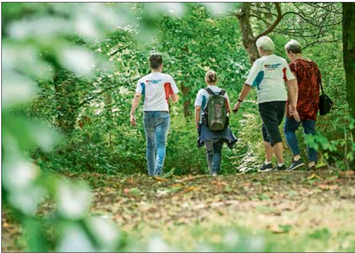
■ Iedereen kan zich aanmelden en meewandelen op zijn eigen niveau.

De beweegcoach hoopt dit jaar in ieder geval met een groep mee te doen aan de challenge. “In Hilver-