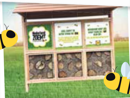
WIJ ZIJN BIJ-VRIENDELIJK