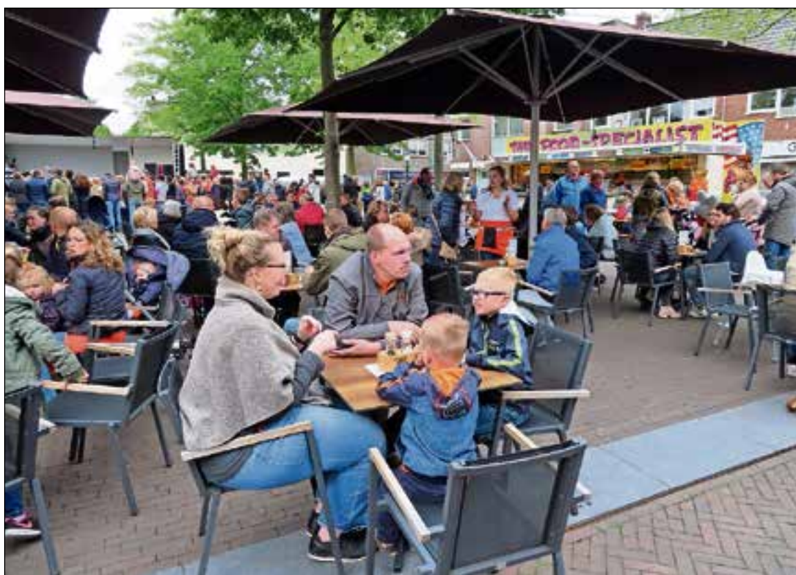
■ Het Oude Raadhuisplein zat kort na de opening vol.