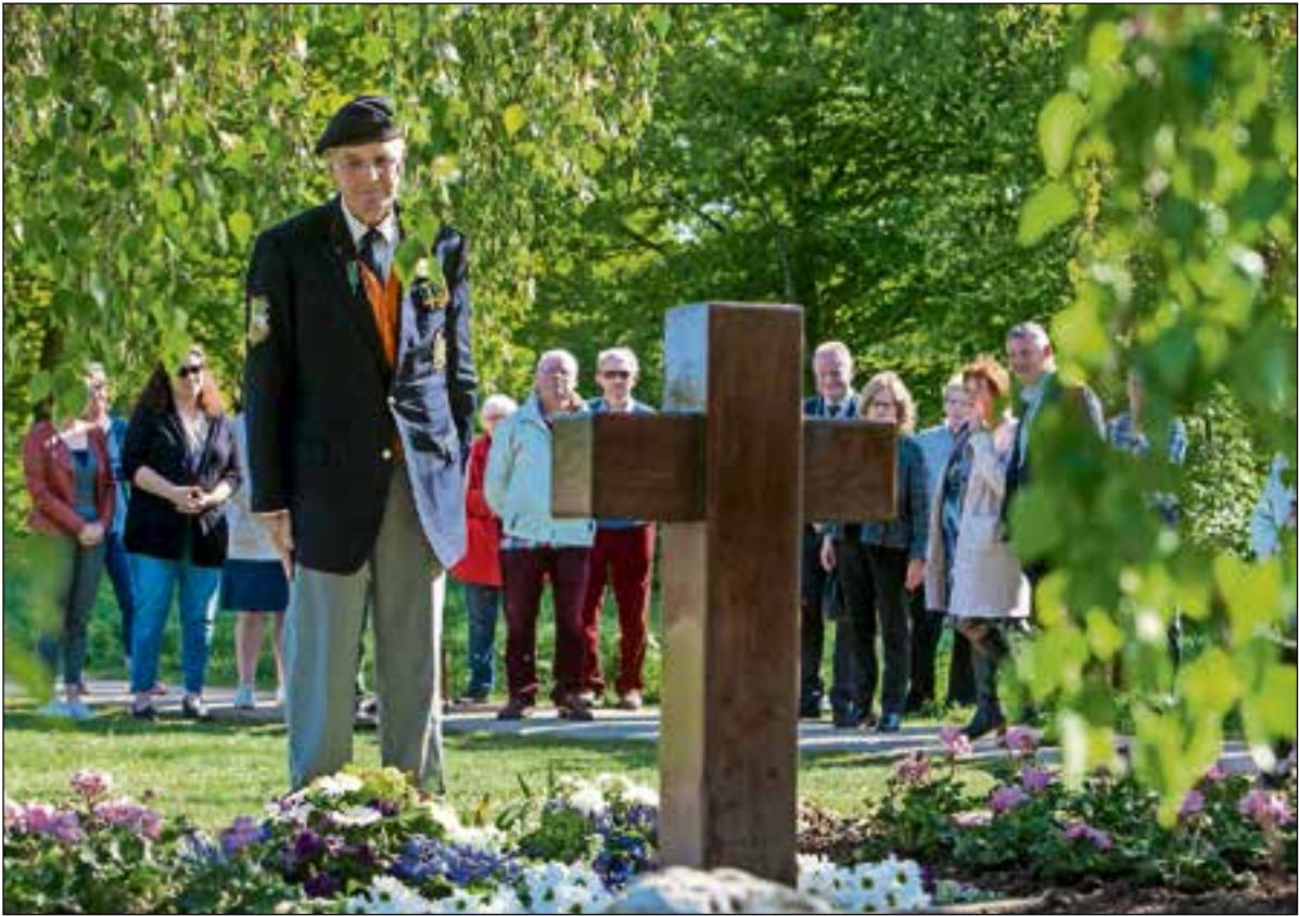
■ Dodenherdenking start dit jaar ook weer bij het monument in het Stadspark.