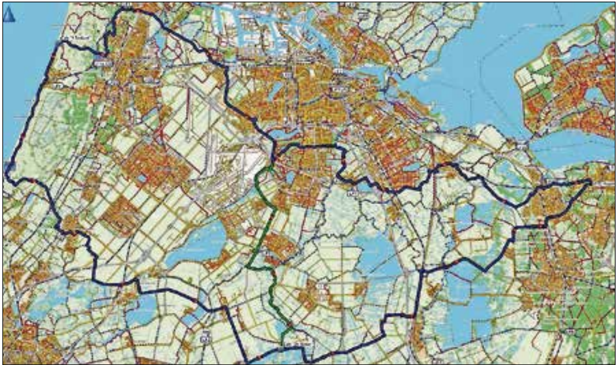
■ Bij Wielertourclub Huizen wordt zaterdag de Omloop Midden-Nederland gereden.

dino's, ruimte voor nieuw leven. Lezing door Cees Biermann.