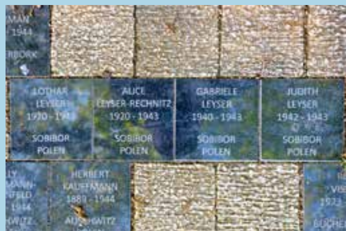
De de familie Leyser wordt herdacht met een viertal stenen bij het oorlogsmonument op het Prins Bernhardplein.

aan noodlot dat zij al een eeuwigheid vreest. Ze staart in haar kind ook zichzelf aan en vraagt: zijn wij er straks eigenlijk ooit echt geweest?