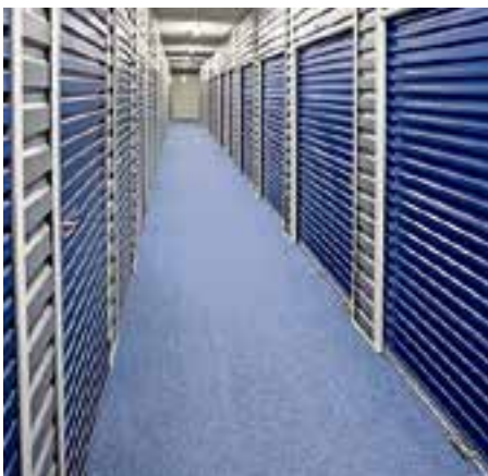
Er zijn verschillende opslagruimten.

Wie gebruik wil maken van de opslag kan contact opnemen via de website of even bellen. "We maken graag een vrijblijvend afspraak, zodat we het een en ander kunnen laten zien en de mogelijkheden doorspreken. Je huurt al vanaf 9,60 euro 1 kubieke meter per maand all-in. Wil je de opgeslagen stukken verzekeren, dan moet je dat bij je eigen verzekering doorgeven."