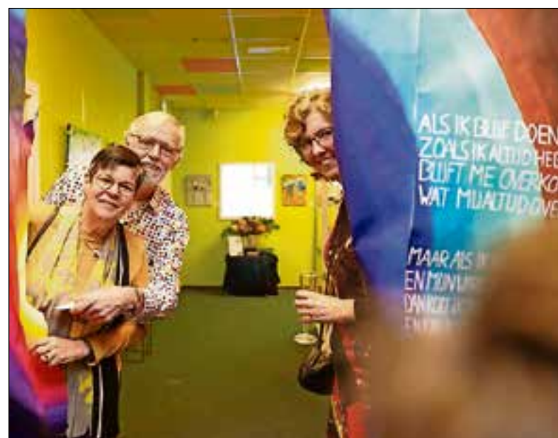
Kleurrijke kunst in Huis van de Buurt.

Zaterdag 13 april wordt er voor het eerst een rommelmarkt georganiseerd in Het Huis van de Buurt. Voor 10 euro is het mogelijk een kraam te huren. De markt start om 10.00 uur en eindigt om 16.30 uur. Het is altijd mogelijk om vrijblijvend binnen te lopen en een kop koffie te drinken in Het Huis van de Buurt aan de Draaikom 2. Meer informatie staat op www.tijdvoormeedoen.nl .