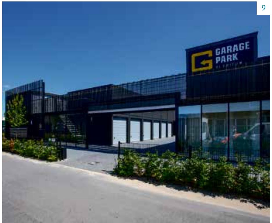
GaragePark aan de Binnendelta in Blaricum.

hoveniers die hun gereedschappen veilig willen opslaan, webshop-eigenaren die hun voorraad in de boxen willen