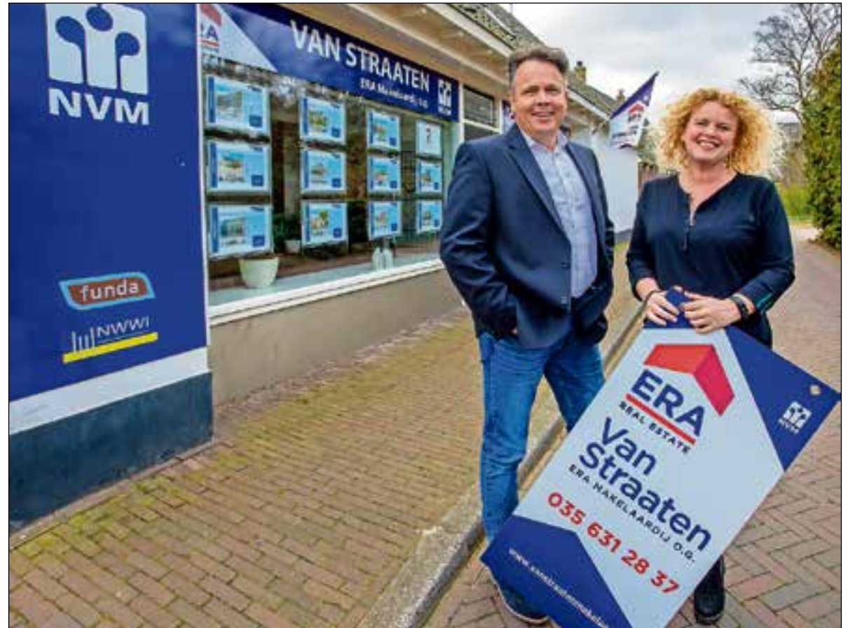
■ Van Straaten makelaardij is inmiddels ook een vertrouwde naam in Huizen.