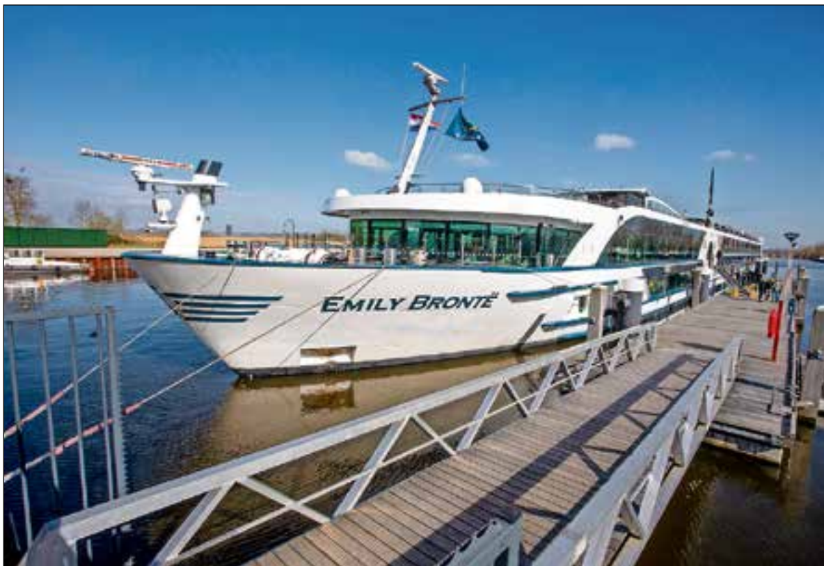
De Emily Bronte had woensdagmorgen de primeur.