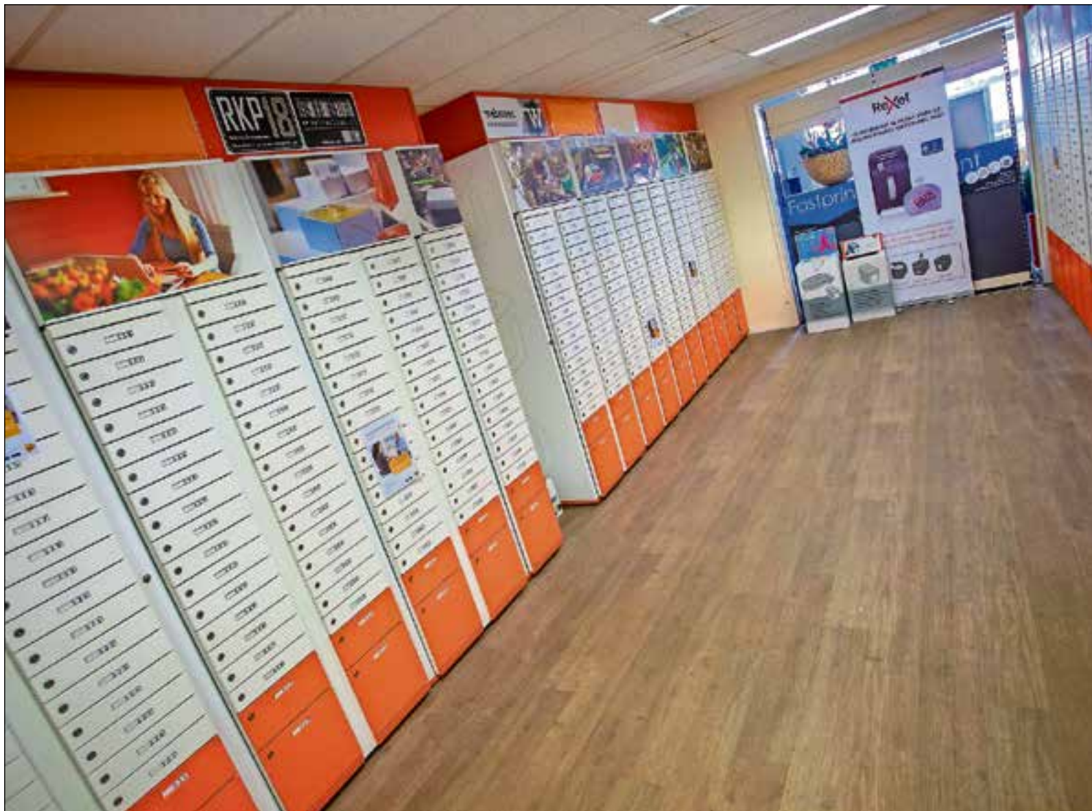
■ Het PostNL Business Point aan de Nijverheidsweg.