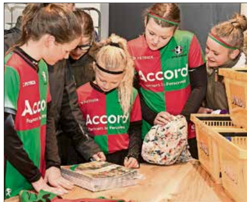
De voetbalplaatjesactie is voor alle leden.

de ontvangst van (internationale) riviercruiseschepen. Inmiddels is Huizen als bestemming aangesloten bij Amsterdam Cruise Port (ACP), de marketing- en promotieorganisatie in de MRA voor de cruisebranche.