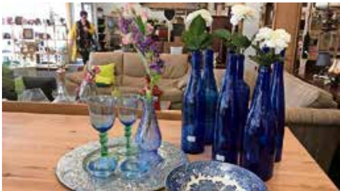
Leuke woonaccessoires in het KringloopCentrum.