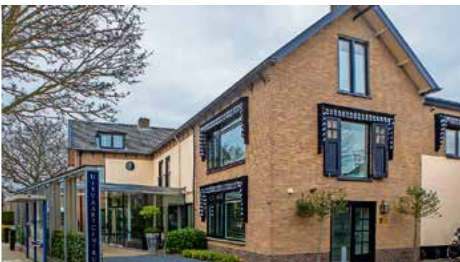
Het verbouwde uitvaartcentrum.

hij stopte met schilderen en met ze mee naar hun huis ging. Ik ben opgegroeid met dit bedrijf, maar dat ik dit bedrijf zou overnemen, had ik op jonge leeftijd niet gedacht. Toen ik op het