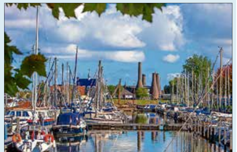
De Haven van Huizen.

In de 70’er jaren is de haven breejer ëmaakt vanof waar nou eethuis de ‘Kalkoves’ staet. Jaren later, dat zal zoë’n bietjen ëweest hemmen too Hotel Newport en ‘t Nautisch kwartier annëlegen wurden is t’r nog vuul meer veranderd. De kniek naer links dee die vroger maakten wurden nou naer reks ëmaakt, de werkhaven wurden annëlegen