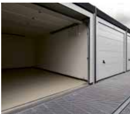
Garagebox variëren van 18 m 2 tot ruim 42m 2 .

Ook worden de garageboxen gebruikt voor opslag. Denk aan installateurs en