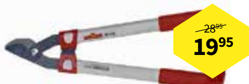
TAKKENSCHAAR POWERCUT RR530 VAN WOLF GARTEN Maximale takdikte 38 mm