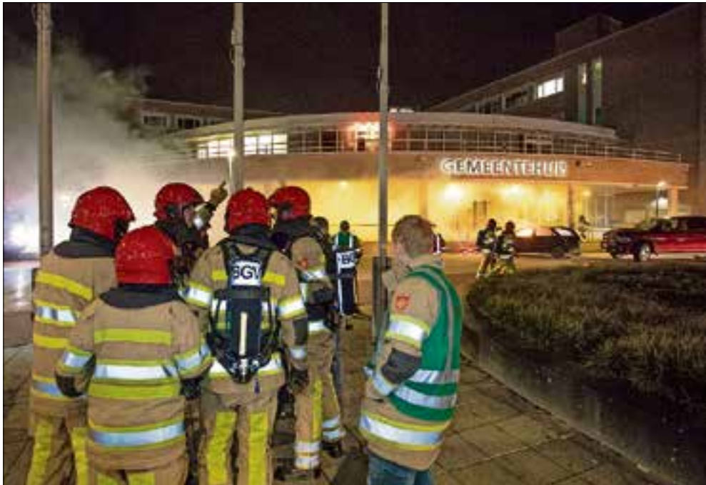
■ De brandweeroefening begint.