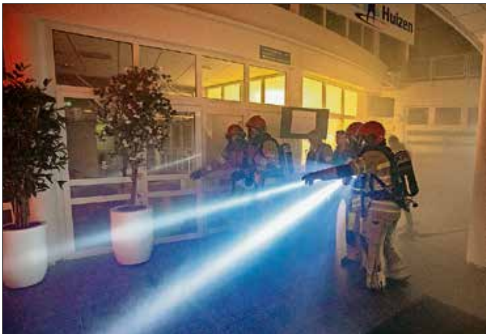
■ Binnen gaat de brandweer op onderzoek uit.