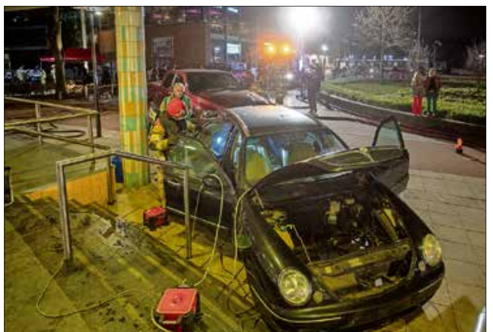
■ Na afloop van de oefening wordt er netjes opgeruimd.