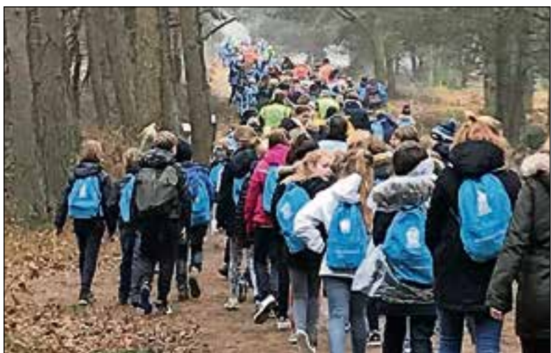
Zes kilometer wandelen met zes liter water.