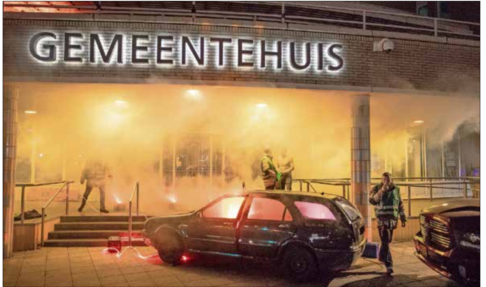
Vrijdagavond oefende de brandweer op het gemeentehuis. Raadsleden, wethouders en burgemeester speelden slachtoffers.