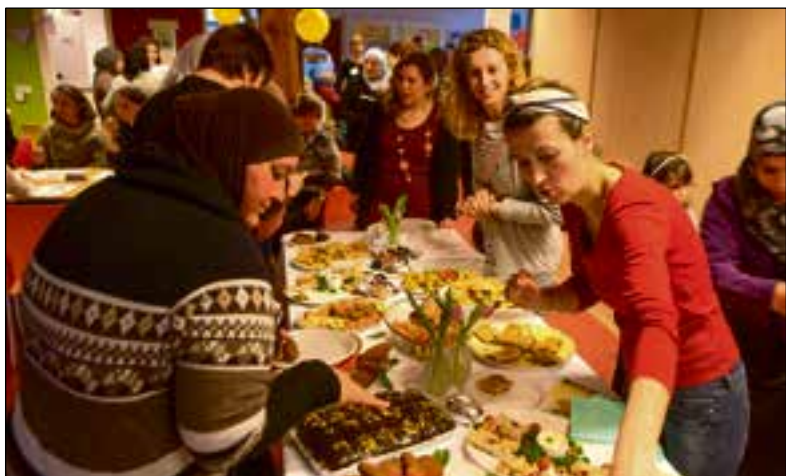
■ Ook vorig jaar werd Vrouwendag gevierd in het Holleblok.

tot 19.00 uur in het teken van vrouwenactiviteiten met informatie, workshops, muziek en dans en creativiteit. Het internationale thema voor Vrouwendag 2019 is 'Heldinnen'. "Wij gaan daar graag in mee, want we zijn tenslotte allemaal heldinnen. Daarom is er naast aandacht voor de vrouwen die heldendaden hebben verricht in de wereld om andere vrouwen te helpen, ook ruime aandacht voor de heldin in onszelf." Er zijn hapjes uit meerdere culturen, van Arabische hapjes tot Hollandse koek. De opbrengsten gaan naar SamenHuizen, ten bate van verbindingprojecten voor vrouwen en het SamenHuizen Kinderfeest op 8 juni. Kijk voor het programma op de Facebookpagina van SamenHuizen of buurgeluk.nl.