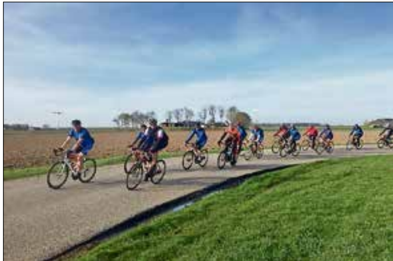
■ De eerste wielertocht staat weer op het programma.

De Openingstocht gaat door bosrijke gebieden richting Scherpenzeel, waar voor de 100 km rijders een koffiestop is gepland in De Kromme Hoek. Er wordt gestart vanaf clubhuis Aan de meet aan de Crailoseweg 80. Er zijn twee afstanden, 60 en 100 km, en beide tochten starten om 9.30 uur. De inschrijfkosten voor deze tocht bedragen voor Toerfietskaarthouders (NTFU) € 2,50 en voor overige deelnemers € 3,50. Er wordt in verschillende groepen gereden en met verschillende snelheden. Wielertoerclub Huizen is een club voor sportieve en recreatieve racefietsers en MTB'ers, aangesloten