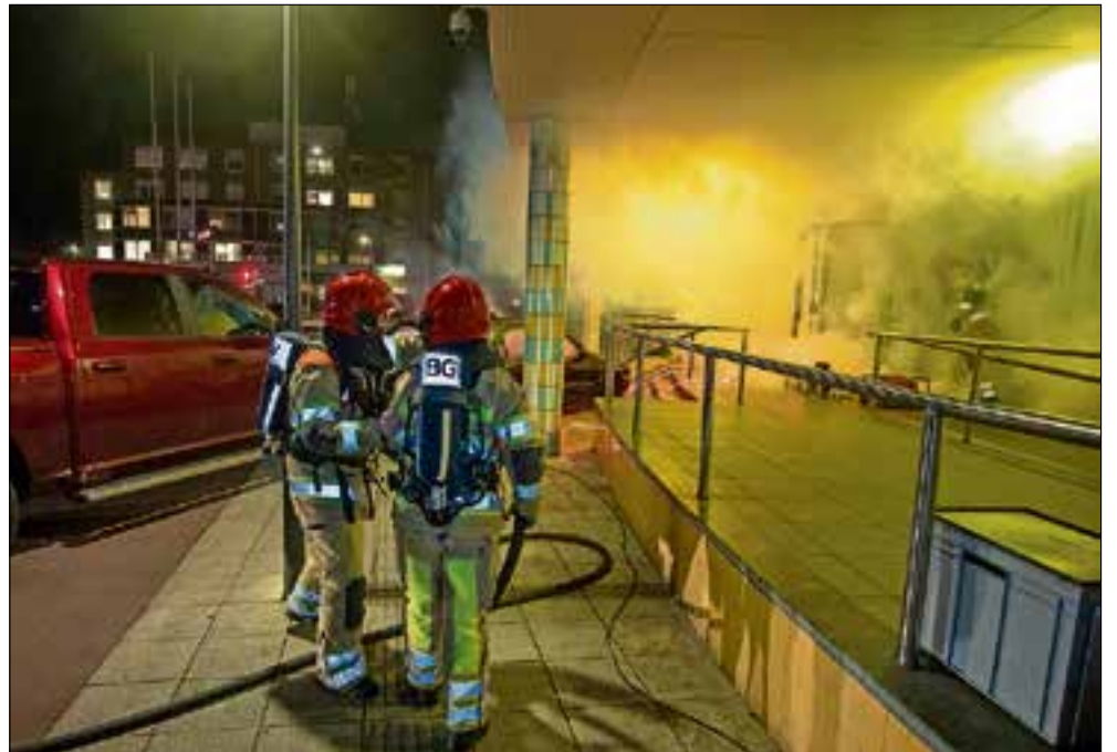
■ Kijken hoe de auto voor het gemeentehuis geblust kan worden.