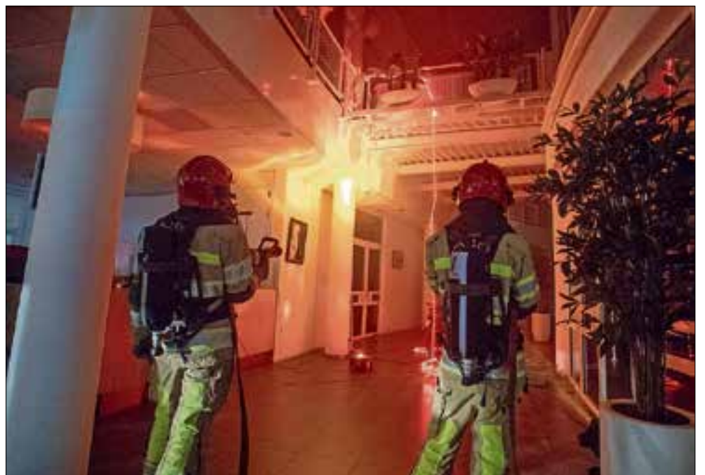
■ Er is ook een brand die doorslaat naar de 1e etage.