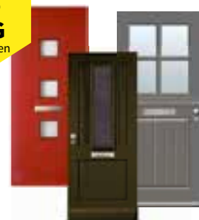
Inclusief glas en hang- en sluitwerk én 10% korting op de montage