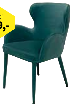
STOEL PERRY Stoel en poten met velvetstof bekleed, in vier kleuren