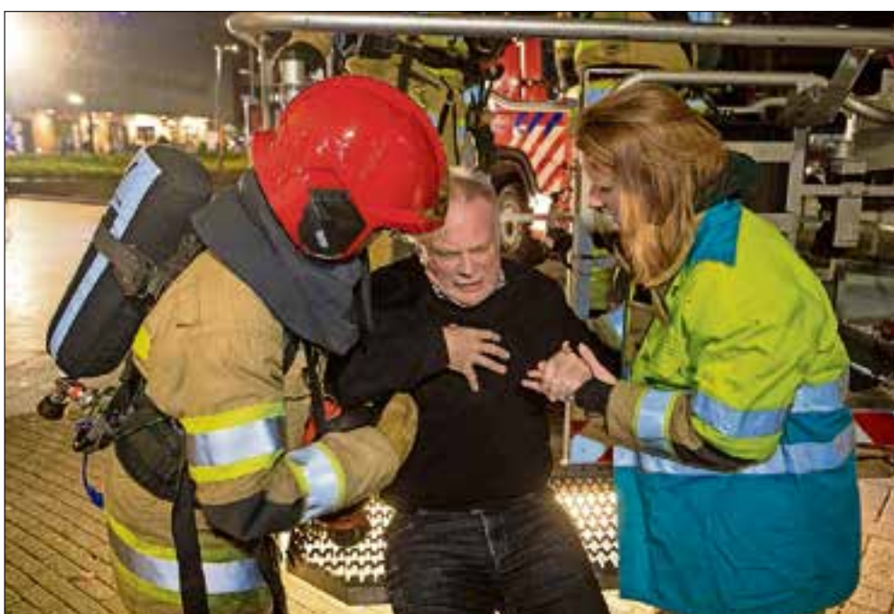
■ De burgemeester is een van de slachtoffers; hij wordt met een hoogwerker gered.

De brandweer is altijd op zoek naar vrijwilligers. Ook vragen over brandpreventie zijn welkom. Kijk op brandweer.nl/gooienveststreek of bel 035-5288777.