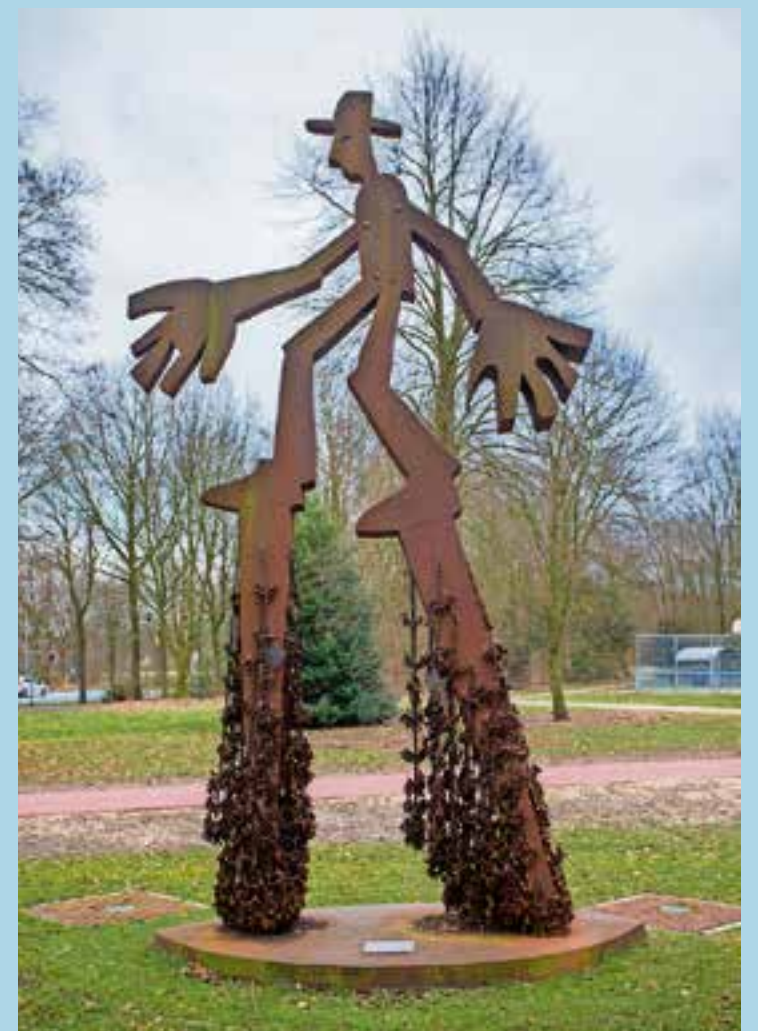
Het beeld stond Eerst op het Museumplein in Amsterdam, toen op Plein 2000 bij gemeentehuis Huizen en nu op de hoek van 't Merk met de Gemeenlandslaan.