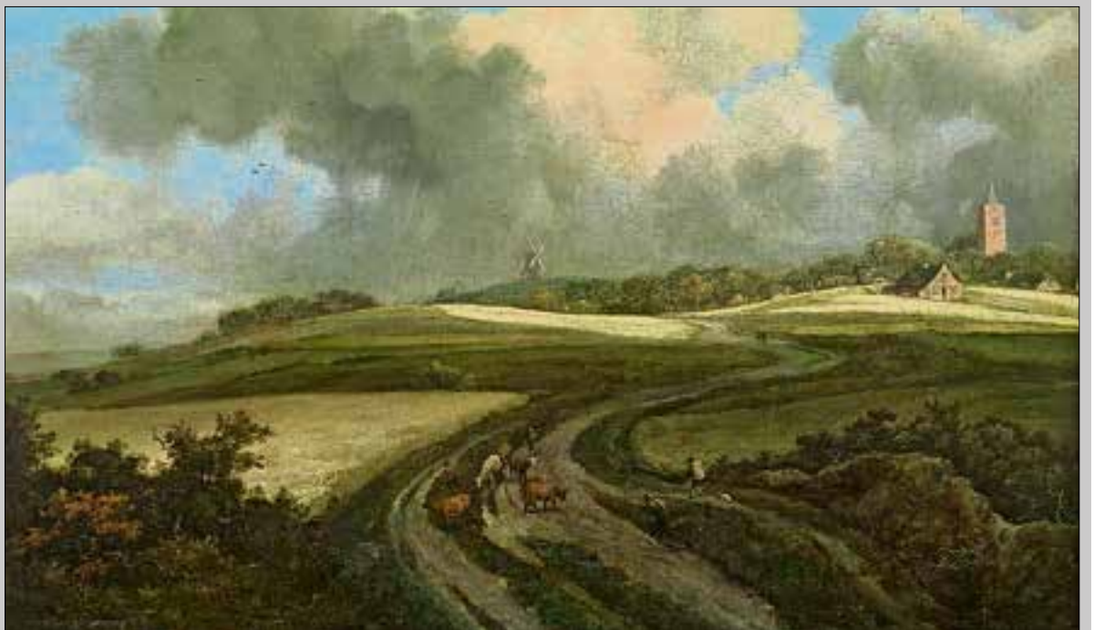
'Weg door graanvelden bij de Zuiderzee' van Jacob van Ruisdael uit 1660-1662.

We hebben onlangs nieuwsgierig meegekeken met de ontdekkingen van de Stichting Vijverberg (Naarden). Voor een eigen lokaal onderzoek hebben zij hele oude kaarten geraadpleegd. Het neveneffect van hun zoektocht was dat zij op die kaarten de windmolen van Huizen tegenkwamen. Een waterstaatkundige manuscriptkaart uit 1636 en een kaart van Bonifatius uit 1619 tonen een windmolen op de locatie van de Molenberg. Doordat zij dit