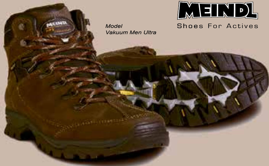
Model Vakuum Men Ultra