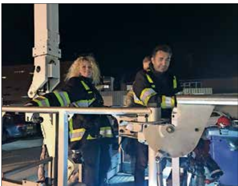
■ Raadsleden gaan omhoog met de hoogwerker.

“Over 10 jaar? Dan woon ik in een groepshuis in Huizen, speciaal voor slechthorenden. Met zijn allen communiceren we dan met gebarentaal en we begrijpen elkaar omdat we allemaal dezelfde beperking hebben. Dat wordt mijn thuis in de toekomst.”