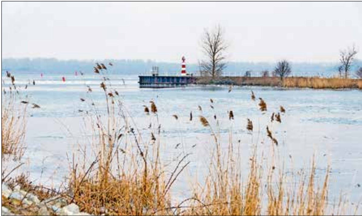
De Basis cursus Fotografie van Via