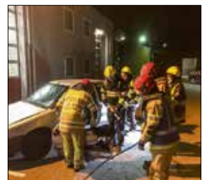
■ Met pneumatisch gereedschap aan de slag.

middelen. Naast uitleg en bezichtigen van het materieel mochten ze zelf ook blussen en een blik op Huizen werpen van bovenaf de hoogwerker.