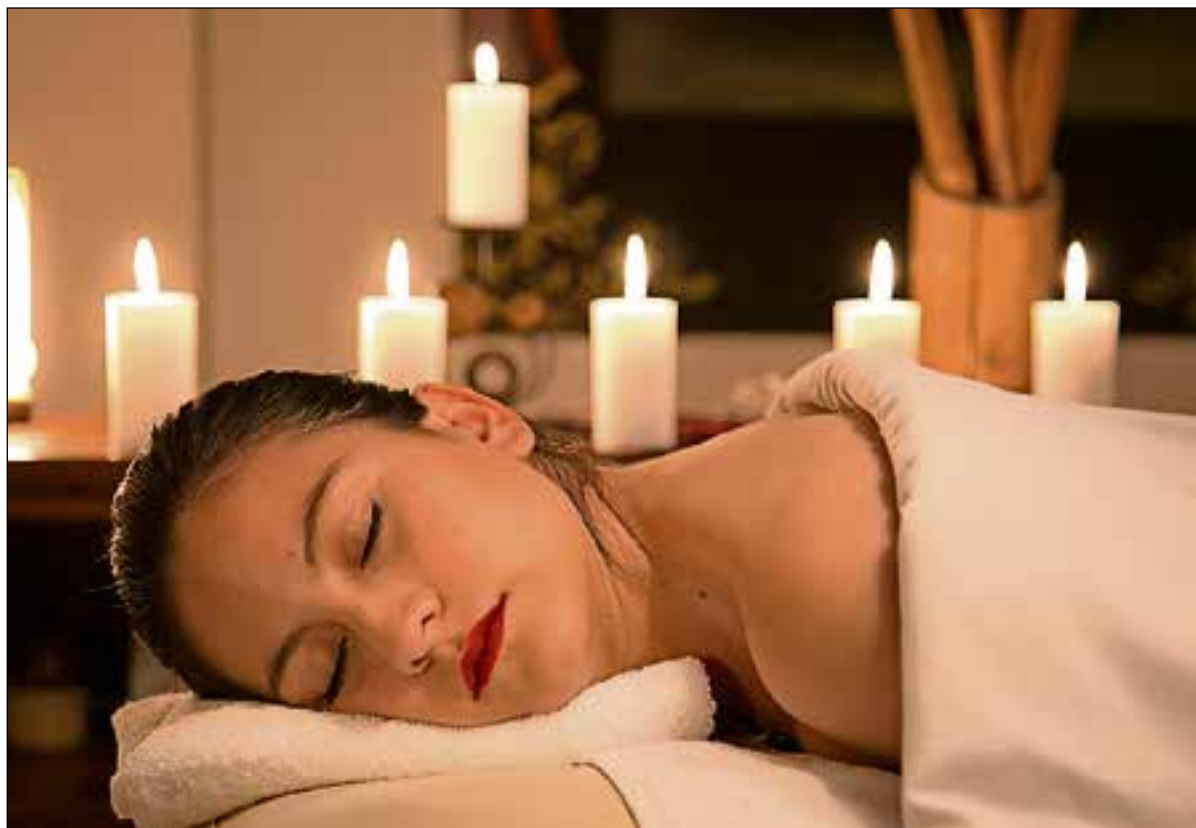
■ Er even tussenuit kan ook dicht bij huis.