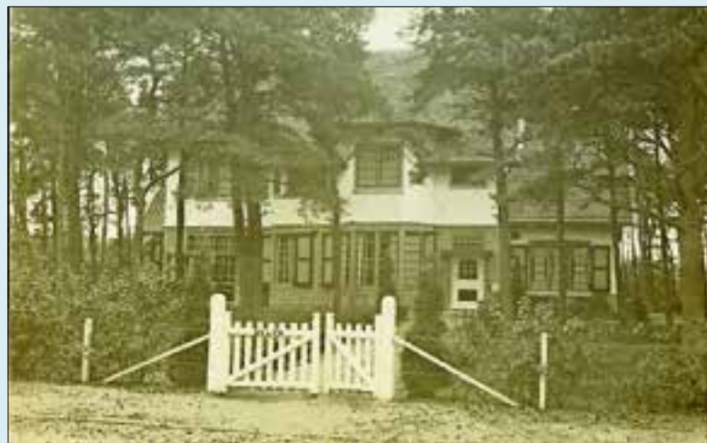
Villa Sylva