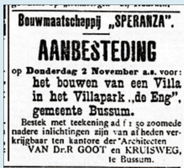
De Gooi en Eemlander 25 oktober 1905