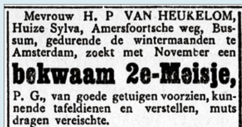
De Gooi en Eemlander 19 september 1914