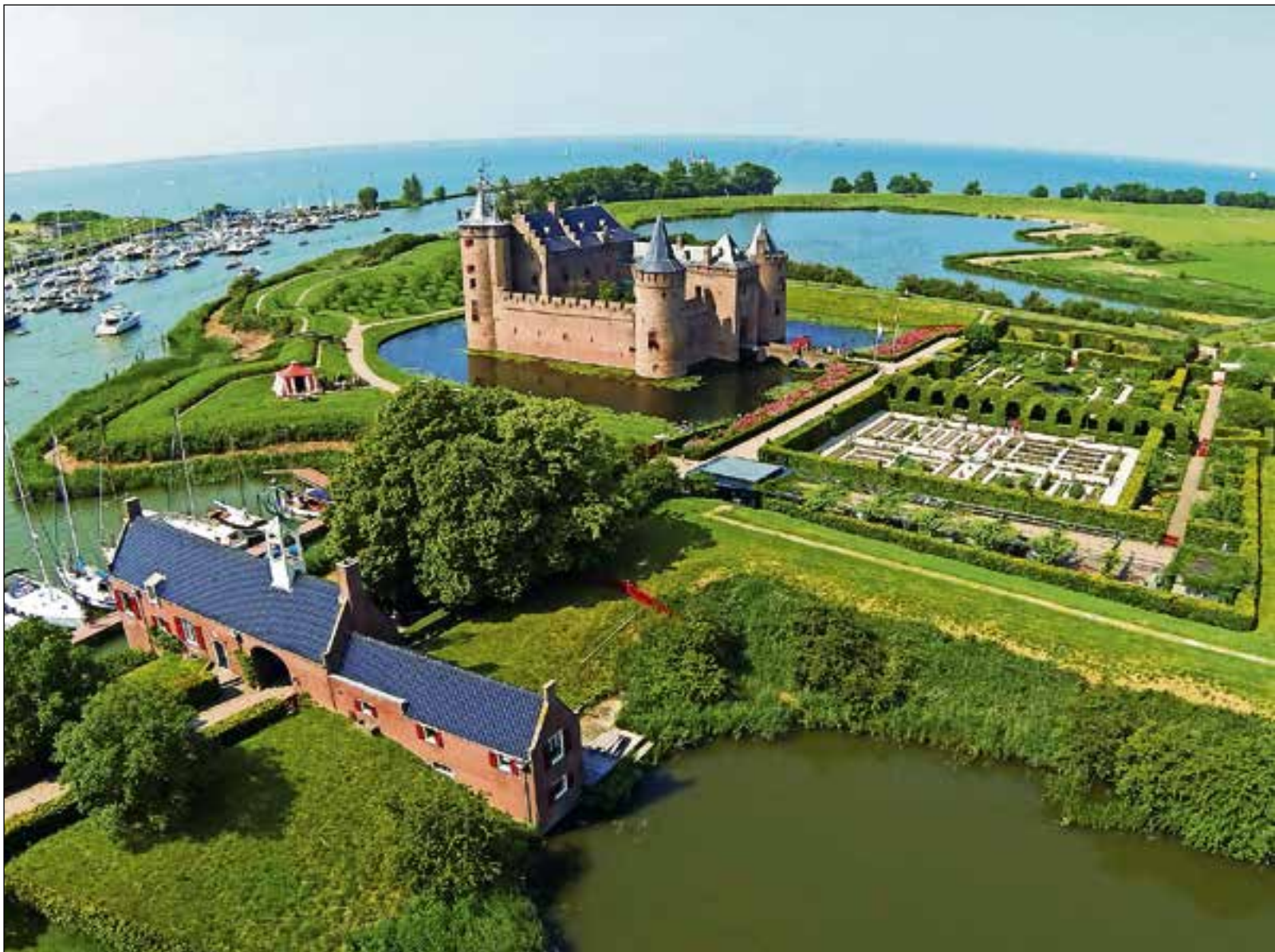
■ Het Muiderslot wil een markante plaats in blijven nemen in het museumlandschap.