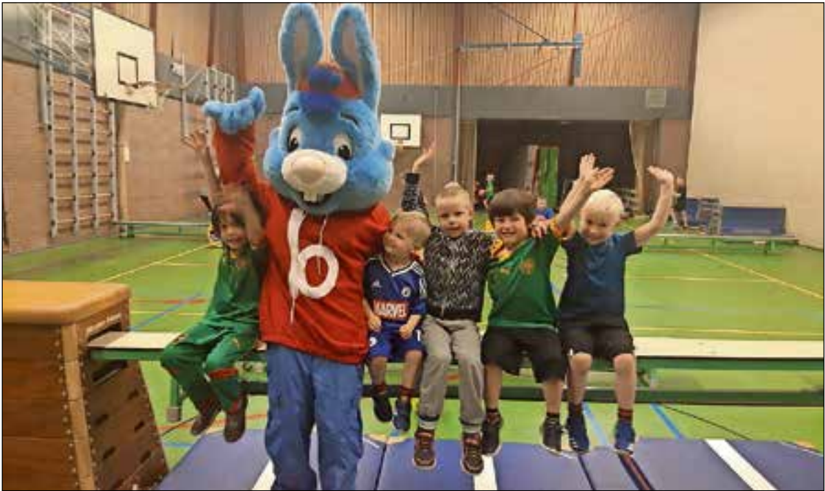
Bobo vakantie dagen. Vanaf maandag 12 augustus om 8.30 uur in De Lunet in Bussum.

Wekelijks spreekuur Administratie voor Elkaar. Voor allerlei vragen over administratie en diverse (gemeentelijke) formulieren, uitleg en hulp bij het invullen. Vragen over toeslagen en andere financiële regelingen.