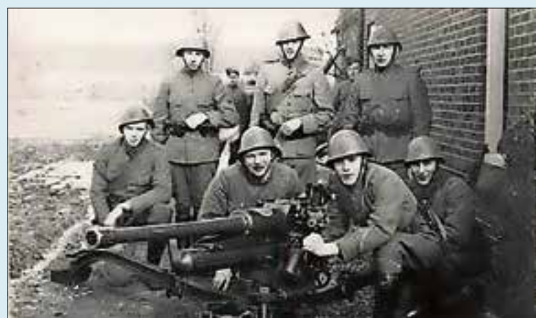
Nederlandse pantser afweer geschut eenheid 1940

versperringen en inundaties in en rond Muiderberg. De in september 1939 gemobiliseerde soldaten nemen hun intrek in scholen en huizen. De polder ten oosten van Muiderberg en de Keverdijkse polder worden onder water gezet. De Noord- en Zuidpolder van Muiden volgen op 10 en 12 mei. De bevolking van Muiderberg evacueert op 13 mei en gaat via Weesp met de trein naar Enkhuizen.