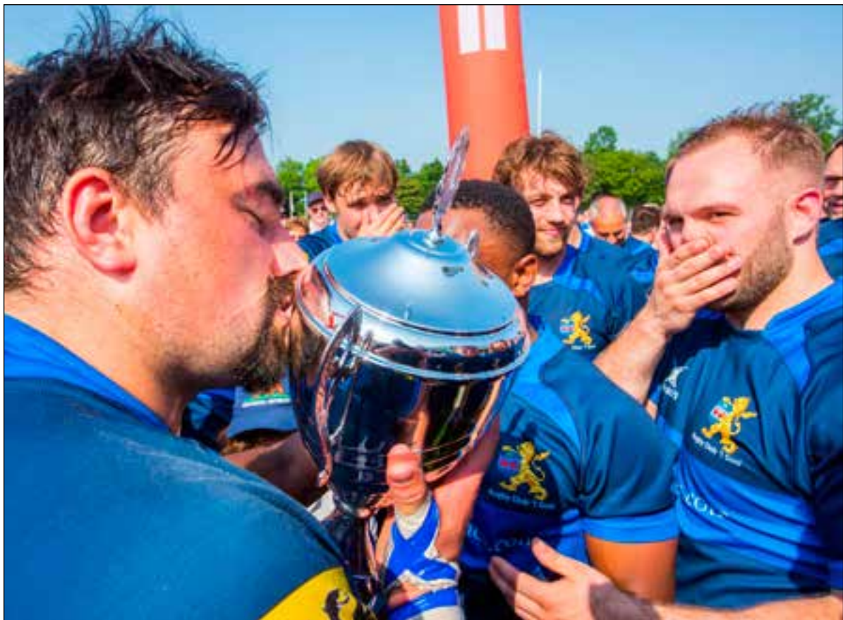
■ Vorig jaar werd de club uit Naarden landskampioen tegen Hilversum. Kunnen ze de titel behouden?