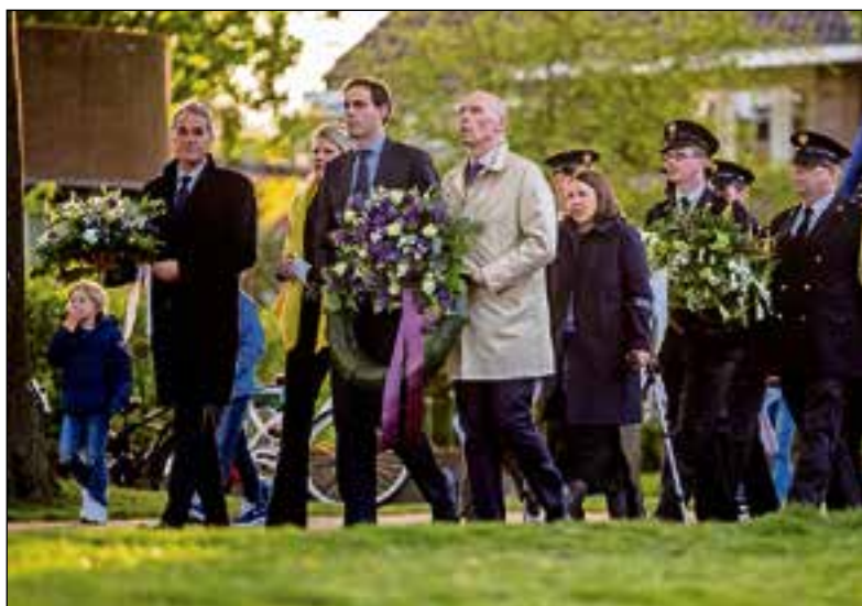
De minister legt een krans.

"Op een kwartiertje fietsen van hier woont Roxanne in de bossen van Naarden. Ze renoveert in 2012 het huis. Er worden luiken ontdekt onder de vloerbedekking en schuilplekken achter lambrieringen. Ze treffen er kaarsstompen, bladmuziek en oude verzetskrantjes aan." Roxanne doet onderzoek naar de achtergrond van het huis en ontdekt dat in haar woning in de oorlogstijd een verzetsgroep zat en dat er tot wel 25 onderduikers zaten. En dat op steenworp afstand van Anton Musserts liefdesnestje en huizen van andere NSB'ers." De minister vertelt dat het hem persoonlijk