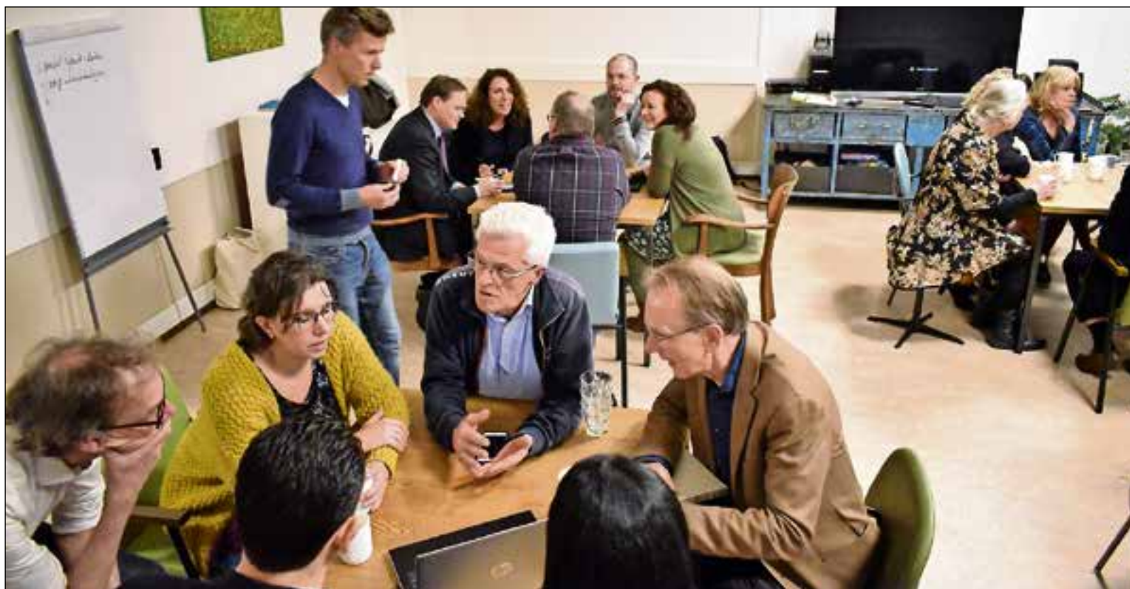
■ Vooral bij de nagesprekken kregen plannenmakers veel tips.