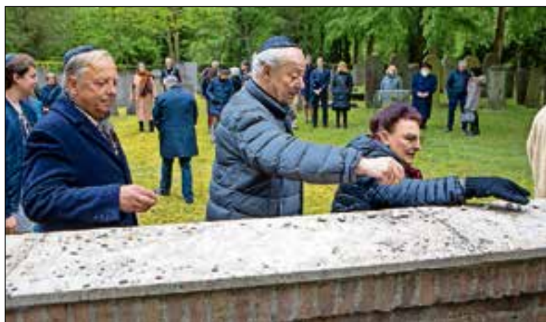
Na afloop werden bloemen en steentjes gelegd.