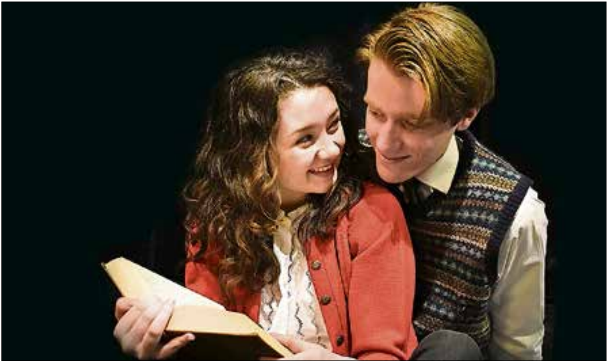
■ Anne en Peter in een scène uit het toneelstuk 'Anne Frank'.

NH Toneel speelt Anne Frank 20.00 uur | Theater in Zuyd Bussum Toneelstuk naar het dagboek van Anne Frank. Op meerdere data. Reserveren: www.nhtoneel.nl .