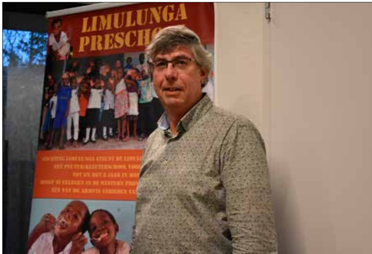
■ Een leerling bedacht een actie voor een goed doel. Die werd gekoppeld aan het afscheid.

In die 28 jaar dat hij directeur was van de Minister Calsschool heeft hij nooit overwogen om over te stappen naar een andere school. “Ik heb daar geen moment tijd voor gehad, ik was te druk met van alles.” Als hij terugblijkt lopen verbouwingen en verhuizingen als een rode draad door zijn carrière. Zo begon hij in januari 1991 aan de J.W. Frisolaan met 118 leerlingen in een gebouw dat bedoeld was als tijdelijke huisvesting. “Met een pennenstreek is er toen door de