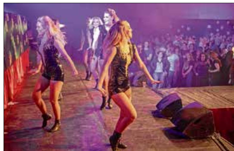
■ Voetjes van de vloer.