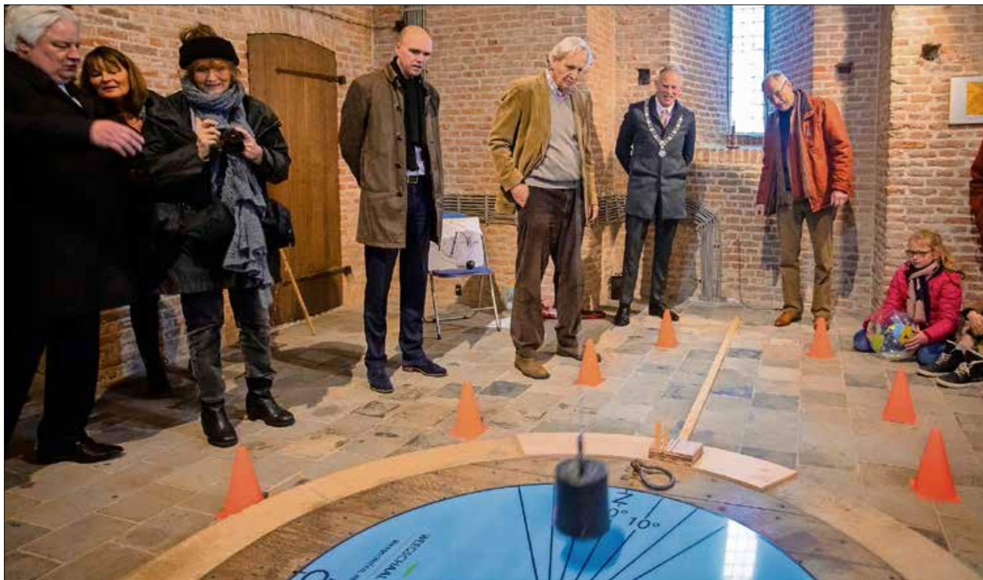
Met grote belangstelling werd gekeken hoe de slinger over de windroos ging.