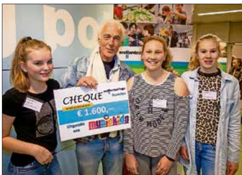
■ De cheque met het mooie bedrag van 1600 euro.

mendichtheid' te waarborgen?" Balzar hoopt dat er nieuwe bomen teruggeplant worden. De vragen zijn nog niet beantwoord.