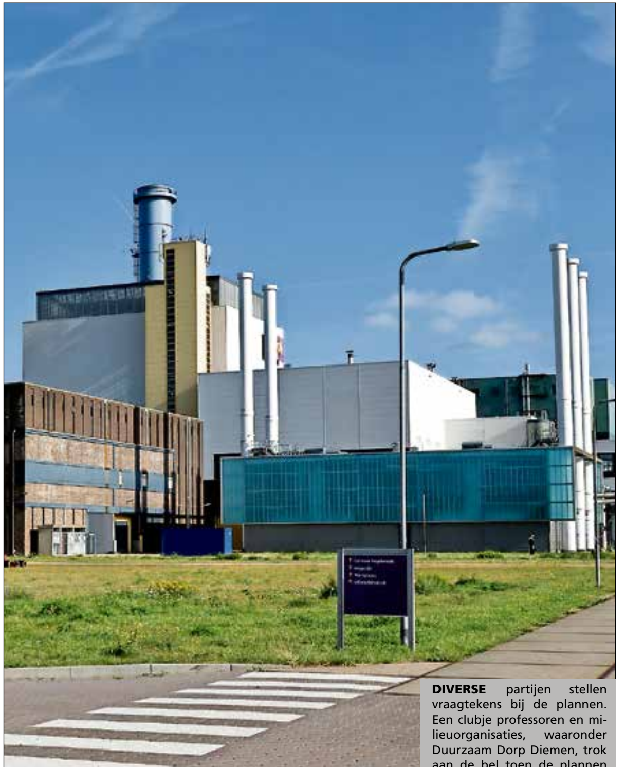
■ De nieuwe centrale moest naast de bestaande komen.

gevolgen voor Diemen kunnen hebben. Diemen dringt nu aan op een convenant met de provincie Noord-Holland en bij voorkeur Amsterdam en Almere en mogelijk Weesp en Gooise Meren. In dit convenant moeten afspraken worden gemaakt over onder andere de tijdelijkheid van de centrale,