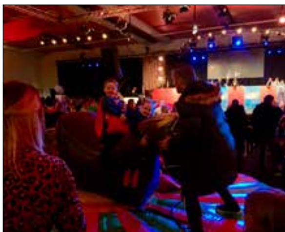
■ Zondag pret voor kinderen.