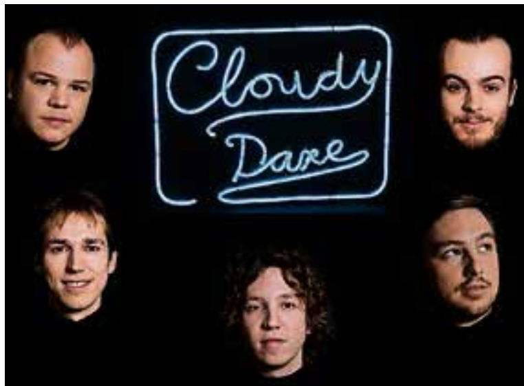
■ De vijf jonge muzikanten van de band.