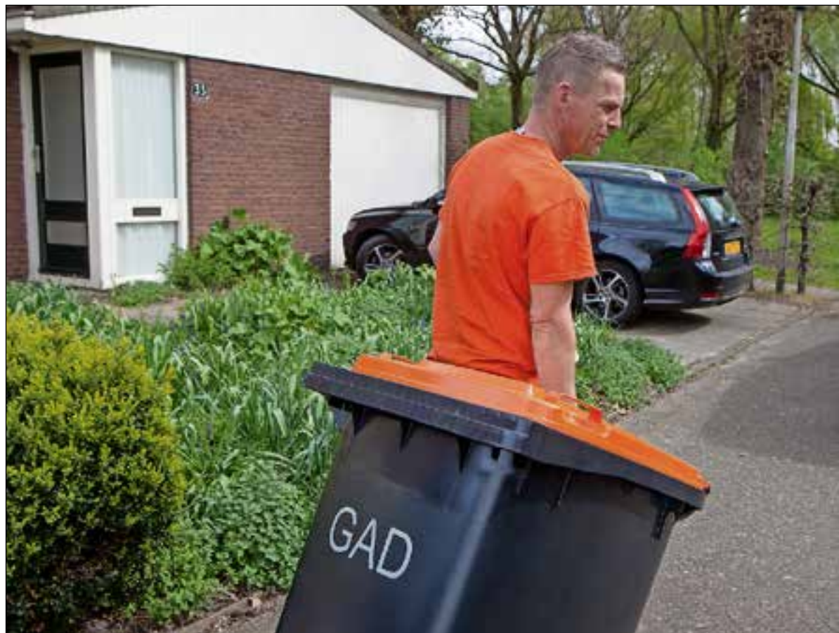
"Pmd scheiden achteraf kan alleen als pmd aan de bron goed gescheiden wordt."

teit", aldus Van Gelderen. En weer kwamen er mooie cijfertjes tevoorschijn. Over zo'n tien jaar, in 2030, moet 50% van al het afval op een goede manier verwerkt worden. In de praktijk betekent dat dat bijvoorbeeld plastic na verwerking ook plastic blijft en dat papier ook