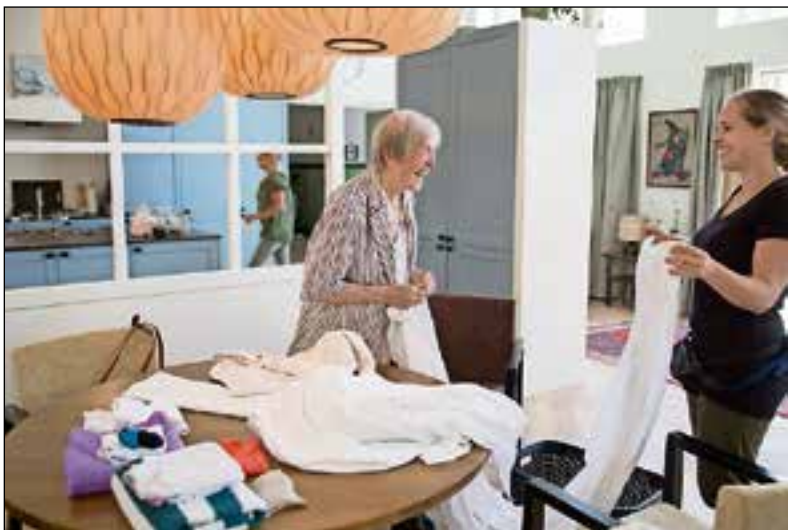
■ Nieuwbouw voor mensen met dementie.

19.30 uur een informatieavond bij de Koninklijke aan de Westzeedijk 7 in Muiden.