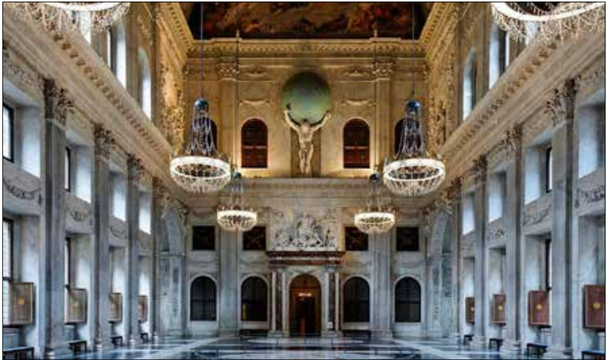
De Burgerzaal in het Koninklijk Paleis Amsterdam.