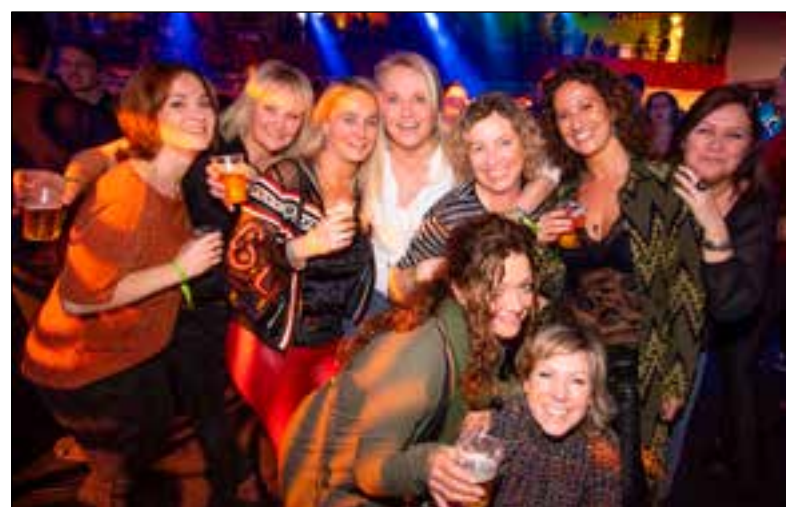
■ Everybody happy.