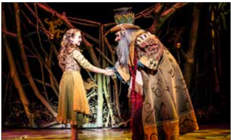
■ Familiemusical Sprookjessprokkelaar

BUSSUM De nieuwe en spannende familiemusical ‘Sprookjessprokkelaar’ komt naar Spant! en deze krant mag gratis kaartjes weggeven.