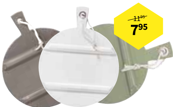
BROODPLANK VAN HK LIVING Voorzien van handvat met metalen ring en ophangkoord, Ø 25 cm, verkrijgbaar in drie kleuren

Shop je favoriete items nu extra voordelig!