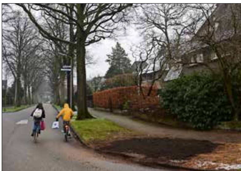
■ Oude boom is weggehaald.

De partij wil de komende tijd meer inzetten op biodiversiteit. Ook deze bomen vervullen volgens de partij een belangrijke rol voor het leven van bijvoorbeeld eekhoorns en uilen in de buurt. Marten Balzar legt uit: "Het takken- en bladerrijk hoog boven de grond is zeer belangrijk in combinatie met