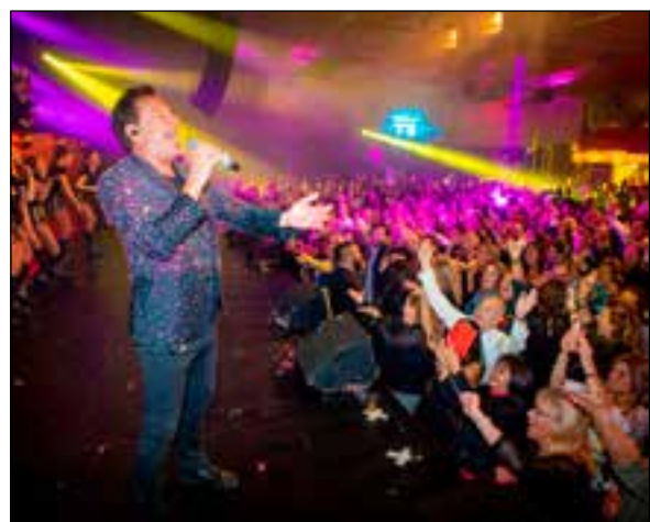
■ Gerard Joling krijgt de handen in de lucht.