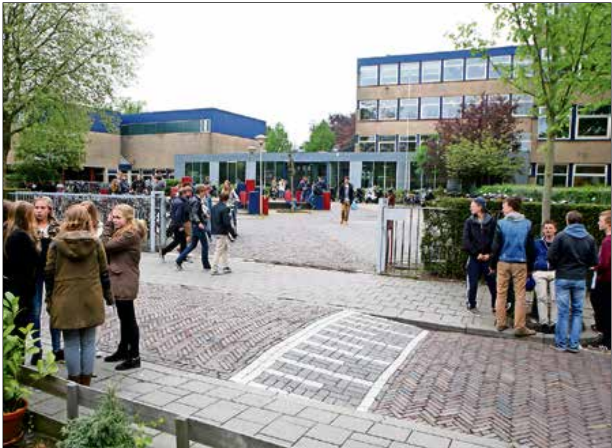
■ Het gebouw van het Goois Lyceum voldoet niet meer aan de eisen van deze tijd.

De sloop- en bouwwerkzaamheden op de twee scholen worden een hele klus. De leerlingen worden gedurende de werkzaamheden ergens anders ondergebracht. De gemeente zoekt daarvoor nog een tijdelijke locatie waar de meer dan duizend scholieren tijdens de verbouwing toch gewoon de lessen kunnen volgen. De twee scho-