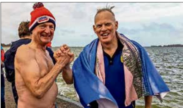
■ De stoere mannen doken het IJmeer in.