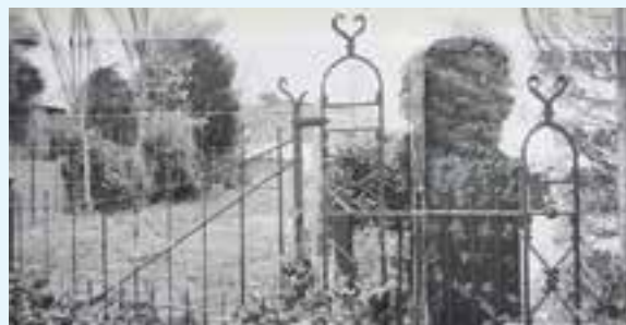
Smeedijzeren poort met een doorgangsbreedte van ruim vier en een halve meter voor de doorgang van de chique landauers met twee paarden en hittenkarren.

Deze stichting was in 1960 door M. Reckman uit Naarden opgericht. De stichting organiseerde groepsreizen per chartervlucht voor familieleden van emigranten. Later kwam reisbureau Gerco Travel in het pand. Daarna staat het pand jarenlang leeg en verkommerd. De tuin wordt een wildernis. Na de sloop ligt het terrein nu klaar voor nieuwbouw. Op het terrein komen twee woningen, een aan de