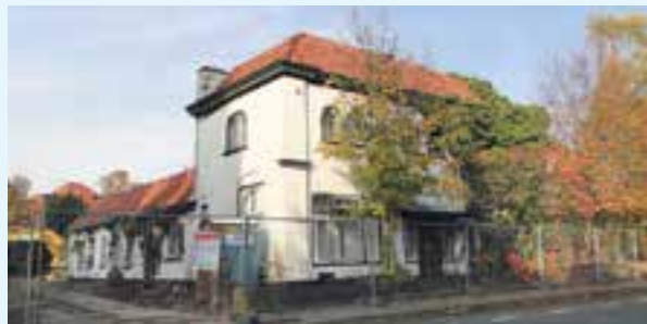
Het Landbouwhuis, Comeniuslaan 16, tijdens de sloop in november 2018

Kijkend van Naarden richting Bussum de kwekerijen en de eerste huizen langs de Comeniuslaan. Rechts aan de horizon staat de St. Vituskerk. Midden op de foto staan twee huizen met de rug tegen elkaar. Het huis aan deze kant had een smeedijzeren poort aan de huidige Julianalaan. De foto is in 1899 genomen vanaf de steiger van de schoorsteen van de elektriciteitscentrale in aanbouw.