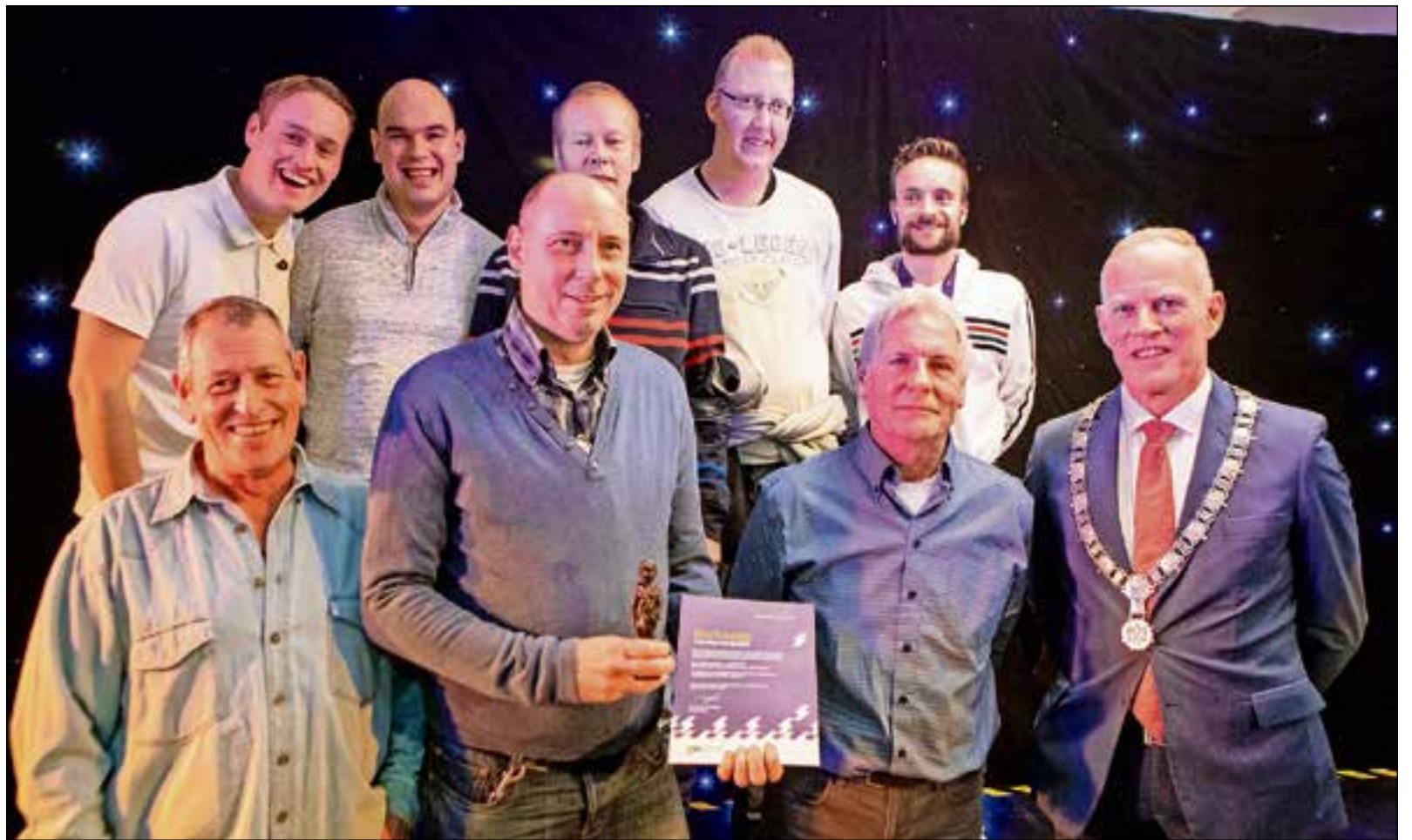
De vrijwilligers op de foto met leden van het G-team.