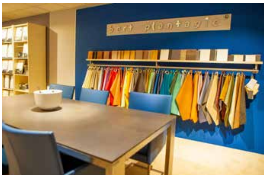
■ Een tafel met stoelen van Bert Plantagie kun je naar eigen smaak ontwerpen.

tafelblad je kunt kiezen en welke kleur leer voor de stoelen. En dat is nog niet alles: je kunt ook nog kiezen welke stof en welke poten je wilt.” Om mensen te helpen een keuze te maken, zet hij de