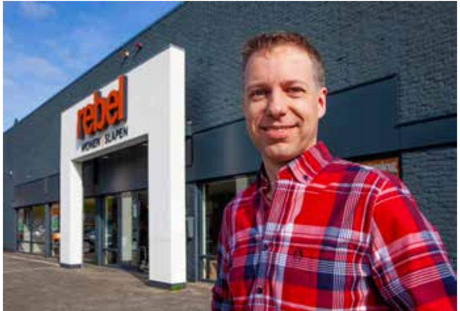
■ Jan Rebel van Rebel Wonen | Slapen.

Rebel Wonen | Slapen heeft dan ook alles om een nieuw interieur in te richten. Naast meubels is er een grote keuze aan raamdecoratie en vloeren. "We stallen dat niet meer zo groots uit als vroeger. Dat hoeft ook niet, omdat je nu op beeld kan laten zien hoe het er in je eigen woonkamer uit komt te zien. We hebben wel overal stalen van, zodat