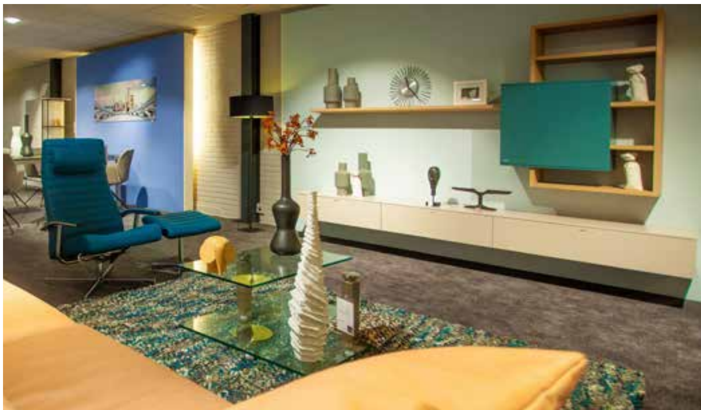
■ Een van de eigentijdse interieurs met aan de wand een kast van Interstar.