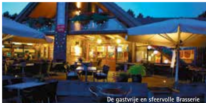
De gastvrije en sfeervolle Brasserie

*Contributie 2019: bij betaling vòòr 1 januari 2019 geldt contributie 2018 en betaald u géén inschrijfgeld. Contributie is exclusief NGF bijdrage.