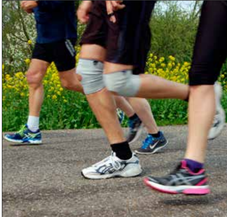
■ Meer sporten, een vaak gekozen uitdaging.

In de regio Gooi en Vechtstreek is 'IkPas' onderdeel van de actie '30dagengezonder'. In januari hebben veel mensen goede voornemens. Helaas stranden deze vaak al snel. Daarom heeft de GGD Gooi en Vechtstreek de nieuwe campagne '30 dagen gezonder' gelanceerd. Door mee te doen, nemen mensen het heft in eigen handen en kiezen zij hun eigen uitdaging. Gezonder, concreet, haalbaar en een goed begin van de lente. GGD Gooi en Vechtstreek daagde iedereen uit om in maart mee te doen met deze actie van vier GGD's uit Noord-Holland en Flevoland. Naast het pauzeren van hun alcoholgebruik kunnen deelnemers ook voor andere uit-