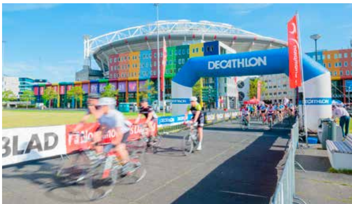
■ Start en finish op de ArenA Boulevard in Amsterdam.

Meer informatie is te vinden op vivium.nl/opendag . Wie zich van tevoren aanmeldt krijgt tijdens de open dag een kleine attentie.