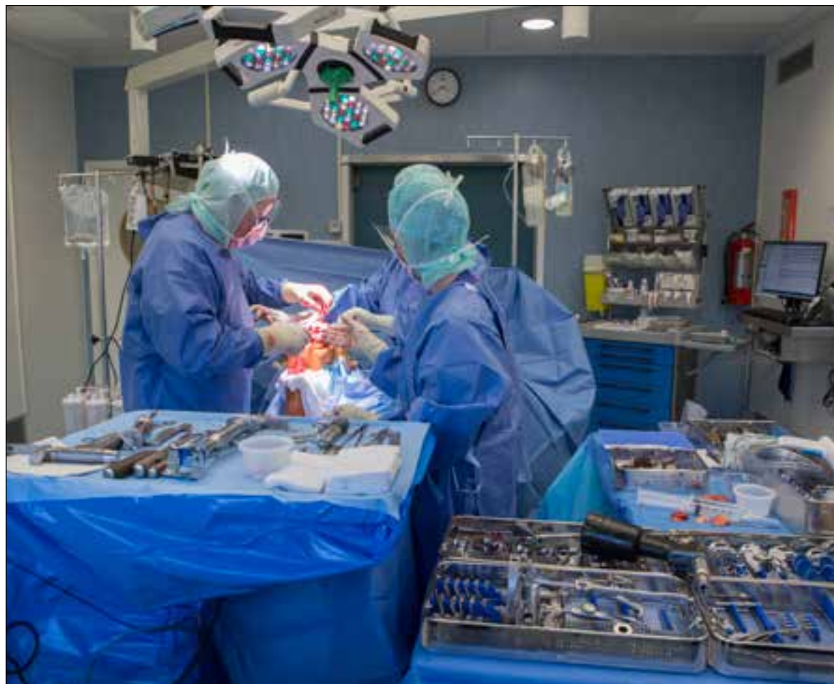
■ Tijdens de operatie wordt de allernieuwste knieprothese geplaatst.

Bij Tergooi zijn alle patiënten welkom omdat het team de kennis en ervaring heeft om ook bij patiënten met een verhoogd risico veilig een knieprothese te plaatsen. Jaarlijks ondergaan ongeveer 350 mensen deze behandeling in Tergooi. Hiervan ervaart 90 pro-