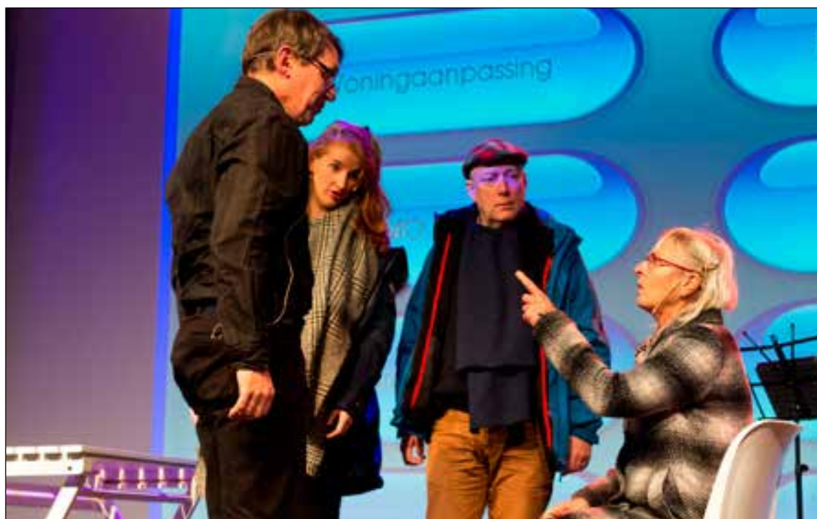
■ De voorstelling van theatergroep Ervarea geeft een steuntje in de rug.