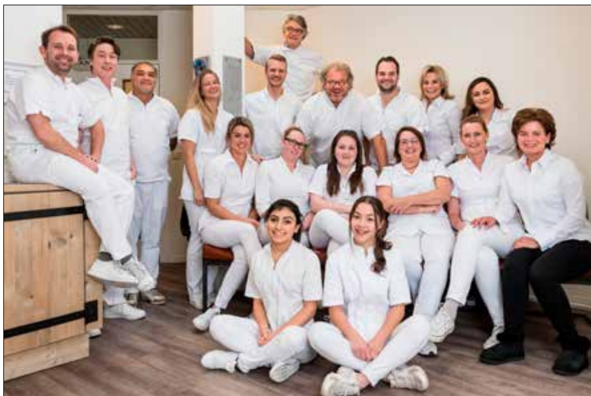
■ Iedereen kan bij het team van Tandheelkundig Centrum Kerkelanden voor bijna alles terecht.

"Onze praktijk wil een prettige, professionele en vertrouwde sfeer uitstralen", zegt Van der Linden. "Iedereen kan bij ons team voor bijna alles terecht. We hebben verschillende disciplines in huis. Naast de reguliere tandheelkunde plaatsen wij implantaten, doen we speciale wortelkanaalbehandelingen en cosmetische behandelingen aan het gebit. Onze visie: een complete mondzorg zonder onnodige kosten." Dat deze visie gewaardeerd wordt, blijkt wel uit de reacties van patiënten. "Goede reacties, daar doen we het voor. Wat ook goed valt: onze ruime openingstijden en het feit dat mensen bij ons geen maanden hoeven te