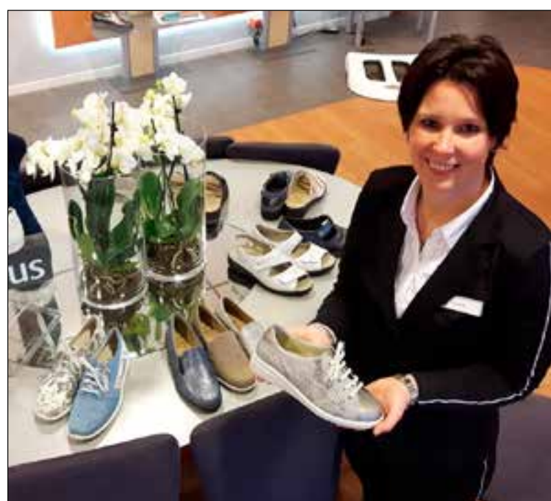
■ Dit voorjaar staat in het teken van de sneakers.

Spoor6 is laagdrempelig. Wanneer de stap naar de huisarts voor een verwijzing te groot voelt, is men van harte welkom voor een vrijblijvend gesprek met een van de professionals van Spoor6. Zo wordt een beeld verkregen van het behandelprogramma, de therapeuten en de aangename omgeving waarin de behandeling wordt aangeboden.