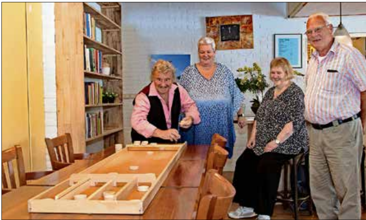
Woensdag is er weer Senioren Plezier in 't Vuronger.