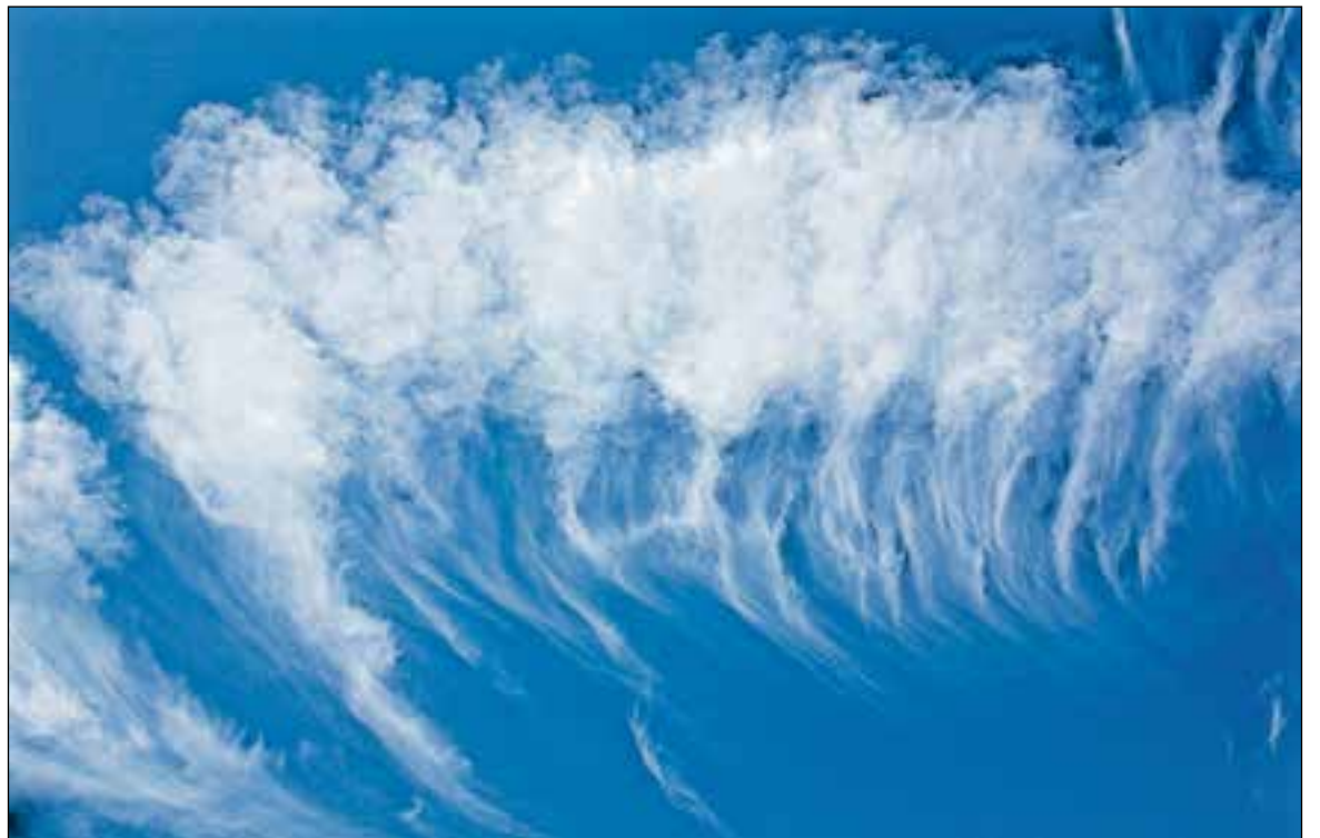
■ Wolkenluier boven Huizen.