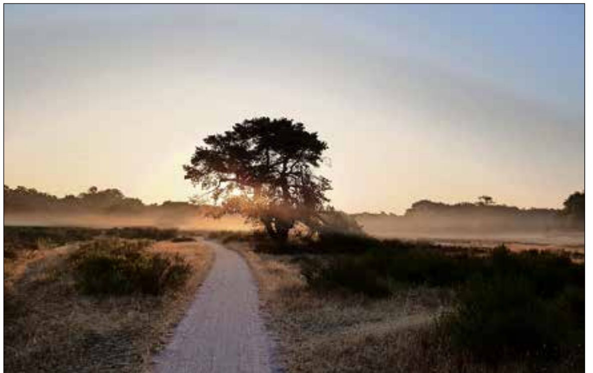
■ Zonsopgang op de hei.