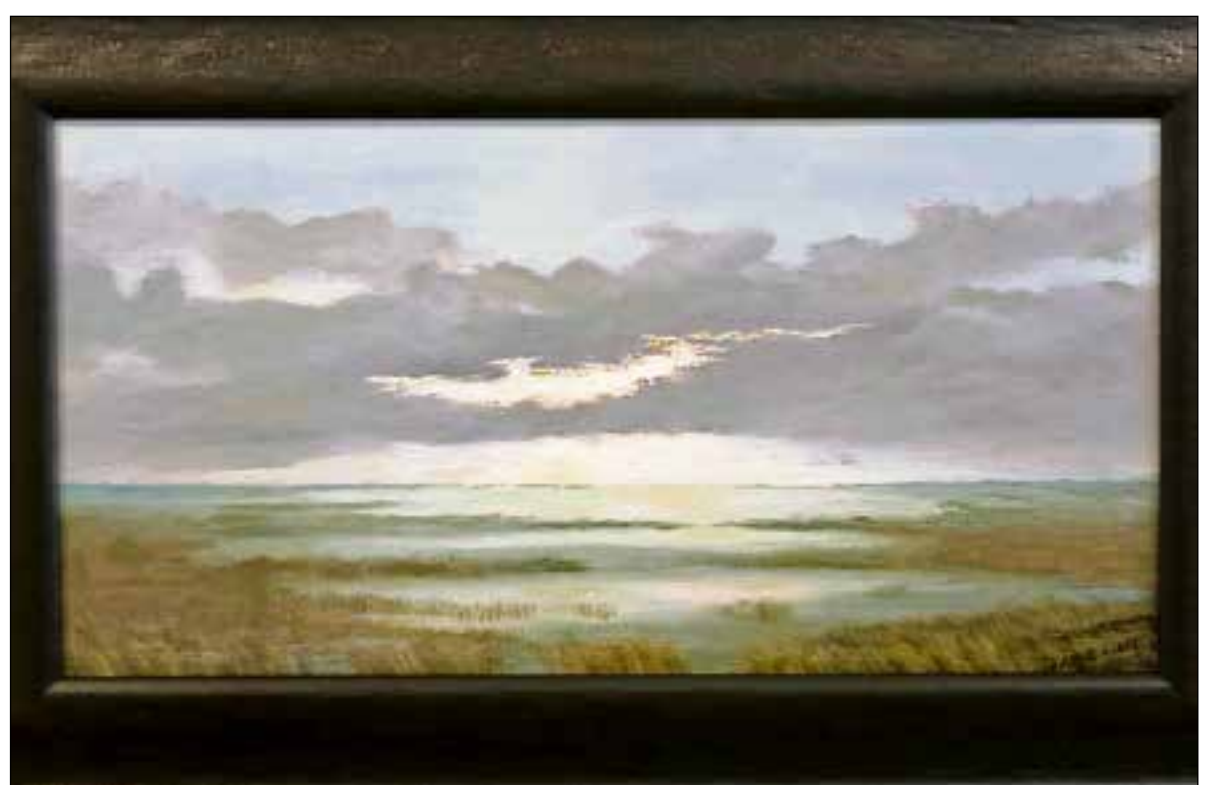
'Plassenlandschap' van Johan Herman Marius Schmüll uit 1939, collectie Gemeente Hilversum.

Hoe regionale collecties elkaar aanvullen en zo het historische verhaal vertellen is goed te zien bij de presentatie van dit landschap op de tentoonstelling in het Huizer Museum. In de tentoonstelling hangt een volledig gerestaureerde parel van Johan Herman Marius Schmüll (1882-1958). Hij was aanvankelijk verfhandelaar maar werd later schilder en tekenaar, en