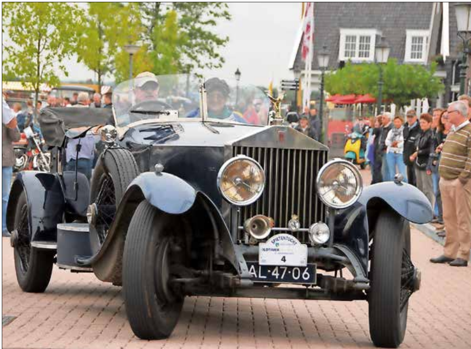
■ Een van de oldtimers bij het vertrek van de Spietentocht.