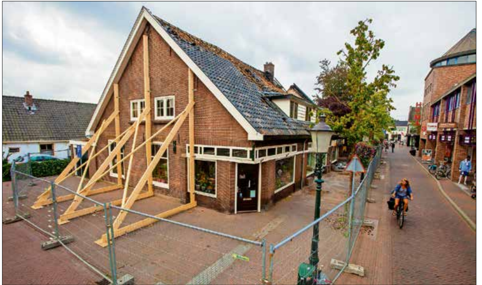
Het pand aan de Kerkstraat dat getroffen werd door brand is inmiddels gestut.

Er wordt onder andere voorlichting gegeven over een brandveilig leven en er zijn diverse demonstraties. Ook is er een escaperoom en de brandweerstore.