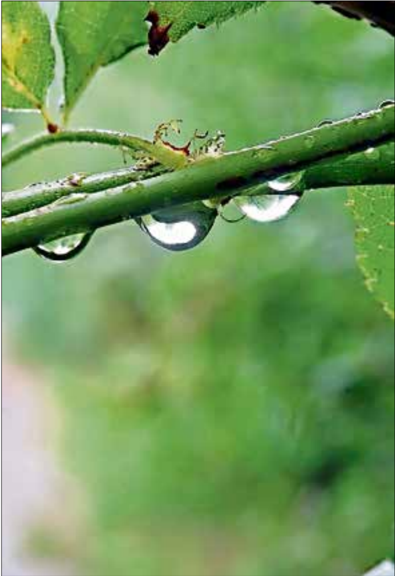
■ Druppels na de regen in het Stadspark.