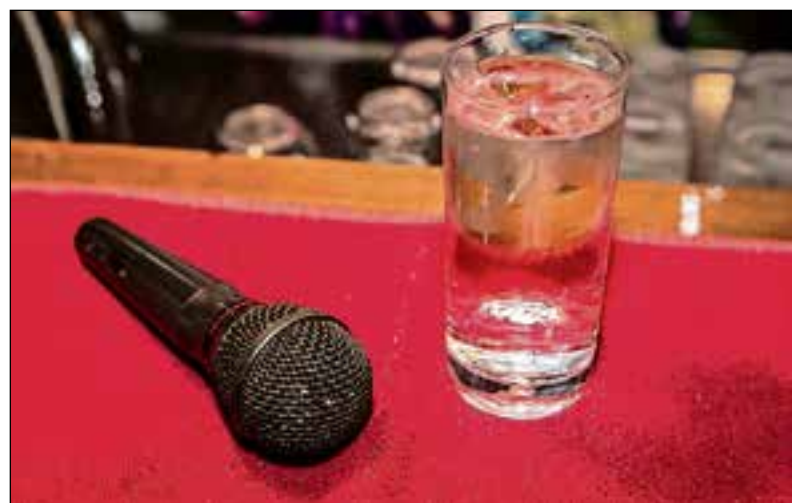
■ Jarenlang zong Tijdink in de band de Barking Bees.