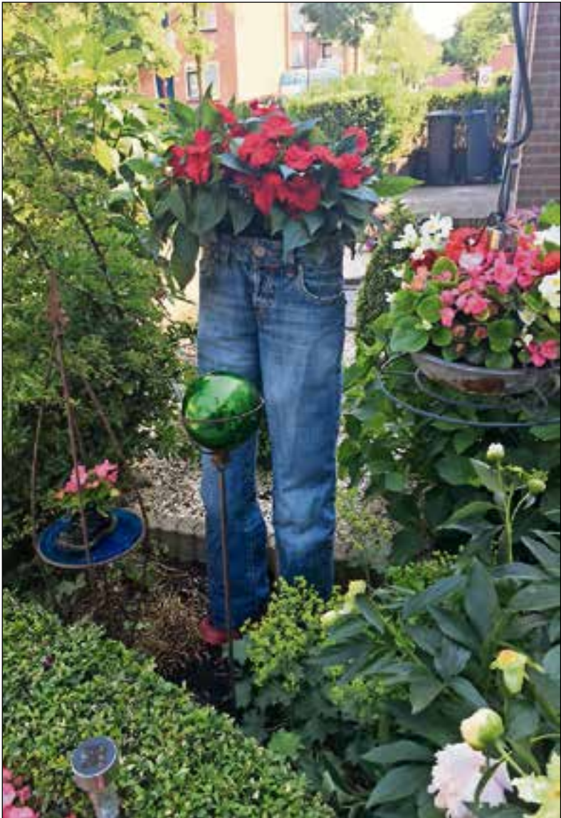
■ Recyclen kan ook zo!