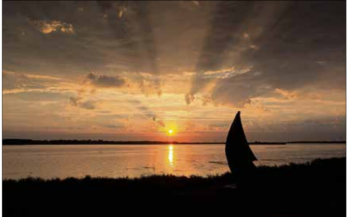
■ Zonsondergang bij het Gooimeer.