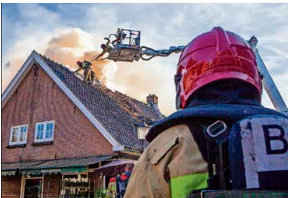
■ De brandweer probeert zoveel mogelijk te redden.