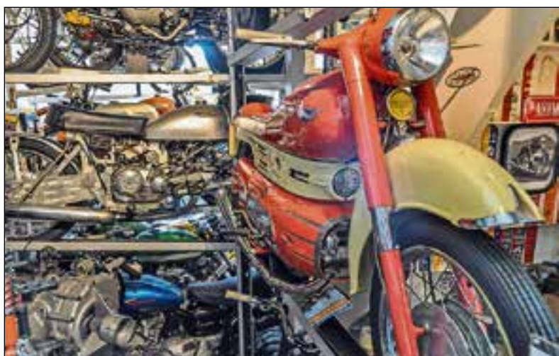
■ De huiskamer vol met motorfietsen.

Al snel groeide de club tot meer dan vierhonderd leden. Allemaal liefhebbers van klassieke motoren. Ze hebben niet allemaal Aermacchi’s, maar ook andere veelal Italiaanse merken. Zelf sleutelen, motoren opknappen en er vooral veel mee rijden. Daar gaat het om. “We organiseren het gehele jaar door veel trips in binnen- en buitenland. Twee keer per jaar gaan we met zo’n zestig clubleden met een touringcar naar Reggio en Imola in Italië. Op die beurzen vinden we allemaal wel iets van onze gading: motoren, onderdelen en allerlei andere zaken. Met een vrachtwagen wordt alles naar Nederland gebracht.”