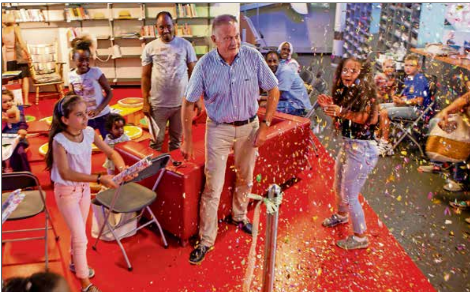
■ Het confettikanon maakt de burgemeester wel even aan het schrikken.