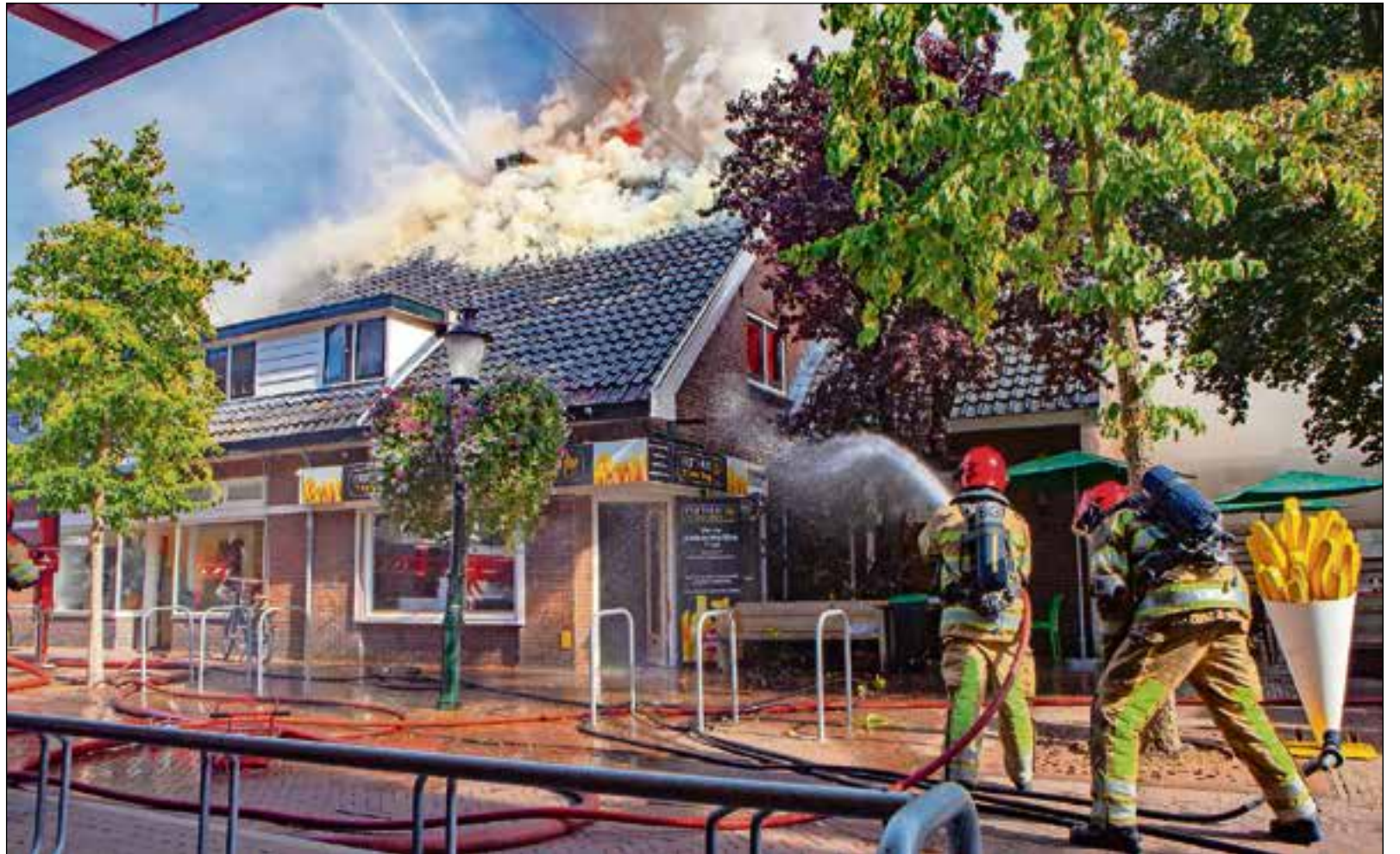
De brand aan de Kerkstraat was al gauw uitslaand.

Wat zeiden die mensen die onder het lint liepen dan? De politie noemt enkele voorbeelden: "Maar mijn fiets staat daar." "Weet u wel hoe ver het omlopen is?" "Ik zag iemand anders ook doorlopen." "Ik loop jullie heus niet in de weg." "Ik vind het allemaal een beetje overdreven." "Alleen even een fotootje maken voor thuis en dan ben ik weer weg." "Maar ik heb tot voor kort zelf ook bij de brandweer gewerkt." "Ik heb haast en dacht: het kan wel even." "Wie heeft er last van als ik hier sta?" De allermooiste: "Lint? Welk lint? Ik heb geen lint gezien!" Wat dacht u van het lint dat wij u zojuist omhoog zagen tillen mevrouw?