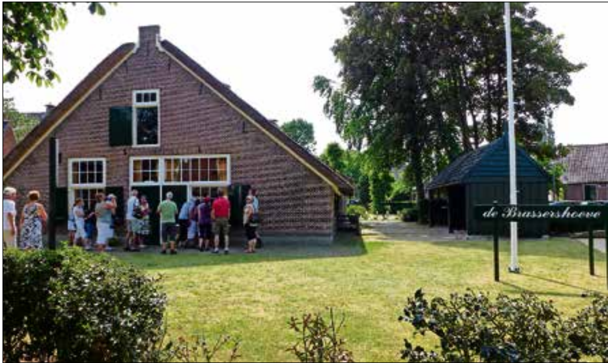
Zaterdag kan er weer gewandeld worden door het Oude Dorp van Huizen.