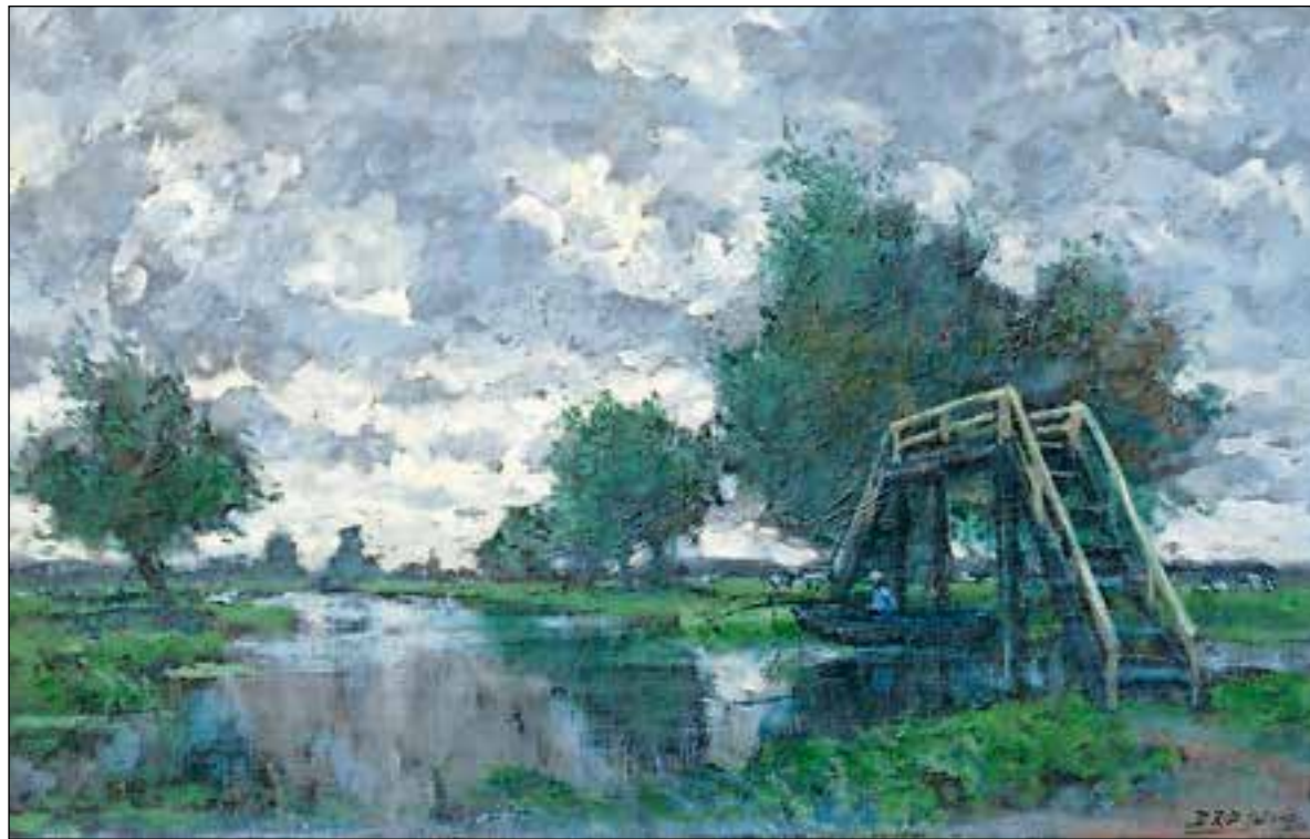
E.R.D. Schaap schilderde 'Brug over de Vaart langs de Herenweg te Ankeveen'. STICHTING KUNSTBEZIT 'S-GRAVELAND.

In de veenontginningen werd hier en daar ook laagveen uitgebaggerd omdat er behoefte bleef aan brandstof. De veenbagger werd gedroogd op legakkers langs de veensloten.