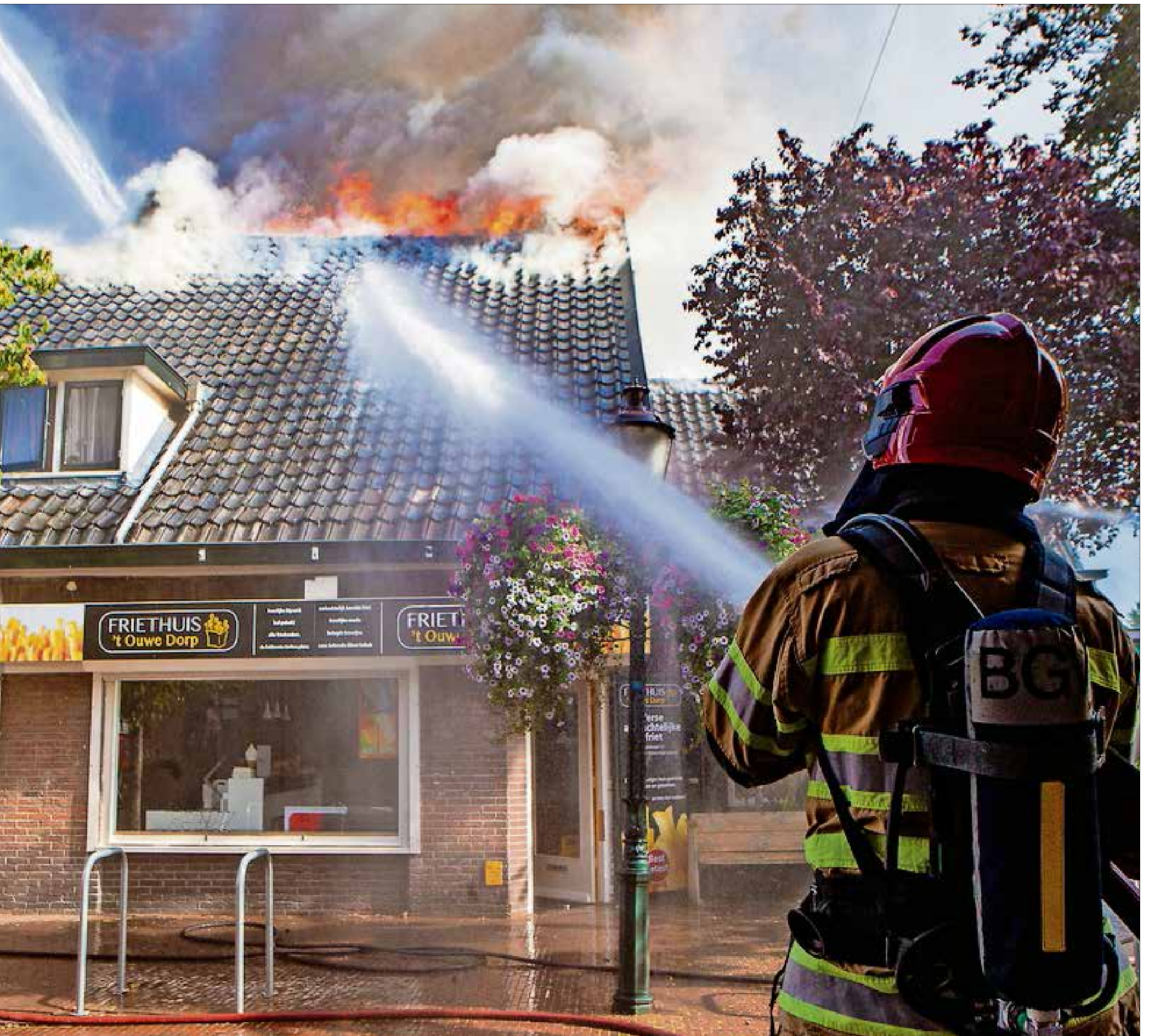
■ De vlammen sloegen al heel snel uit het dak, nadat de brand gemeld was.