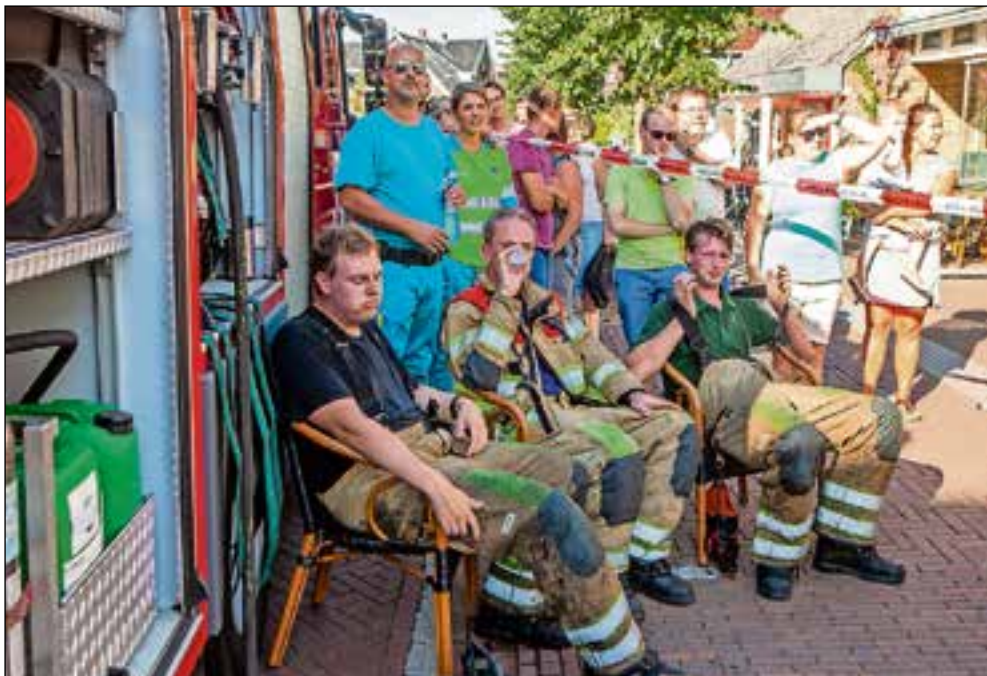
Met het warme weer was het afzien voor de brandweermensen.