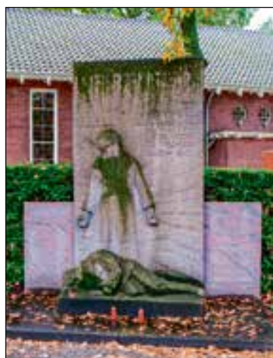
■ Voorheen stonden de namen naast het monument.

Met het herdenkingsmonument worden de oorlogsslachtoffers uit Huizen herdacht. Het gaat om burgers en militairen die in het Koninkrijk der Nederlanden of waar ook ter wereld zijn omgekomen of vermoord sinds het uitbreken van de Tweede Wereldoorlog in oorlogssituaties en bij vredesope-