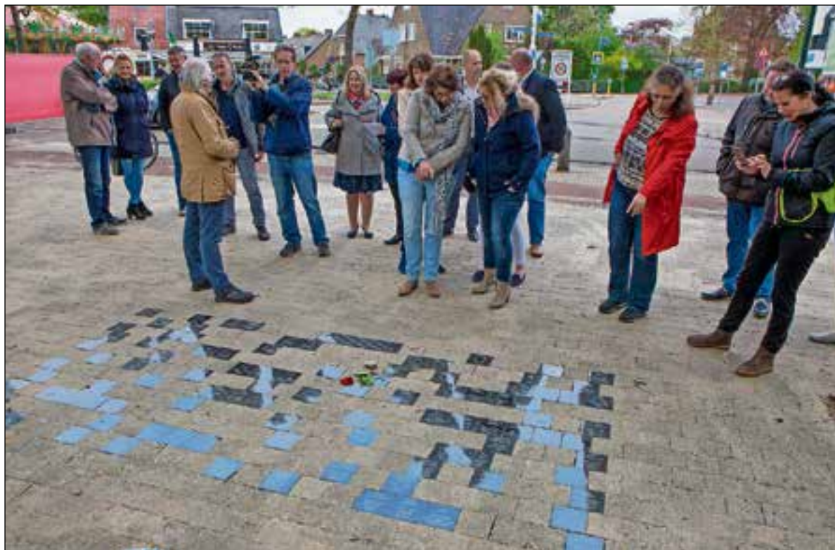
■ Elk slachtoffer heeft nu een eigen herdenkingstegel die voor het monument ligt.