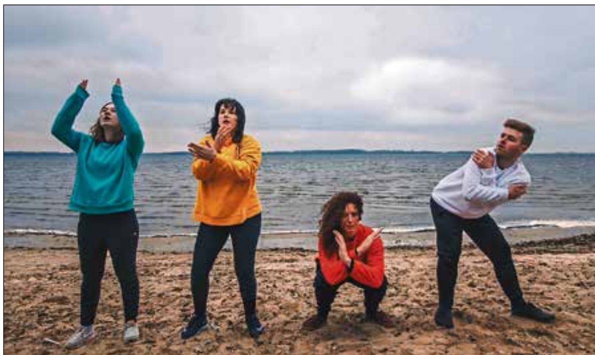
'Dat, Dus' - Locatietheaterpresentatie bij de Surfclub in Huizen op donderdag 3 mei.