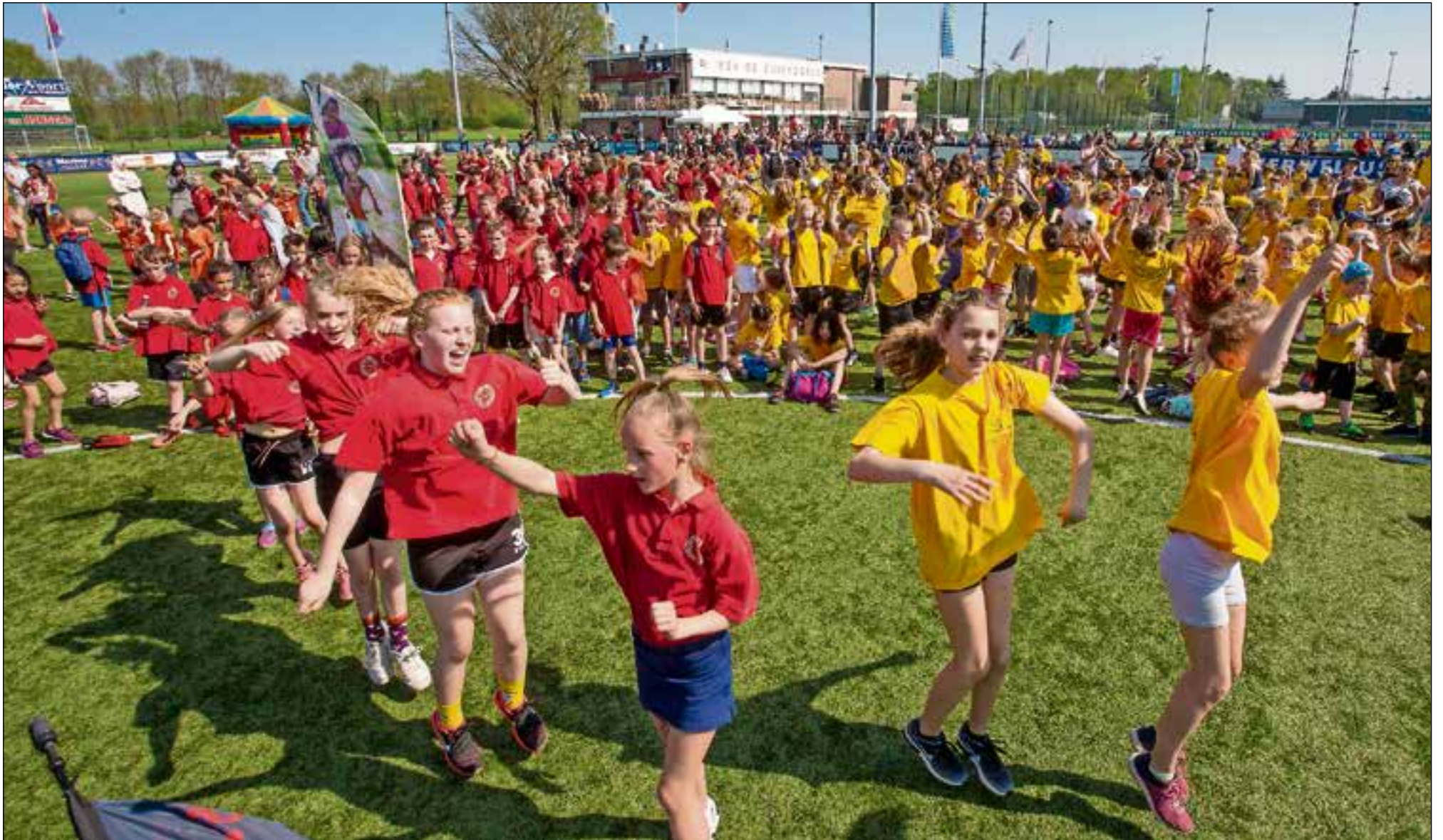
De Koningspelen eindigden met een gezamenlijke dans.