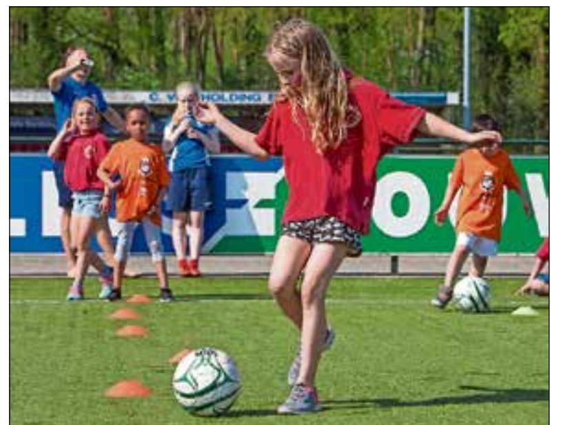
Er werd ook volop gevoetbald.