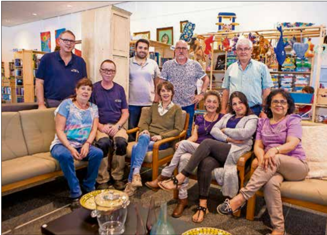
■ Enkele toppers van het KringloopCentrum.