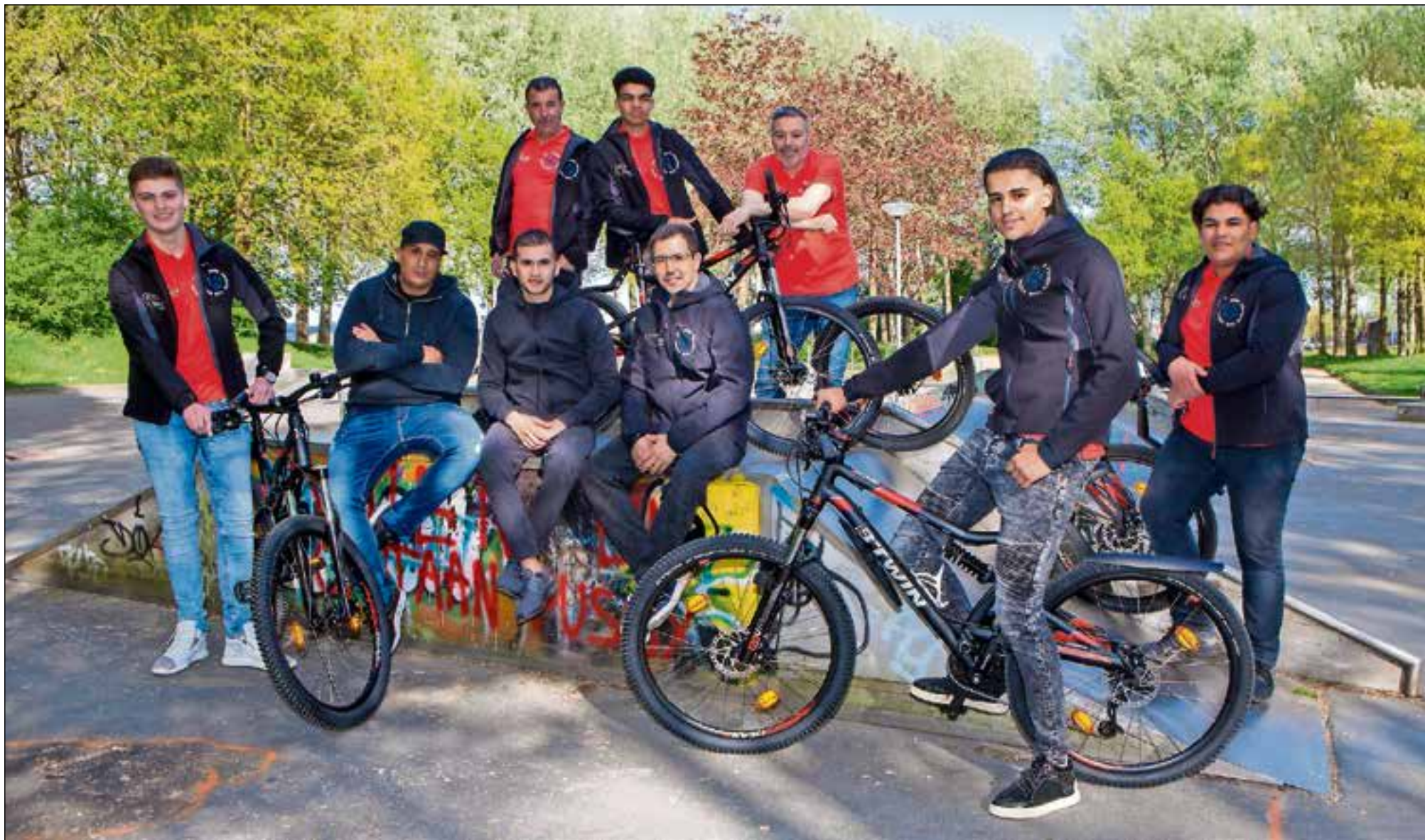
De leden van het Jeugd Preventie Team zijn een mix van jongeren uit Huizen die zich op een positieve wijze hebben ontwikkeld.