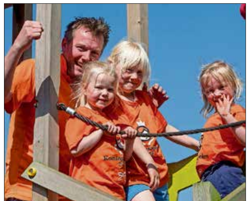
Veel kinderen waren gekleed in het oranje.

De Koningspelen hebben het doel te laten zien dat samen goed ontbijten en actief bewegen belangrijk, maar vooral ook heel leuk is. De Koningsportdag wil duidelijk maken dat elk kind elke dag minimaal één uur actief moet bewegen om gezond te blijven. De Koningspelen zijn een idee en initiatief van Richard Krajicek als lid van het toenmalige Nationaal Comité Inhuldiging voor de feestelijkheden rondom de inhuldiging van Koning Willem Alexander op 30 april 2013. Sindsdien is dit jaarlijks terugkerende evenement altijd op de laatste vrijdag voor Koningsdag. Dat laatste is volgend jaar weer niet het geval. Dan zijn de Koningspelen al op 12 april, een week later is het Goede Vrijdag.