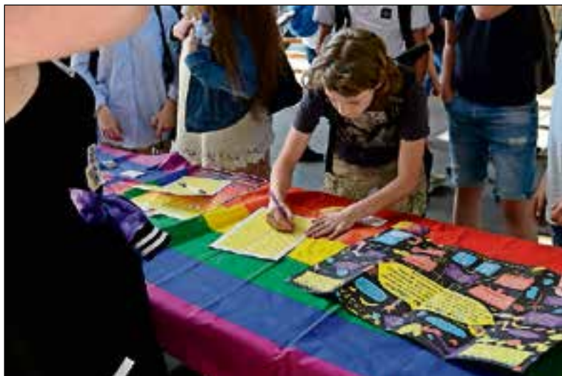
■ Een leerling tekent de petitie tegen pesten.

zelf mag zijn en iedereen ook weet dat het voor de ander belangrijk is om zichzelf te mogen zijn.