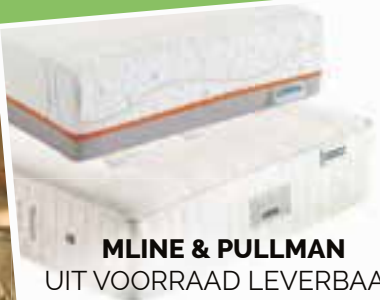
MLINE & PULLMAN UIT VOORRAAD LEVERBAAR