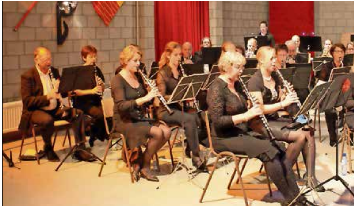
■ Het concert is een goede kennismaking met de veelzijdigheid van blaasinstrumenten.