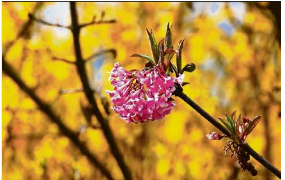
■ Prachtige kleuren in de borders langs het Enkhuizerzand.