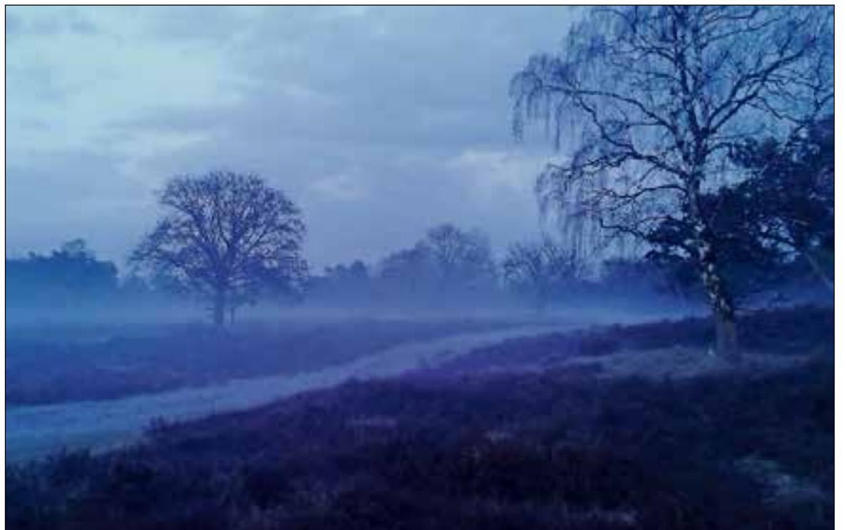
■ Verstilde avond op de Limitische Heide.