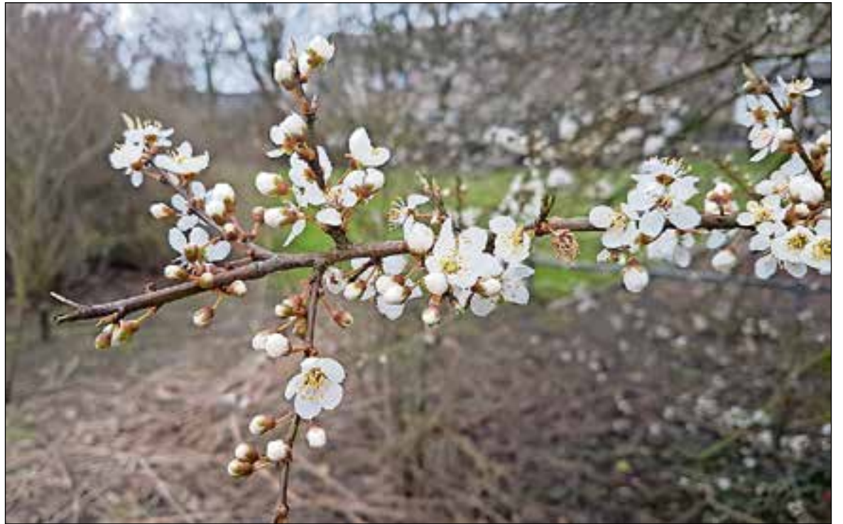
■ Sleedoorn in bloei.