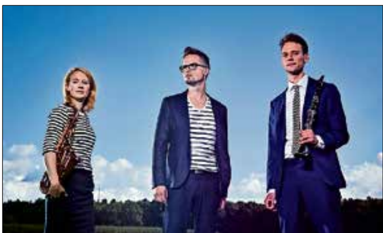
Het Rodion Trio.

Het concert is gratis; kaarten kunnen worden afgehaald bij de receptie van het woon-zorgcentrum aan de Graaf Wichman 5.