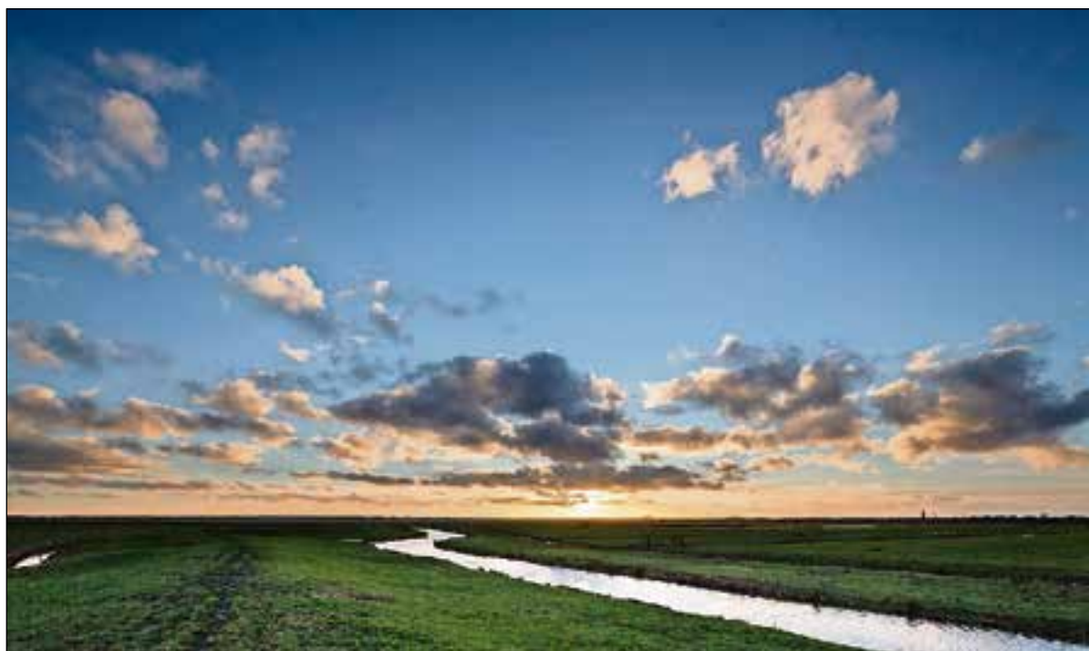
■ Zondag 8 april is er een avontuurlijke vogelwandeling in de Eempolder.