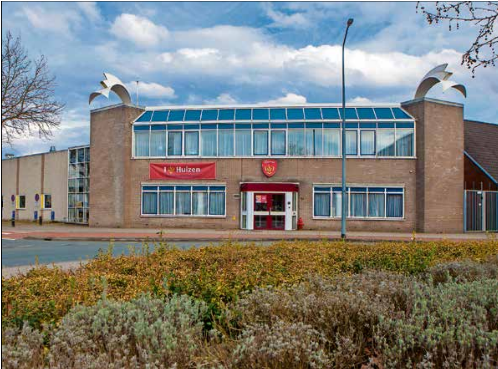
De brandweerkazerne in Huizen herbergt straks een tankautospuiter minder, maar krijgt wellicht een snel interventievoertuig terug.