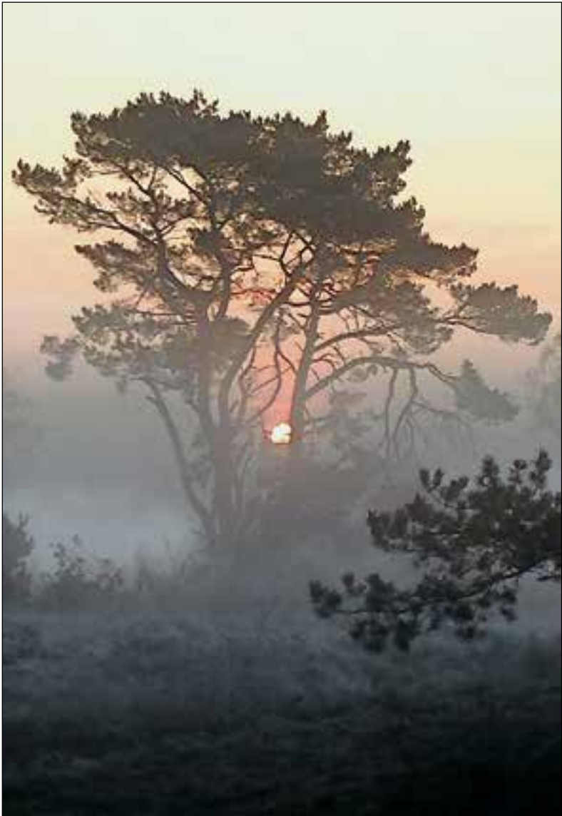
■ Zonsopkomst op de Limitische Heide.