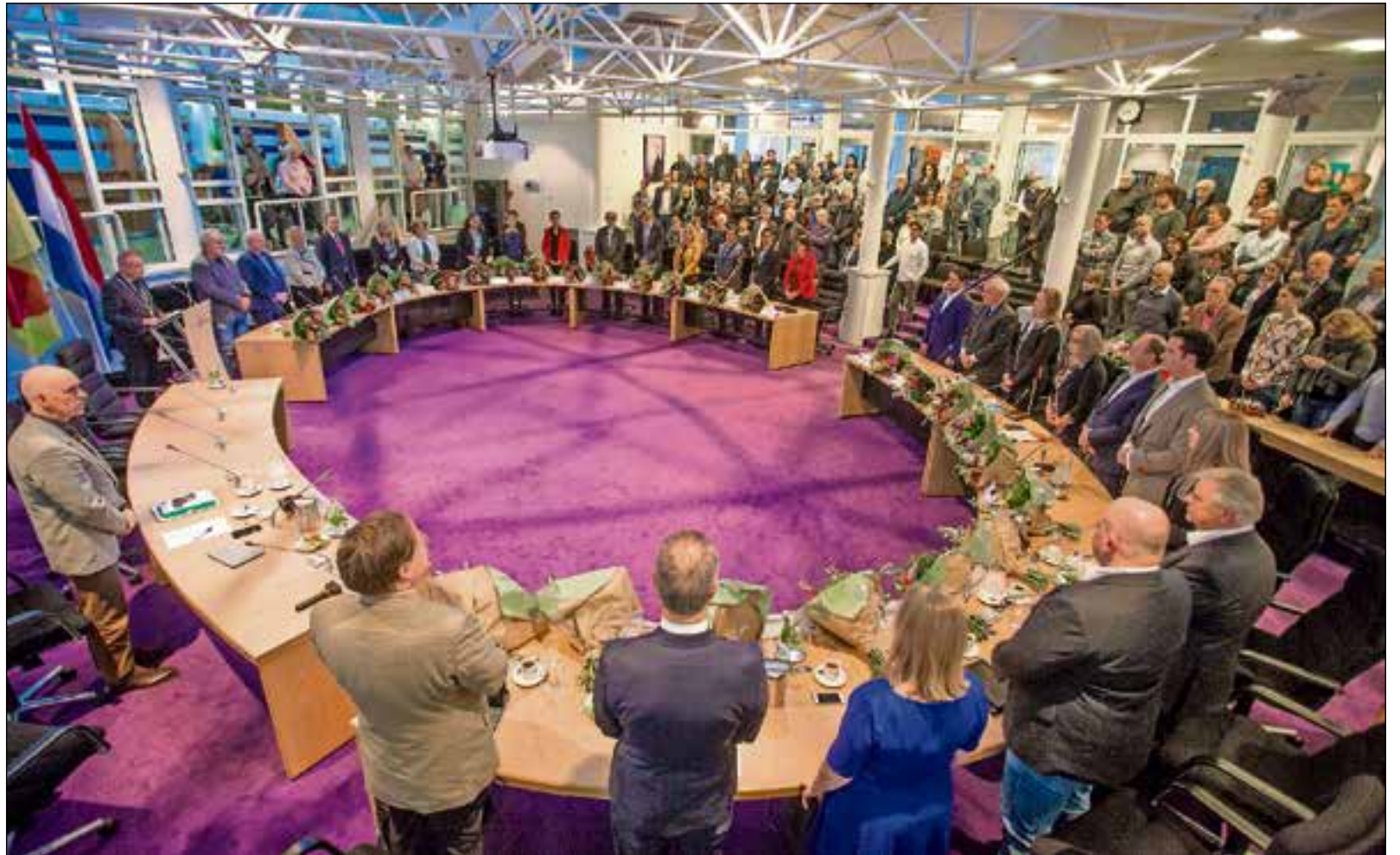
De nieuwe raadsleden leggen de eed of belofte af.

Daarnaast brengen alle horecabedrijven hun private camera-toezicht op orde, net zoals de gemeente dat heeft gedaan. "Ook worden er nog stappen gezet om de verlichting te verbeteren. Deze afspraken zijn vandaag ondertekend door alle betrokken ondernemers."