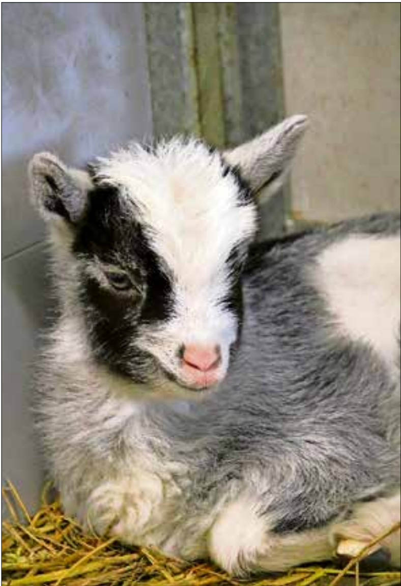
■ Een klein nieuwsgierig geitje bij de kinderboerderij.