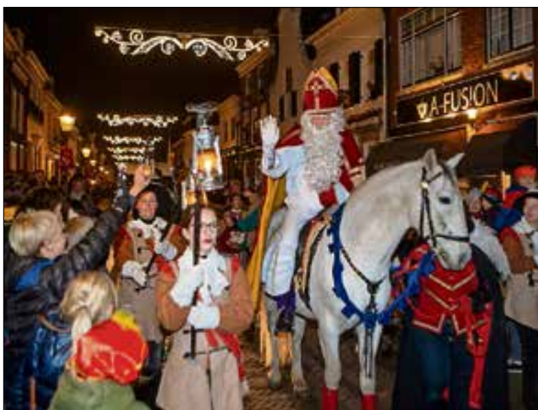
De rondrit door de Vesting.