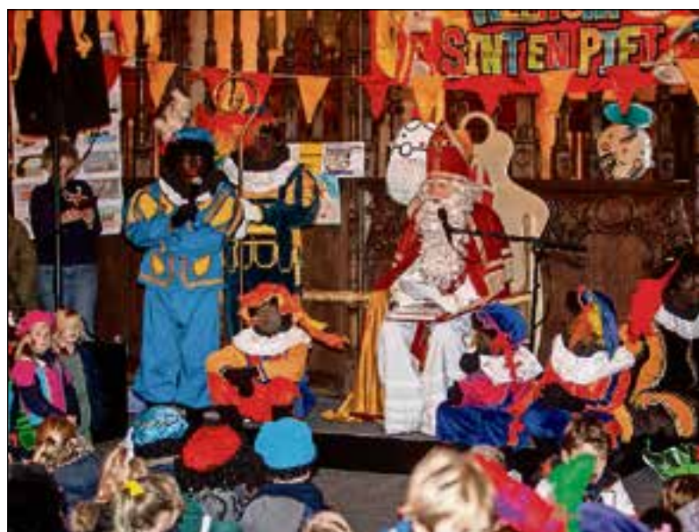
Sinterklaas is gesprek met de kinderen.