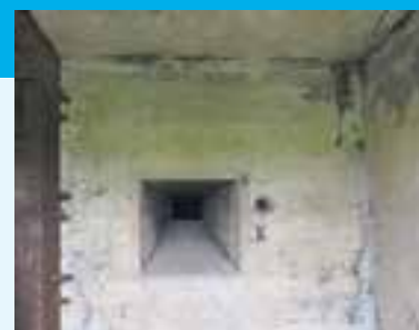
Gewerschietgat bij de ingang van een groepsschuilplaats

door een gewerschietgat (zie foto). De stalen deuren zijn echter zelden of nooit geplaatst en de ingangen zijn later vaak dichtgemaakt met baksteen en vervolgens gepleisterd. De schuilplaats moest met zijn 2.15 meter dikke dak bescherming bieden aan 10 tot 12 man. De haken op het dak dienden voor het aanbrengen van camouflagemiddelen, zoals netten of een gronddekking van gras-