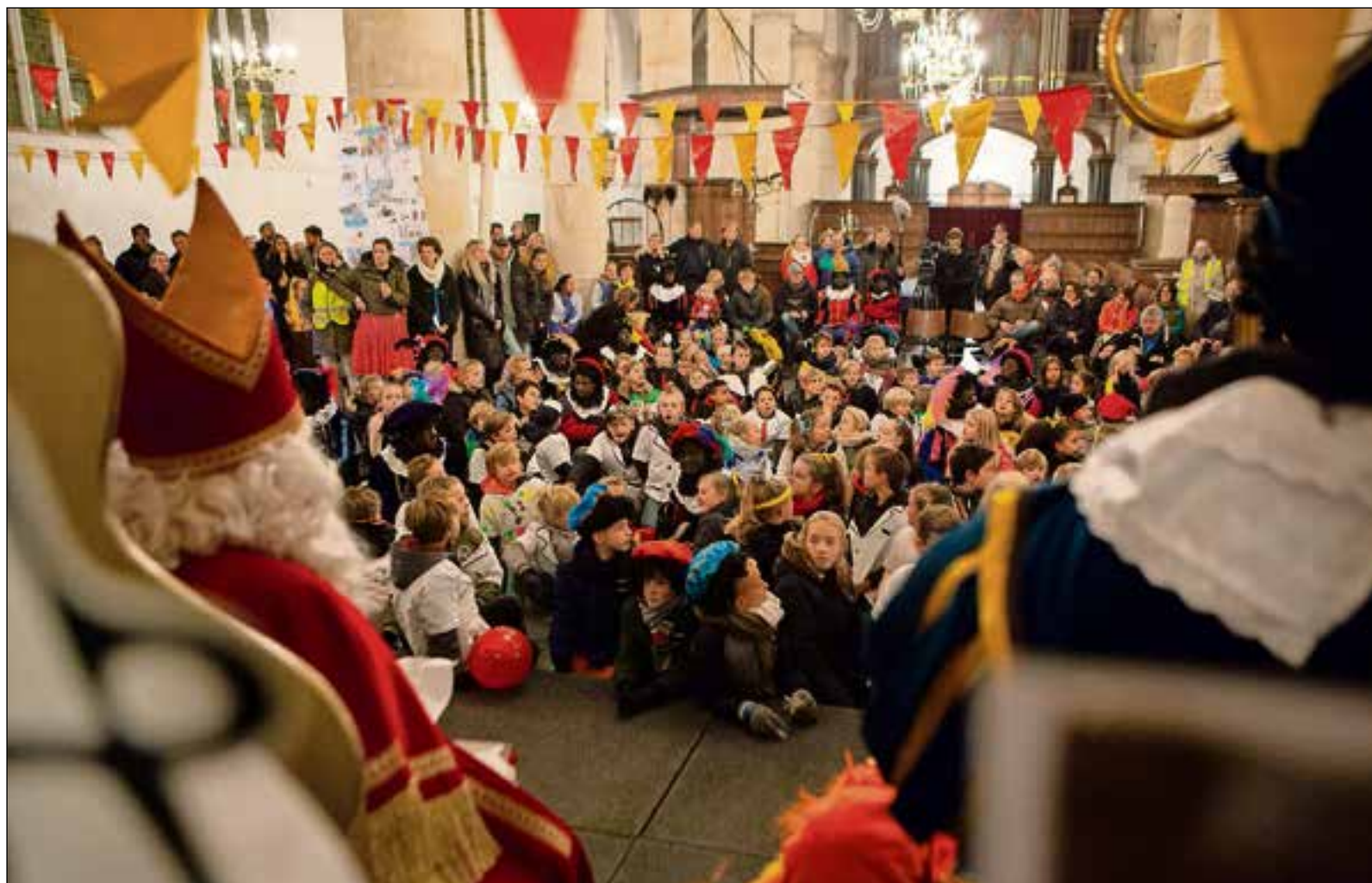
Het sinterklaasfeest ging verder in de Grote Kerk.

De muziekpieten, de kleine pony, de dansende pieten met kerstlichtjes in de kleding en handschoenen, de vaandeldrager van Nardinc, de swingende brandweerpiet, de meisjespiet die high fives uitdeelde en honderden kinderen die op z'n hardst 'Pepernoten' riepen. De kinderen wisten bijna niet waar ze moesten kijken, zo veel gebeurde er om hen heen. En tussen al die vriendelijke vrienden uit Spanje reden ook de prachtig versierde karren van de basisscholen uit Naarden. Ze hadden er duidelijk allemaal weer veel werk aan gehad om een mooie wagen en bijpassende kleding te maken. Dit jaar hadden de wagens het thema 'Muziek'. Zo waren er karren met reggae-muziek, hiphoppers en disco. Nadat de hele route door de Vesting was voltooid, ging het feestje voor de liefhebbers nog door in de Grote Kerk.