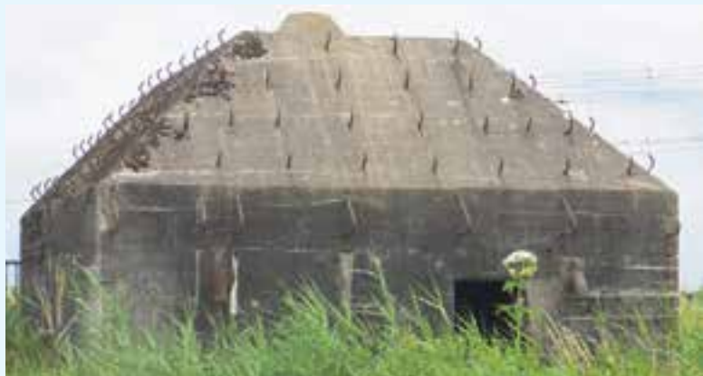
Groepsschuilplaats bij Naardermeer