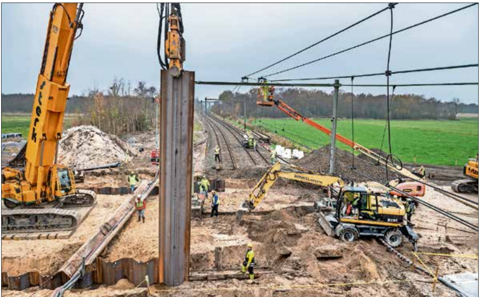
■ De aanleg van de Voormeerpas is een hele klus.

Er werd ook alvast gewerkt aan de rest van het spoor, vooral door Bussum. Dat gaat komend jaar fors op de schop: er worden sporen en wissels weggehaald, waardoor de overwegen smaller kunnen worden. Afgelopen weekend werd er alvast voorbereidend werk gedaan.