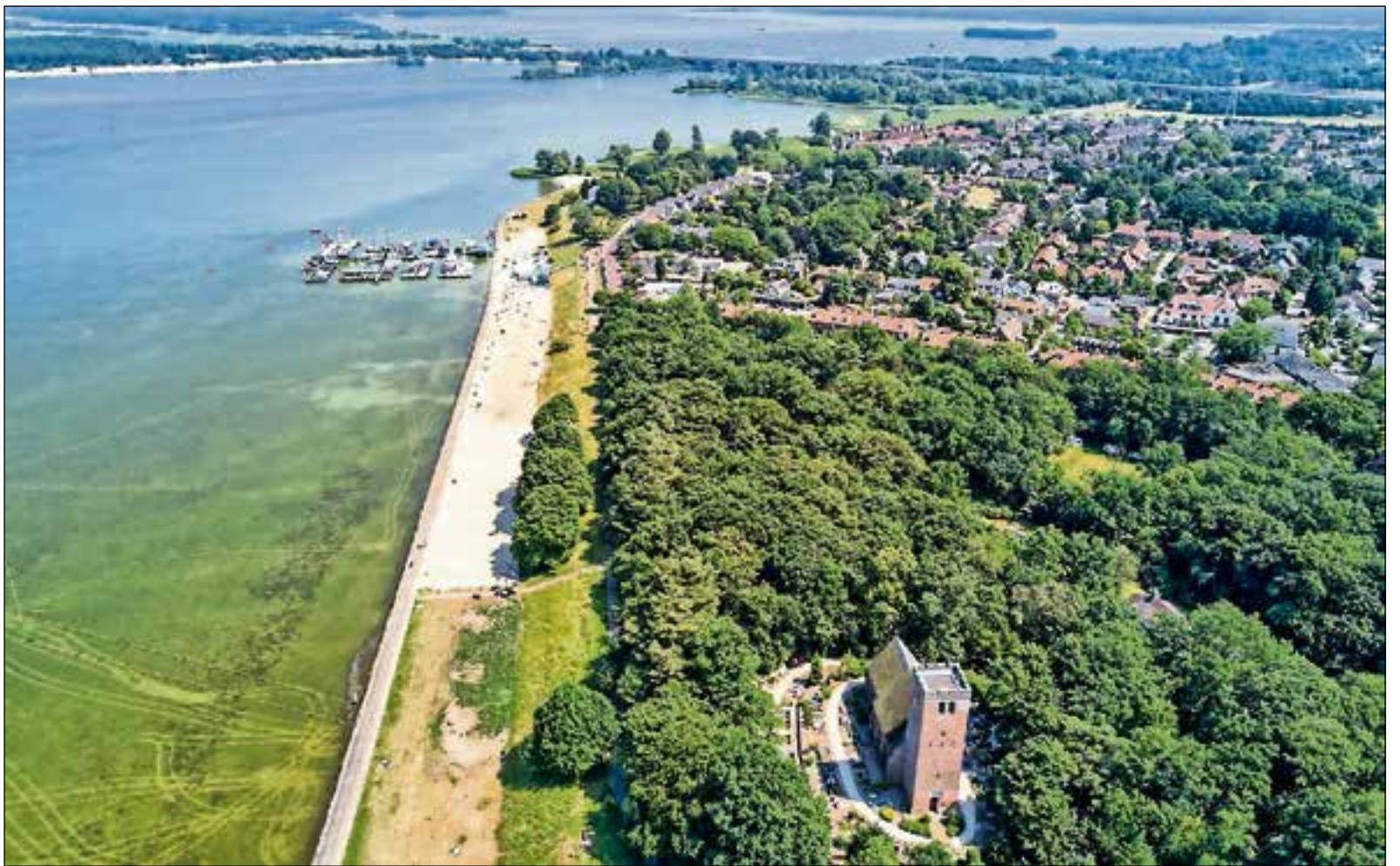
■ Geen huisjes langs het strand, is de boodschap.

Naast het ontbreken van draagvlak zijn er voor het college nog twee belangrijke redenen om de plannen