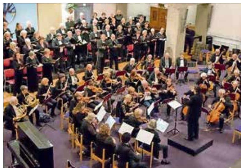
■ Toonkunst Bussum geeft concert in Wilhelminakerk.

Het concert begint om 15.00 uur. Een kaartje kost 17,50 euro, inclusief programmaboekje en consumptie in de pauze. Kinderen tot twaalf jaar kunnen gratis mee en voor jongeren van twaalf tot achttien kost een kaartje 5 euro. Kaarten te bestellen via info@toonkunstbussum.nl of bel met Wil Senden: 035-623 53 09.