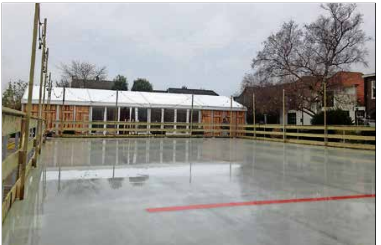
■ Zaterdag gaat de baan open.

Of er nu een jaarlijkse traditie is geboren, kan de woordvoerder niet zeggen. Wel dat de gemeente enthousiast is. Mocht er een volgend jaar weer een ijsbaan komen dan zal die in ieder geval op een an-