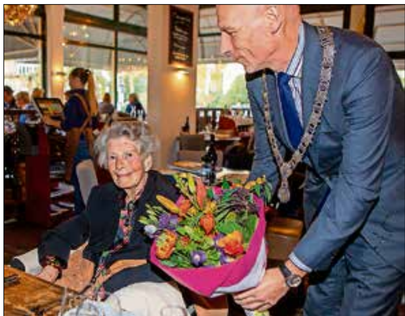
Bloemen van de locoburgemeester.