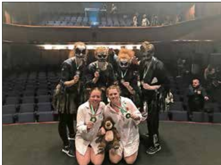
■ Geen middenmoot, maar medailles.

Wie eens kennis wil maken met ropeskippen kan hiervoor terecht bij Keizer Otto.