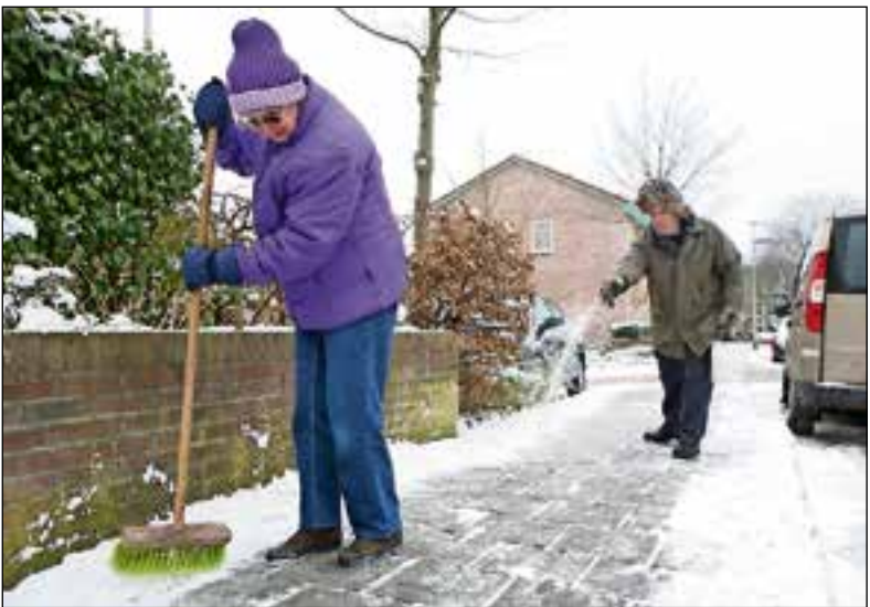
De stoep ijs- en sneeuwvrij houden is een kleine moeite.

Als het straks glad wordt op de weg kun je ook zelf een handje helpen om de straten en stoepen begaanbaar te houden. De gemeente roept bewoners op om zelf hun