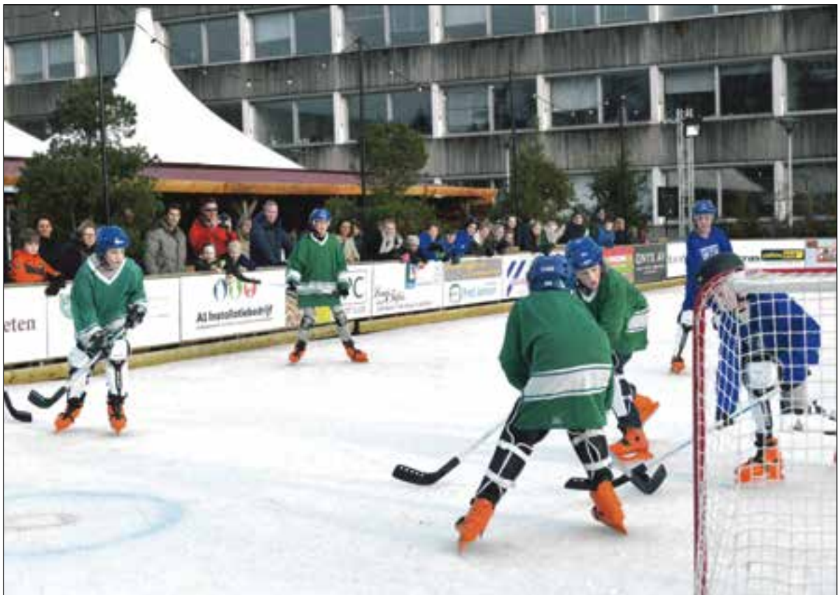
■ Inschrijven voor ijshockey bij Bussum op IJs.