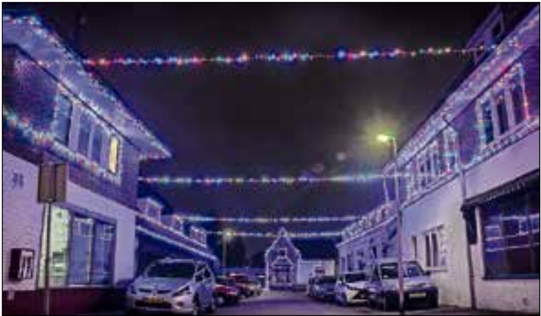
De burendie maakten een kunstwerk van lampjes.