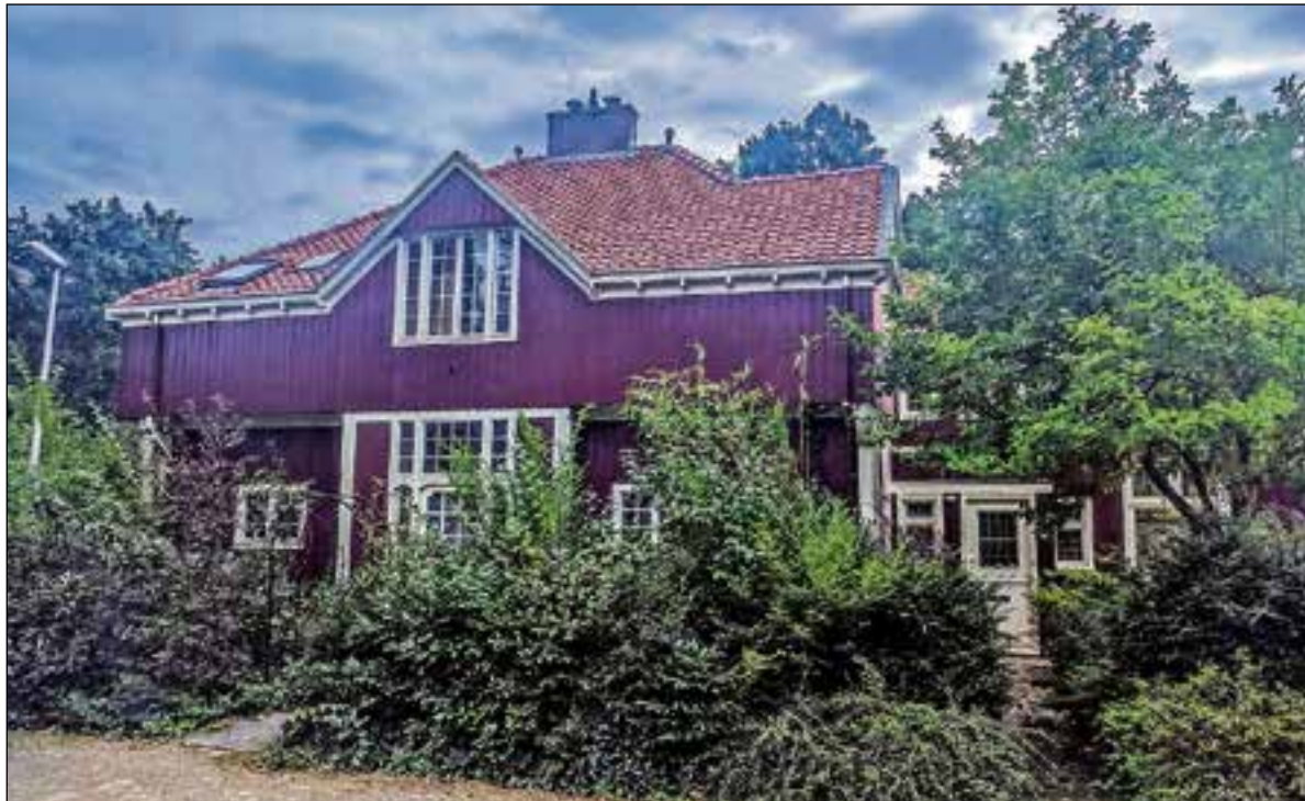
Het oude herstellingsoord aan de J.J.H. Verhulstlaan.

De spoedmonumenten aanvragen worden overigens nog wel behandeld. Heemschut en het Cuypersgenootschap verwachten wel dat,