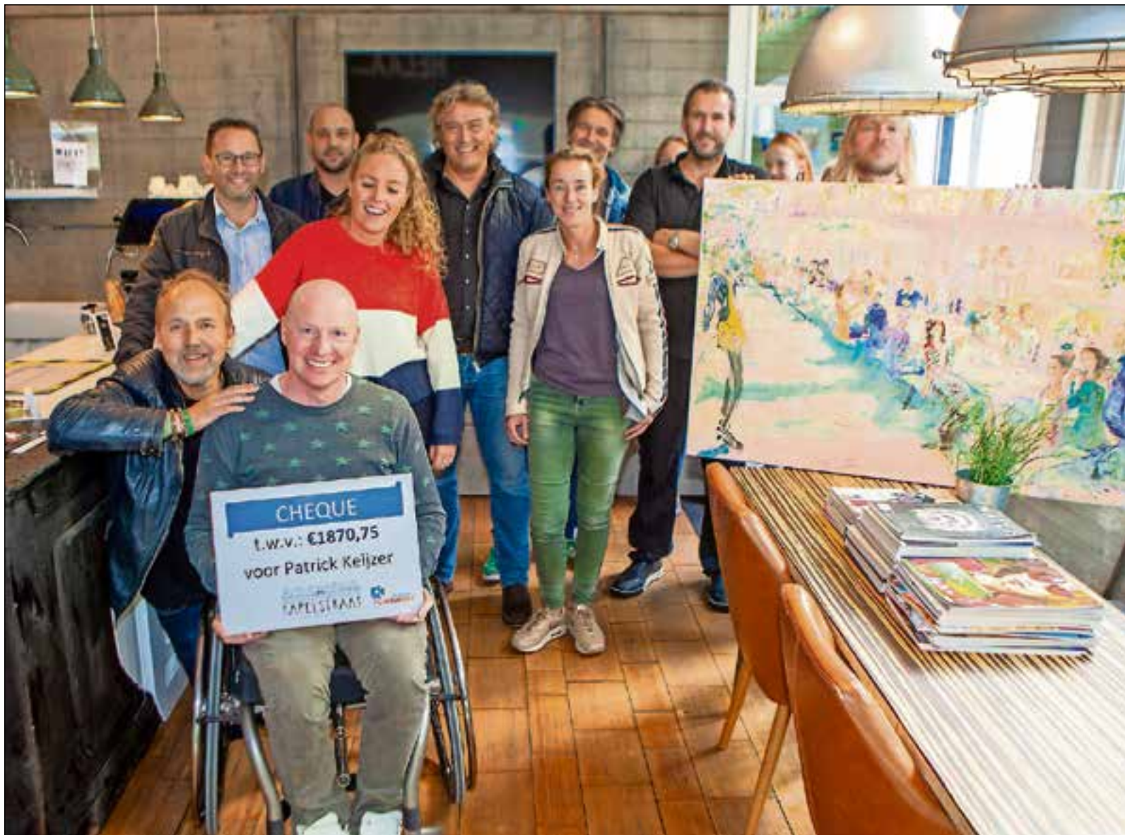
■ Het merendeel van de ondernemers en de kunstenaar met zijn schilderij dat werd geveild.