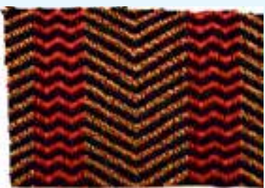
Koehaartapijt (coll. Openluchtmuseum Arnhem)

I.J. Brugmans. De arbeidende klasse in de 19e eeuw 1813-1879 *) ingekort citaat J.C. Vleggeert. Kinderarbeid in de negentiende eeuw