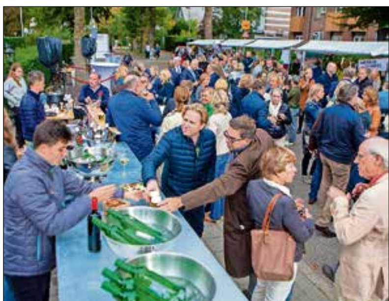
De Meerweg stond vol met stands.

In wijkcentrum Uit-wijk aan de Dr. Schaepmanlaan is op donderdag 4 oktober van 19.30 tot 21.00 uur een bijeenkomst over de activiteiten en het maatjesproject.