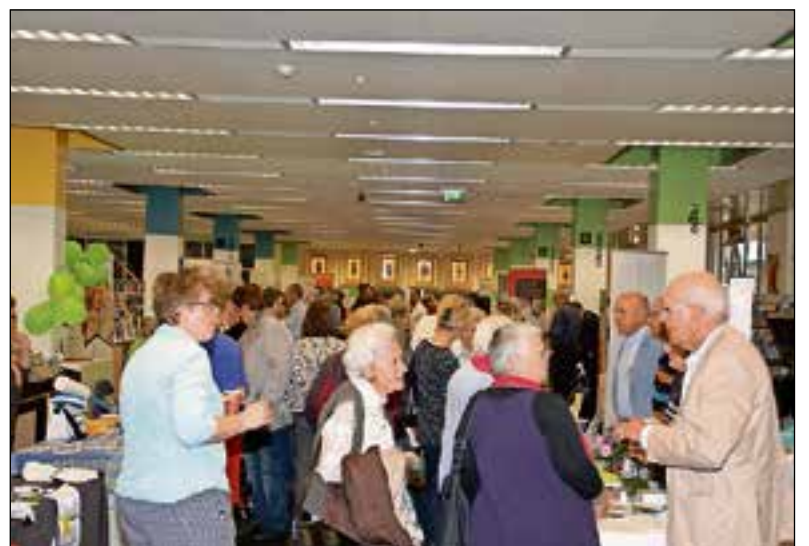
Een eerdere editie in 2016 was een groot succes.

De seniorenmarkt is gratis. De organisatie is in handen van Bibliotheek Gooi en meer, Seniorenraad Gooise Meren, Sportcentrum de Zandzee, Thuiszorgwinkel FullMobility en Versa Welzijn. De markt wordt mede mogelijk gemaakt door de gemeente Gooise Meren. Meer informatie op seniorenraad-gooisemeren.nl .