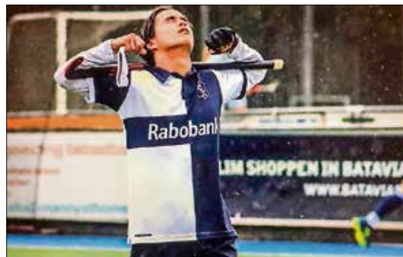
Gooische domineerde, maar kon niet winnen.

De Bussumse vrouwen zochten voor de rust lang naar hun eigen spel. Leonidas kwam al na een minuut op voorsprong. Gooische mocht vervolgens de keeper bedanken dat het daarbij bleef. Leonidas kreeg een paar goede kansen om de voorsprong te vergroten. Een kwartier voor tijd scoorde Gooische de gelijkma-ker.