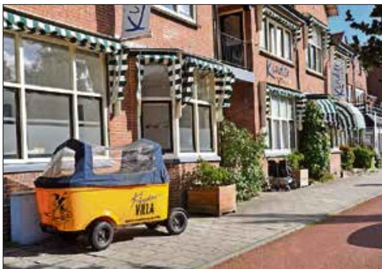
Voorlopig blijft de stint geparkeerd staan.

Kinderopvang Smallsteps in Naarden heeft twee stints. Deze worden per direct niet meer gebruikt. "Omdat de oorzaak van het onge-