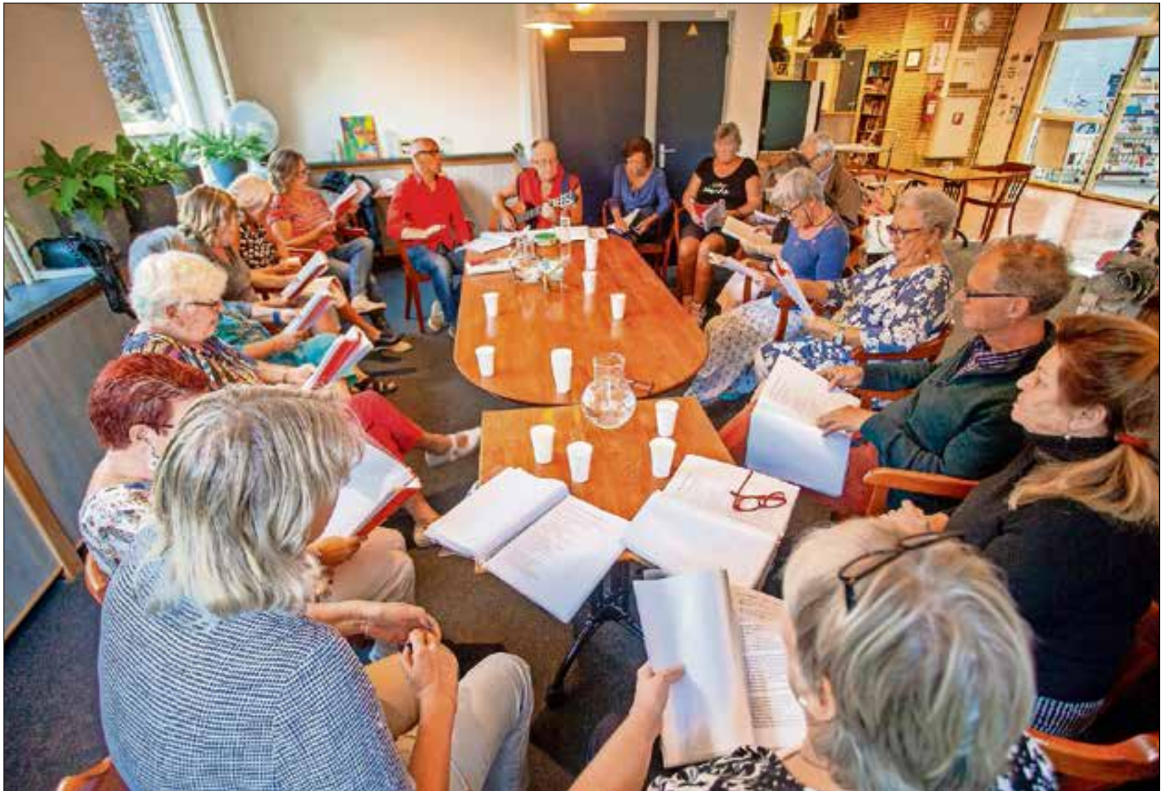
■ Het buurtkoor zingt vooral liedjes van vroeger.