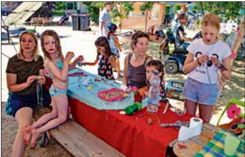
In de schaduw van de grote tent.