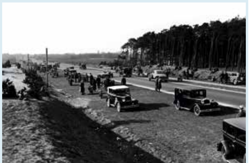
Rijksweg 1 bij de Larense heide (1933)

Door de toename van het autoverkeer in de vijftiger en zestiger jaren van de vorige eeuw ontstonden problemen met het bermpar-