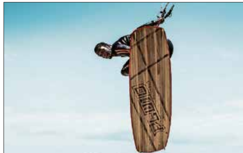
■ Kiteboard naar eigen ontwerp.

In 2008, toen hij 20 was, begon hij zijn eigen boardmerk. Een jaar later voegde hij daar zijn eigen kiteschool aan toe. “Ik zag kansen en heb die gegrepen. Ik heb nu een heel eigen, internationaal merk, Fluid Kiteboarding.” Hij traint ook veel in het buitenland. Daar test hij onder andere de nieuwste boards die hij lanceert. Zijn kites zijn verkrijgbaar in Kaapstad, Australië, noem maar op. “Laatst zag ik mijn kites ook bij wedstrijden in Nederland en Griekenland. Mijn gear is dus echt goed genoeg voor de beste kites van de wereld. Probleem is vaak dat kitesurfers erg merkvast zijn. Maar wie eenmaal overstapt, wil niet meer anders”, lacht hij. Deelname aan wedstrijden is niet iets waar de Bussumer warm voor draait. Hij houdt het liever bij zichzelf. Hij vindt het misschien wel