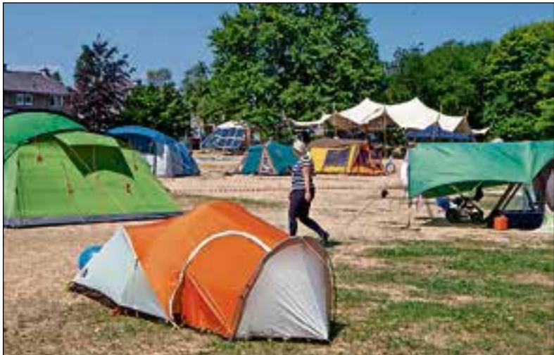
Tenten in alle soorten en maten.