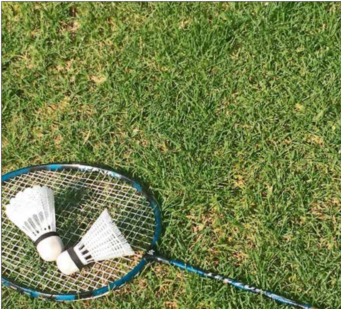
■ Bussumers zijn dol op sport.

Echter, sinds onze verhuizing naar Bussum lijkt het probleem zichzelf op te lossen. Om lid te kunnen worden van (de meest populaire) hockey- of voetbalclubs van Bussum moet je aan meer voorwaarden voldoen dan voor een reis door Noord-Korea. Een parttimebaan als vrijwilliger, 'vrinden' die je naar binnen kunnen loodsen zijn een must,