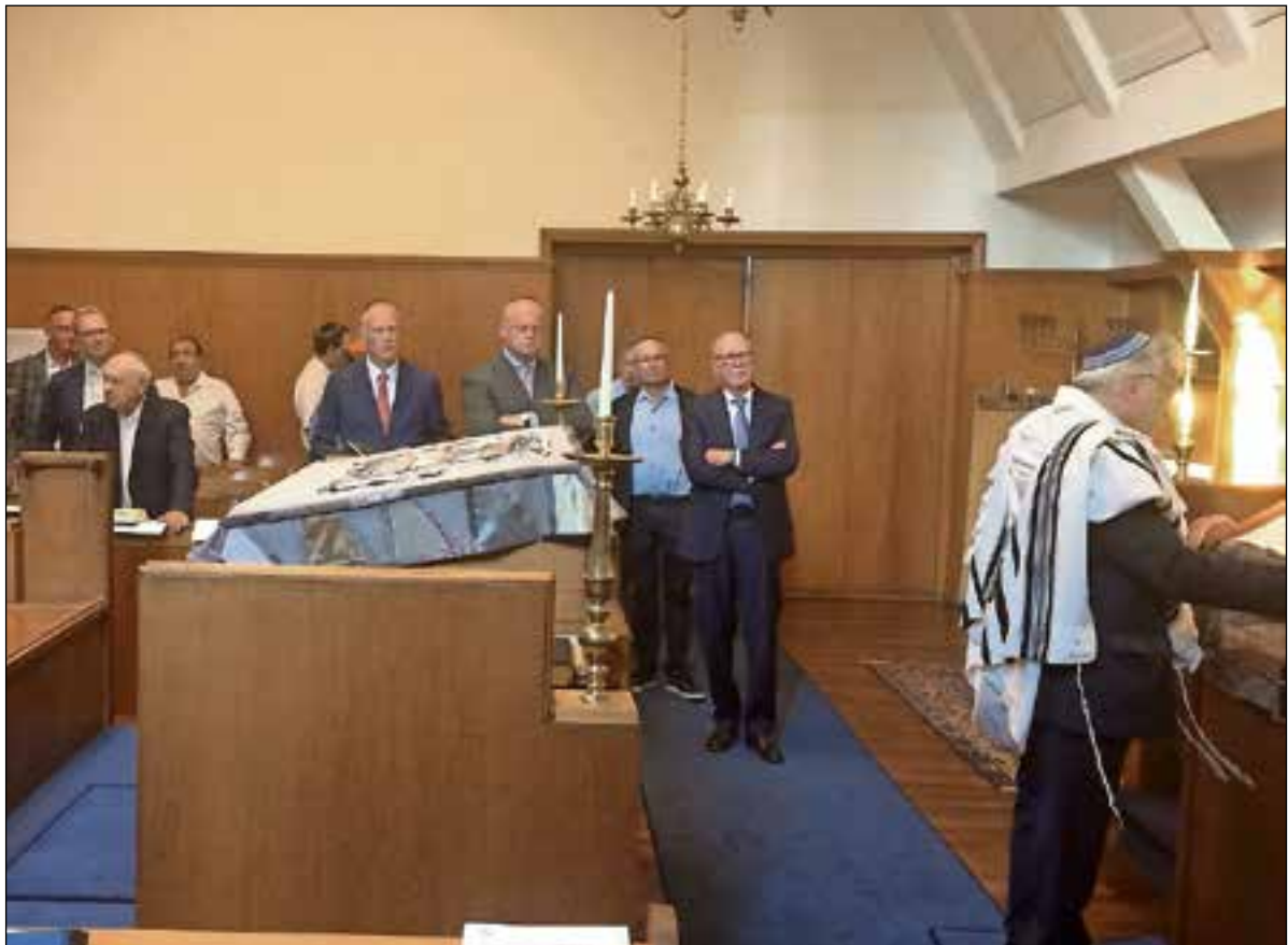
■ Minister Grapperhaus (2e van rechts) toonde grote interesse.