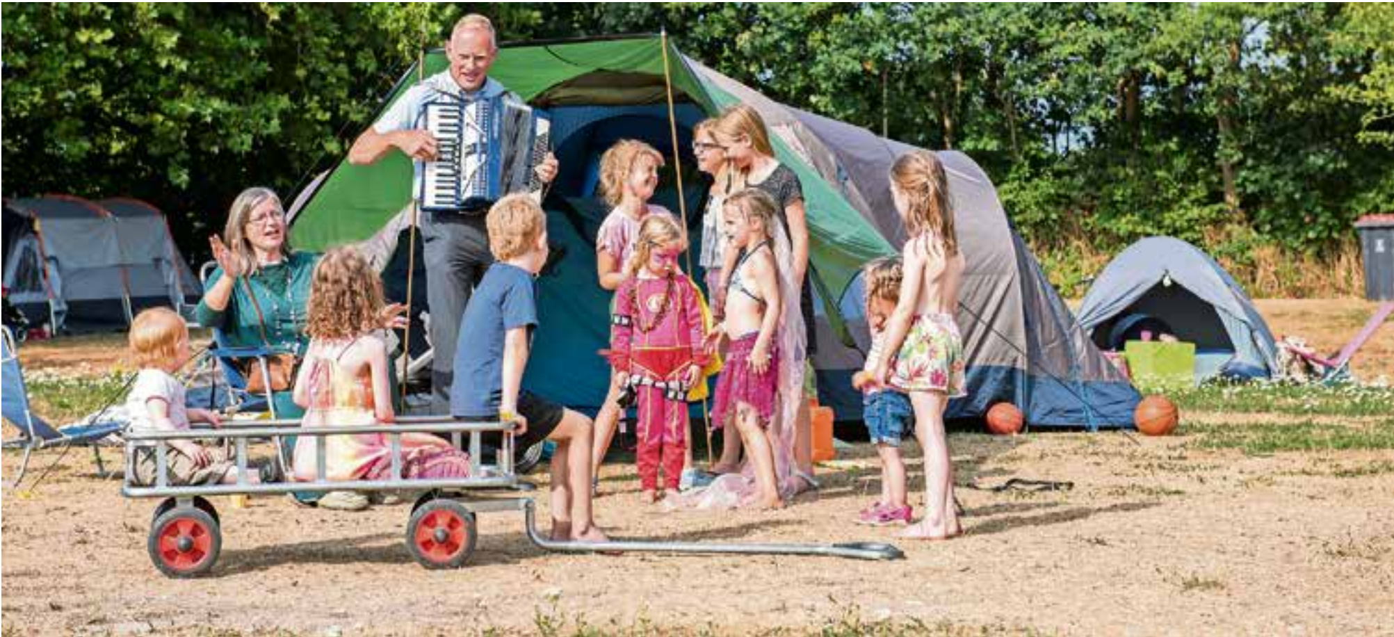
De burgemeester speelde een deuntje.