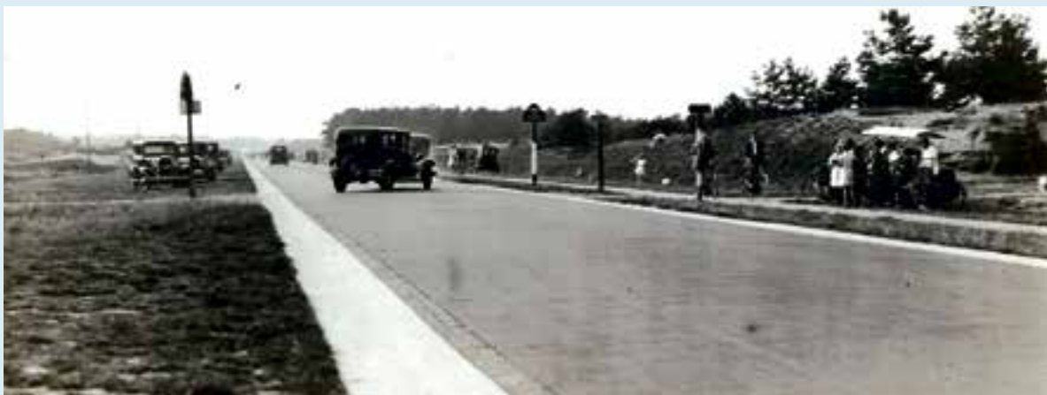
Rijksweg 1 bij De Witte Bergen (datum onbekend)