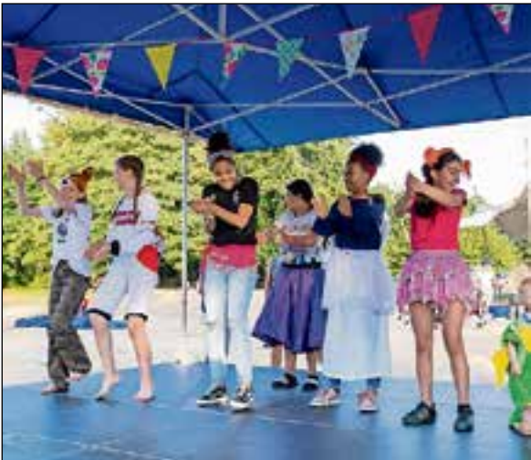
Optredens door de kinderen.