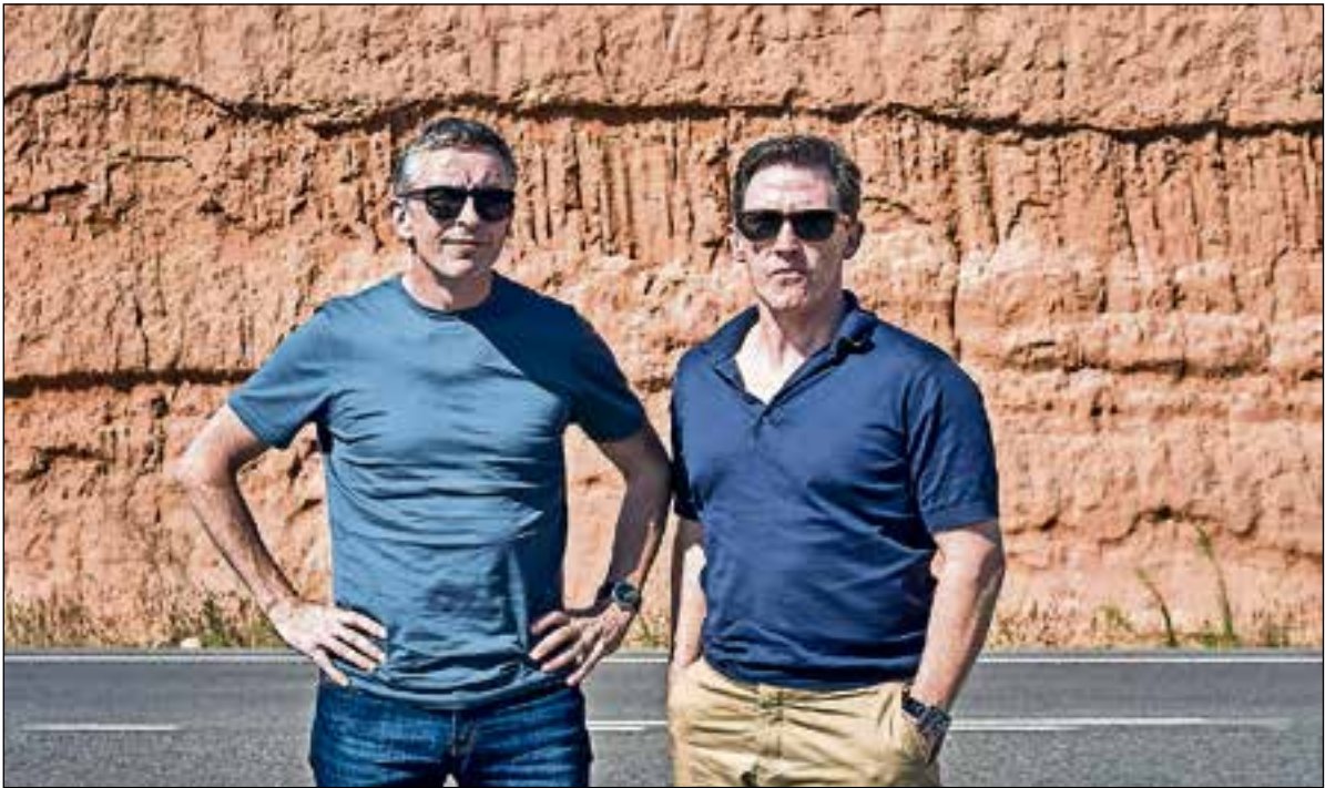
■ Aanmelden voor film The Trip to Spain met diner in Filmhuis Bussum.

WerkzoekersServicePunt 9.00 uur | De Palmpit Bussum WerkzoekersServicePunt in De Palmpit elke donderdag 9.00-12.00 uur Palmpit Bussum Koekoeklaan 3