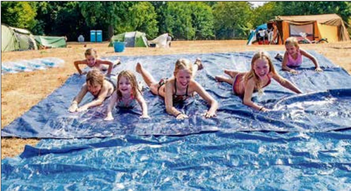
En glijden maar!