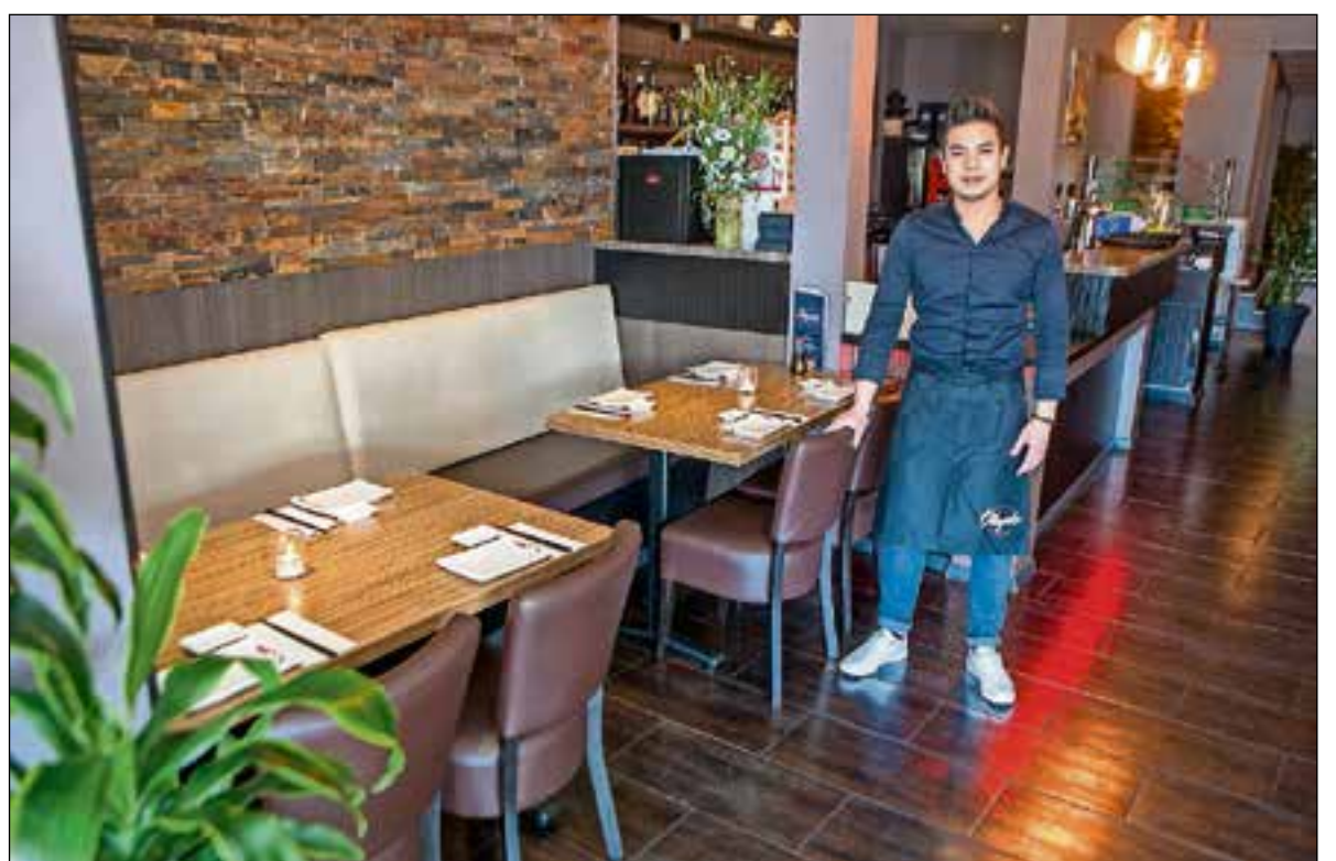
■ Restaurant Okydo is gevestigd aan de Stationsweg 20 in Bussum.

tionsweg. Als je hem naar zijn droom vraagt, reageert hij verrassend. “Ik heb wel dromen: een tweede restaurant, een bar en op lange termijn de aantrekkelijkheid van Bussum vergroten. Maar mijn eerste prioriteit is dat ik mijn personeel iets kan meegeven in het leven. Ze zijn nog jong en ik weet uit ervaring - ik studeerde op die leeftijd bedrijfskunde in Leeuwarde - dat je juist in die levensfase als persoon verder groeit. En door ook een fijne werkplek voor ze te creëren, maak ik mijn werknemers blij en dan zijn ook mijn gasten blij.” Voor Kydo is dat een van de belangrijkste sleutels tot succes en hij wil dan ook zo snel