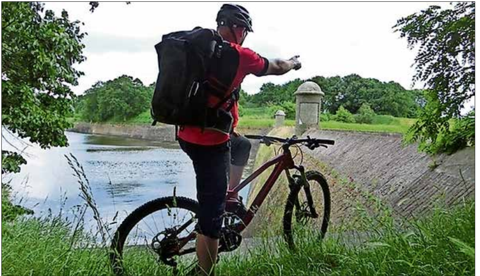
■ Ontdek de verborgen schatten op de mountainbike.

Vrijdagavond 13 april is de eerste activiteit met de 'Nacht van Naarden'. Een andere activiteit is op zondag 15 april met 'Ontdek de verborgen schatten'. Ga mee op een avontuurlijke reis door de tijd op je mountainbike. Onder leiding van een gids ga je op zoek naar mooie historische plekken met verhalen over vroeger en nu en laat de gids aan de hand van documentatie en foto's het ontstaan van Naarden en het Gooi zien. Heb je een stoere 4x4, doe dan deze zondag mee met de nieuwe FortRally die bij het Vestingmuseum begint en langs de Nieuwe Hollandse Waterlinie gaat met meer dan 40 forten, zes vestingen en twee kasteelvestingen. Tijdens de rally wordt er vooral gereden over binnenwegen, landweggetjes en bospaadjes met een aantal tussenstops voor onder meer lunch en kleine activiteiten. De rally eindigt bij Werk aan het Spoel in Culemborg. Informatie staat op www.startfortenseizoen.nl .