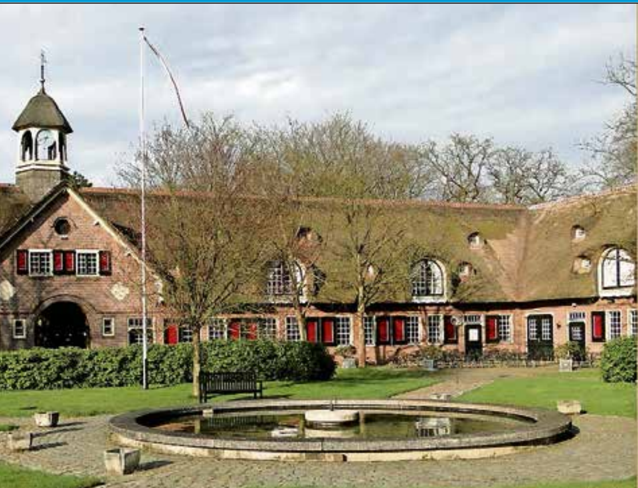
Er is een rondleiding bij Hofstede Oud Bussem.