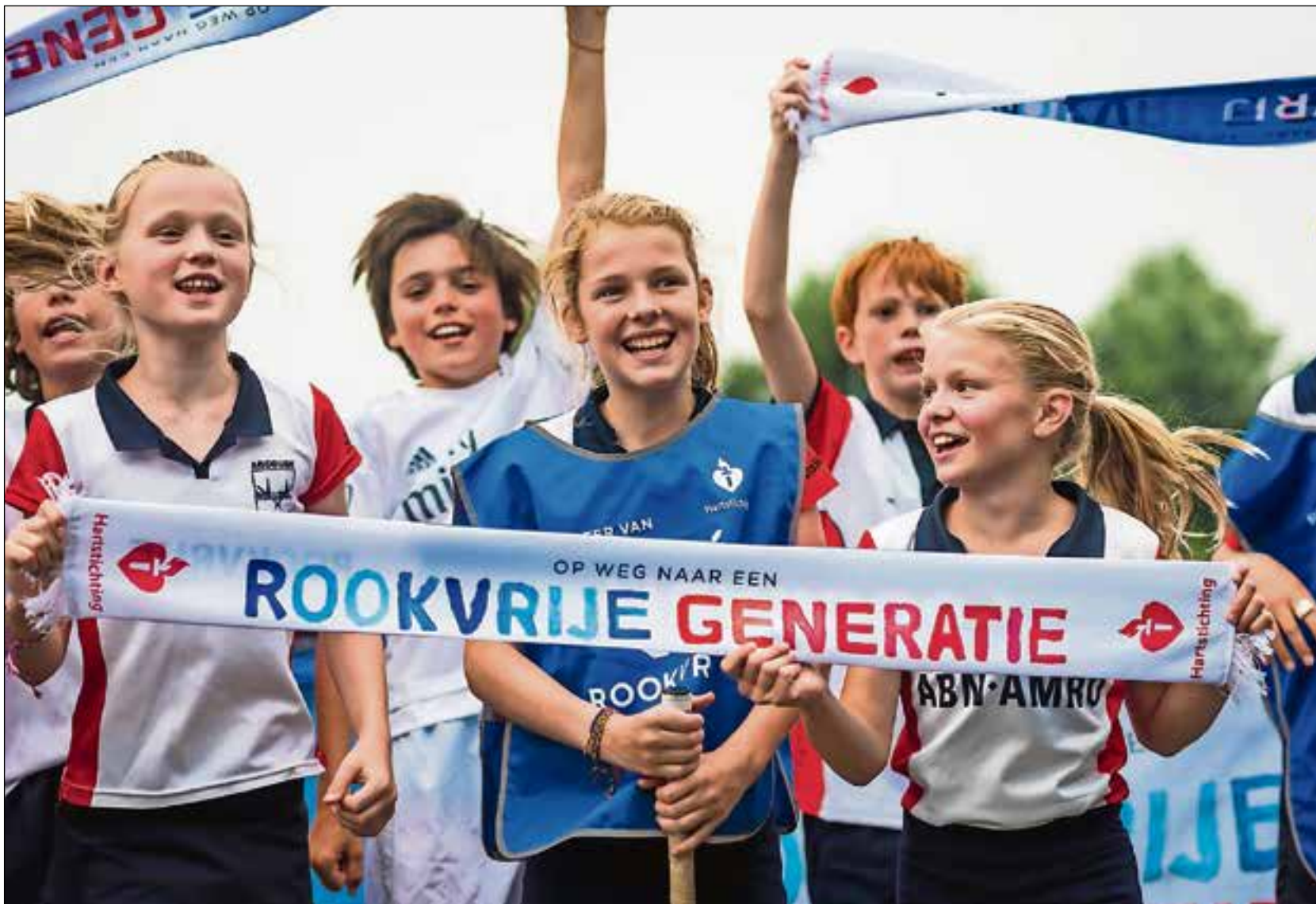
De Gooi en Vechtstreek is op weg naar een rookvrije generatie.