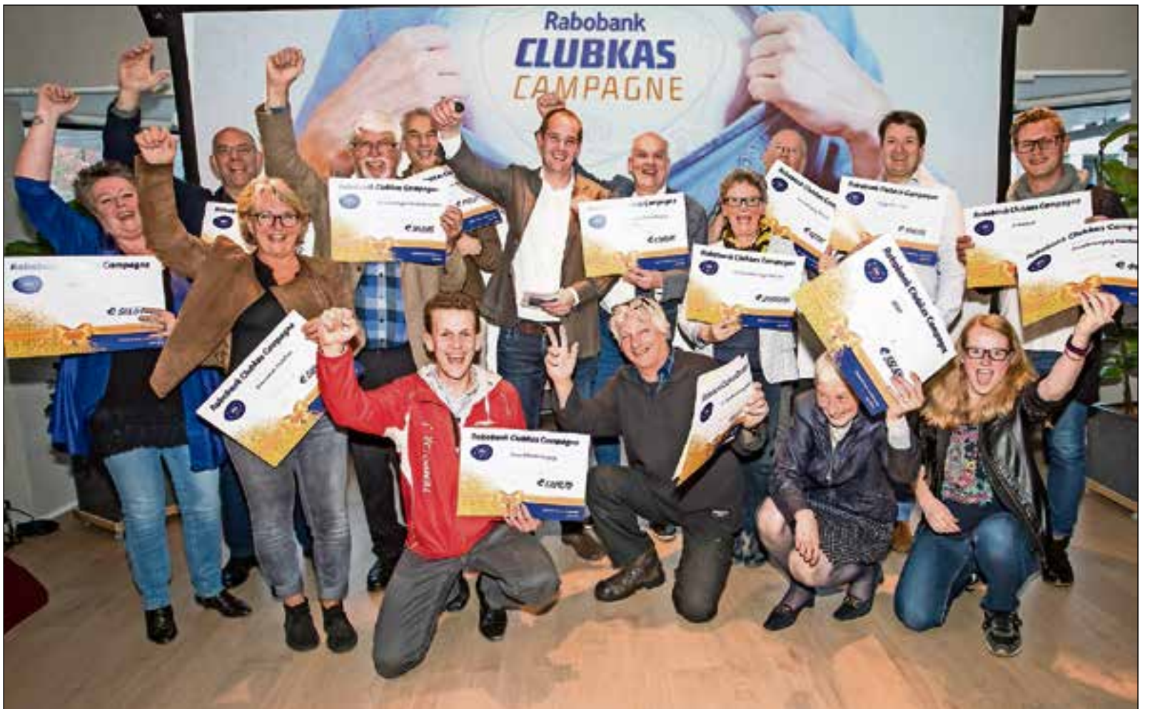
■ Alle winnaars op een rijtje.

De winnaars zijn geworden: De Zonnebloem regio Het Gooi, Gymnastiek- & Turnvereniging Keizer Otto, Stichting Open Monumentendag Naarden, Tempo Atletiekvereniging, Rugby Club 't Gooi, Muziekvereniging Het Gooi, ST. ontmoetingscentrum voor ouderen, Tennisvereniging Naarden, Denksport Centrum Bussum, Vrouwenkoor SmartTease, ASGM, Déjà-Vu, Toneelvereniging Kameleon en De Kombocht.