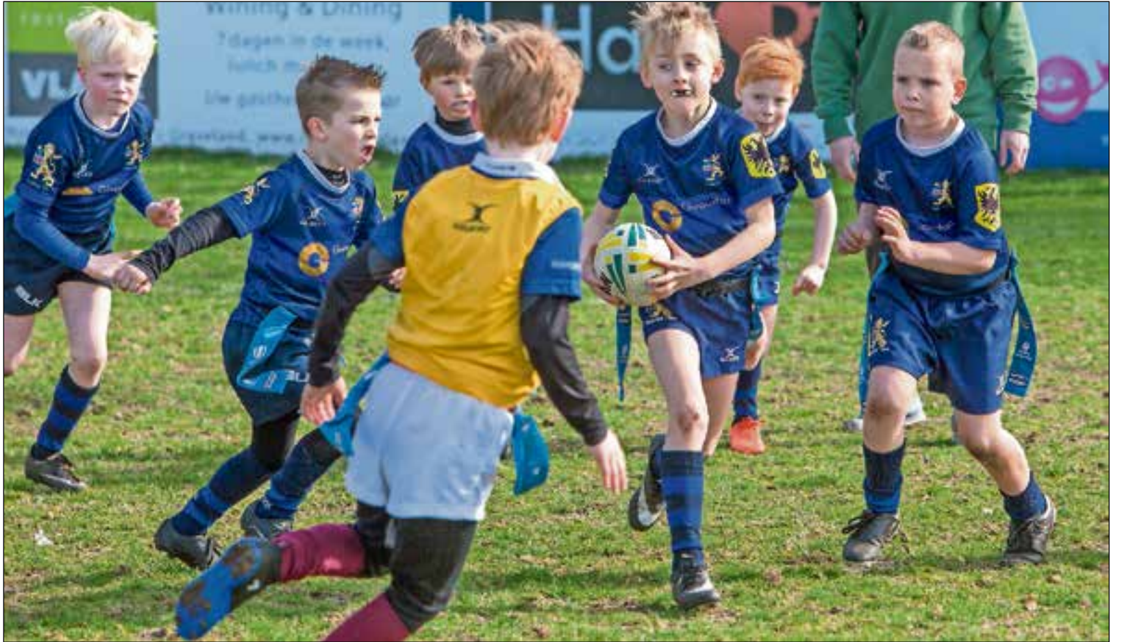
■ Kinderen leerden via een parcoursje hoe je rugby speelt zonder tackelen maar met aantikken.

"Spelenderwijs konden kinderen kennismaken met deze leuke sport met een parcoursje waar ze de basisbeginselen van rugby leerden kennen. Ook hebben we met z'n allen een thuiswedstrijd bekeken en de dag werd afgesloten met hamburgers." De laatste jaren is rugby flink aan het groeien. "Het is een stoere sport - maar ook met discipline - en een echte teamsport, want je bent op het veld afhankelijk van elkaar. Vanaf vier jaar kun je bij ons een keer per week komen trainen en vanaf zes jaar speel je op zaterdag ook een minitoernooi. Dat geldt ook voor kids vanaf acht jaar en die trainen dan tweemaal in de week. En vanaf je dertiende speel je mee in de competitie. We proberen de wedstrijden in de regio te houden. Onze jeugd speelt op hoog niveau en speelt door heel Nederland tot Middelburg aan toe."