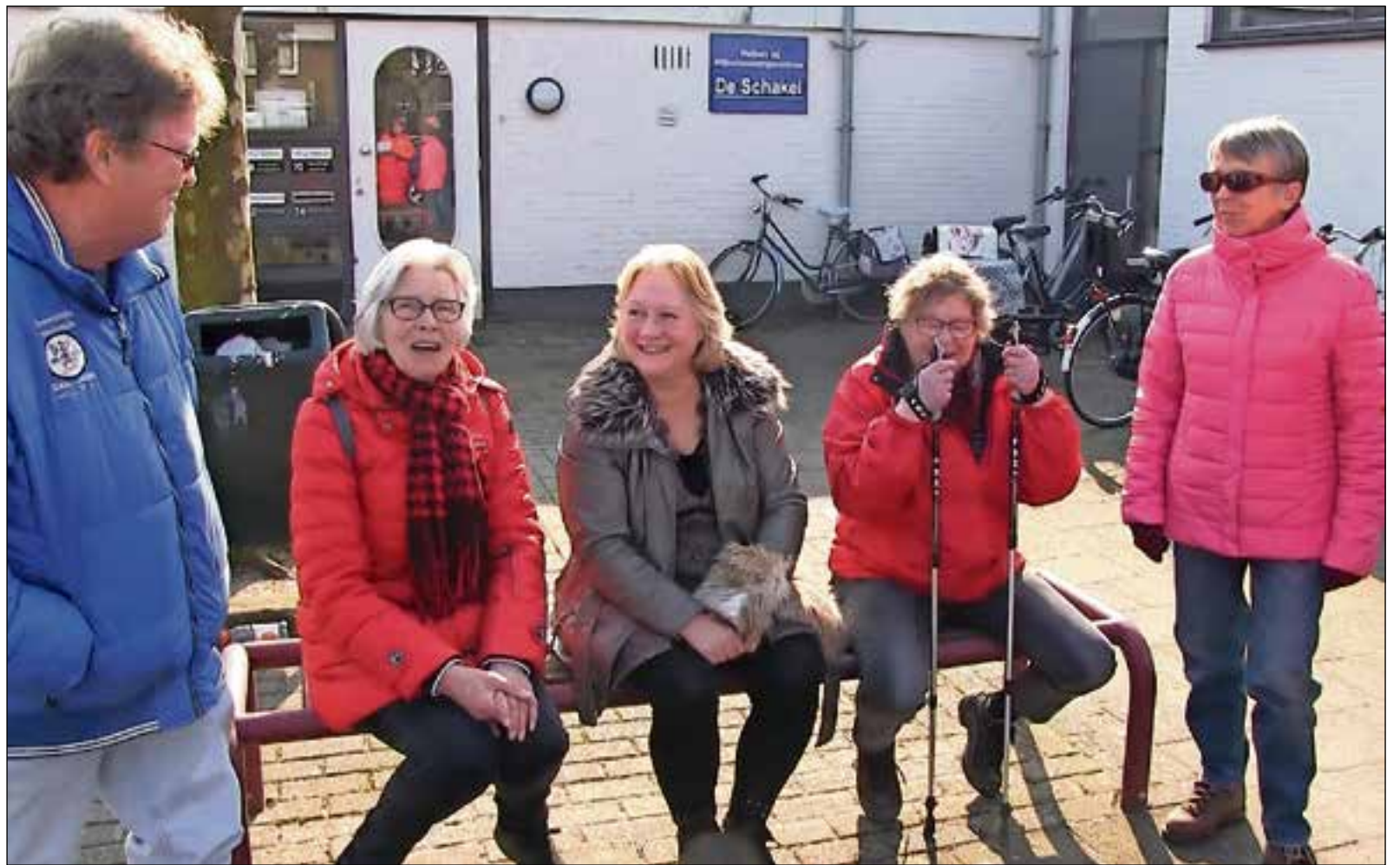
De wandelgroep zit klaar bij huisartsenpraktijk Keverdijk om te gaan wandelen.

Een andere deelnemer, hij is gepensioneerd, vertelt de sociale contacten binnen de groep ook