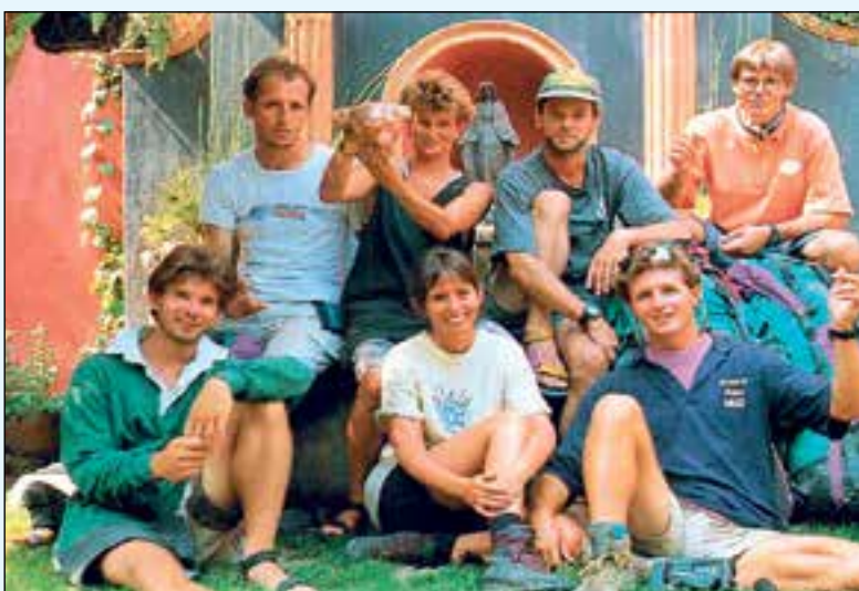
In Antigua in Guatemala.