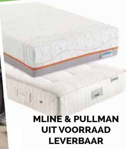
MLINE & PULLMAN UIT VOORRAAD LEVERBAAR