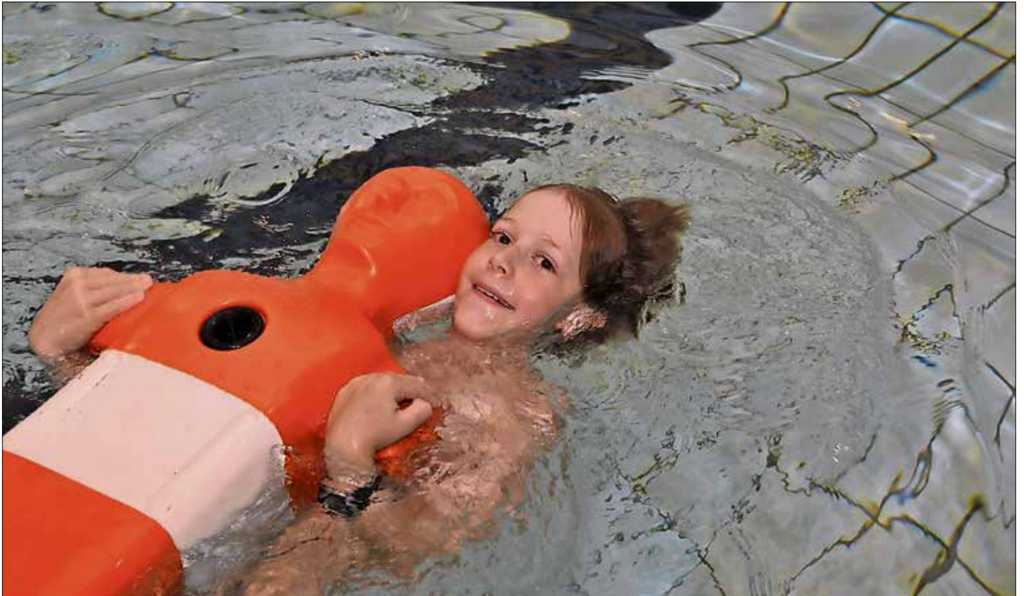
■ Behalve reddend zwemmen komen er ook survivaltechnieken bij kijken.