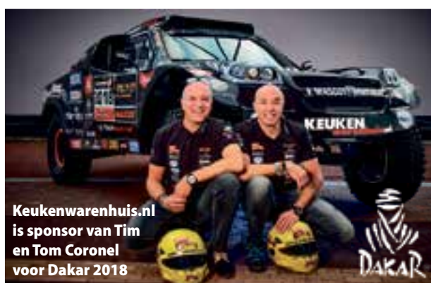
Keukenwarenhuis.nl is sponsor van Tim en Tom Coronel voor Dakar 2018