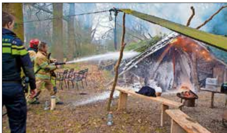
Brandweer kon afbranden schuur niet voorkomen.