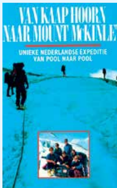
Omslag van het boek.

'Van Kaap Hoorn naar Mount McKinley' is de titel van het boek over deze unieke Nederlandse expeditie van Pool naar Pool. Auteur was Eric Luteijn, één van de zes reizigers. Alle teamleden maakten foto's. En uitgever M&P te Weert gaf in 1993 het gebonden boek van 144 pagina's uit. De Stichting Pole to Pole onder-