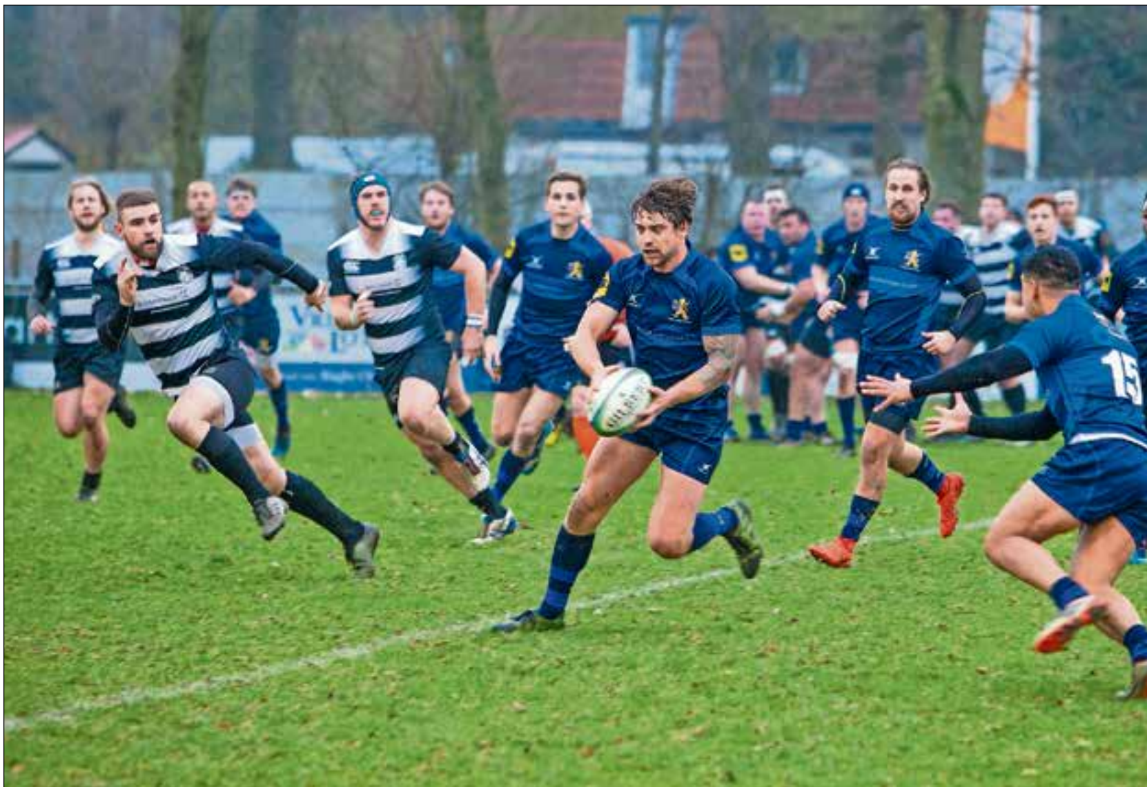
■ Mooie actie van Rugbyclub 't Gooi.

NAARDEN Na deze overwinning konden de Gooiers een dag later in hun clubhuis De Poort zonder schroom het 85-jarig bestaan van de club vieren.