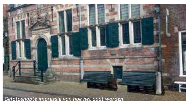
Gefotoshopte impressie van hoe het gaat worden