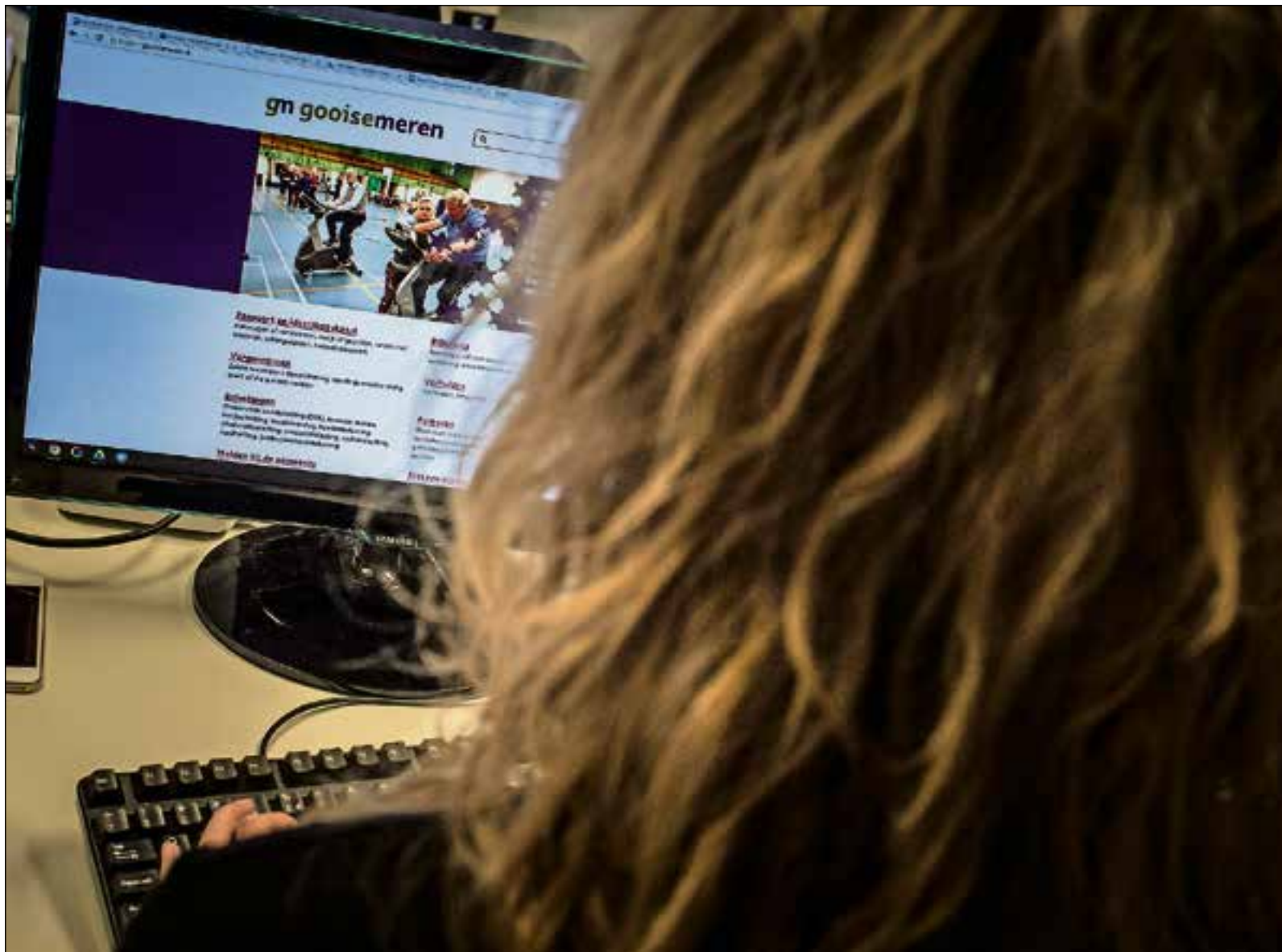
Gemeente belooft binnen vijf werkdagen te reageren.