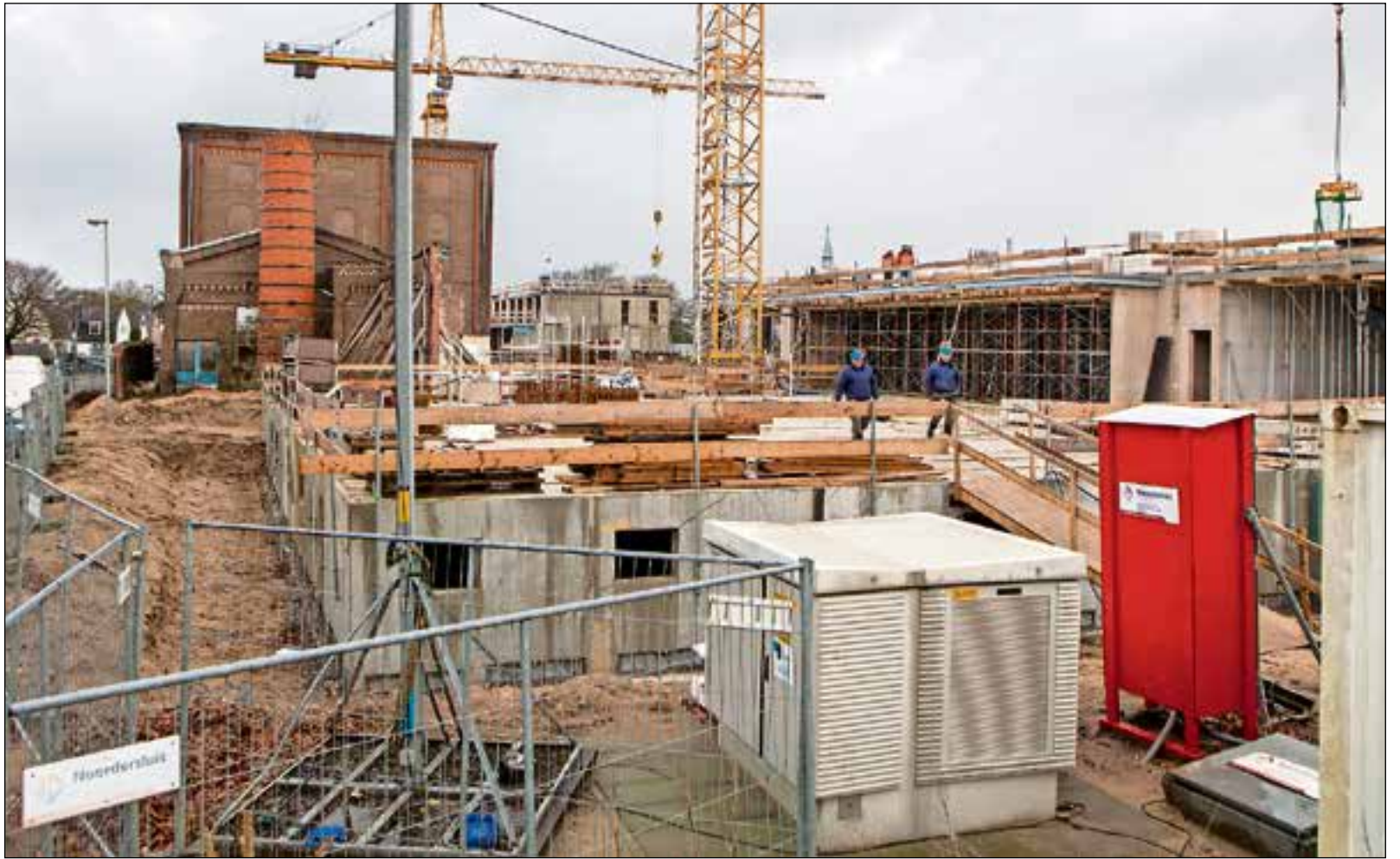
Het parkeerdek is over twee weken klaar.

De autokrakers nemen steeds dure spullen mee, zoals telefoons en laptops. "De daders weten kennelijk feilloos de auto's te vinden met waardevolle spullen en zijn er in een mum van tijd met de buit vandoor", zo waarschuwt de Gamma op een bord voor de zaak. De bouwmarkt roept op om geen waardevolle spullen achter te laten en vraagt klanten extra te letten op verdachte personen op de parkeerplaats.