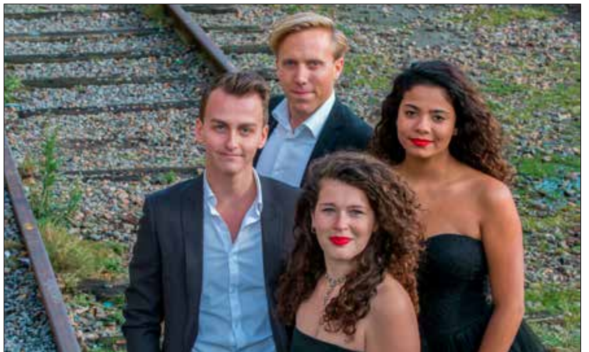
De vier jonge musici treden voor het eerst op.

Het repertoire dat ze uitgekozen hebben is behoorlijk divers. "We hebben gekeken naar wat leuk is om naar te luisteren en het mocht niet te eentonig zijn." Het