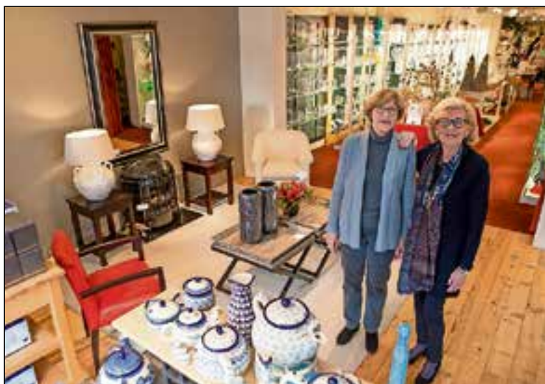
Met pijn in het hart sluit de zaak eind maart.

Inmiddels is de grote uitverkoop begonnen en dat loopt erg goed. Veel klanten zijn al langsgeweest om de zussen en het personeel gedag te zeggen. "De reacties zijn gigantisch, hartverwarmend ook. De mensen vinden het vreselijk dat we weggaan. Ze zeggen dat we altijd zo goed geholpen hebben,