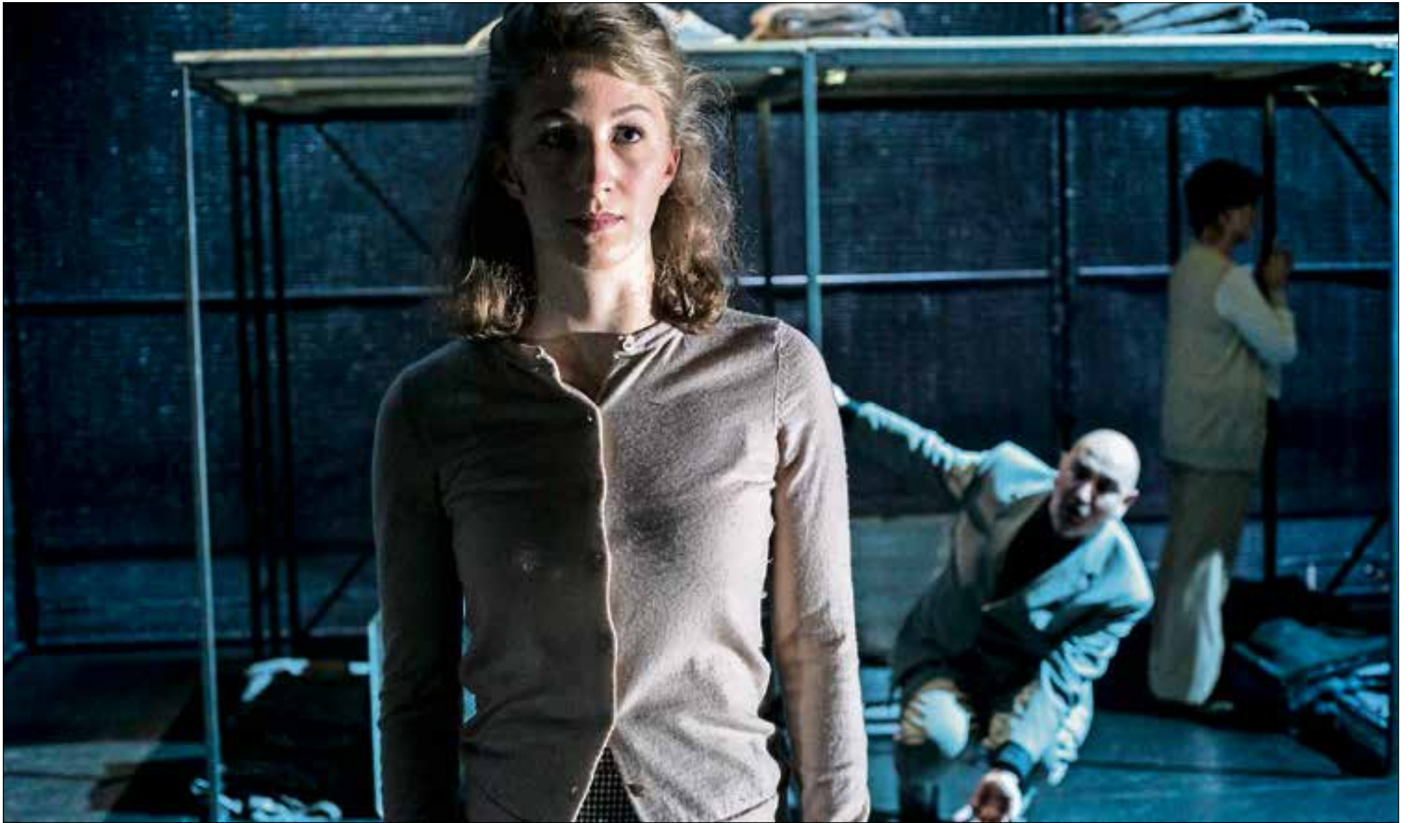
■ Scène uit 'Achter het Huis'.