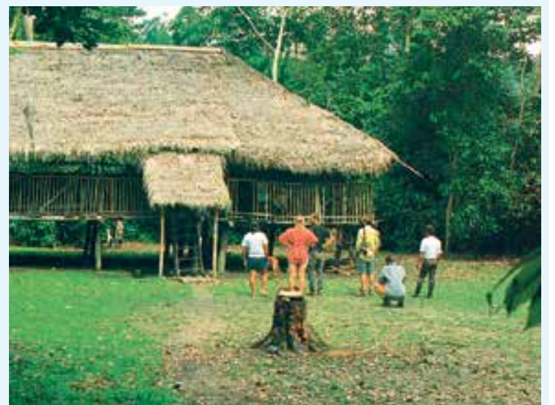
Midden in het oerwoud op bezoek bij een indianenfamilie.

culieren, konden ze niet alleen de tocht maken, maar ook dit boek en vier nieuwsbrieven uitgeven. In de laatste nieuwsbrief van september 1993 kondigden zij een tentoonstelling en een audio-visuele presentatie aan, te houden op 3 oktober 1993 in het toenmalige Luchtvaartmuseum te Schiphol. Inmiddels zijn we 25 jaar verder. De zes hebben na