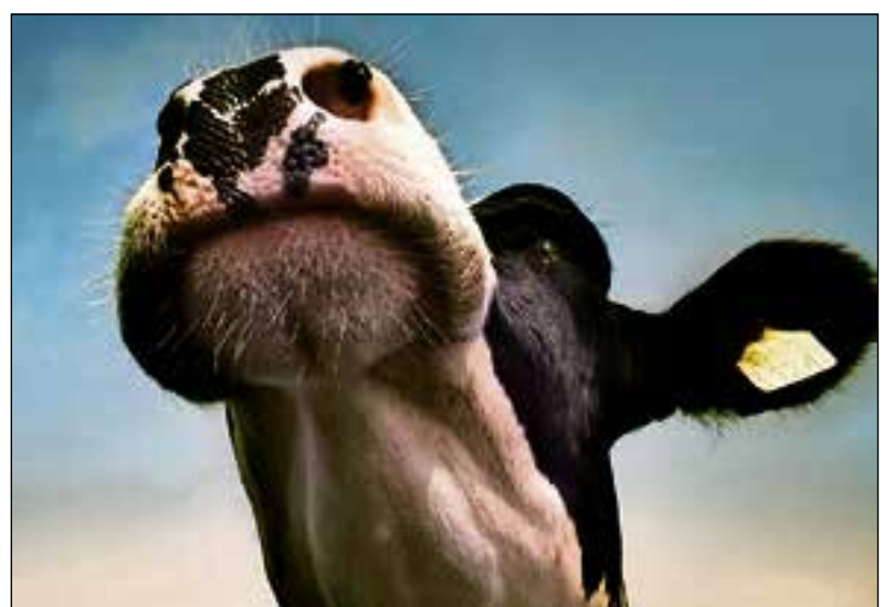
De spraakmakende documentaire over een boerenbedrijf.