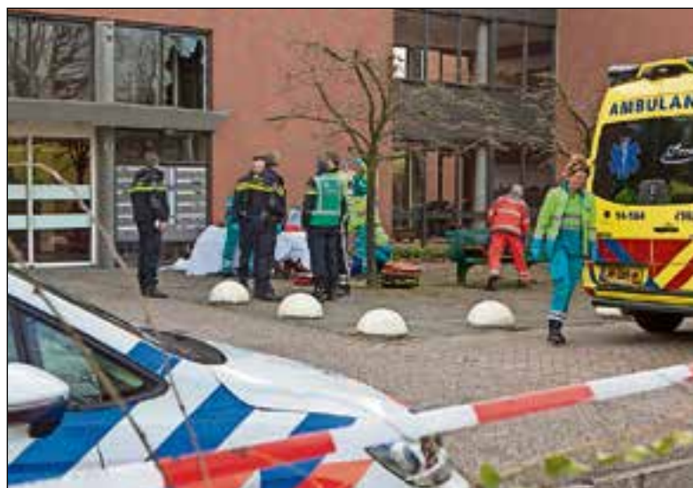
De bewoner overleed na een val van de eerste etage.

Volgens burgemeester Ter Heegde was de man het slachtoffer van een noodlottig ongeval, maar toch roept de burgemeester woonzorgcentra op extra alert te zijn en zo nodig maatregelen te nemen. "We zijn ons er niet altijd van bewust hoe groot deze scoot-