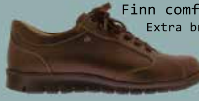
Finn comfort Extra breed