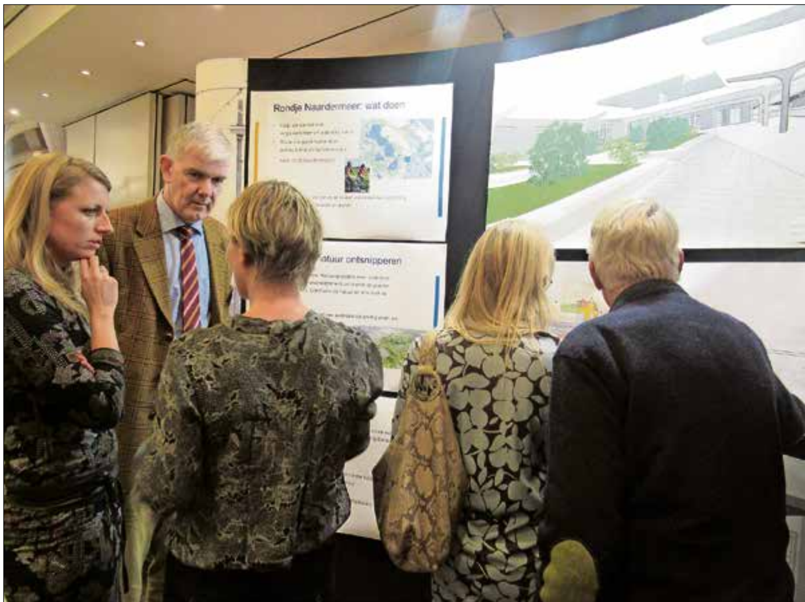
■ De bezoekers kijken vol belangstelling naar de gepresenteerde plannen.