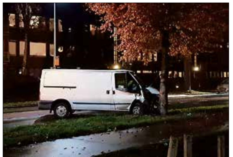
■ De bus reed tegen een boom.

■ De bazaar is zaterdag van 11.00 tot 15.00 uur in het pand aan de De Ruijterlaan 24a.