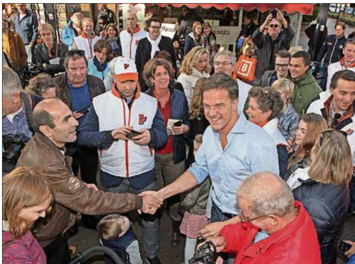
Nog heel even en alle verkiezingscampagnes barsten weer los.

bekend. De meeste lijsttrekkers zijn bekende gezichten, verder op de lijst gevolgd door wat verrassingen en nieuwkomers. Nu alle kernen gefuseerd zijn tot de gemeente Gooise Meren lijkt het alsof alle partijen bij het samenstellen van hun kandidatenlijst ook nadrukkelijk selecteren op waar de persoon woont. Behalve HVBNM, die partij heeft alleen raadsleden uit Bussum en één uit Naarden op de lijst staan. Dat zou geen probleem moeten zijn nu we één gemeente zijn. Toch werd bij de vorige verkiezingen wel duidelijk dat inwoners graag stemmen op iemand uit hun eigen woonkern. Grootste uitdaging van de gemeenteraad is om een stabiele