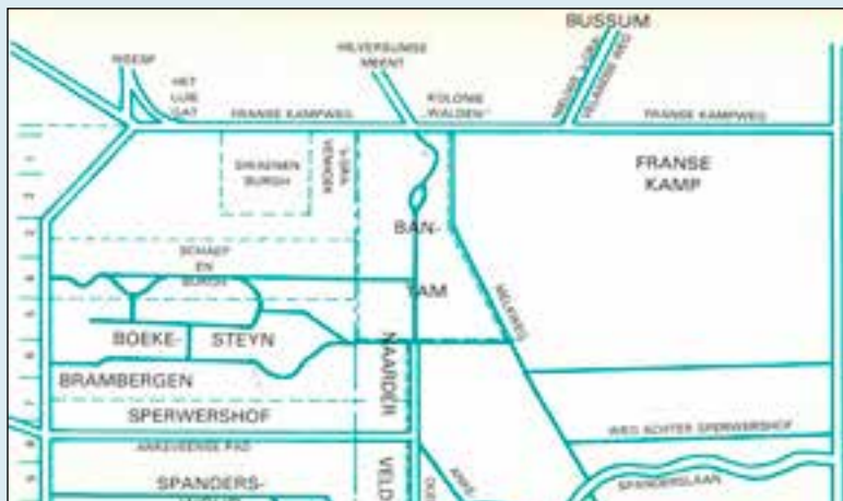
Deel van globale wandelkaart rond 1950.

'De Swaenenburgh' is de naam van het 's-Gravelandse landgoed dat het dichtst bij Bussum ligt, maar het minst bekend is. De ingang bevindt zich aan de Franse Kampweg, vlak tegenover de Hilversumse Meentweg, en het kavel staat haaks op 'Schaep en Burgh'. Het is een betrekkelijk klein landgoed dat in de loop van eeuwen verschillende eigenaren heeft gehad, samen met het naastgelegen 's-Gravenhoek, wat nu weiland is. 'De Swaenenburgh' kreeg pas in 1797 die naam.