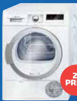
Bosch warmtepomp-droger twv €699,-