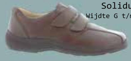
Solidus Wijdte G t/m M