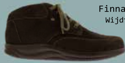
Finnamic Wijdte K