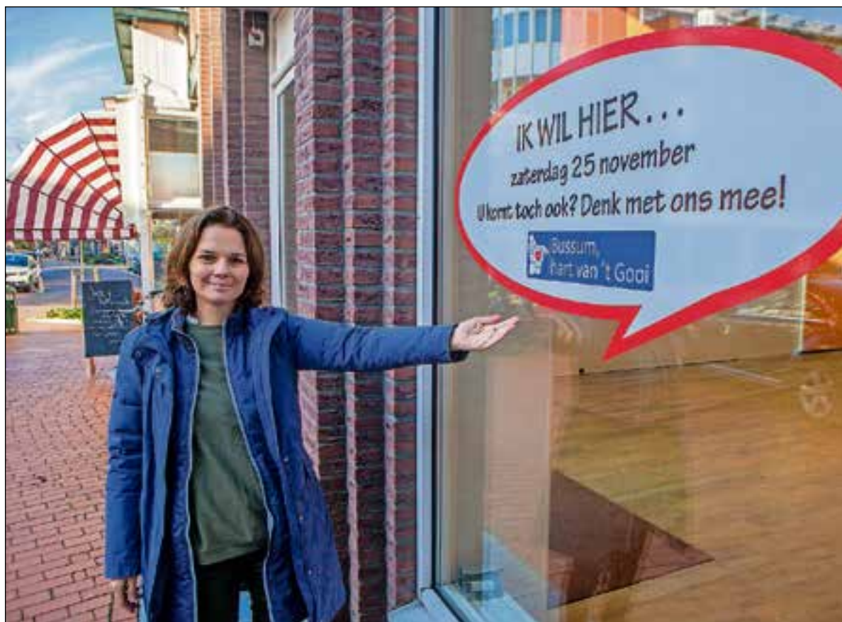
De dorpsmanager wil weten welke ideeën er leven.

Van Vossen legt uit wat hiervan het doel is. "Ik wil centrumbezoekers, ondernemers en bewoners actief mee laten denken over de versterking van ons winkelge-