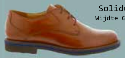
Solidus Wijdte G/H