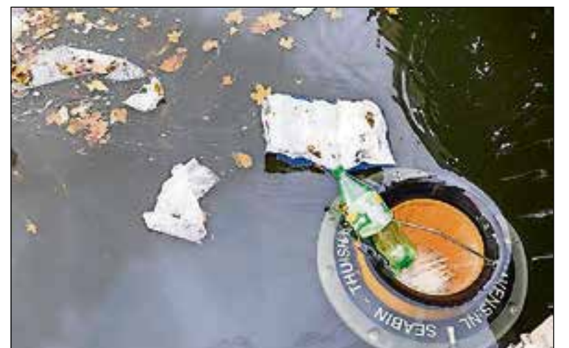
Voor vissen vormt hij geen gevaar.

crowdfundingactie. Als beloning voor het vertrouwen kregen ze de primeur voor Nederland.