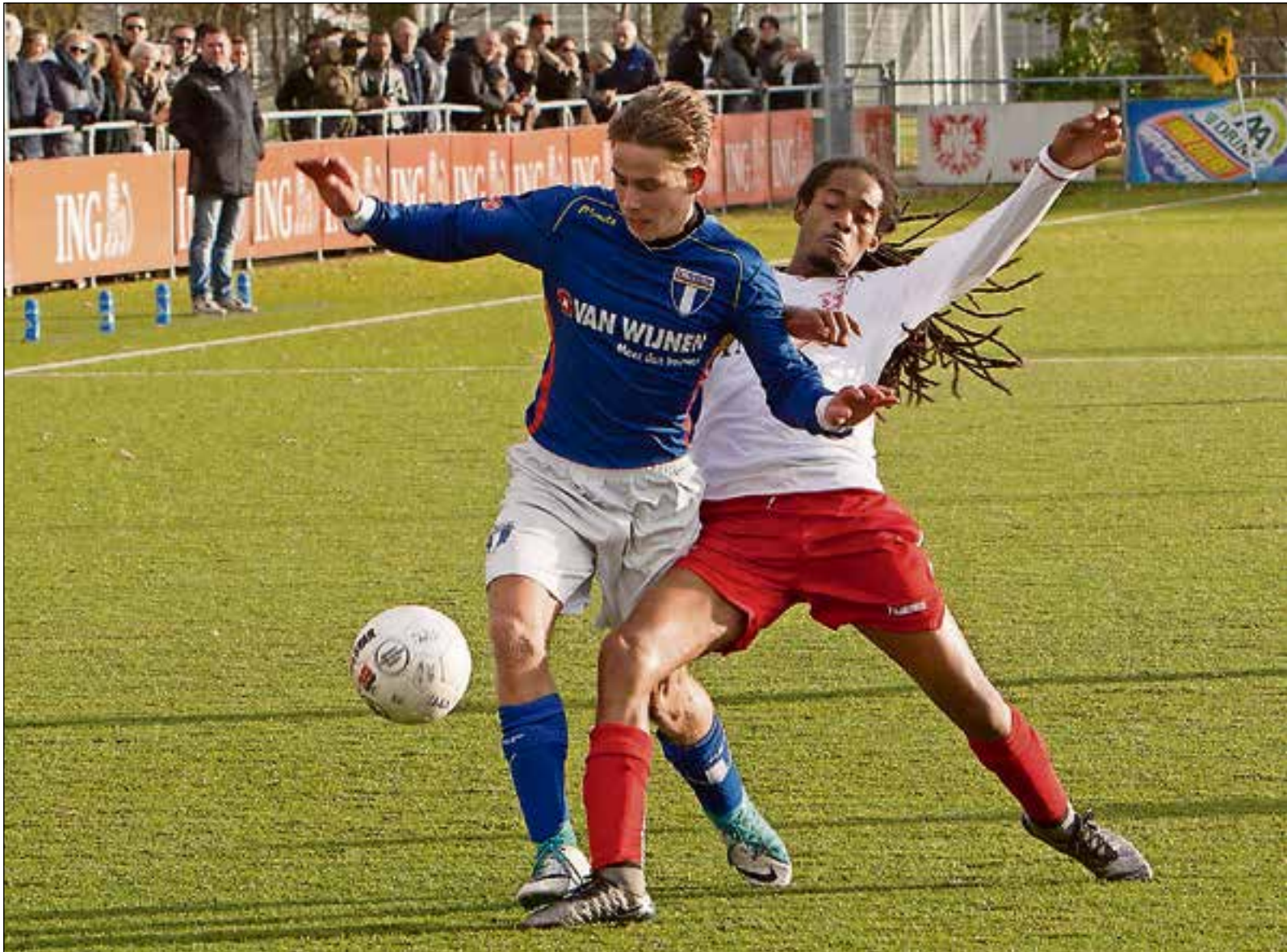
■ De stress over de naderende periodetitel zat er behoorlijk in.