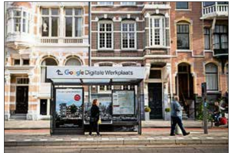
De opvallende tramhalte.

Rehe vertelt meer over het project. "Google biedt ondernemers gratis onlinecoaching aan in de Digitale Werkplaats. Ze verzorgen daar workshops over onderwerpen als het vergroten van je onlinevindbaarheid en social media. Deze pop-upstores verplaatsen steeds. Bureau voor Reuring verzorgde het concept, de venue, aankleding, pers en meer. En wij verzorgden de buitenreclame. De tramhalte is verbouwd en heeft een 3D-signing op het dak met een pijl richting de werkplaats. Daarnaast zet Google een abri-campagne in en rijdt er een bestickerde tram rond."