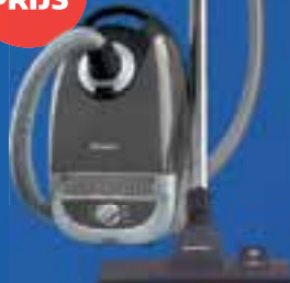
Miele stofzuiger twv €199,-