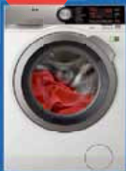
AEG wasmachine twv. €999,-