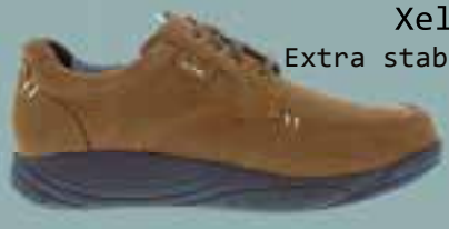
Xelero Extra stabiele zool