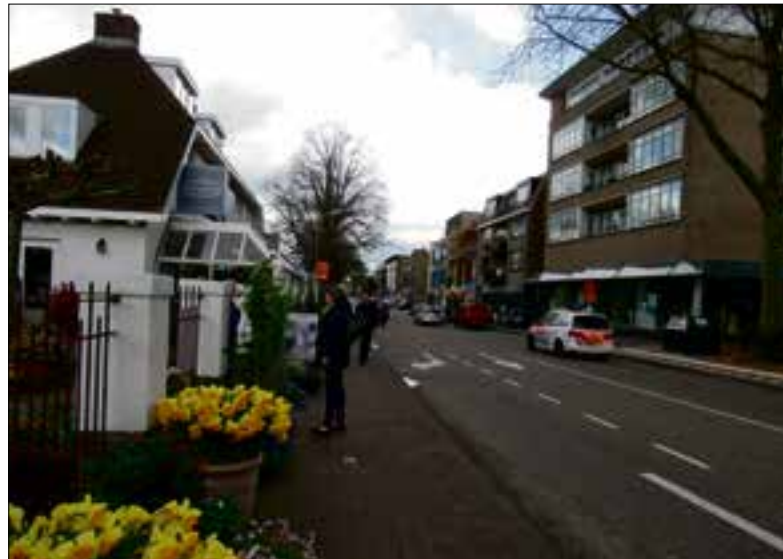
■ De Vlietlaan in 2017, met Hema en veel leuke winkels