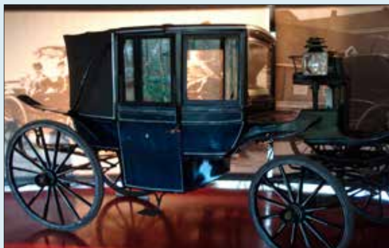
Glaslandauer (Nationaal Rijtuigenmuseum).

heeft gepraktiseerd, nieuwe wiel-doppen met de eigen naam op te verhandelen rijtuigen werden gezet. Die wioldoppen werden gefabriceerd door ijzergieterij Tattersall Holdsworth in Enschede, een machinefabriek waar onder meer gietijzers onderdelen voor rijtuigen werden gemaakt. De leiding van deze fabriek heeft familiebanden met het Engelse paardenbedrijf onder dezelfde naam.