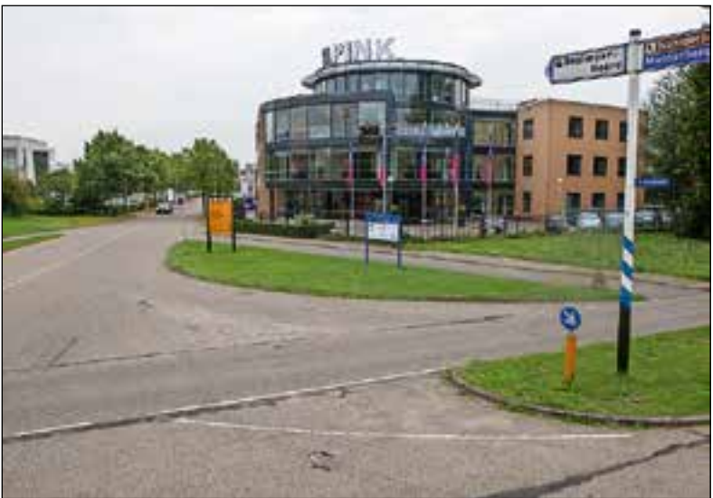
■ Bedrijventerrein Noord.