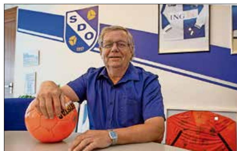
■ De bestuurskamer, vertrouwd terrein voor de 70-jarige SDO'er.

wat geluidsoverlast geeft. "Bij sport hoort geluid, of dat nu van teleurstelling of vreugde is."