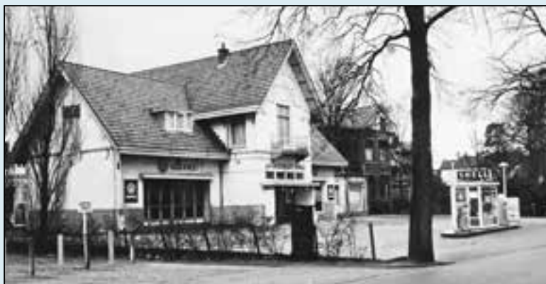
Eslaan 14, omstreeks 1925.

Tattersall-Bussum voert naar de Eslaan, waar rond 1880 Henk van Zalinge een rijtuigenhandel vestigde. Dat was op nummer 14, in het koetshuis van de naastgele-