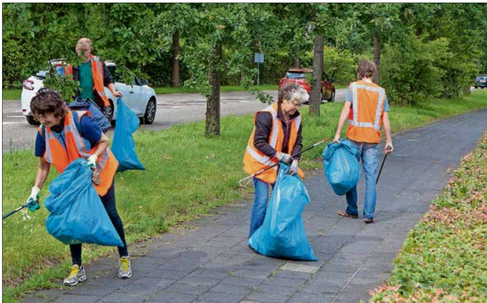
■ Een keer per maand Troeptrimmen, in Naarden en Bussum.

BUSSUM / NAARDEN Je kunt ze sinds eind vorig jaar tegenkomen. De Troeptrimmers, een clubje vrijwilligers dat regelmatig de straten van Bussum en Naarden al trimmend of wandelend van zwerfvuil ontdoet.