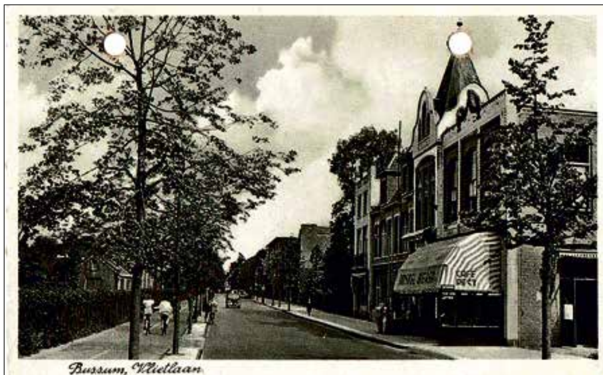
■ De Vlietlaan in de jaren '30, met rechts bioscoop Novum en links een fietspad.

Dorpsmanager Ellen van Vossen: “Een laan met uitstraling waar het goed toeven is voor bewoners, ondernemers en bezoekers. Veel treinreizigers lopen vanaf het station via de Vlietlaan naar het Bussumse centrum. Vroeger was de Vlietlaan een prachtige groene laan. Met de bloemenpracht van ‘Het Gooise Land’ tegenover de Hema is de toon in ieder geval gezet”.