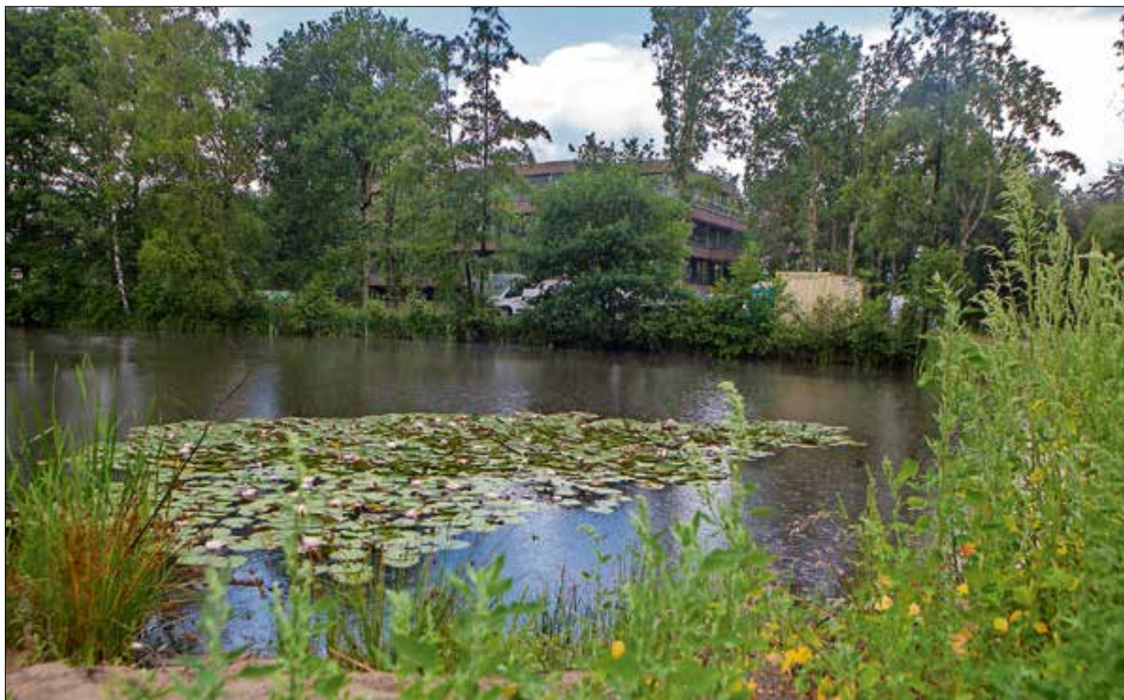
■ Geen 200.000 maar 170.000 euro is nodig voor groenonderhoud.

BUSSUM Een flinke meevaller voor de bewoners van Cruysbergen; zij krijgen per woning 2.000 euro terug van de gemeente. Reden is dat het geplande groenonderhoud een stuk goedkoper uitvalt dan werd verwacht.