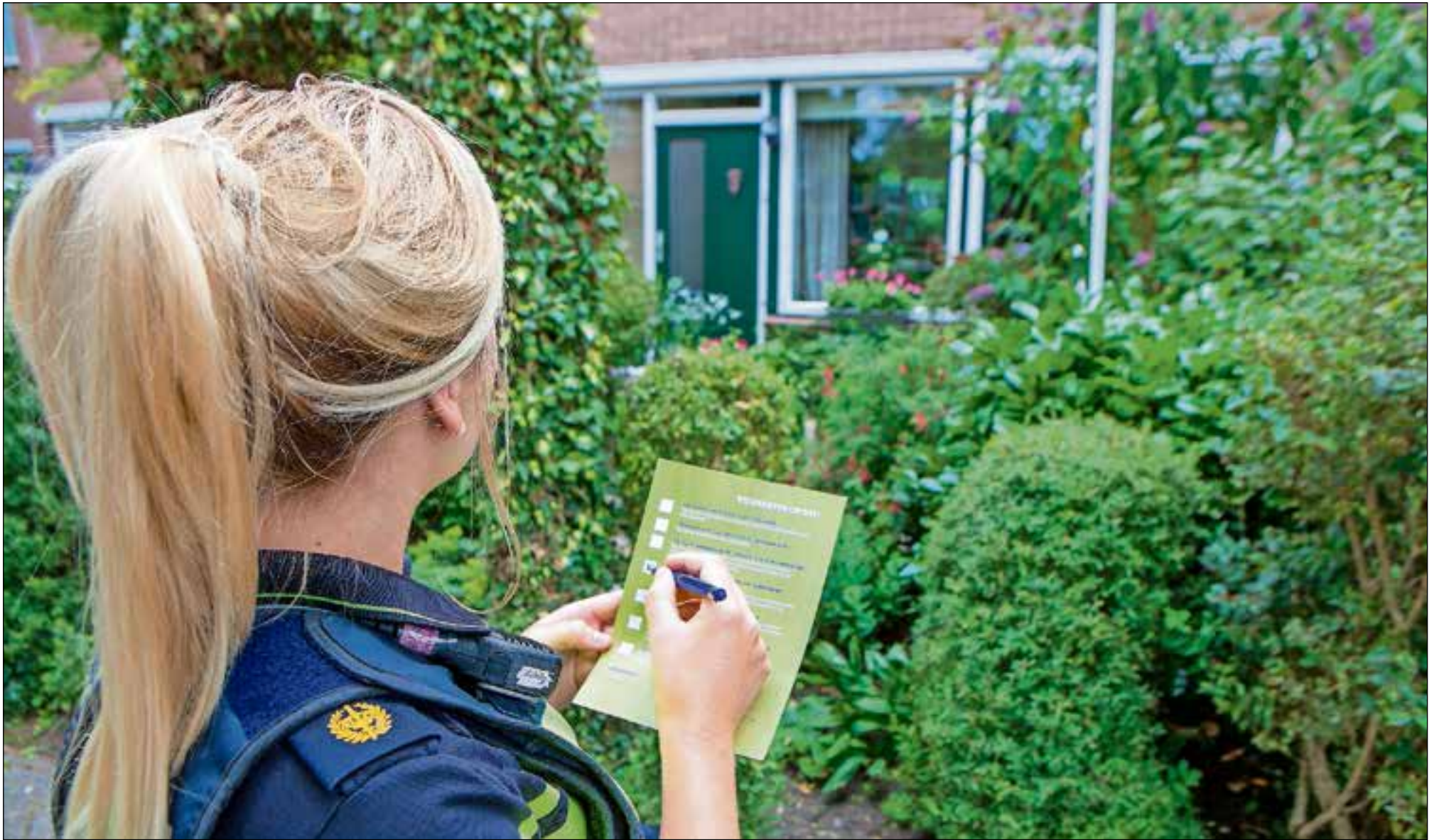
■ De wijkagent vult een waarschuwingsfolder in, waar ze aankruist waar bewoners op moeten letten.