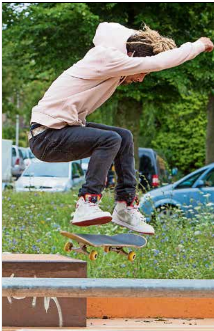
■ Luid applaus voor deze jongen.