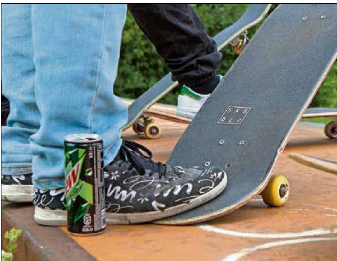
■ Even op je beurt wachten.