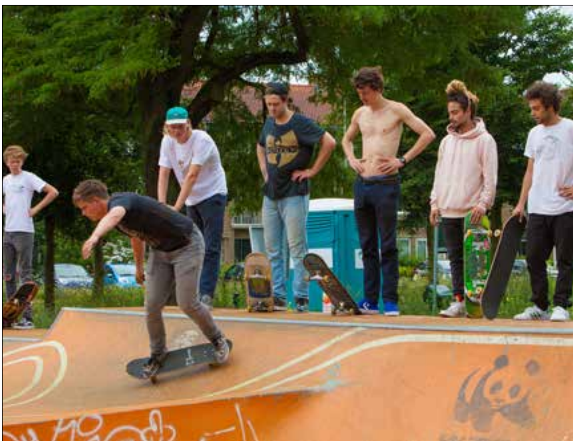
■ Er hing een relaxed sfeertje.