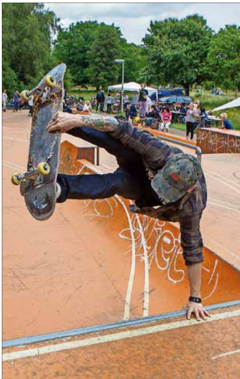
■ Coole tricks.