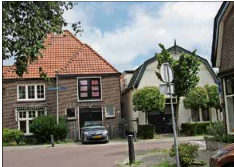
■ Hoek Driestweg/Noorderweg waar in de jaren '50 nog veel buurtwinkels waren, zoals groentehandel, bakkerij en slagerij.

In de straten rond Piet van Det waren tot in de jaren '60 tal van buurtwinkels gevestigd. Waar je boodschappen kon laten opschrijven in een boekje. Aan het eind van de maand rekende je dan af. Op de Gildestraat hoek Driestweg zat een kruidenierswinkel annex petroleumhandel. In de wijk waren ook enkele stadsboerderijen gevestigd. Barneveld Zaken zat al op de Noorderweg.