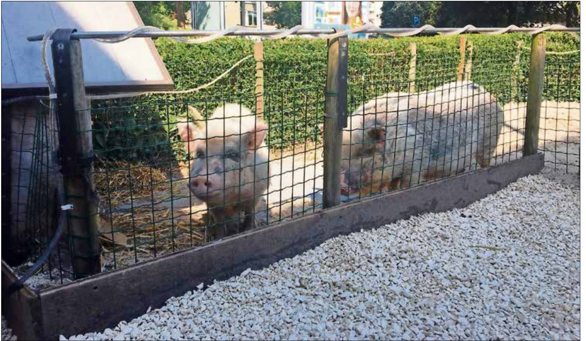
■ Broer en zus hebben ieder hun eigen plek in het hok.