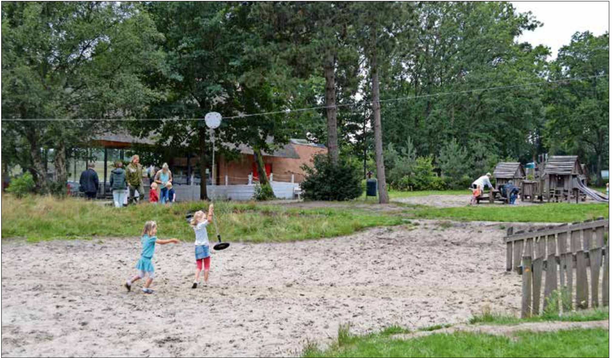
■ Het restaurant is nu nog dicht. De speeltuin is wel toegankelijk.