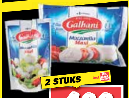
Galbani Mozzarella mini of maxi 2 x 150/200 gr.