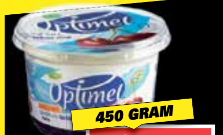
Almhof Yoghurt Griekse Stijl alle smaken