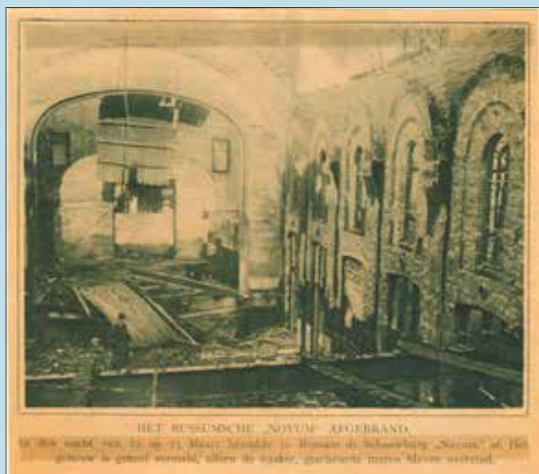
Onbekend tijdschrift 1917 (collectie Winthorst, gemeentearchief Gooise Meren)