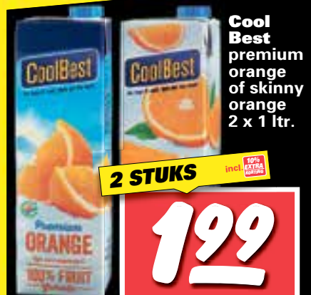
CoolBest premium orange of skinny orange 2 x 1 ltr.