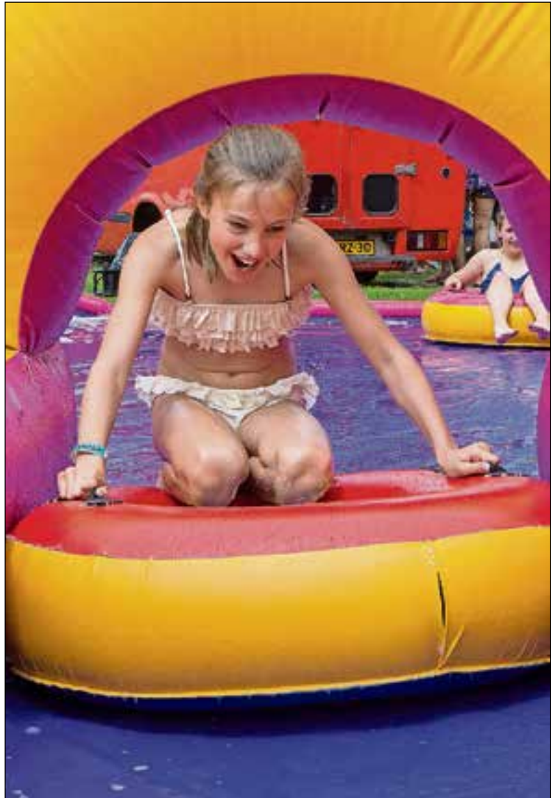
■ Spelen met band en water.