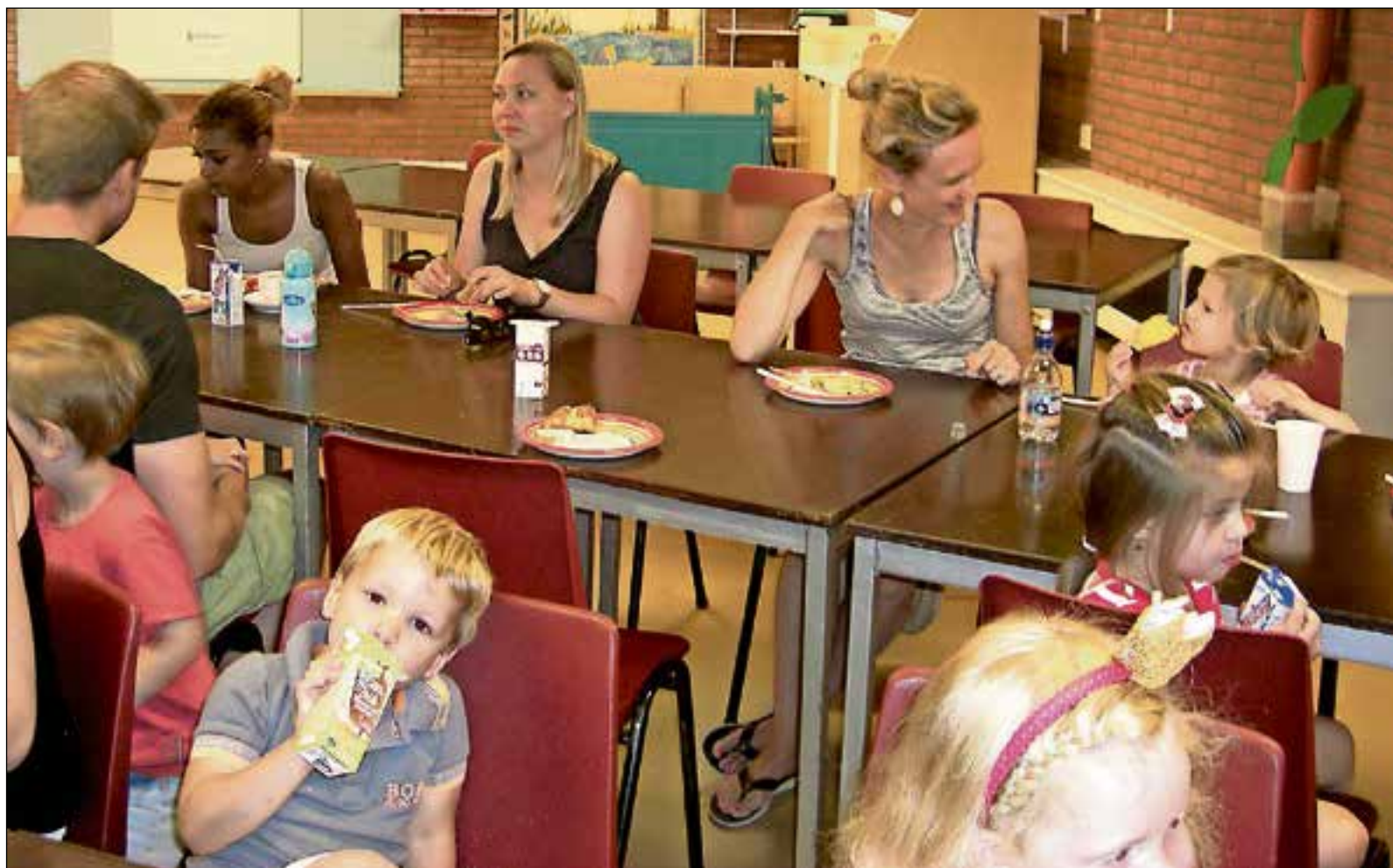
■ Genieten van samen eten en drinken.