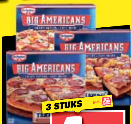
Big Americans alle smaken