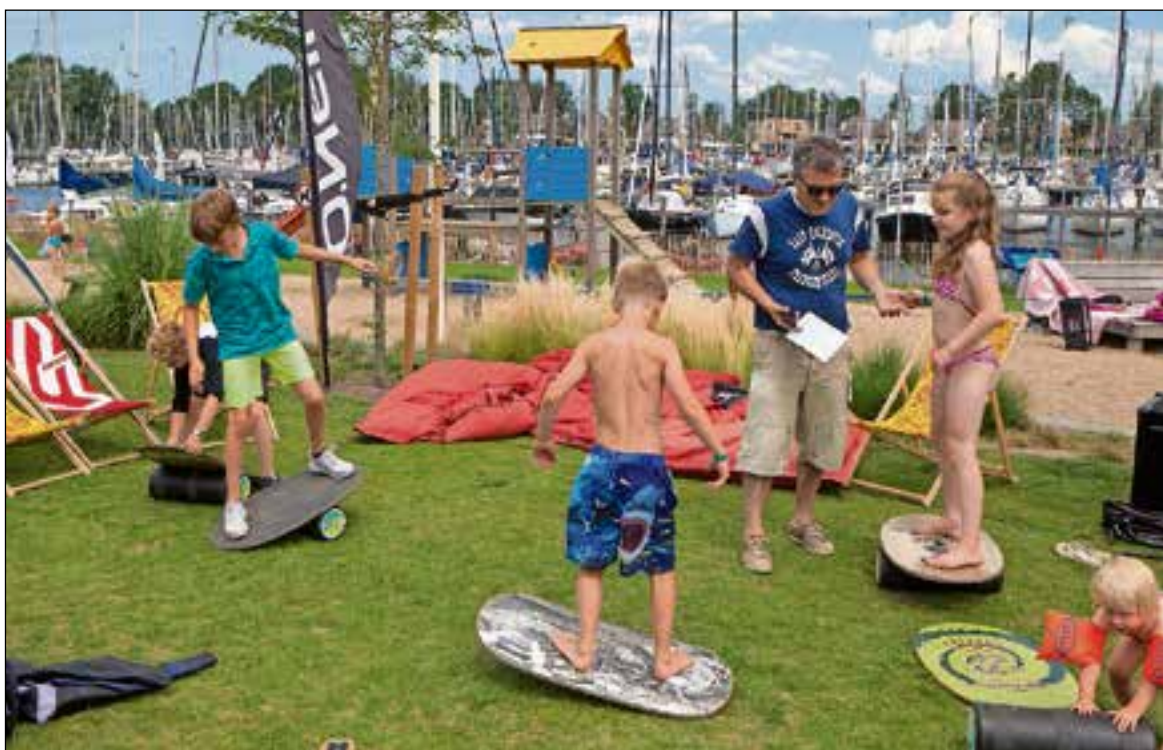
■ Oefenen met balans.