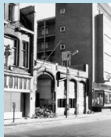
De sloop van Novum 24 februari 1917

andere bioscopen heeft (Flora en Concordia).