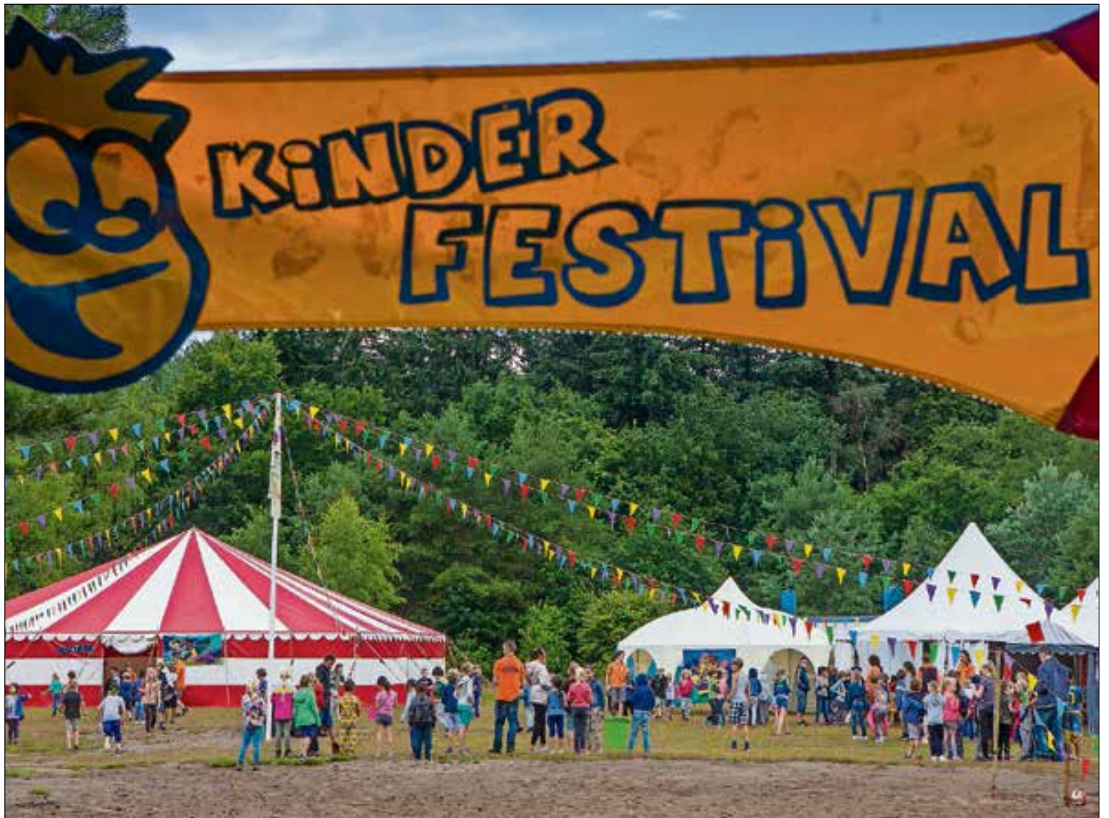
■ Kleurrijke bende, zelfs in de regen.