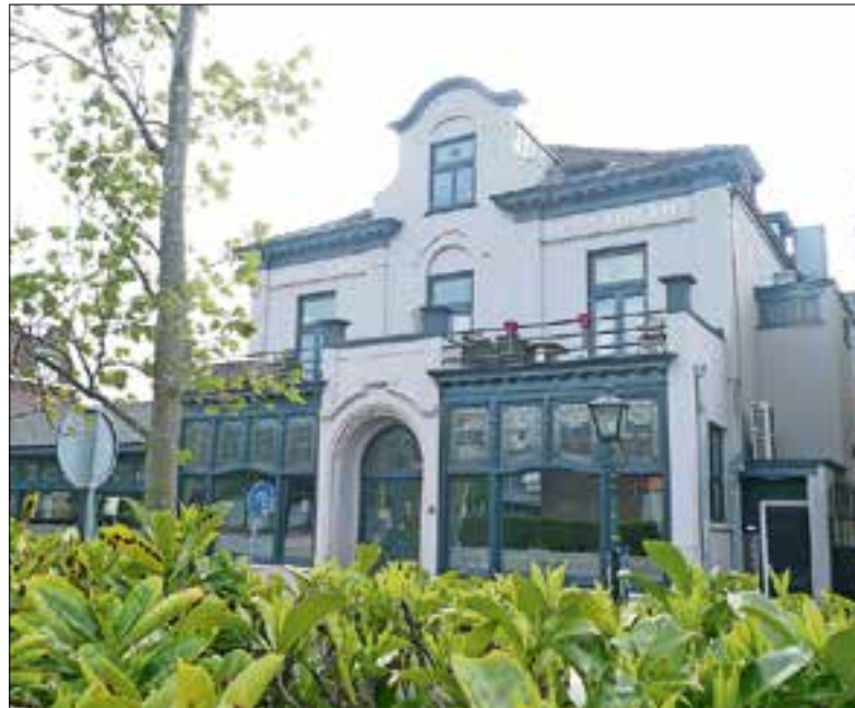
■ ‘Bel Ami’ anno 2017. Het gebouw is een mooie entree van het Bussumse centrum geworden.

‘Tijdens de kermis werd er volop gedanst en ook wel eens gevochten’