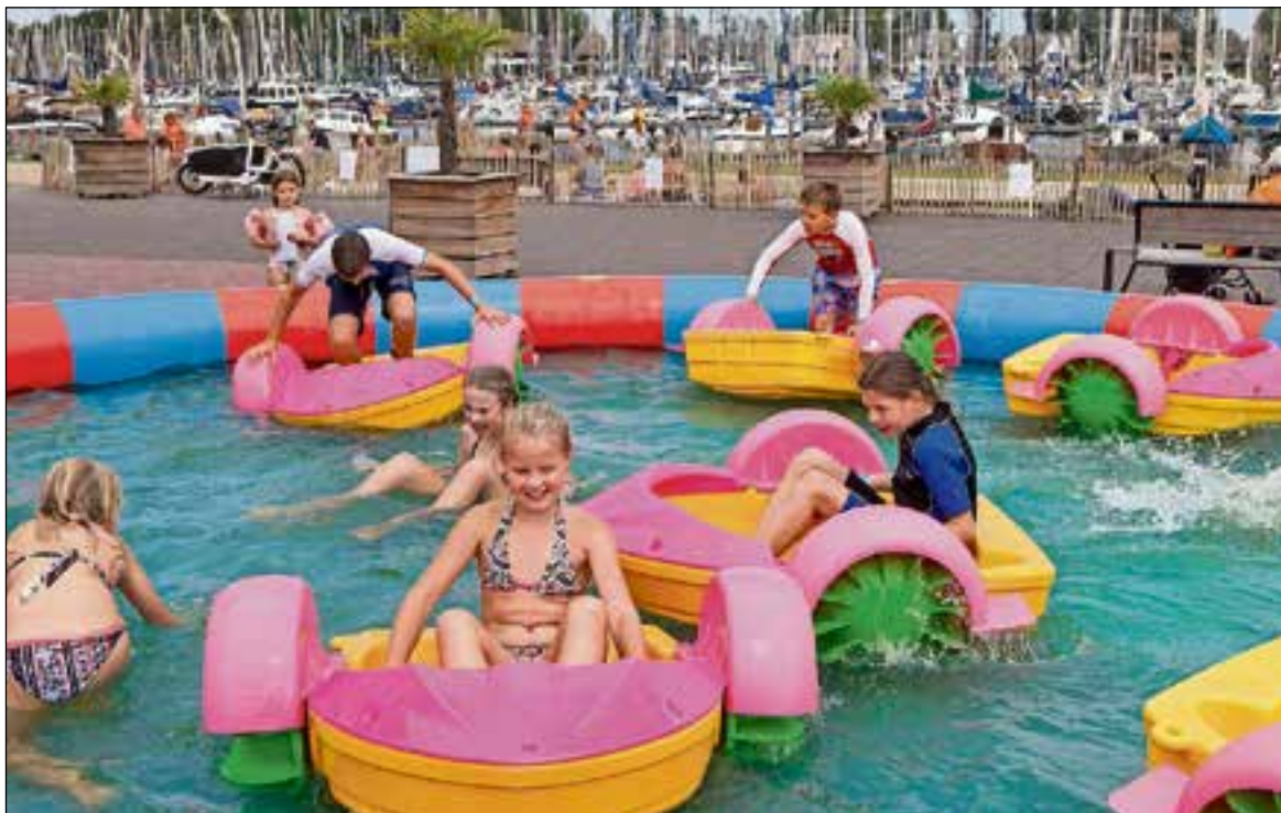
■ Bootje varen.