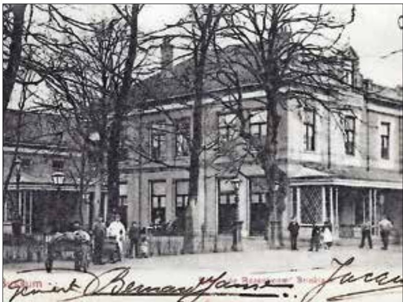
■ Herberg ‘De Rozenboom’ rond 1900.

zen naar de eerste TV uitzending vanuit Studio Irene gekeken. Vele bekende TV/popsterren waren tussen 1951-1980 vaak te vinden in ‘De Rozenboom’. Studio’s Irene, Eltetho en Vitus lagen om de hoek.