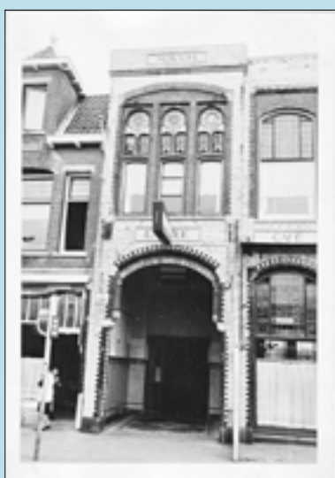
Novum met rechts café Karseboom

Hoe populair het bioscoopbezoek een eeuw geleden is blijkt