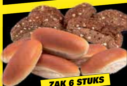
Molen-goud Meer-granen of Melk-boter Puntjes