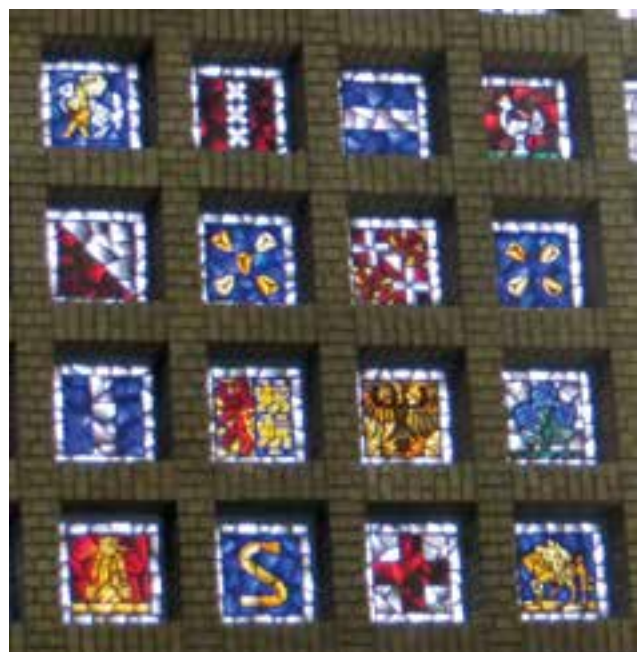
In de hal van NS station Naarden-Bussum.

Voor de geschiedenis van Bussum en Muiderberg kijken we maar honderd tot tweehonderd jaar terug. De historie van de vestingstadjes Naarden en Muiden is vele eeuwen oud. De sporen die de natuur en mensen in de landschappen hebben achtergelaten zijn soms recent en elders weer van lang geleden. Gebouwen, villa's, (water)wegen, en mensen die in Gooise Meren wonen, werken en recreëren zijn ook onderwerpen waar je aan kunt denken. Bijvoorbeeld met bijzondere details of juist royale overzichten. Zo maar wat tips. Heb je recente foto's of ga je nu op pad om foto's te maken? Ze zijn welkom!