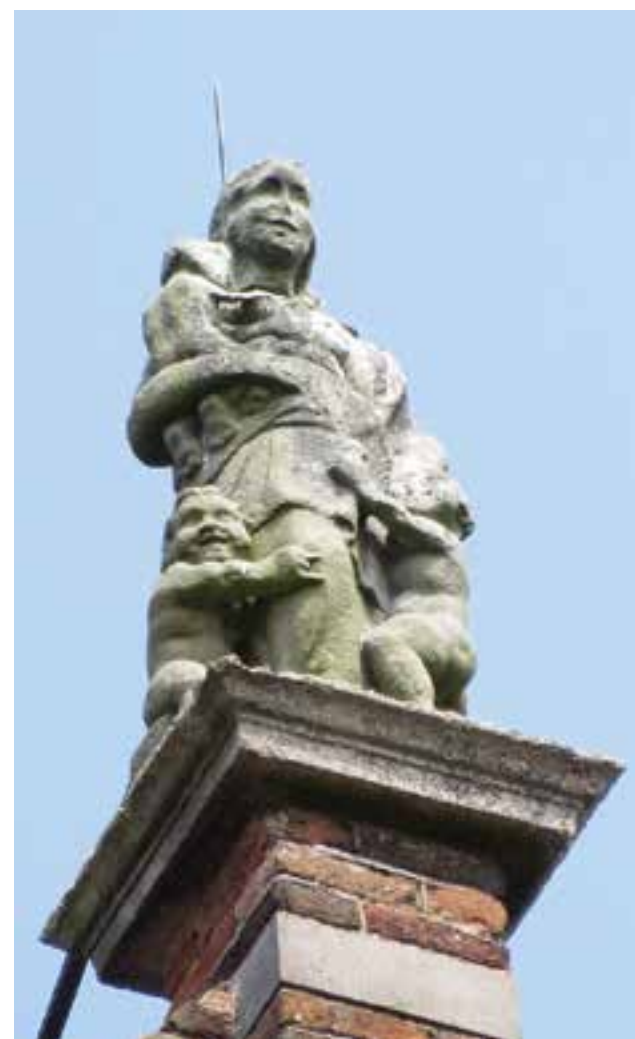
De liefde. Op geveltop van Raadhuis Naarden.