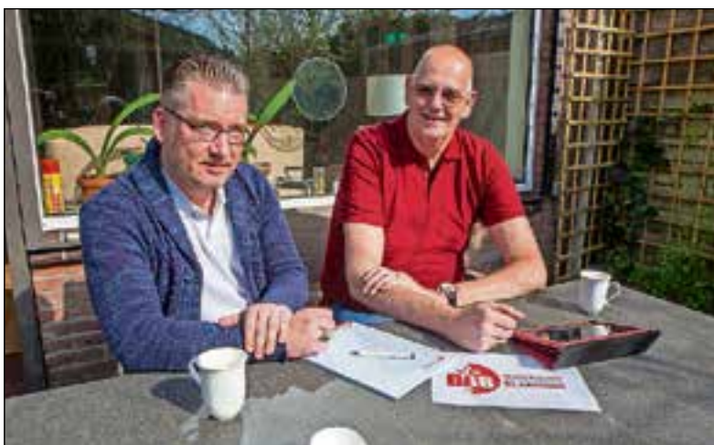
DAB wil op een andere manier politiek bedrijven.

"En voor alle duidelijkheid, wij zijn straks niet belangrijk. Dat zijn de leden. Zij kunnen via onze web-