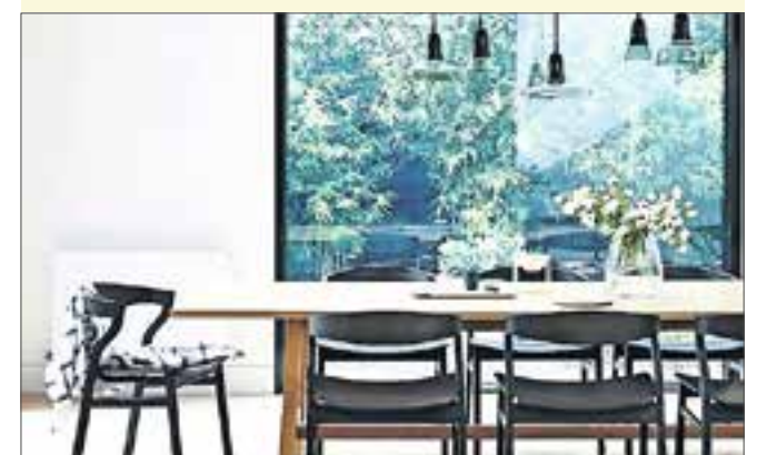
Donkere kozijnen halen buiten naar binnen.

Heb jij problemen met het kiezen van kleuren in je huis, je kunt mij altijd benaderen op desiree@deesstyling.com .