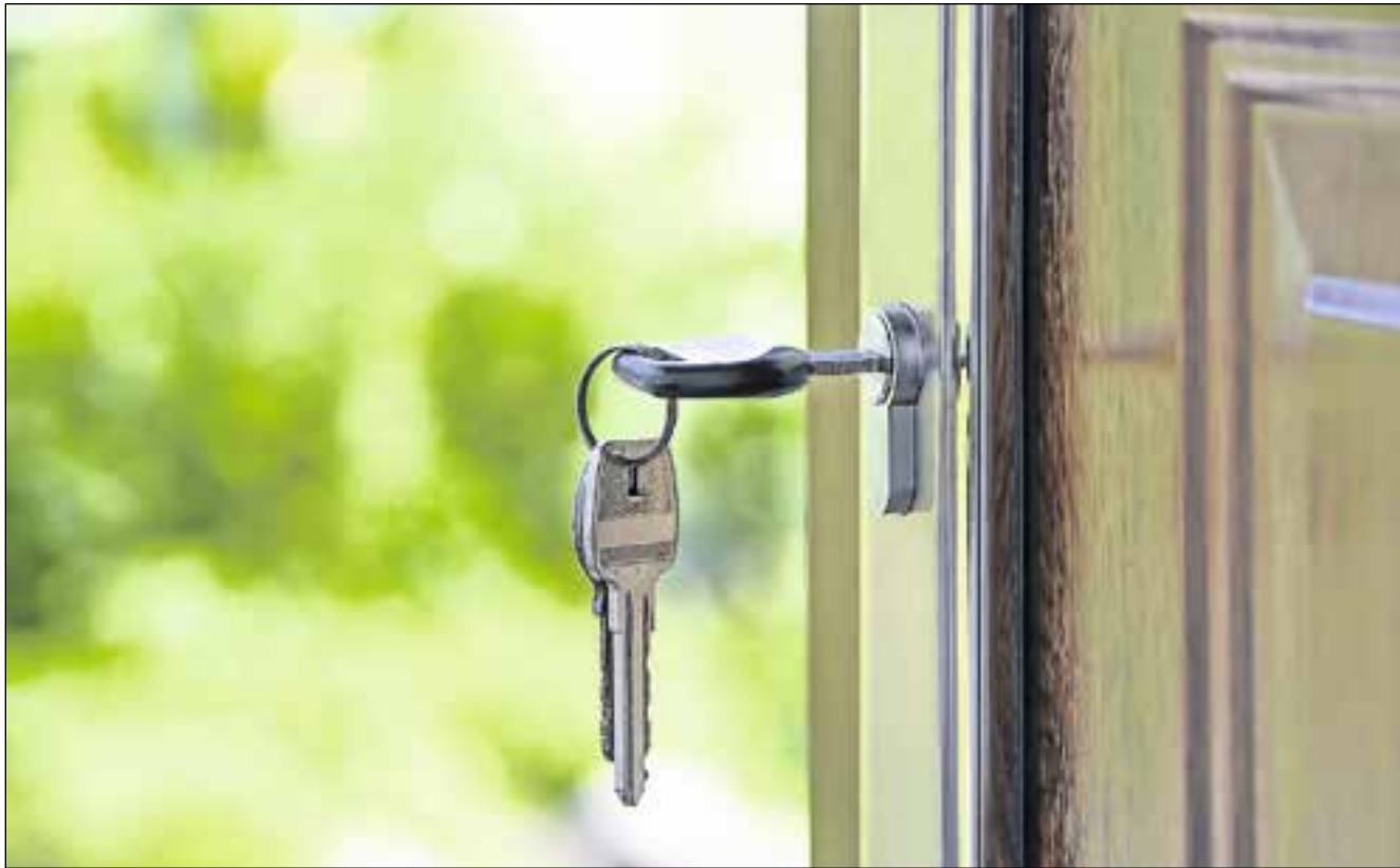
Zorgmedewerkers en familie moeten naar binnen kunnen, maar ongenode gasten niet.