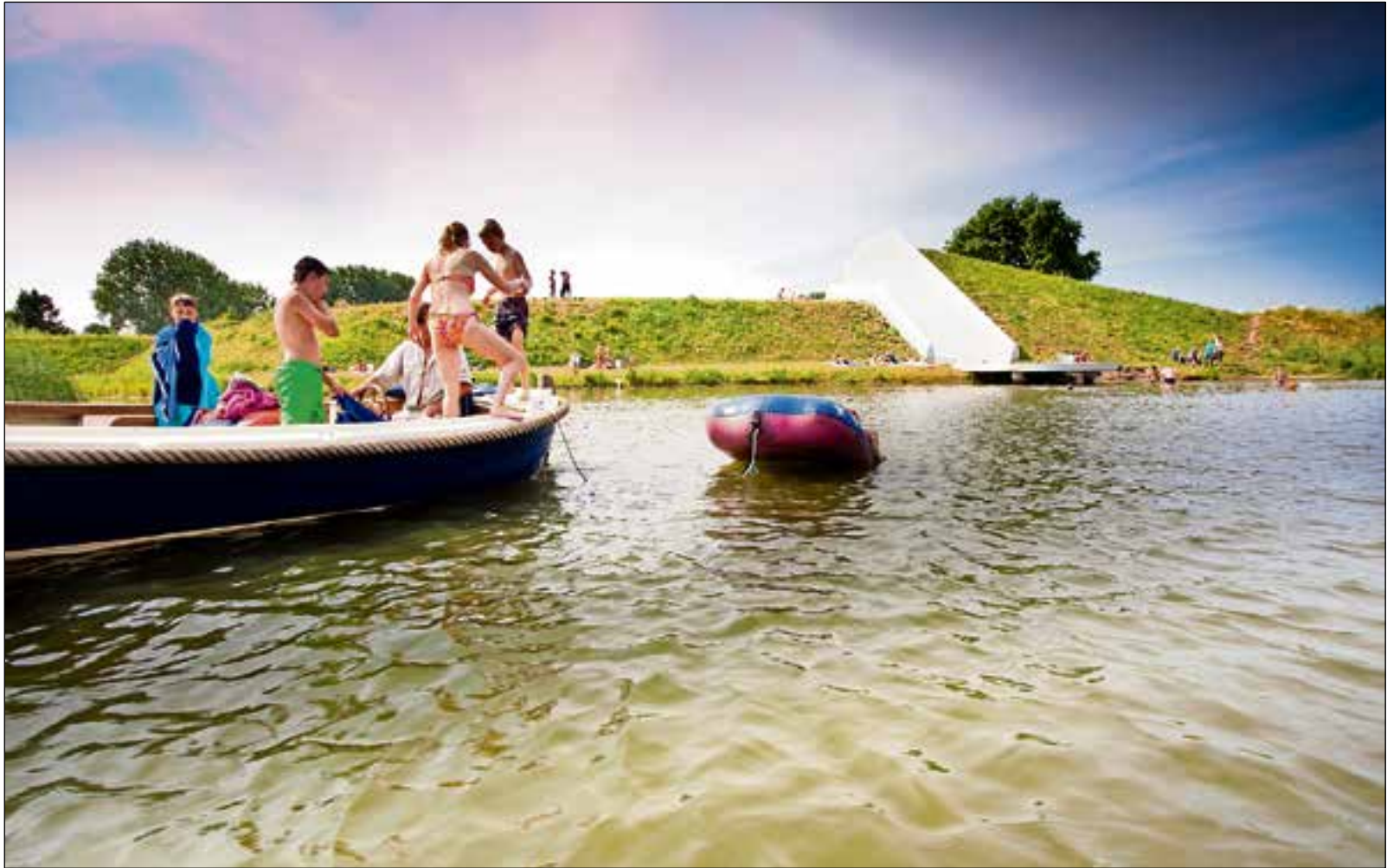
Nu wordt er zomers overal gezwommen in de Vecht. Zo veel mogelijkheden zijn er niet.

De wijk wordt in maximaal 10 jaar gebouwd en in die tijd moet de plas met alle stranden ook worden aangelegd. Er komt halverwege de Korte Muiderweg een doorksteek naar de Vecht voor boten. Die kunnen daar dan de plas op en af. Naast een plas en een stadsstrand krijgt Weespersluis twee basisscholen en een buurtsuper.