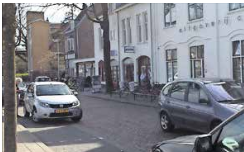
Parkeren langs de straat gaat verdwijnen.

Daarnaast worden er ook maatregelen genomen voor de vrachtwagens van de Action. De laad-en-lostijden worden nog verder aangepast zodat de vrachtwagens alleen mogen komen laden en