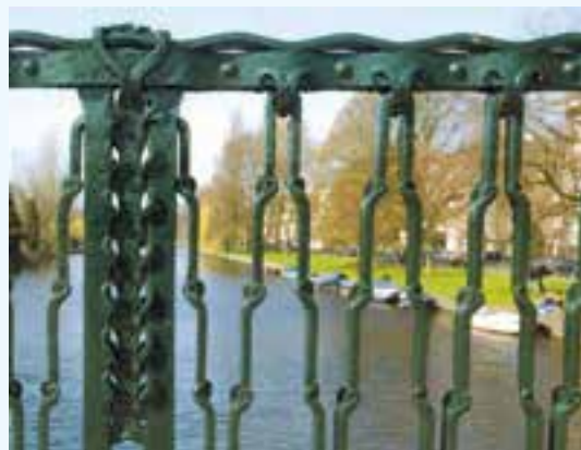
Amsterdamse school in Amsterdam