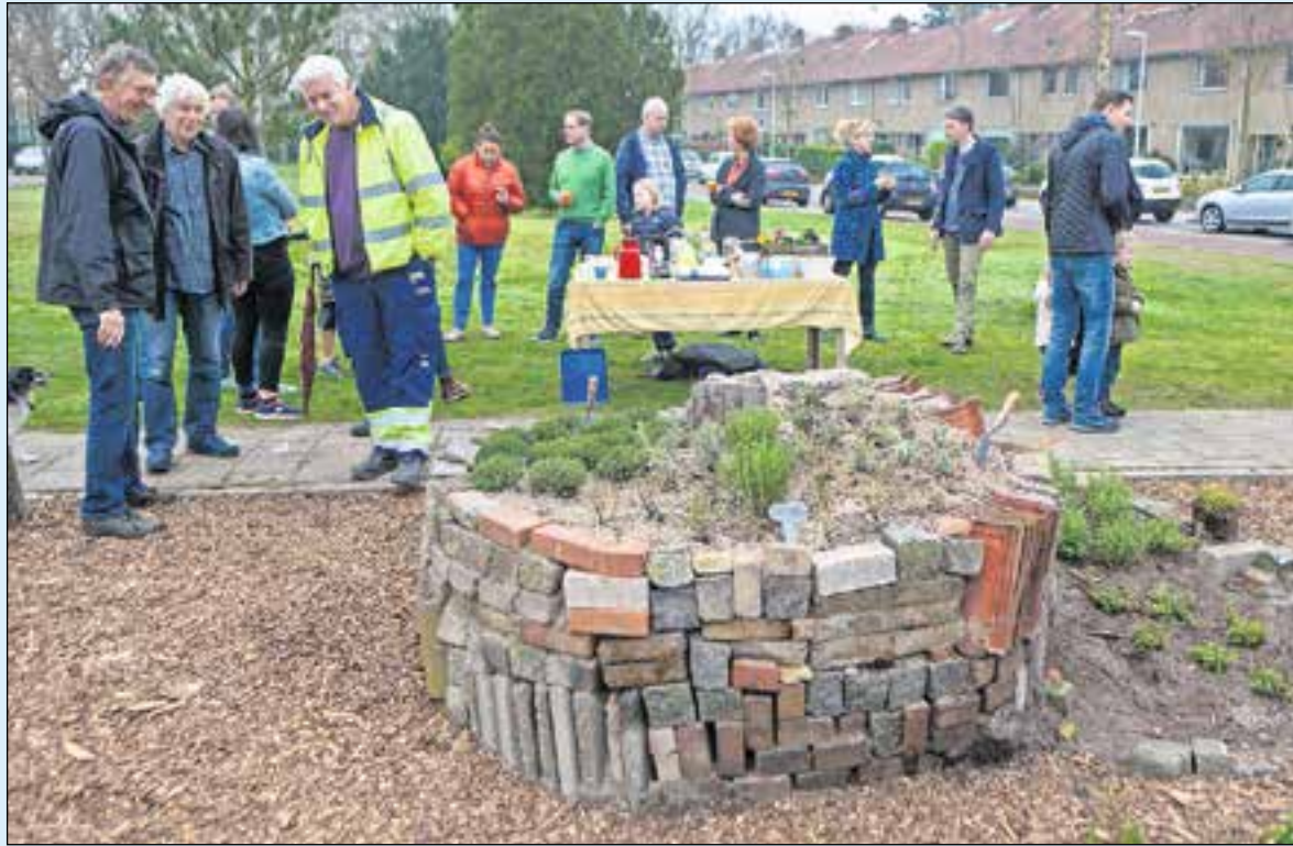
Kruiden plukken uit de buurttuin voor je eigen keuken.

Het tuintje wordt beheerd door de bewoners, de gemeente helpt met raad en daad.