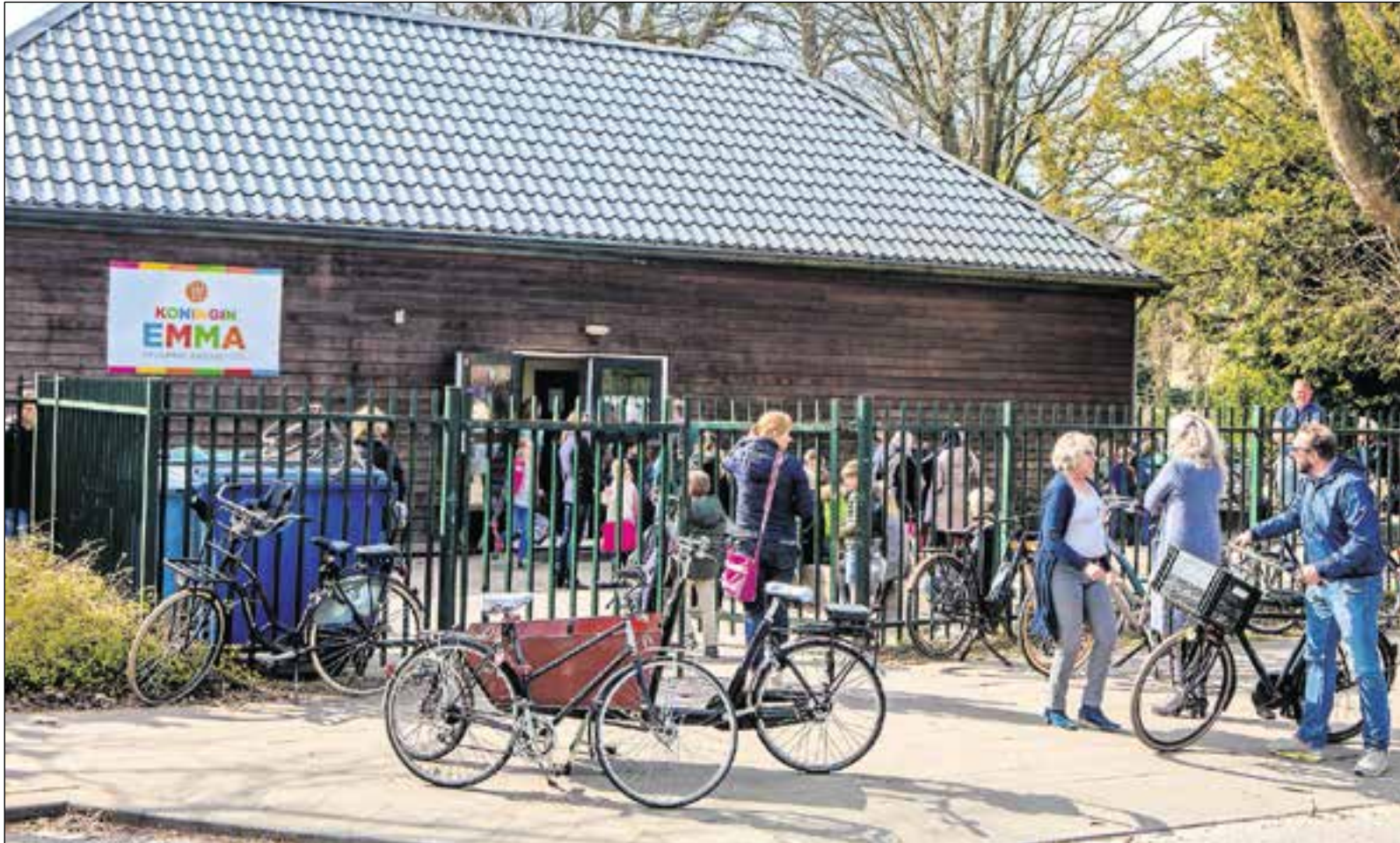
Verhuizing kan niet snel genoeg komen voor de middenbouw aan de Slochterenlaan.