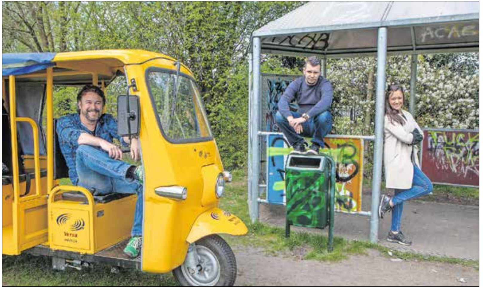
Gezamenlijke aanpak van jeugdoverlast.

De gezamenlijke aanpak bestaat uit een aantal zaken, waaronder