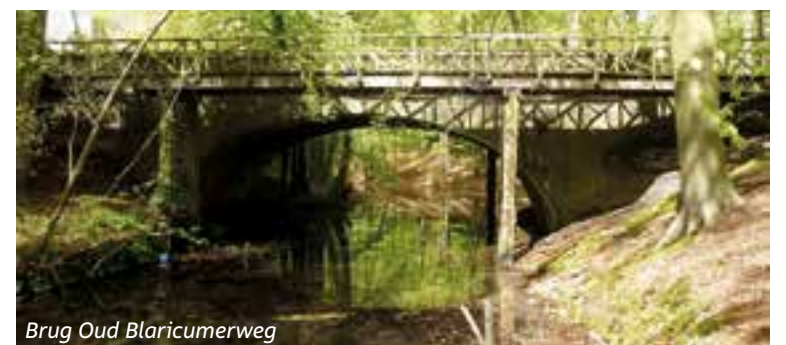
Brug Oud Blaricummerweg

Het college heeft door een extern bureau onderzoek laten doen naar de gang van zaken bij de renovatie van de brug Oud Blaricummerweg. Deze avond worden de resultaten van het onderzoek gepresenteerd. De volledige agenda en bijbehorende stukken van de Politieke Avond van 5 april vindt u op bestuur.gooisemeren.nl .