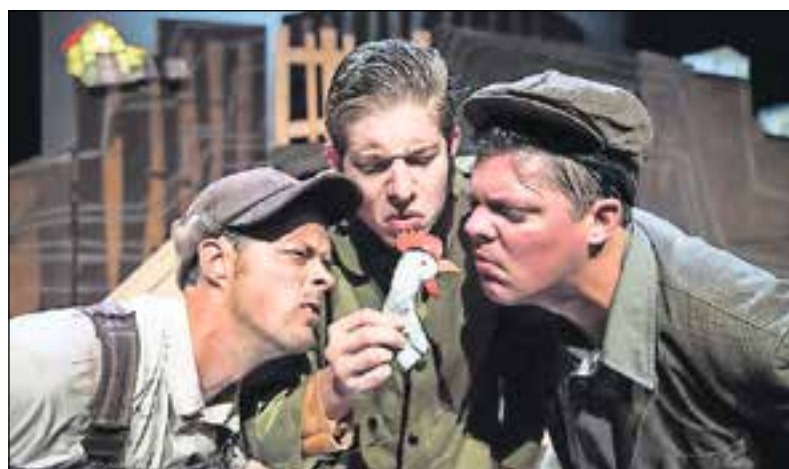
'De Fantastische Meneer Vos'.

Meneer Monster speelt deze show naar het boek van Roald Dahl. Het verhaal gaat over een vos die de boeren uit de buurt besteeft. Deze familievoorstelling (vanaf 4 jaar) is op zondag 9 april te zien om 11.00 en om 14.30 uur in Spant! Bussum. Wie kaartjes wil winnen kan mailen naar prijsvraag@spant.org onder vermelding van 'Fantastische Meneer Vos'. Over de uitslag kan niet worden gecorrespondeerd.