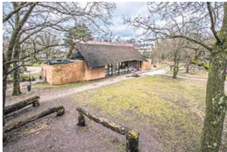
Heidezicht ligt er nu nog verlaten bij.

Het restaurant van Heidezicht blijft nog wel gesloten. Er wordt