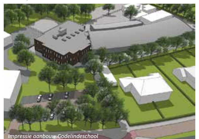
Impressie aanbouw Godelindeschool

Het bestemmingsplan staat drie bouwlagen toe, maar het worden er twee. Naar verwachting kan de bouw in september starten. Dan kan het gebouw na de zomervakantie van 2018 in gebruik worden genomen en zijn de leerlingen niet langer over meerdere locaties in Naarden verspreid.