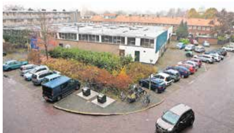
De loods aan de achterkant.

Met de extra vloeroppervlakte voor Deen hebben de bezwaarmakers geen problemen, wel met de grotere parkeerplaats achter het pand. De bewoners vrezen dat hun woongenot wordt aangetast: het verstoort de rust en zorgt voor andere overlast. Het duurt nog wel even voordat de verbouw van de supermarkt echt van start gaat. Als de supermarkt de plannen af heeft, worden die