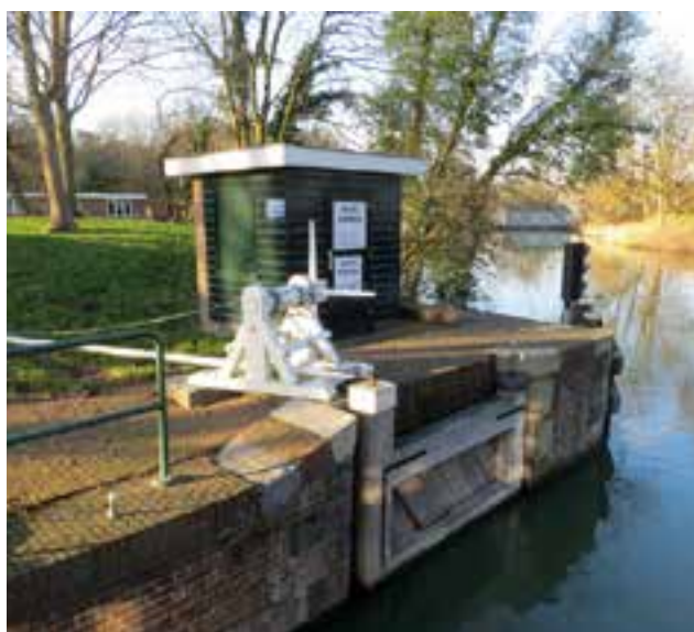
Sluisje naar de Muidertrekvaart.

Dus, wat te doen? Maak foto's ergens in Gooise Meren, die je treffend of waardevol vindt. Een foto waar je een speciale herinnering aan hebt of een foto die een bijzonder betekenis voor je heeft. Met mensen of kinderen erop maakt een foto vaak nog aantrekkelijker. Denk daarbij wel aan toestemming van degenen die er op staan. Ook foto's die je eerder hebt gemaakt, maar wel na 2015, kunnen meedoen. De grootte moet minimaal 1 MB zijn. Geef een beschrijving bij elke foto in minder dan 100 woorden.