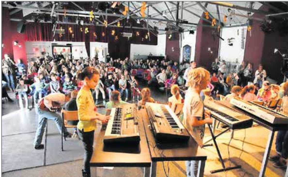
Zaterdag open dag bij de Gooische Muziekschool met presentatie, workshops en optredens.