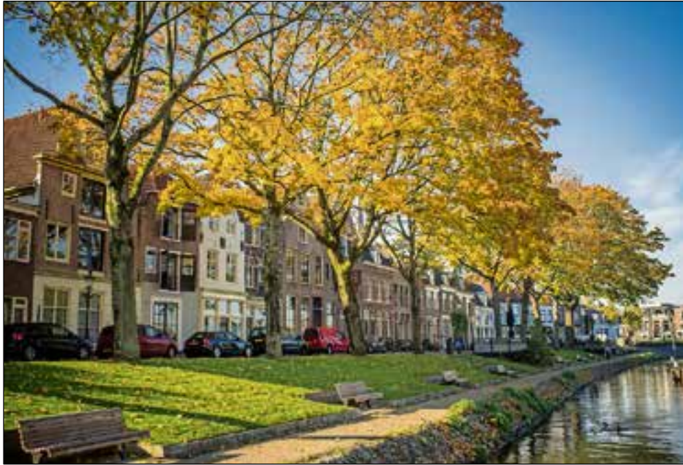
Okergeel, inspiratie uit de natuur voor je interieur.