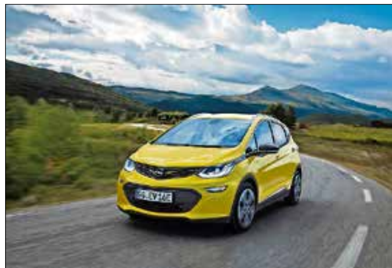
De Ampera-e heeft een actieradius waar je mee thuis kunt komen.

De 4,17 meter lange Opel Ampera-e is ook erg ruim. Het batterijpakket is onder de vloer gemonteerd, zodat het interieur onverminderd ruimte biedt voor vijf personen.