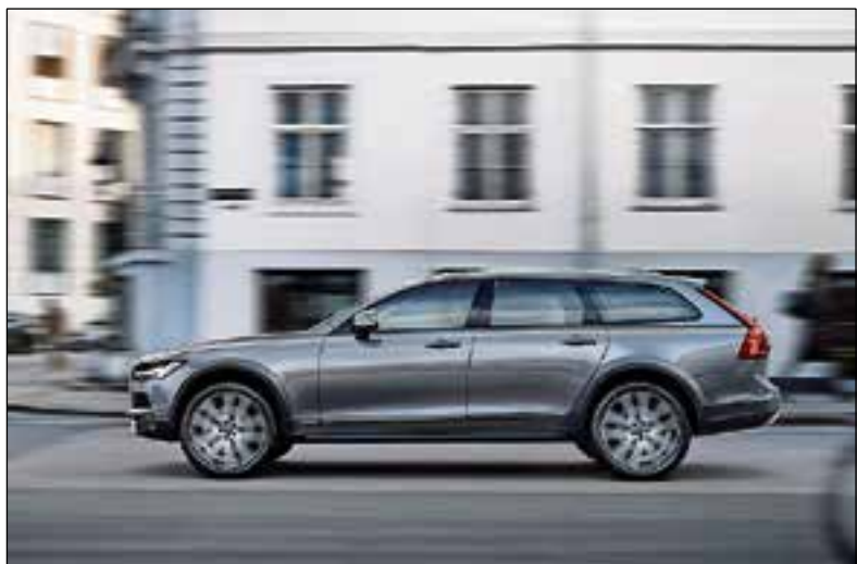
Luxe SUV in verfijnde, elegante Estate-body.

De carrosserie van de V90 Cross Country illustreert het krachtige en dynamische karakter van de luxueuze SUV. Daarbij kan de klant kiezen voor zowel een stoere als een elegante detailafwerking. Het design van een Volvo Cross Country is meer dan alleen 'styling'. De verrassende, intrigerende combinatie van een krachtige, stoere body en een luxueus interieur met een Scandinavische sfeer is geheel in lijn met de traditie van Volvo's Cross Country-modellen. Maar nu verpakt in een verfijnde, elegante Estate-body.