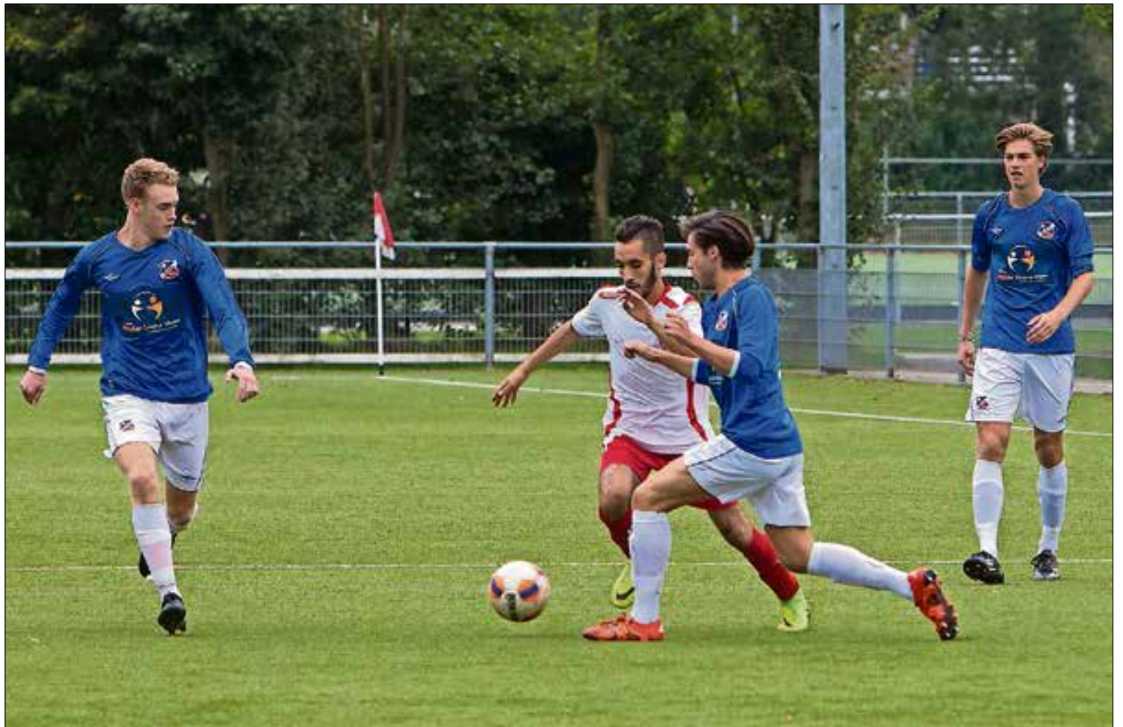
BFC was het hele duel beter dan NVC.

BFC heeft na afgelopen weekend nog steeds een puntje meer ver-