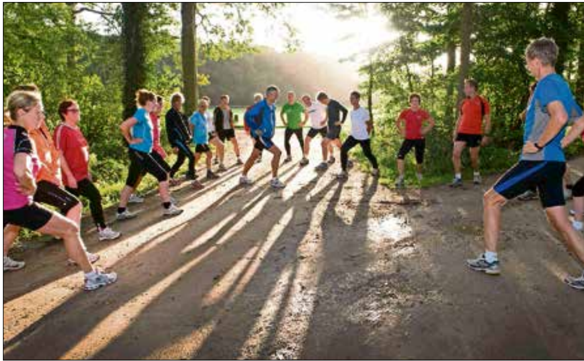
Op verschillende plekken starten weer hardloopcursussen voor beginners.