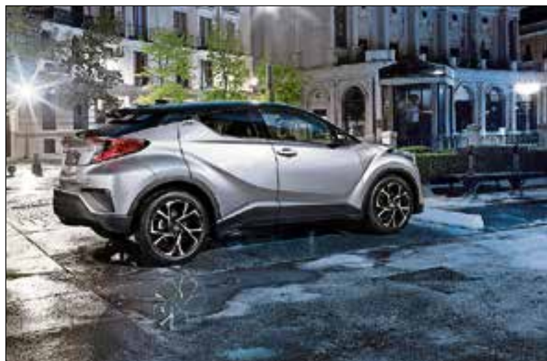
De uitdagende Toyota C-HR is nieuw.

en gunt een blik in de toekomst met de conceptbrandstofcelauto: de FCV PLUS.