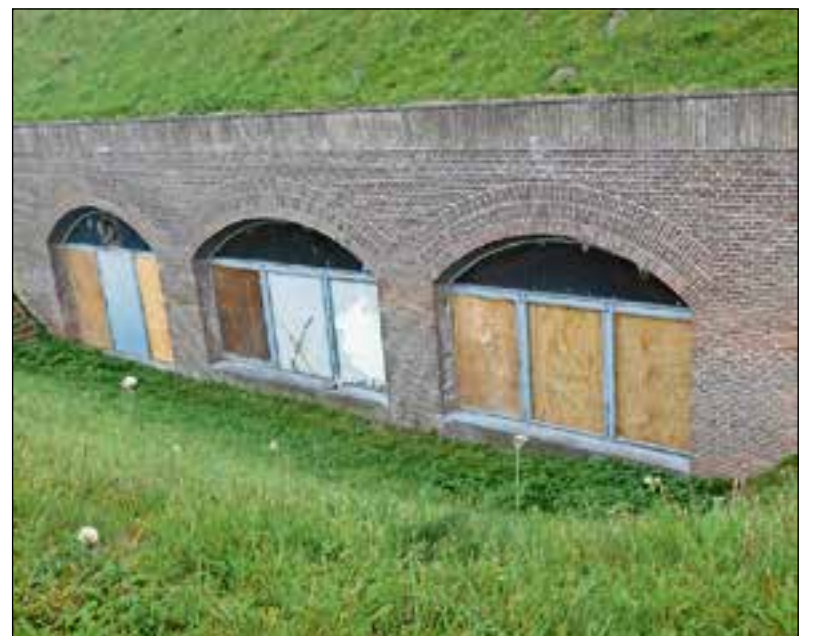
Vandalisme bij Bastion Oranje.