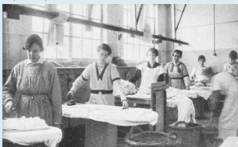
Strijkzaal van de Gooische.