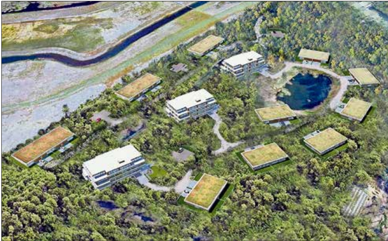
Landgoed Nieuw Cruysbergen staat synoniem voor 365 dagen vakantiegevoel.