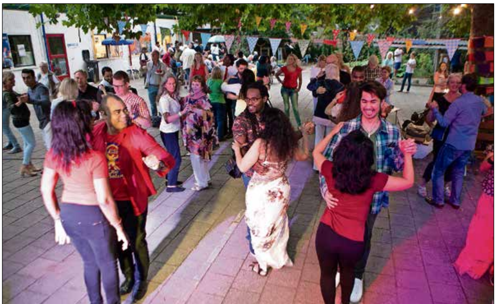
Leden van dansschool Esencia (links op de foto) verzorgden een workshop salsa.

Wie niet is geweest en benieuwd is naar de sfeer kan de foto's bekijken op de Facebookpagina van Elk Goois Matras Komt Van Pas.