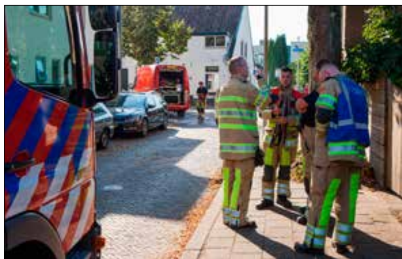
De twee brandjes waren snel geblust