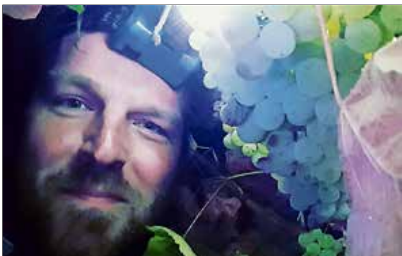
Druiven plukken, zeker ‘s nachts, is behoorlijk vermoetend.