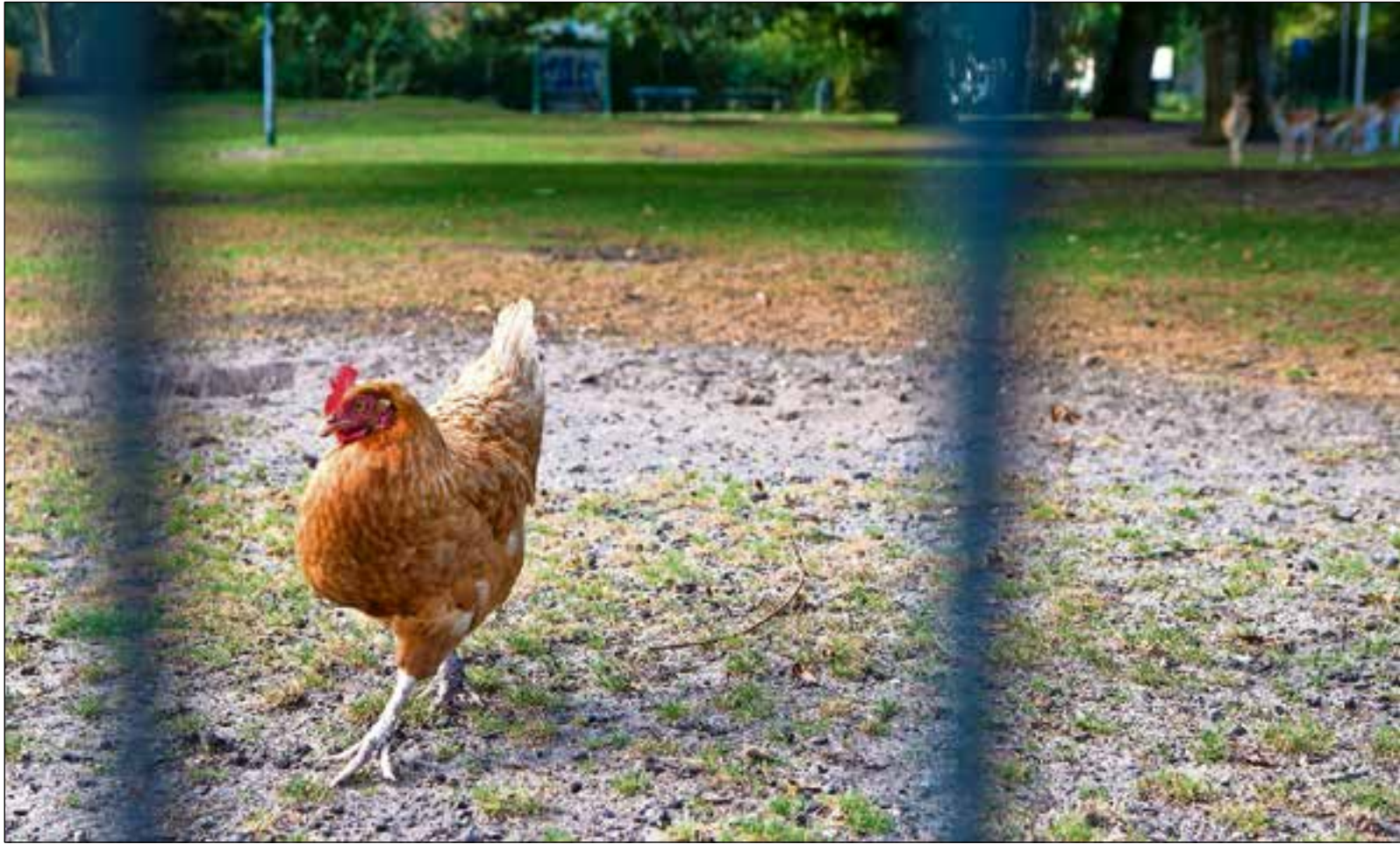
Nog geen week geleden wandelden er nog vele kippen rond.