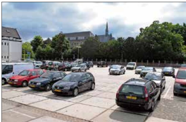
Plaats genoeg voor de schaatsbaan.

Er wordt momenteel hard gewerkt om de komst van de schaatsbaan naar de Veldweg verder te regelen. "We verwachten dat het goedkomt, maar de gemeente moet alles ook nog goedkeuren. Het voorstel moet nog