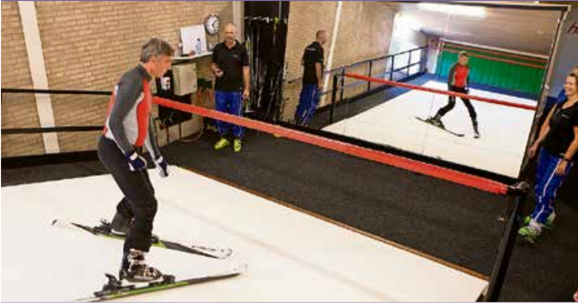
Oefenen op de rolbaan.