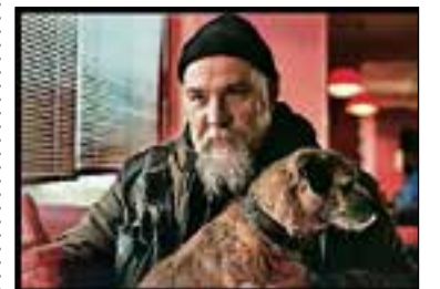
'Les Premiers les Derniers'.