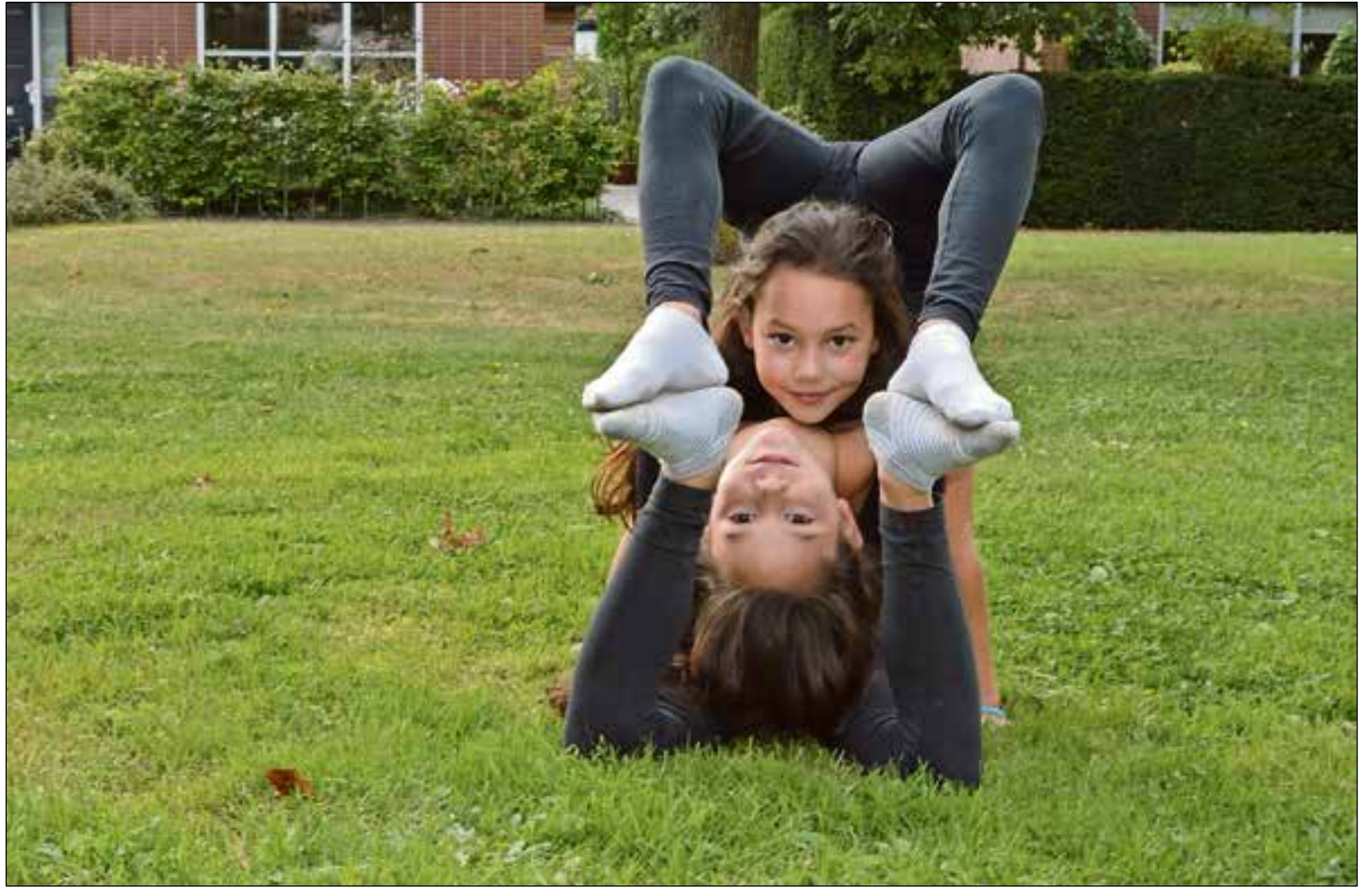
De tweeling is altijd in beweging.

Ook op school kan de vrolijke tweeling maar moeilijk stilzitten. Senna: “Ik val regelmatig van mijn stoel en mijn klasgenootjes