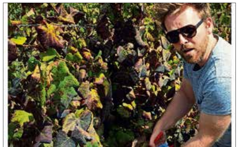
Noordelijker, bij Lissabon, kan overdag geplukt worden.