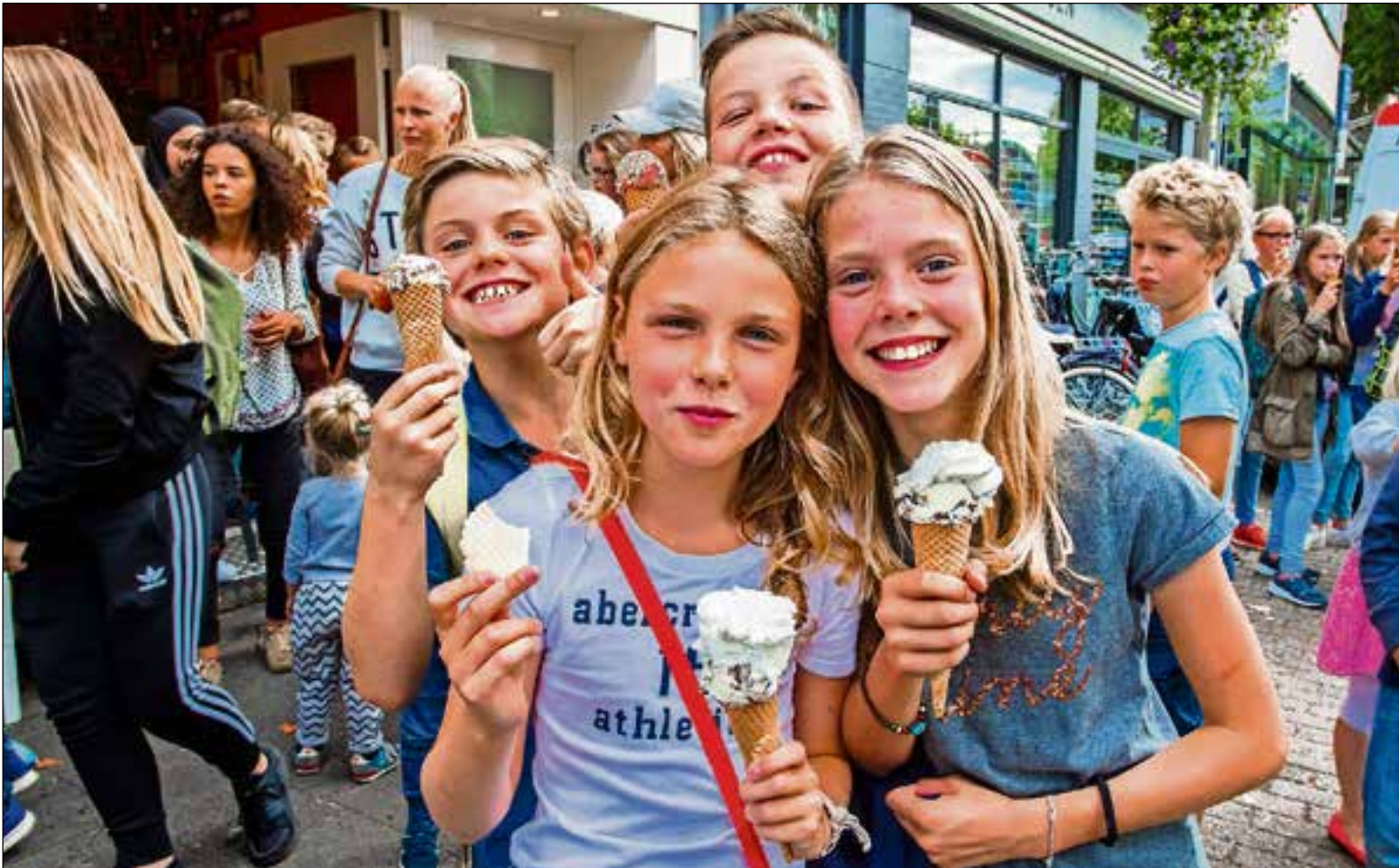
Genieten van gratis ijs!