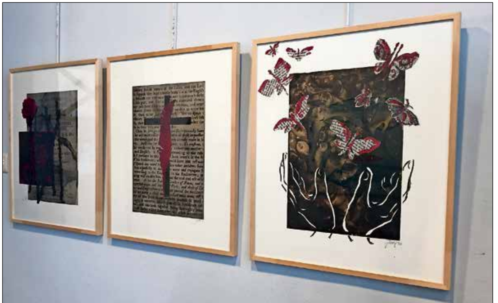
Moderne interpretaties gebaseerd op het leerboek van Comenius uit 1658.