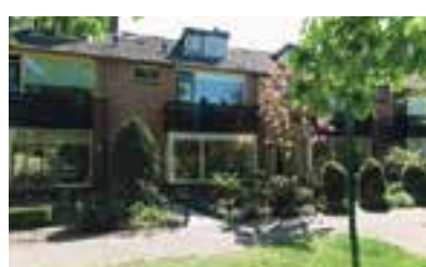
Patrijzenhof 172 Eemnes Vraagprijs € 280.000 k.k.