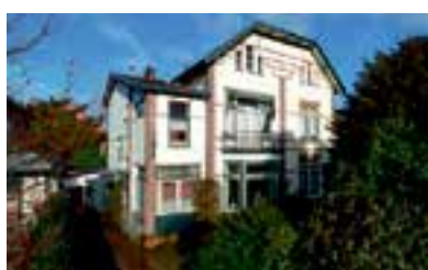
Graaf Florislaan 62 Bussum Vraagprijs € 645.000 k.k.