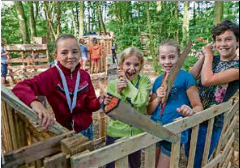
Samen hutten bouwen.