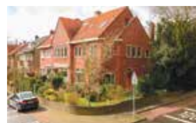
Gerard Doulaan 10 Hilversum Vraagprijs € 475.000 k.k.

Bekijk het totale aanbod van de ruim 2000 huizen die te koop of te huur staan in Gooi & Vechtstreek op GooisWoonNieuws.nl