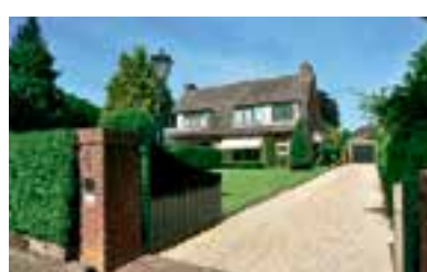
Melkweg 41 Laren nh Vraagprijs € 695.000 k.k.