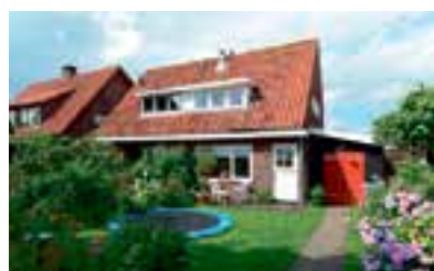
Herenweg 61 Ankeveen Vraagprijs € 259.000 k.k.