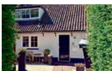
Oud-Loosdrechtsedijk 125 Loosdrecht Vraagprijs € 525.000 k.k.