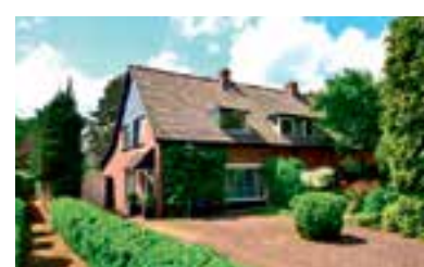
Meentzoom 67 Blaricum Vraagprijs € 559.000 k.k.