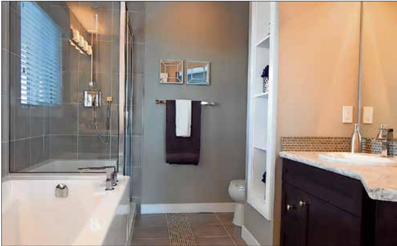
Als je je badkamer comfortabel inricht, beleef je er elke dag nog meer plezier van.