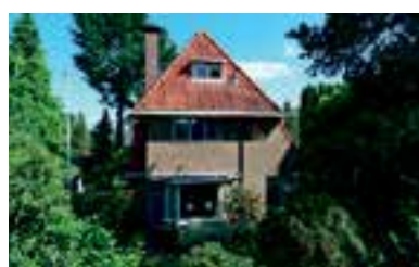
Berkenlaantje 22 Huizen Vraagprijs € 835.000 k.k.