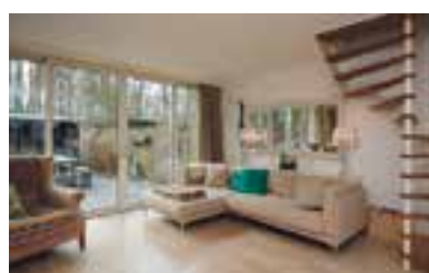
het Karveel 41 Muiden Vraagprijs € 339.000 k.k.