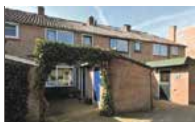
Prinses Marijkehof 100 Naarden Vraagprijs € 217.000 k.k.