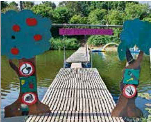
De toegang tot het eiland.