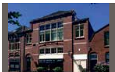
Noordereinde 37 's-Graveland Vraagprijs € 795.000 k.k.