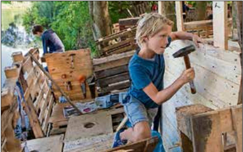
De mooiste creaties.