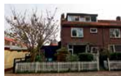
Nicolaas Maeslaan 1 Muiderberg Vraagprijs € 349.500 k.k.