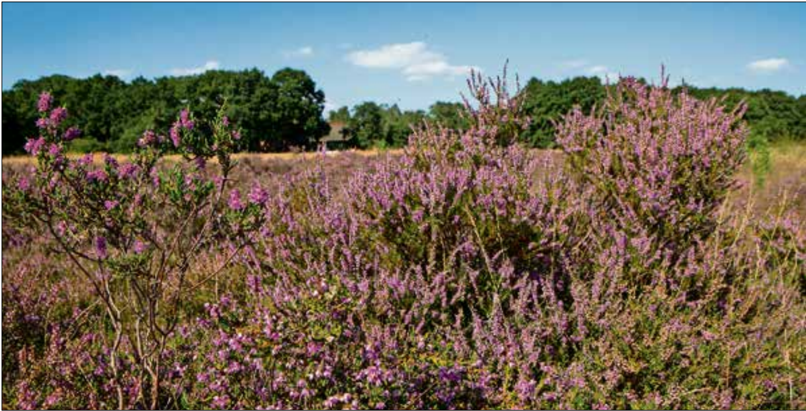
De Bussumerheide vol schitterende kleurstellingen.