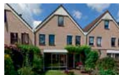
Lange Wetering 54 Nederhorst den berg Vraagprijs € 385.000 k.k.