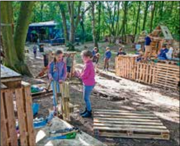
Mooie ruimte op het eiland.