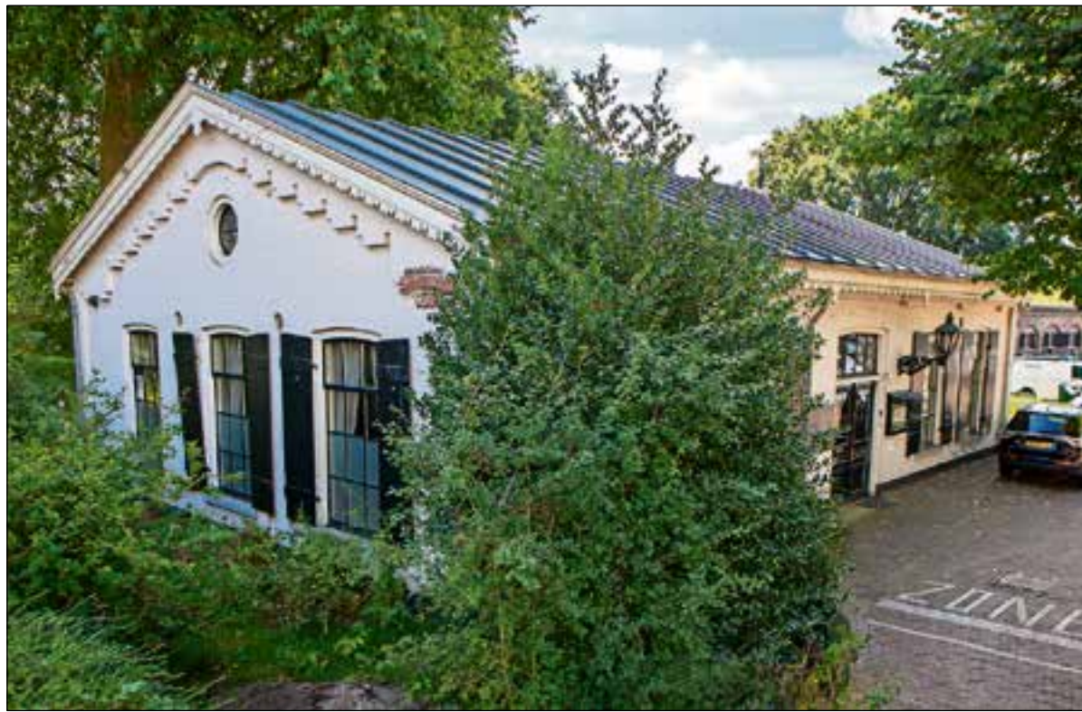
Gebouw De Hoed wordt een cultureel centrum.