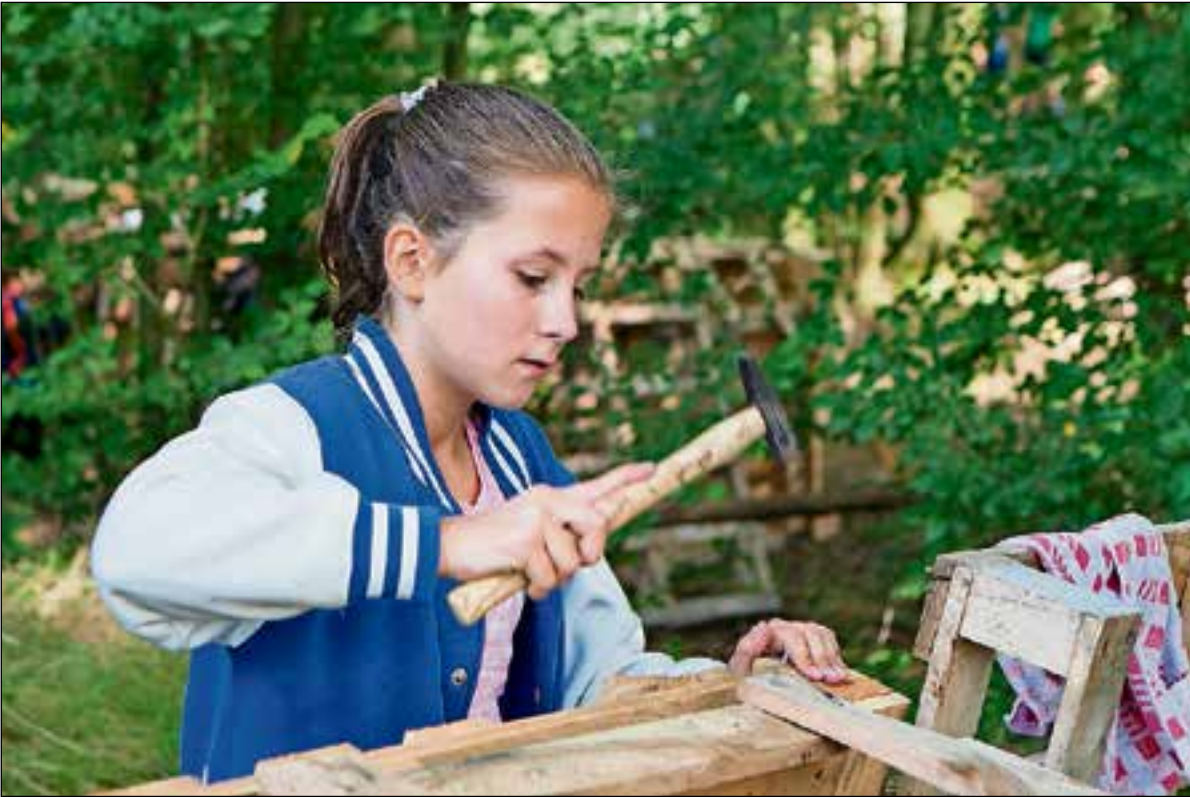
Voorzichtig met de hamer.