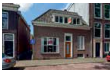
Hoogstraat 58 Weesp Vraagprijs € 417.500 k.k.