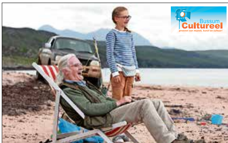
‘What we did on our holiday’.

Traditiegetrouw openen Bussum Cultureel, Filmhuis Bussum en de Tindal Stichting het weekend met een film in de open lucht. Op vrijdagavond 9 september staat het grote scherm weer klaar en wordt onder de sterrenhemel de humo-