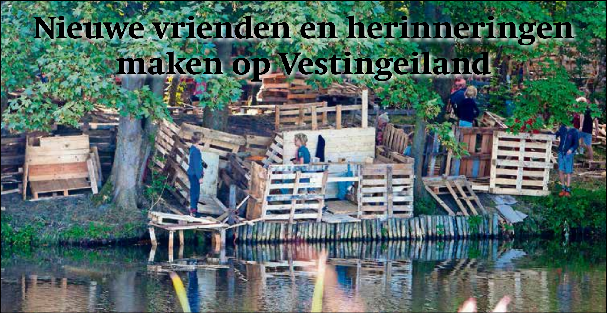
Het Vestingeiland 2016.