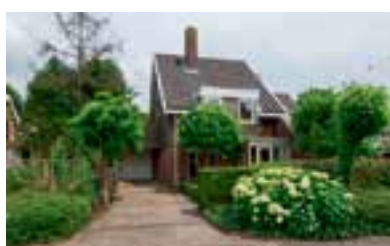
Petersburg 6 Nigtevecht Vraagprijs € 489.000 k.k.