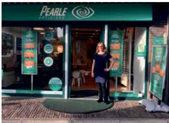
Pearle Opticiens, Veerstraat 2, Bussum

Vorige maand is Pearle Opticiens ook bestempeld tot beste optieketen van Nederland. "Onze deskundige opticiens en contactlensspecialisten staan altijd klaar, bijvoorbeeld voor een gratis professionele oogmeting".