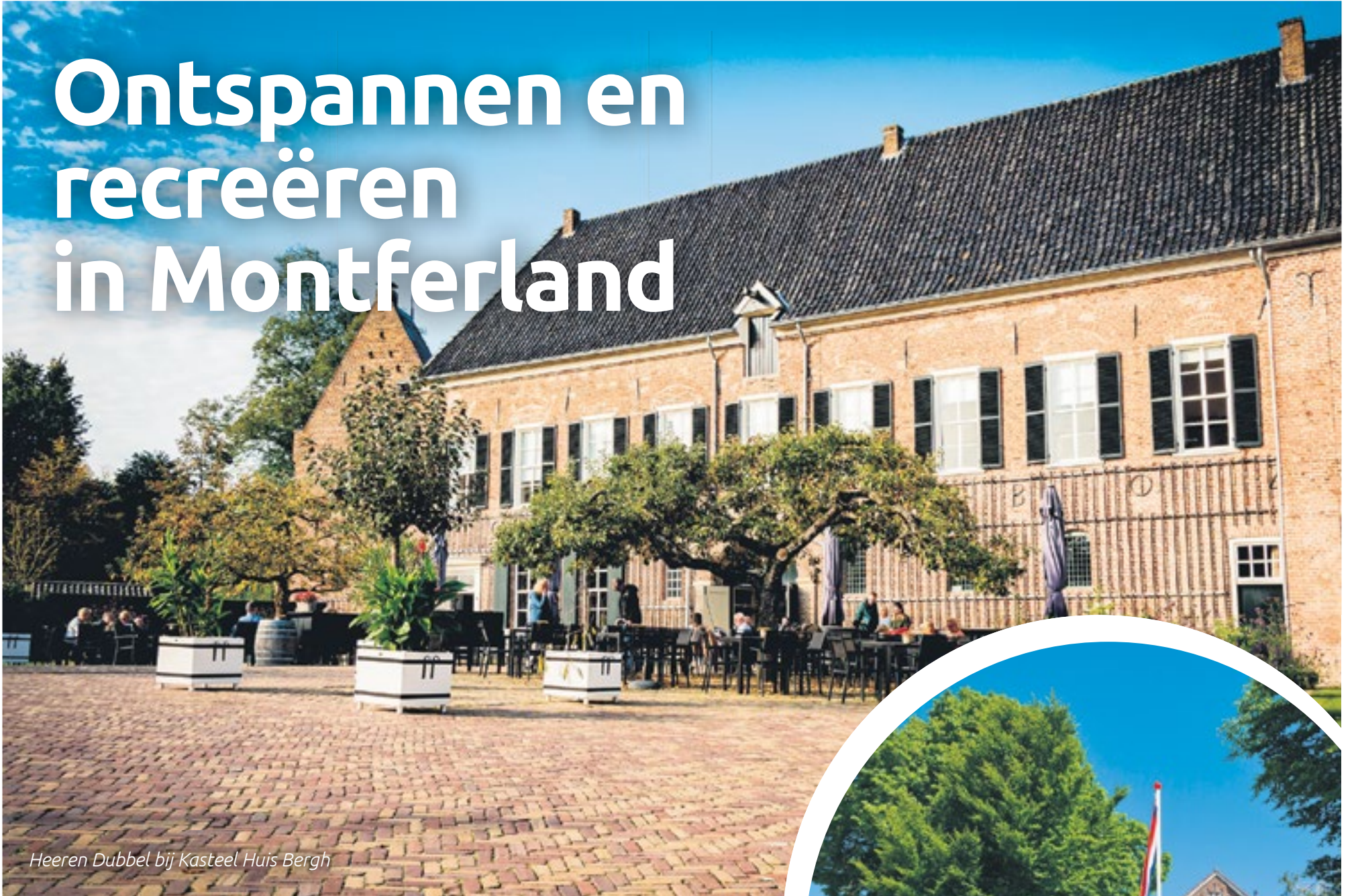
Heeren Dubbel bij Kasteel Huis Bergh

Montferlanders zeggen dat je nergens zo goed kunt ontspannen en recreëren als in Montferland. Daar zit wel een kleine kern van waarheid in, maar Nederland heeft wel meer mooie gebieden waar je heerlijk kunt ontspannen en recreëren. Montferland is echter wel één van de gebieden die je bijzonder mag noemen en waar het meer dan genoeg is om even tot rust te komen. Landelijk gelegen in het oosten van het land, schurend tegen de Achterhoek en het Duitse achterland. Bosrijk en heuvelachtig. Heerlijk watergebied waar het goed toeven is. Sfeervolle overnachtingsmogelijkheden en gezellige terrassen waar bezoekers hartelijk welkom zijn.