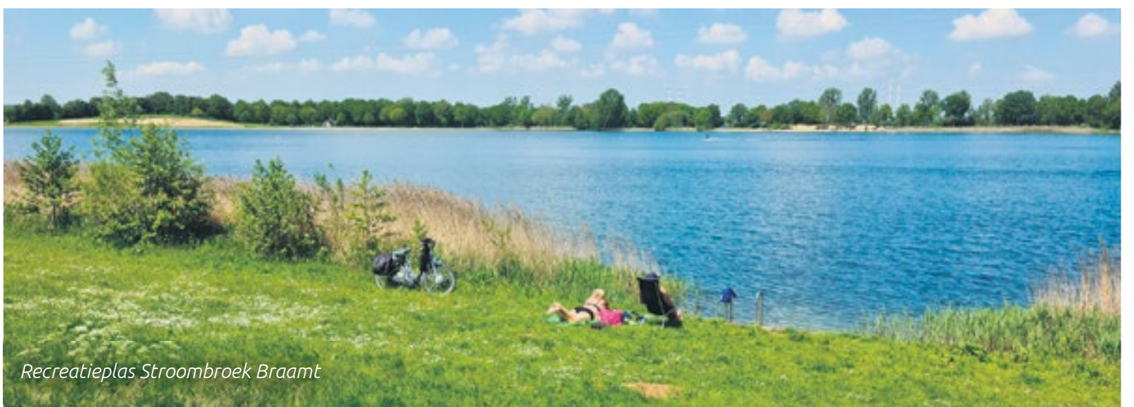
Recreatieplas Stroombroek Braamt

Dit alles onder het genot van een goed glas wijn, aanbevolen door de gastheer of gastvrouw, die met veel plezier en kennis van zaken de juiste combinatie vindt, voor ieders smaak.