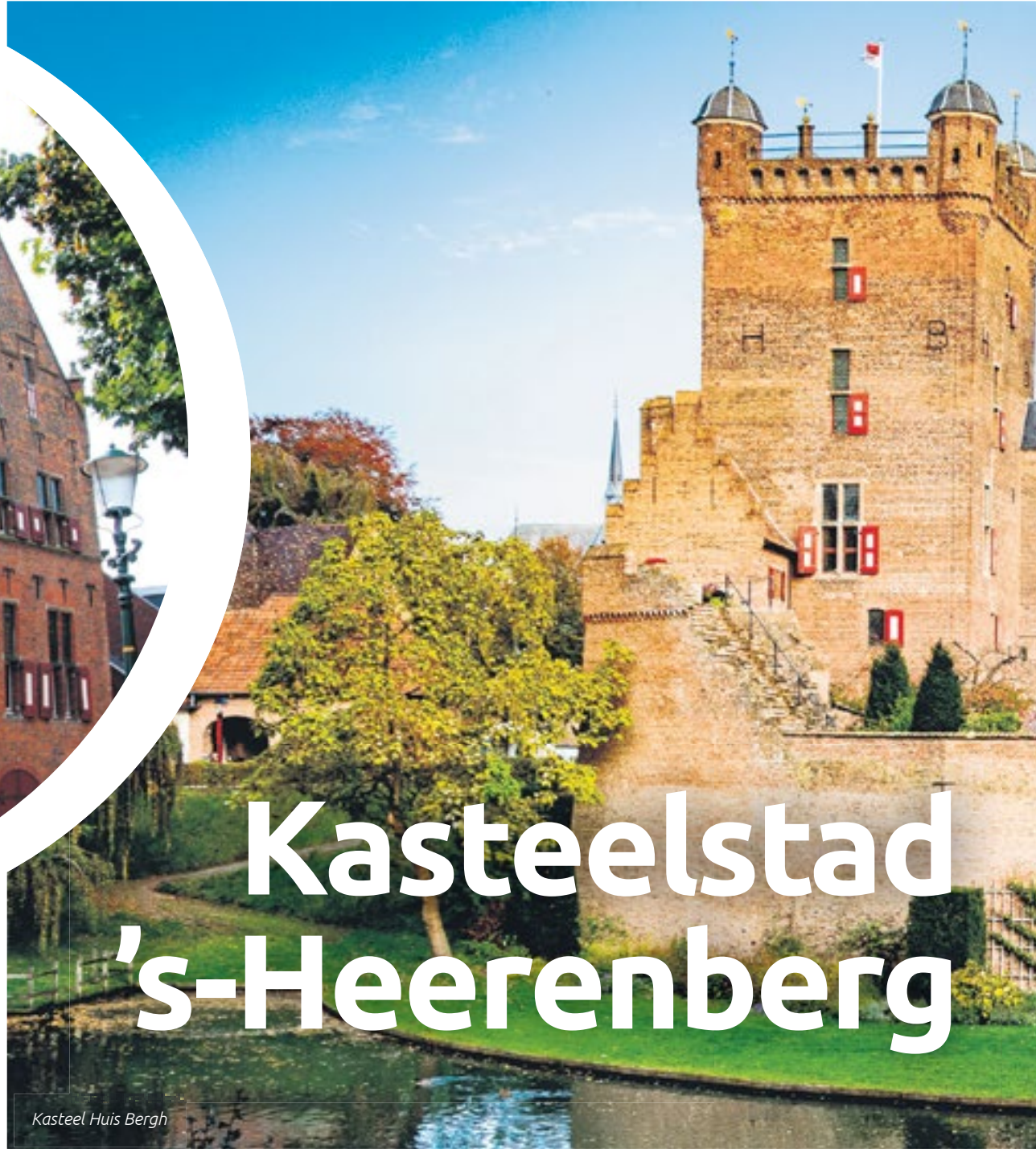
Kasteel Huis Bergh