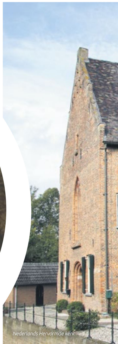
Nederlands Hervormde kerk