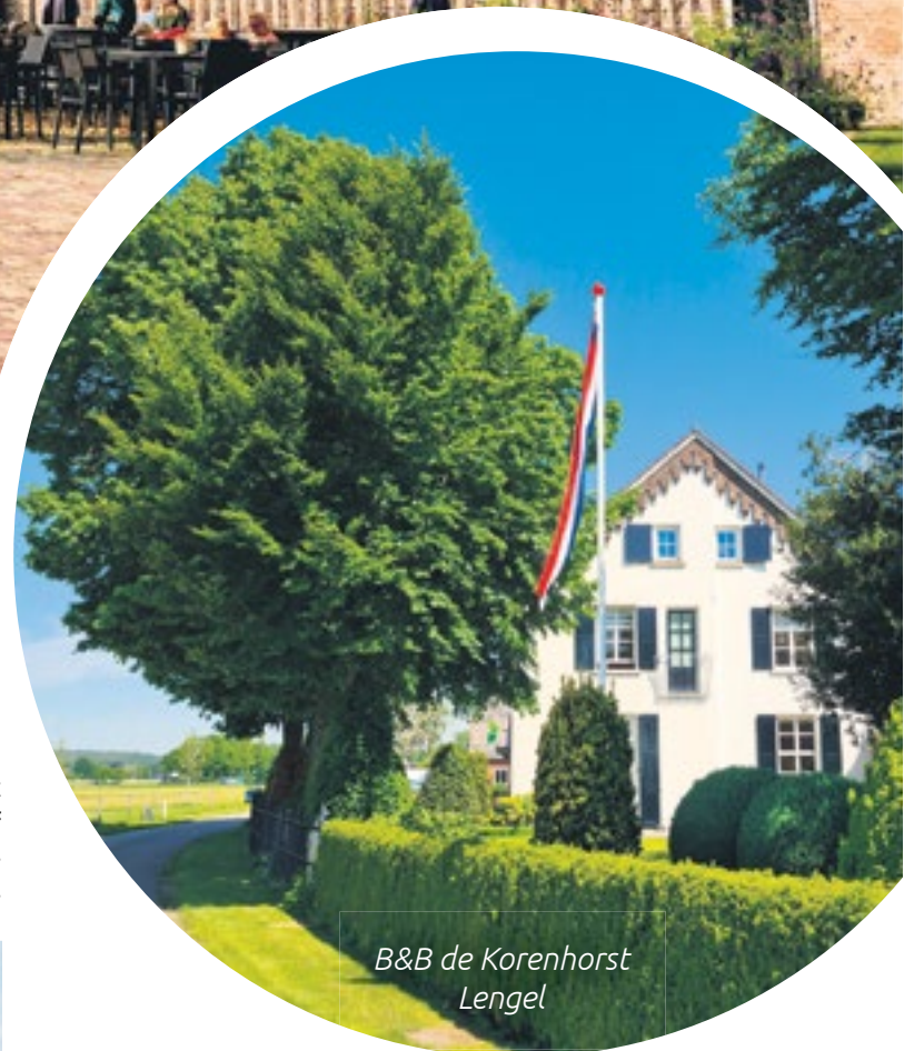
B&B de Korenhorst Lengel

ras, waar de eerste zonnestralen weer een mooie dag aankondigen, dat alles maakt dat iedereen er een aangenaam verblijf heeft en graag weer terugkomt.