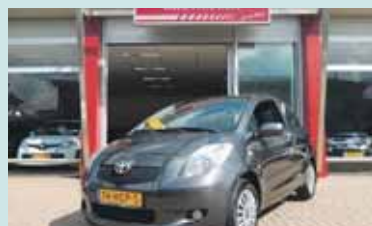
Toyota Yaris 1.3 16V VVT-I 2008 131.700 KM € 5.990,- Autobedrijf Jan Nijland 's-Heerenberg

Kijk op achterhoekauto.nl voor het volledige aanbod en alle specificaties