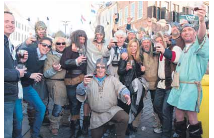
Deze Vikingen zijn elk jaar weer van de partij op de Bokbierdag.

ZUTPHEN - Op zondag 8 oktober is het weer Nationale Bokbierdag. In de binnenstad van Zutphen presenteert de Zutphense horeca enkele tientallen verschillende soorten bokbier. Bier van grote bekende brouwerijen en ambachtelijke gebrouwen bieren uit de regio.