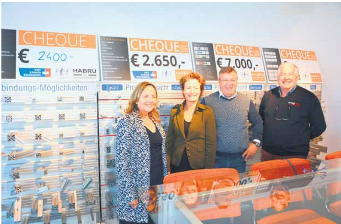
Overhandiging van de cheque in 2016.