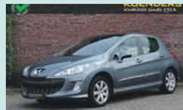
Peugeot 308 1.6 VTI 16V 5-DRS 2008 86.064 KM € 7.445,- Koenders Auto's Breedenbroek