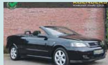
Opel 1.8 16V BERTONE ALS 2006 127.939 KM € 5.945,- Koenders Auto's Breedenbroek

Kijk op achterhoekauto.nl voor het volledige aanbod en alle specificaties