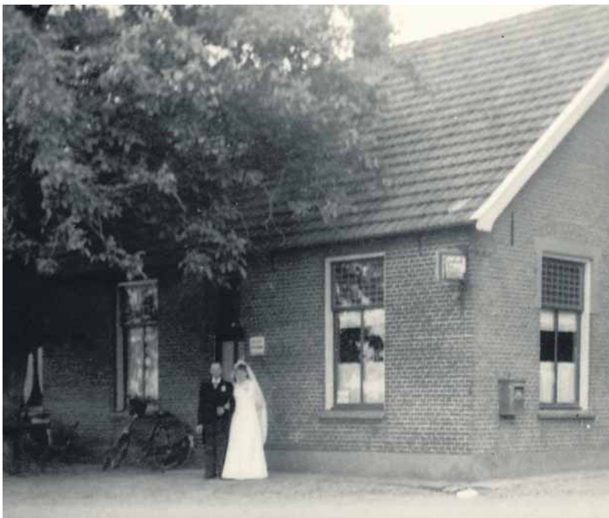
Café Schoemaker op de Oversluis met bruidspaar Schoemaker.

Er zijn die dag leden van de groep aanwezig om uitleg te geven en vragen te beantwoorden. Wie zelf