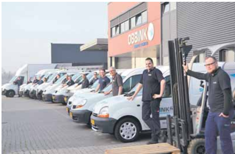
Obbink-servicemonteurs bij het Service Center in Lichtenvoorde.

Mocht het onverhoopt niet lukken om het probleem zelf op te lossen, dan kan men vanaf nu eenvoudig een service-aanvraag indienen op de servicewebsite. Obbink: "Via de servicewebsite is het ook mogelijk om de status van je reparatie in te zien. Daarnaast is de klantenser-