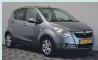
Opel Agila 1.0 EDITION 5- 2012 53.230 KM € 7.650,- Auto Westerveld Sinderen / Varsseveld