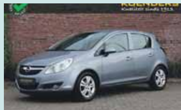
Opel Corsa 1.4 16V 5D WR 2009 134.632 KM € 6.945,- Koenders Auto's Breedenbroek