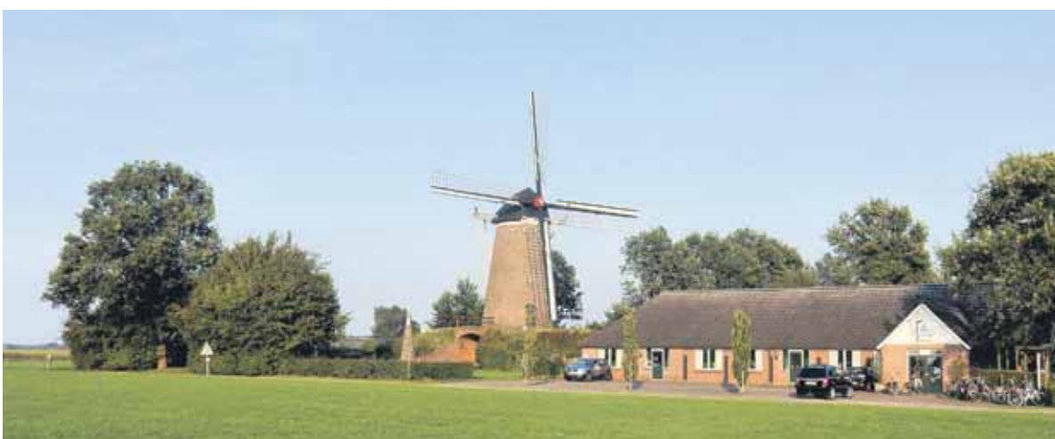
De molen bij Van Hal in Voorst.

Het vertrek- en eindpunt voor de drie routes is dit jaar bij restaurant Van Hal aan de Grensweg 13 in Voorst. De wandelaars kunnen starten tussen 9.00 en 13.00 uur. Langs de route is een pauzeplek ingelast bij Camping de Küper in Breedenbroek en voor deelnemers van de 16 en 21,5 km is er tevens een pauzeplek ingelast bij het Buurtschapshuus in Sinderen. Het