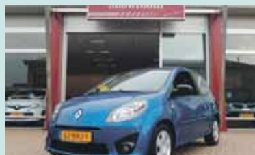
Renault Twingo 1.2 16V CO2 2010 130.006 KM € 4.990,- Autobedrijf Jan Nijland 's-Heerenberg