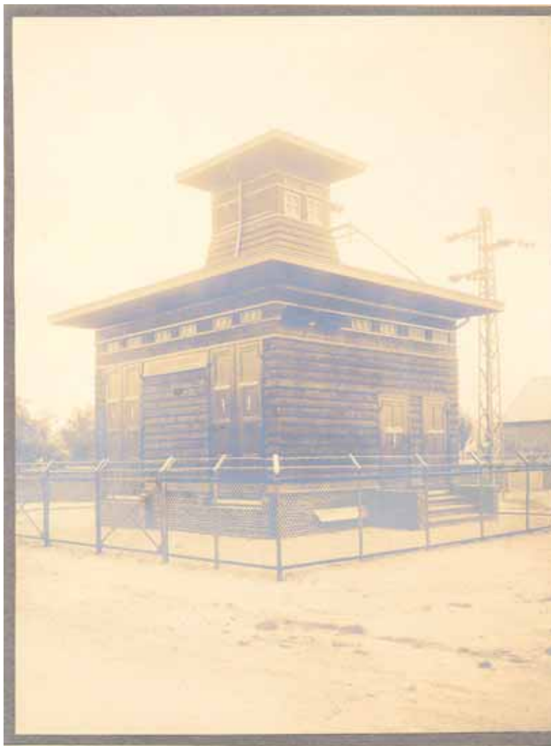
Het transformatorhuis in Megchelen.

Het PGEM-telefoonnet werd door het verzet in Gelderland gebruikt omdat de verbindingen via het openbare PTT-telefoonnet veelal tot stand werden gebracht door telefonisten, die konden meeluisteren. Hoewel het merendeel be-