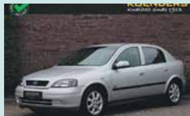
Opel Astra 1.6 5D NJOY 100% 2003 170.245 KM € 3.400,- Koenders Auto's Breedenbroek