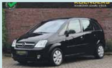
Opel Meriva 1.6 16V Cosmo 2005 183.791 KM € 3.800,- Koenders Auto's Breedenbroek