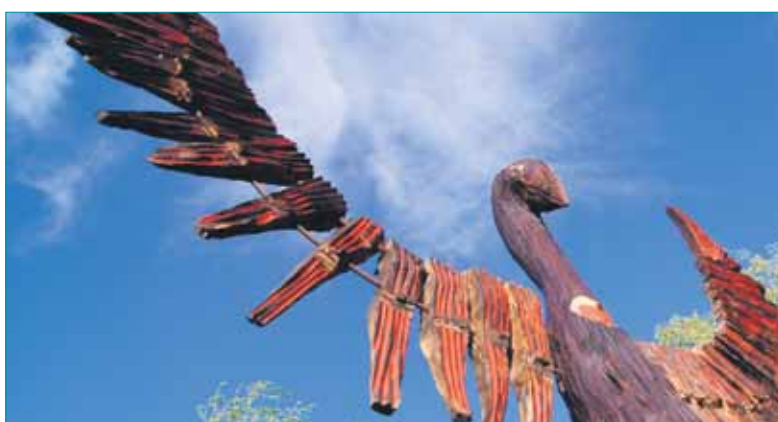
De vuurvogel, een beeld van Marjolein Markink.