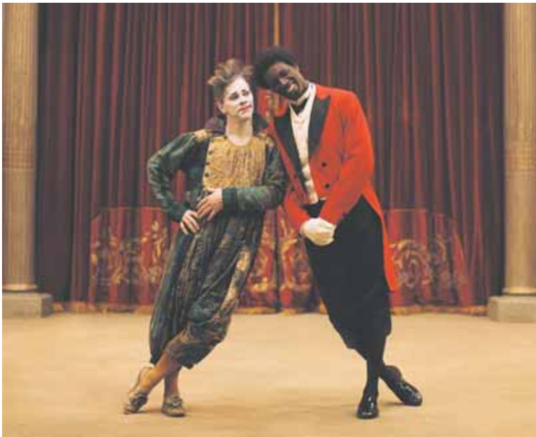
Monsieur Chocolat was een bezienswaardigheid in de Parijse kunstenaarswijk Montmartre.

Hierdoor worden deze medemensen ten onrechte gediscrimineerd