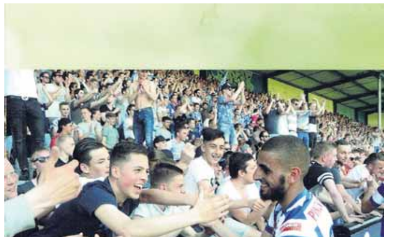
Cover van het nieuwe boek van Erik Hagelstein.

DOETINCHEM - Plotseling was hij daar weer: de boerenbruiloft op De Vijverberg. Na drie slechte seizoenen op rij beleefde de Doetinchemse voetbalclub in de knotsgekke voetbaljaargang 2015-2016 een heuse wedergeboorte. Het publiek stond achter de superboeren en ondanks de matige resultaten leeft de club weer in de Achterhoek.