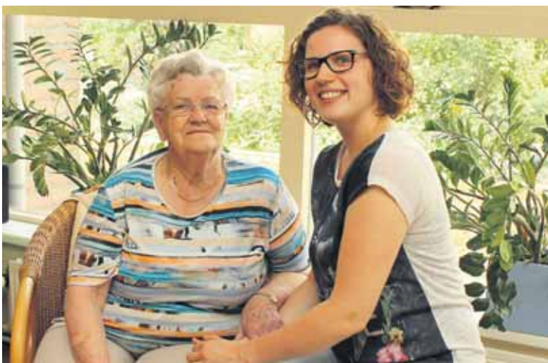
Vier zorgorganisaties onderzoeken krachtenbundeling.

ACHTERHOEK - Zorgorganisaties Azora, Careaz, De Gouden Leeuw Groep en Marga Klompé hebben het initiatief genomen de haalbaarheid van een gezamenlijke thuiszorgorganisatie te onderzoeken. De veranderingen en digitalisering in de zorg en toenemende eisen van zorgverzekeraars, zorgen ervoor dat budgetten (geleidelijk) kleiner worden en de werkgelegenheid op het spel komt te staan. De mogelijke krachtenbundeling zorgt voor betere vooruitzichten.