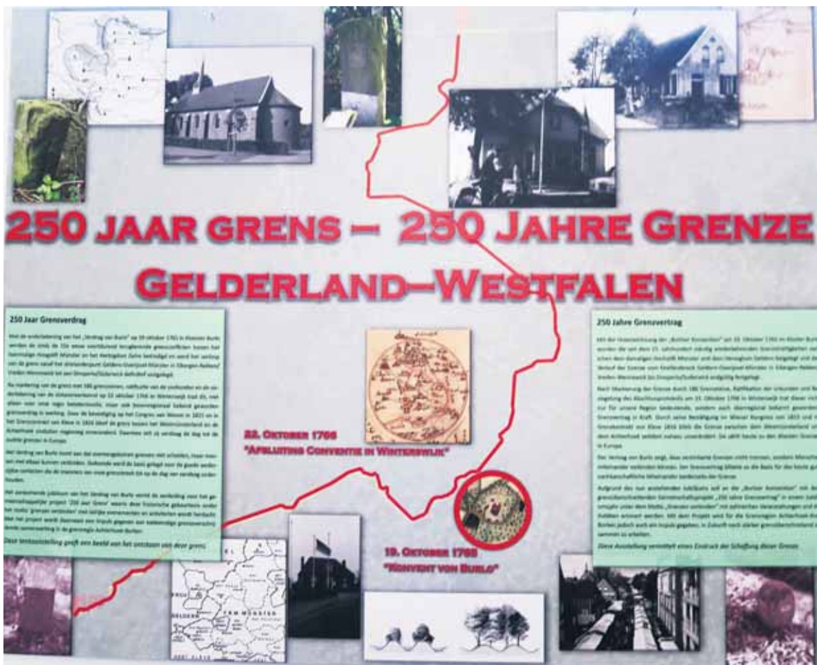
Eén van de vele informatieborden over ‘250 jaar grens’.

Na de officiële opening in Burlo is er de rondtrekkende tentoonstel-