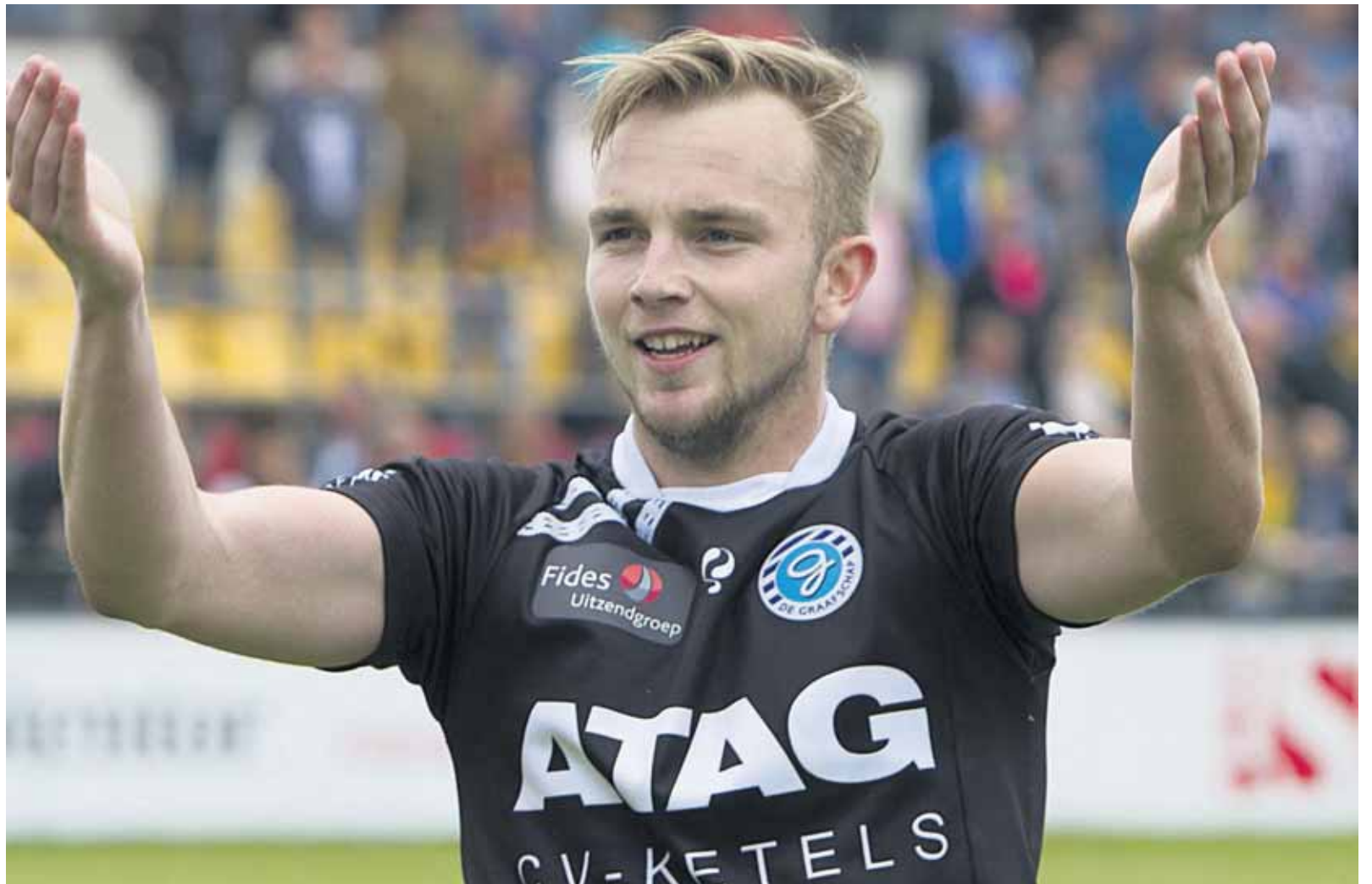
Hidde Jurjus.

LIEVELEDE - Er is een cypers/grijs gestreepte kater gevonden met een witte bef, voor witte teentjes, witte vlek op de borst, hapje uit het rechter oor, mist de hoektanden in de bovenkaak. Voor informatie kan contact worden opgenomen met Stichting Amivedi, meldpunt Aalten/Achterhoek, Sylvia Spaargaren, tel. 088 - 0063305 of achterhoek@amivedi.com.