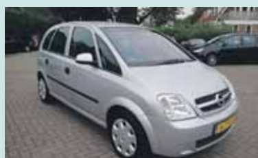
Opel Meriva 1.6-16V Enjoy 2004 149.614 KM € 2.850,- Auto Paashuis Lichtenvoorde