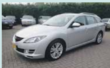
Mazda 2.0 CITD Business Navi 2009 181.518 KM € 8.850,- Auto Paashuis Lichtenvoorde