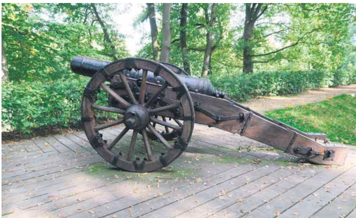
Het Grolse Kanon.