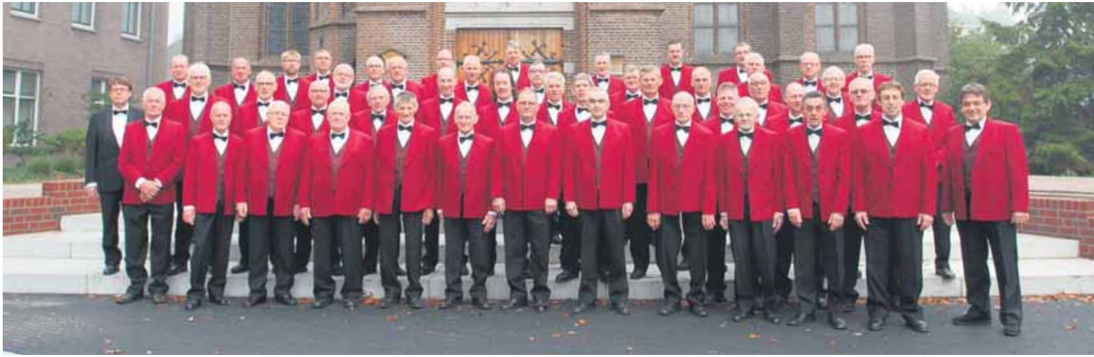
Het Beltrums Mannenkoor.

BELTRUM - Het Beltrums Mannenkoor geeft op zaterdagavond 14 oktober een concert met de titel: Songs from the heart all around the world . Dit in samenwerking met het accordeonorkest Animato uit Hengelo (O). Het concert begint om 19.30 uur en vindt plaats in de RK kerk in Beltrum.