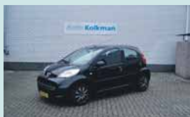
Peugeot 107 1.0-12V SUBLIME 2009 102.521 KM € 5.200,- Auto Kolkman Groenlo