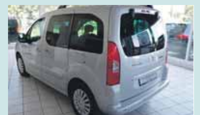
Citroën Berlingo 1.6 VTi 120 2010 87.756 KM € 9.950,- Auto Kolkman Groenlo