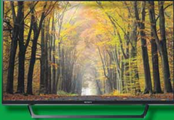
KD-40WE660 Full HD LED TV

• 40 Inch / 101 cm • MotionFlow XR 400 Hz • X-Reality™ PRO • Meteen online met de speciale YouTube™-knop • ClearAudio+ • High Dynamic Range zorgt ervoor dat zelfs de kleinste details vol van kleur en haarscherp worden weergegeven