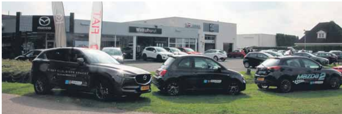
De showroom van Winkelhorst.

WINTERSWIJK - Auto Winkelhorst, Mazda- en Fiat-dealer aan de Vreehorstweg 1 in Winterswijk, houdt op zaterdag 7 en zondag 8 oktober van 10.00 tot 17.00 uur de ‘Now Or Never’-show.