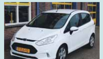
Ford B-MAX 1.0 EcoBoost 2015 30.398 KM € 15.500,- Autobedrijf Ilink Vragender