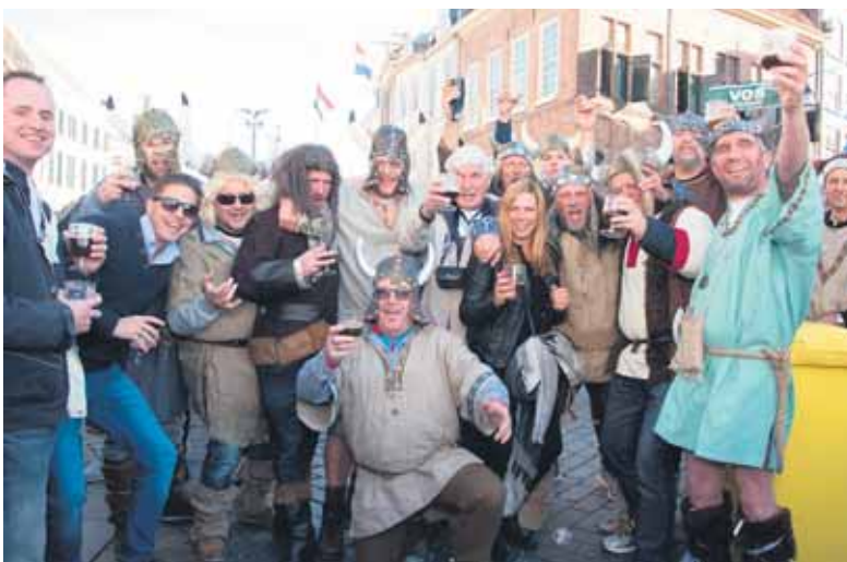
Deze Vikingen zijn elk jaar weer van de partij op de Bokbierdag.

Door de reconstructie van de IJsselkade, een vitale verkeersader, heeft de organisatie besloten de nostalgische optocht een jaartje over te slaan. In plaats van de historische voertuigen is er nu extra veel muziek, zijn er oude ambachten en wordt er een demonstratie bier brouwen gegeven. Ondanks het niet doorgaan van de optocht rijdt