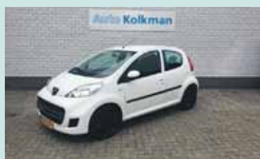
Peugeot 107 1.0-12V URBAN 2011 121.510 KM € 5.450,- Auto Kolkman Groenlo