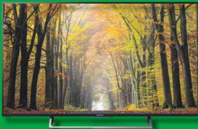
KDL-49XE7096 4K Ultra HD LED TV

• 49 Inch / 124 cm • Ultra HD (4K): 4 keer scherper dan Full HD • Smart TV, toegang tot een breed aanbod van apps, games en programma's • Ook deze TV is geschikt voor het spelen van games op een zeer hoge resolutie. Met dank aan de ongekend scherpe helderheid zijn alle details van uw game zichtbaar