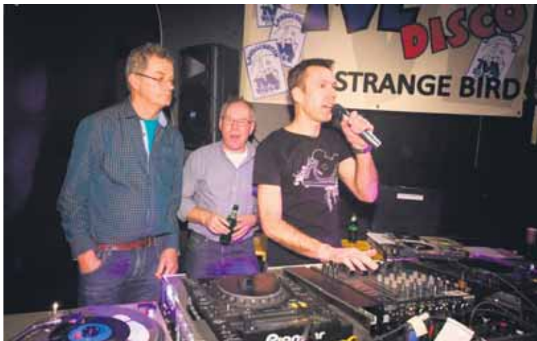
De DJ's van Black Out, hier in actie tijdens popreünie Roomse Herrie LIVE 2013 in City-Lido.