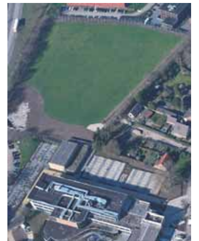
Planverkenning voor een nieuwe sporthal bij het Marianum Groenlo

Nu start eerst de planverkenning naar de locatie Marianum voor de sporthal. Naast overeenstemming met het Marianum over de uitgangspunten