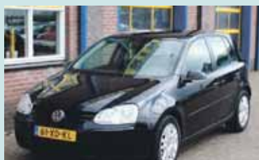
Volkswagen Golf V 1.9 TDI Trendline 2007 229.500 KM € 5.750,- Autobedrijf Ilink Vragender