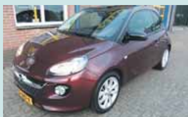
Opel ADAM 1.2 Jam LED- 2015 47.509 KM € 12.250,- Autobedrijf Ilink Vragender

Kijk op achterhoekauto.nl voor het volledige aanbod en alle specificaties