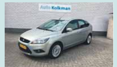
Ford Focus 1.8 LIMITED, 2010 174.927 KM € 8.945,- Auto Kolkman Groenlo