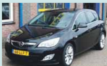
Opel Astra 1.6 Cosmo 5-drs 2010 120.937 KM € 9.950,- Autobedrijf Ilink Vragender