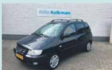
Hyundai Matrix 1.6i ACTIVE 2005 77.250 KM € 4.250,- Auto Kolkman Groenlo