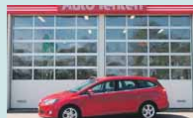
Ford Focus 1.6 TDCi 115pk 2011 220.000 KM € 6.350,- Auto Tenten Lichtenvoorde