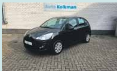
Citroën C3 1.4 Tendance, Airco, 2009 100.140 KM € 7.250,- Auto Kolkman Groenlo