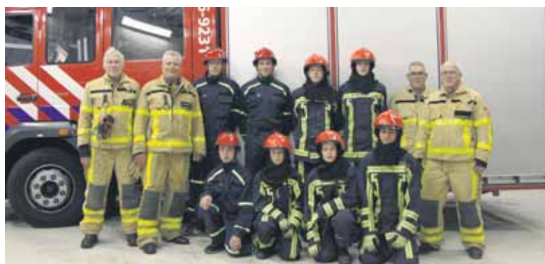
De Jeugdbrandweer Oost Gelre.

OOST GELRE - Zondag 8 oktober Bestaat de Stichting Jeugdbrandweer Oost Gelre tien jaar. Op zondag 8 oktober van 14.00 tot 16.00 uur is er een receptie in de kazerne van de brandweer Groenlo aan de Oude Winterswijkseweg 20 in Groenlo. Een ieder is dan welkom om een kijkje te nemen in de brandweerkazerne waar diverse activiteiten zijn opgezet om een goed beeld te krijgen van de Jeugdbrandweer.