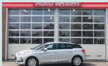
Citroën DS5 2.0 Hybrid4 2013 156.122 KM € 13.950,- Auto Tenten Lichtenvoorde

versterkt door licht- en geluidseffecten. Dankzij 'x-ray vision' is het zelfs mogelijk om een Audi onderhouds te ontdekken. De Audi VR Experience wordt nu al ingezet in de gedigitaliseerde 'private lounge' van Audi Centrum Hengelo. Nog dit jaar krijgen vijf andere Nederlandse Audi Centra met een private lounge de beschikking over de vooruitstrevende VR-technologie. (BJK)