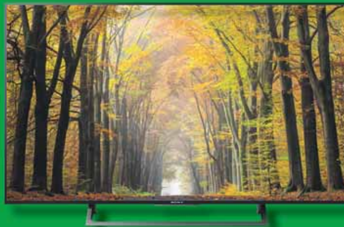
KDL-49XE8099 4K Ultra HD LED TV

• 49 Inch / 124 cm • Ultra HD (4K): 4 keer scherper dan Full HD • Geniet van levendige en levens-echte kleuren dankzij het TRILUMINOS™-display • Android TV voorzien van geavanceerde spraakbesturing. Hierdoor heeft u razendsnel toegang tot uw favoriete TV programma of apps zoals Netflix