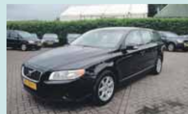
Volvo V70 2.0D Limited 2009 281.870 KM € 8.950,- Auto Paashuis Lichtenvoorde