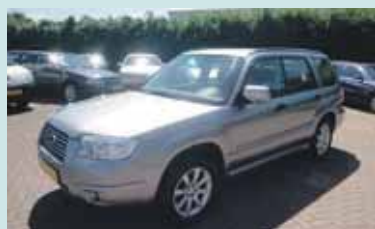
Subaru Forester 2.0 X Luxury 2007 174.056 KM € 8.850,- Auto Paashuis Lichtenvoorde