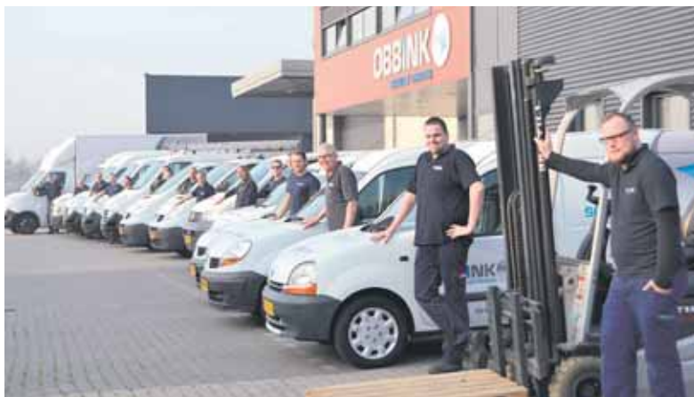
Obbink-servicemonteurs bij het Service Center in Lichtenvoorde.

Obbink: “Via de servicewebsite is het ook mogelijk om de status van