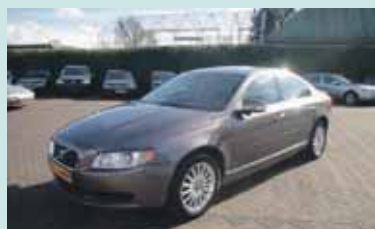
Volvo S80 3.2 Summum 2007 42.451 KM € 16.950,- Auto Paashuis Lichtenvoorde