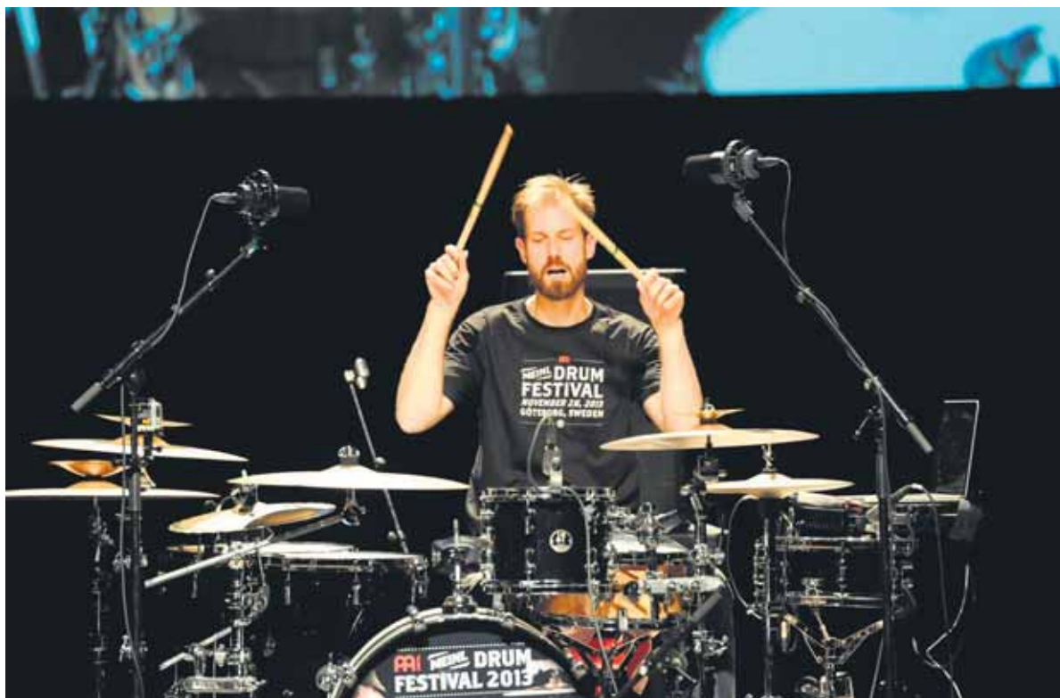
Benny Greb.