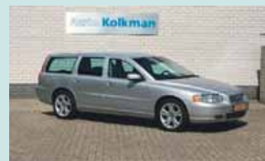
Volvo V70 2.4D EDITION I, 2007 264.250 KM € 8.250,- Auto Kolkman Groenlo