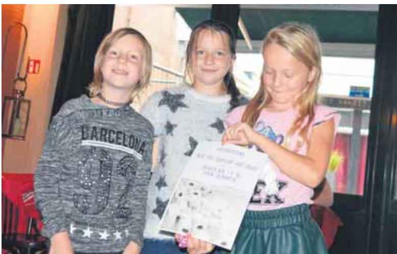
De beste verkopers bij de jeugd verdienen een extraatje.

GROENLO - Op een regenachtige zaterdagochtend stond er al vroeg een handjevol actieve leden van handbalvereniging Grol klaar bij de hal van Auto Arink in Groenlo. Over enkele ogenblikken zou de schuifdeur opengaan en kon iedereen zijn verkochte pakken toiletpapier meenemen in auto, busje of op de aanhanger. Leden die niet zelf in de gelegenheid waren om de pakken op te halen, kregen bezoek aan huis van volgepakte auto's om zo later de pakken te kunnen verspreiden.