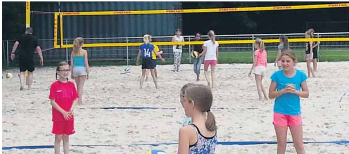
Veel kinderen maakten kennis met (beach) volley.