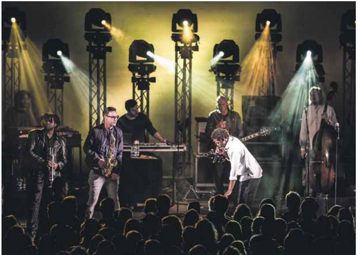
Typhoon in het Openluchttheater.