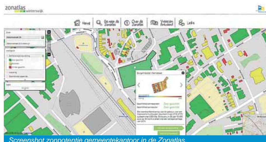
Screenshot zonpotentie gemeentekantoor in de Zonatlas.

Op het dak van ons gemeentekantoor liggen ook zonnepanelen. In totaal is er ruimte voor zo'n 275 zonnepanelen. Een groot deel van deze panelen is al geïnstalleerd. Als gemeente geven we natuurlijk graag het goede voorbeeld. Samen meer schone energie opwekken in onze gemeente: doet u ook mee?