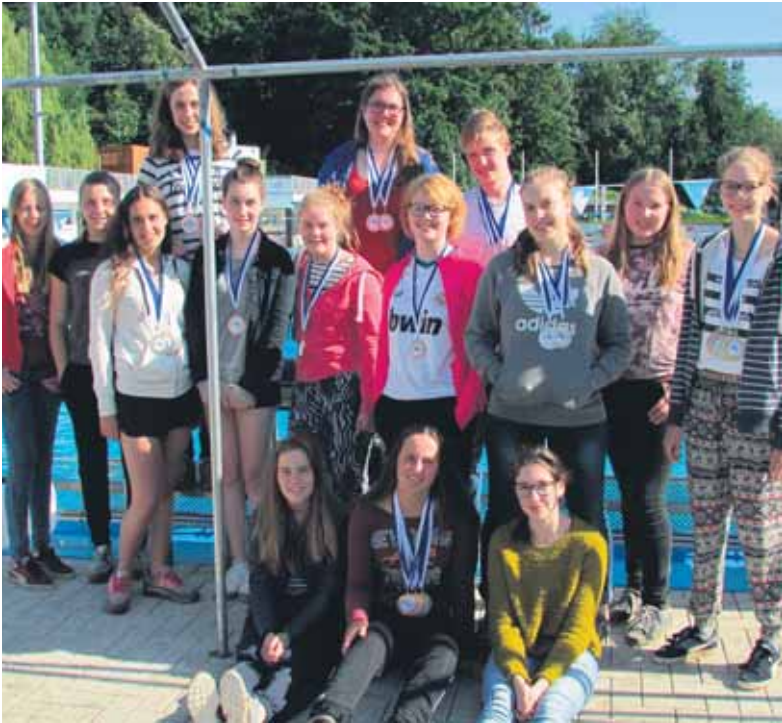
Het team van WWV.