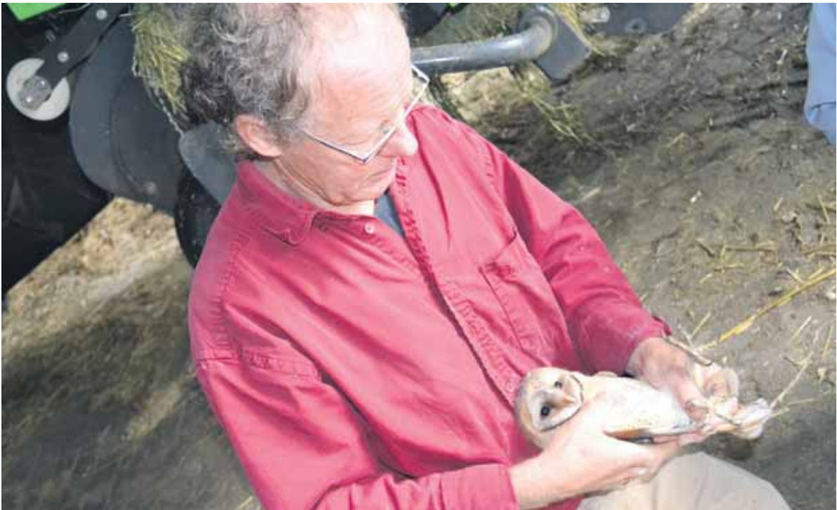
Het uilskuiken wordt gemeten.