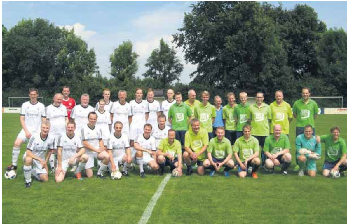
De teams, bestaande uit ambtenaren van de gemeenten Winterswijk en Vreden.