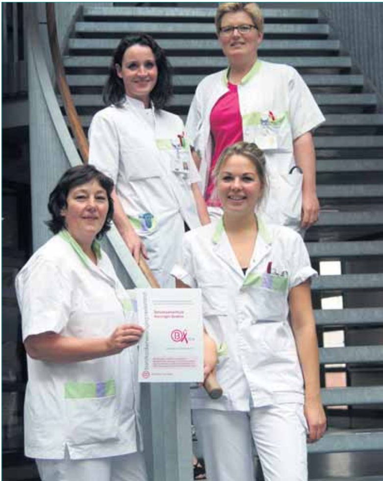
Het team is blij met de waardering voor de zorg.