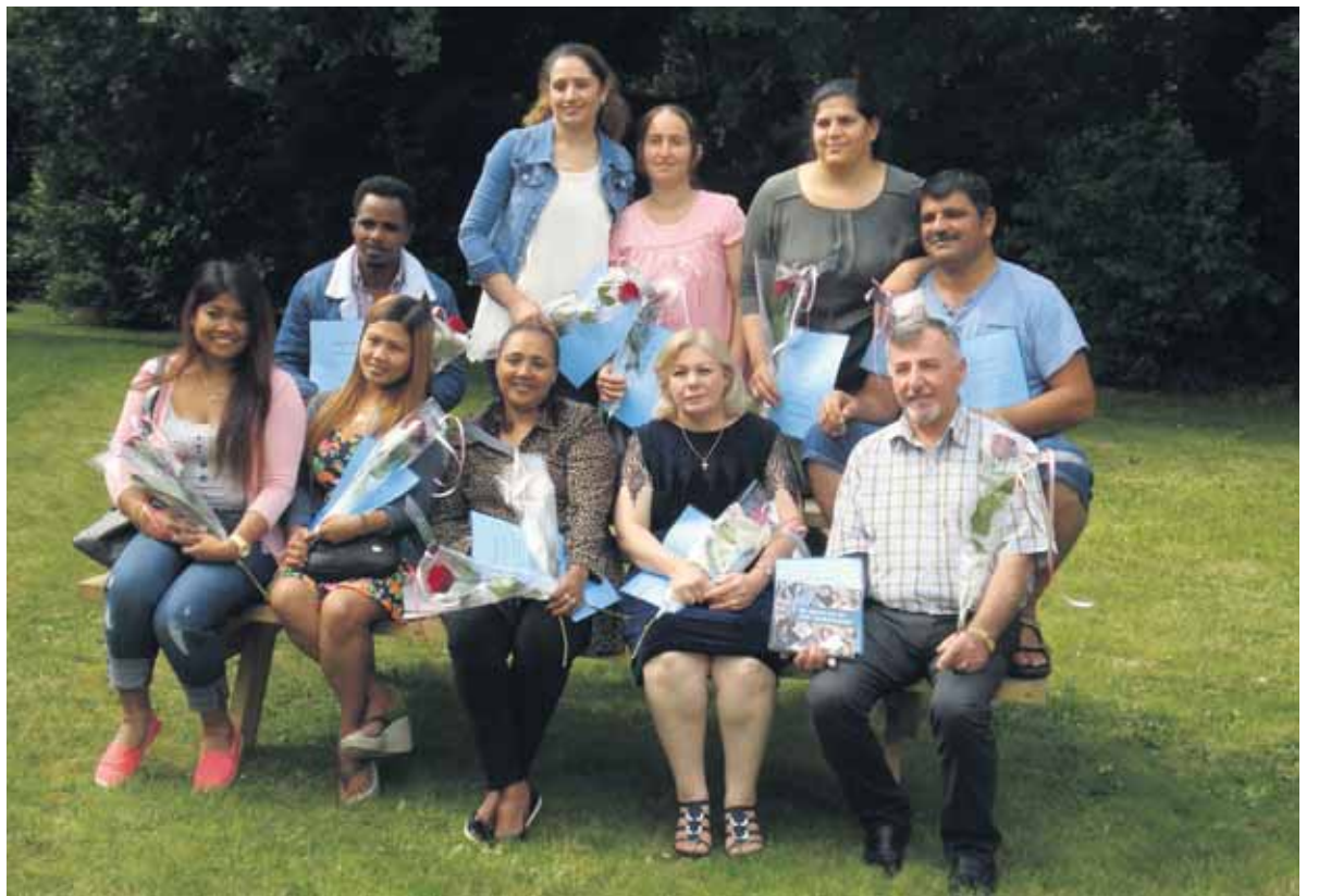
De cursisten met het verdiende certificaat.