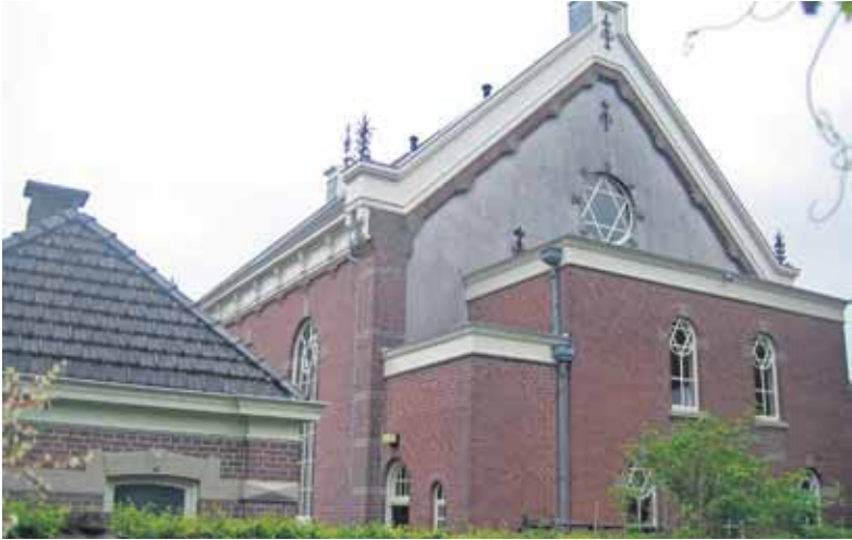
De synagoge van Winterswijk, met het mikwe.