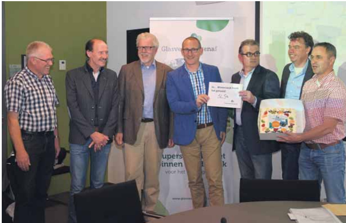
Tevredenheid over het al voor de sluitingsdatum behalen van het benodigde aantal aanmeldingen voor glasvezel.