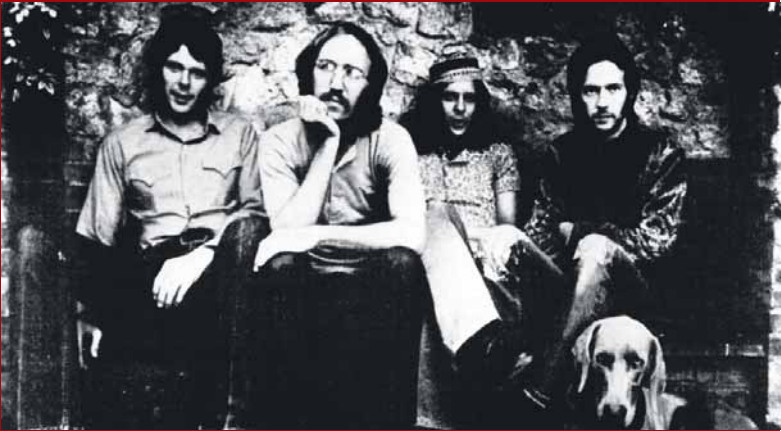
Derek and the Dominos in 1970 (vlnr): Jim Gordon, Carl Radle, Bobby Whitlock and Eric Clapton.

'I don't want to lose this feeling' Eric Clapton staat voor me. Na de eerste noot die hij speelt is het duidelijk dat hij het echt is. Het is een enorme kick. Het vierde nummer van het optreden is Bell Bottom Blues. Dat ken ik van een elpee! Ik noem voor mezelf de bandleden op van Derek and the Dominos: Clapton op gitaar en zang, Jim Gordon op drums, Carl Radle op bas en Bobby Whitlock met zijn mooie rauwe, hoge stem op toetsen. De ballad Bell Bottom Blues klinkt zo echt en puur. De gitaren huilen en gieren. Clapton en Whitlock zingen hun longen uit hun lijf. Het liedje moet wel over een heel mooi meisje gaan, stel ik mij voor. Zou het om Patti Boyd gaan, de vrouw van George Harrison waarvoor ook Layla is geschreven? Clapton was namelijk tot over z'n oren verliefd op haar. Bell bottoms, dat zijn toch van die broeken met wijde pijpen? Het wordt een liedje dat blijft hangen en ik geniet van het concert. Wanneer ik halverwege de