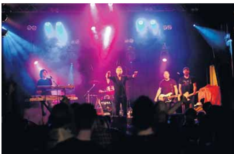
Doe Maar Undercover is ook in 2016 weer op Reurpop te bewonderen.

Een verslag van een bezoeker die het optreden van Doe Maar undercover op Reurpop 2015 als volgt beschreef: "Zodra ze beginnen te spelen denk je weer aan