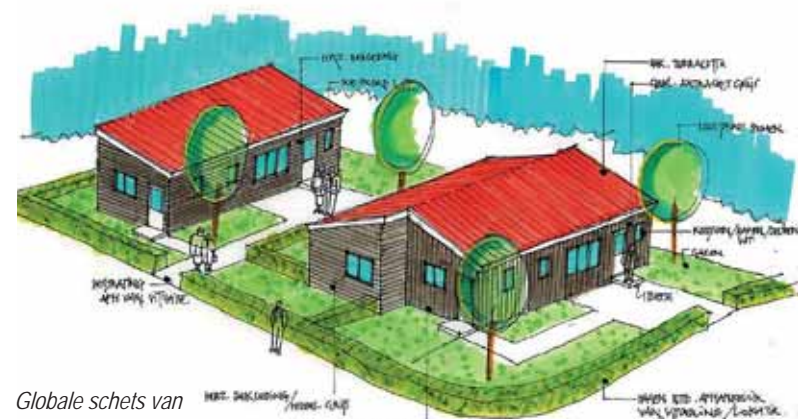
Globale schets van de tijdelijke woningen, dit is een impressie, uitvoering kan nog wijzigen