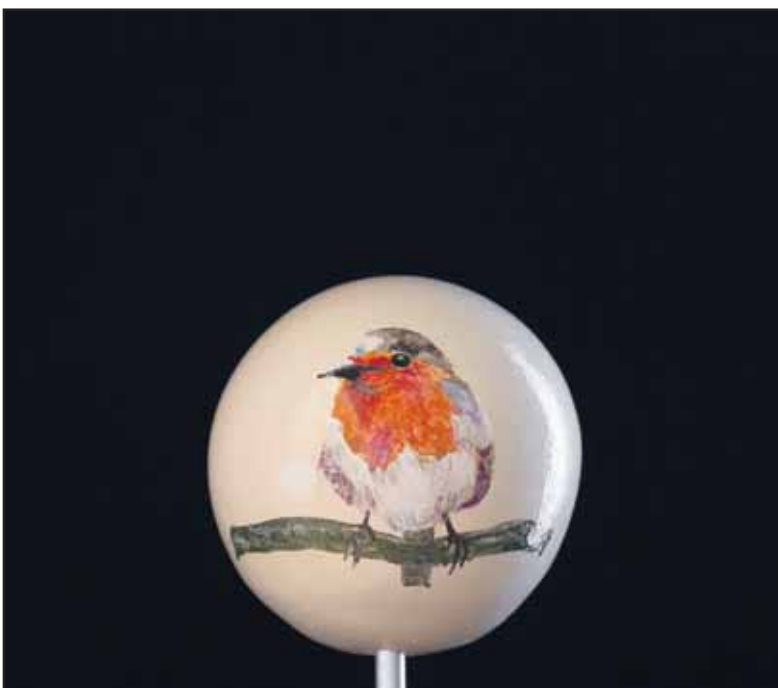
Werk van Hilde Grooters.

■ Steengruis, Houtsnippers en Glassplinters is een initiatief van fotograaf Bas Weetink (www.basweetink.nl) en schrijver/uitgever Rob Weeber (www.vanatoto.com). Belangstellenden kunnen het boekje met tweeëntwintig 3D kunstenaars bestellen via rob@vanatoto.com . De prijs bedraagt € 10.