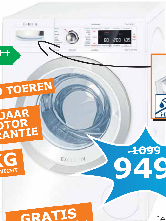
BOSCH WAW32672NL WASMACHINE

GEMAKKELIJK EN BETER VOOR UW KLEDING EN PORTEMONNEE