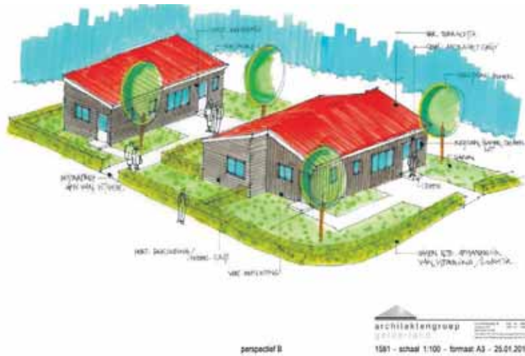
Een 'artist impression' van de tijdelijke woningen.

Vluchtelingen met een verblijfsvergunning hebben de asielprocedure al doorlopen. We geven begeleiding bij de inburgering en kiezen bewust voor kleine locaties om inburgering te bevorderen. Inmiddels zijn in Berkelland al jaren lang stathouders gehuisvest. In