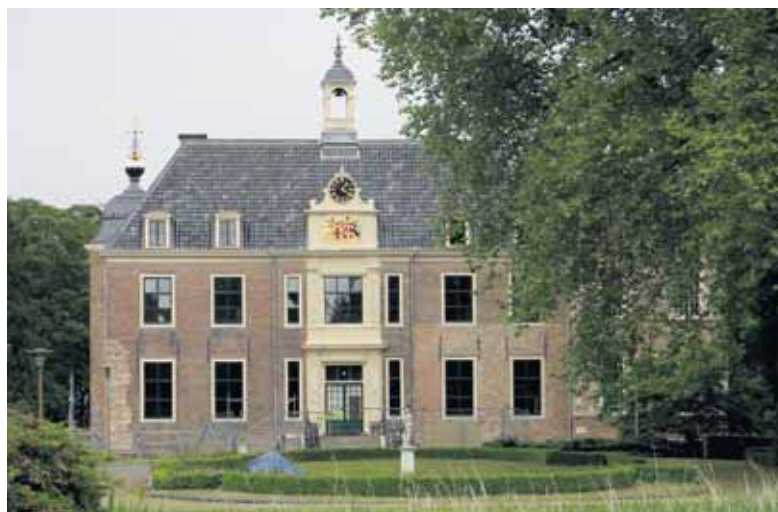
Kasteel Ruurlo staat centraal tijdens de lezing van Old Reurle.

Hierbij heeft hij alle medewerking gekregen van architect Cor Bouwstra en het bouwteam. Tijdens de lezing zullen de bouwwijzigingen op alle verdiepingen van kelder tot en met de zolder