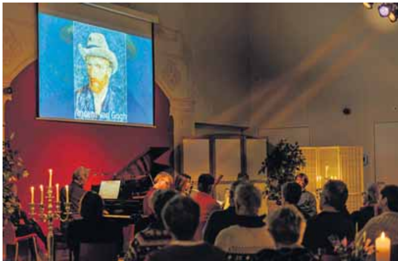
Een concert en een tentoonstelling rondom Van Gogh vormde een mooie mix.