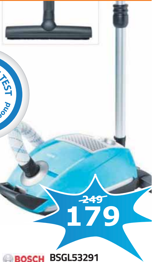
BOSCH BSG53291 STOFZUIGER

PureAir hygiëne filter, 15m actieradius, 4 zwenkwielen, telescoopbuis met schuifmanchet, XXL-aan-/uitschakelaar, met de voet bedienbaar, AirBumper, 4.5 liter inhoud, stofzak vol indicatie, energielabel AACA