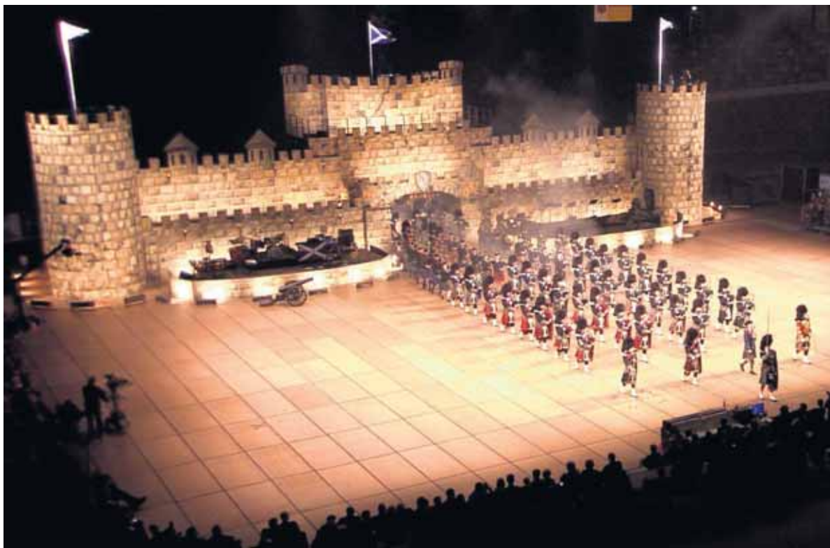
The Music Show Scotland heeft een levensecht kasteel als decor voor circa tweehonderd muzikanten en danseressen.

Dat is feitelijk hetzelfde wat The Music Show Scotland doet. Maar dan met Keltische muziek. Waarbij vooral de spectaculaire opzet opvalt. Zo wordt een levensecht kasteel opgebouwd als decor voor de circa tweehonderd muzikanten en danseressen, afkomstig uit vijf landen. "In totaal zijn er tien opleggercombinaties nodig om al het materiaal te vervoeren. Het kasteel is zo overweldigend groot en ziet er zo echt uit dat het publiek na afloop vaak even wil voelen of het niet van steen is gemaakt. En door de speciale licht- en geluidseffecten wanen de toeschouwers zich echt in de Schotse Highlands."