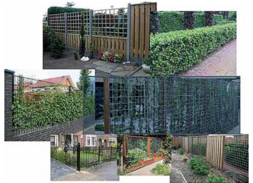
Deze erfafscheidingen voldoen aan de voorwaarden. Ze hebben een open en vriendelijke uitstraling.

“Regels worden vaak als een belemmering beschouwd. Dat zien we overal in het land. Daarom proberen we regels zo veel mogelijk te beperken. Daar waar toch regels nodig zijn, zoals bij een bouwaanvraag, willen we dit zo snel mogelijk afwickelen voor onze inwoners. In Berkelland willen we met dit experiment de procedure versnellen en hiermee tegemoet komen aan de wens van inwoners en ondernemers. Daar waar het kan, ben ik als wethouder groot voorstander van versnelde regelgeving. Wij willen deze wens van onze inwoners oppakken en kijken of dat in de praktijk werkt.