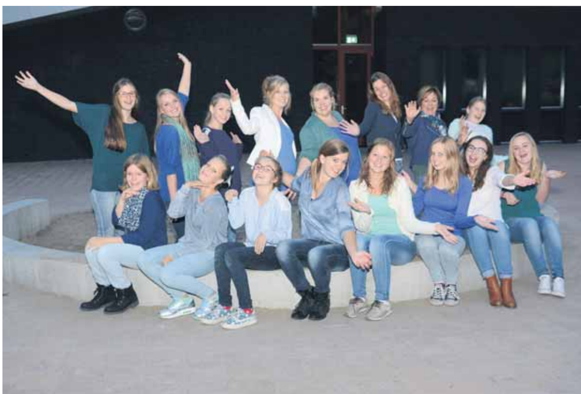
@Seven uit Ruurlo treedt op tijdens het Valentijnsconcert in Borculo.

De Vocal Group EigenWijs onder leiding van Rogier IJmker en op de piano begeleid door Bram Verhagen bestaat uit dertien zangers/zangeressen. Het is een enthousiast en gedreven gezelschap dat diverse muziekstijlen ten gehore brengt: popsongs, close harmony en jazz. Voor dit concert is gekozen voor onder andere Be still my heart, Nature boy en Walking in the air. EigenWijs concentreert zich niet alleen op het zingen, maar ook de presentatie en uitstraling op het podium krijgen de nodige aandacht. Contact met publiek, een wisselwerking, een vonk laten overslaan, een balans tussen kijken en luisteren zijn kenmerkend voor EigenWijs. Meidengroep @Seven heeft zeven-