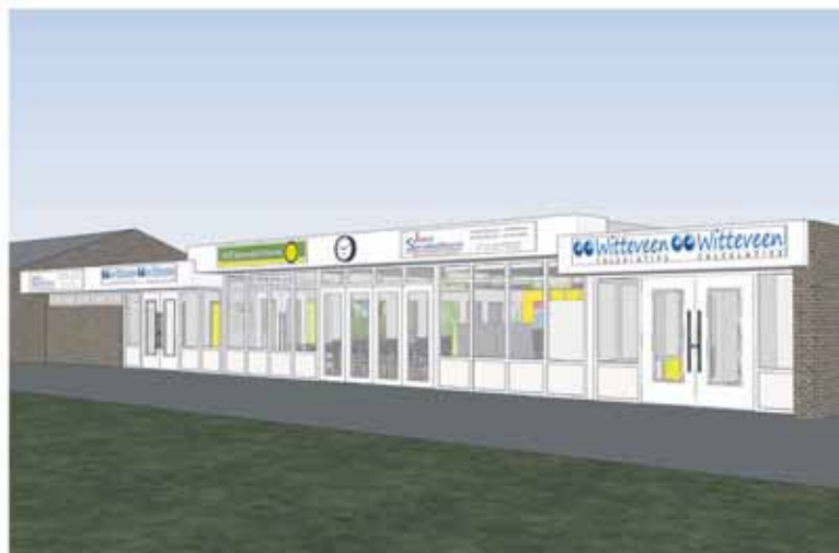
Het ontwerp van de nieuwe voorzijde van de kantine van VV Ruurlo.

Na de presentatie van de plannen en een 'vragenuurtje' gaven de ruim vijftig aanwezige leden door middel van deze ledenraadpleging een positief advies aan het bestuur van Stichting Beheer Sportpark 't Rikkelder die het sportpark beheert. Aansluitend vond een algemene buitengewone ledenvergadering van VV Ruurlo plaats voor de verstrekking van een geldlening door de vereniging aan de stichting om de verbouw mede mogelijk te maken. Enkele weken geleden schonk een anonieme schenker onverwachts 35.000 euro aan de Stichting Beheer Sportpark 't Rikkelder voor de verbouwplannen van de kantine. Ook kan de stichting 10.000 euro verwachten van Stichting Fonds 1819 voor de verbouw. De verbouw omvat onder meer een vernieuwde entree aan de zijde van de kleedaccommodatie met een centrale gang die ook toegang biedt naar een nieuw sanitairgedeelte en de kleedaccommodatie. De huidige garde-