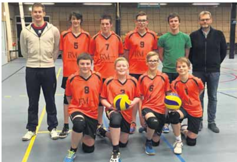
Spelers en leiding van Tornax met de sponsors.

Vorige week heeft Van Woudenberg het Jongens B team van Tornax voorzien van nieuwe shirts. Het jongensteam per januari gepromoveerd naar de eerste klasse van de jongenscompetitie B, heeft afgelopen zaterdag mogen schitteren in het mooie tenue van Rouwhorst & Maertzdorff. En schitteren dat deden de jongens tegen Tornado Laren. Op de tweede set na hadden de jongens van Tornax veel overwicht en sloten de wedstrijd dan ook af met een klinkende 4-0 overwinning.