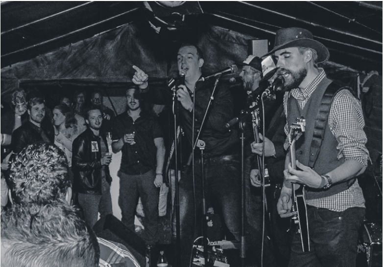
Band Opschaakl’n.

Underkoffer is een band uit Hengelo die met een divers repertoire de bühne op komt. Nummers uit de 50’s maar ook muziek van nu, voor elk wat wils. Opschaakl’n! is een nieuwe dialectband die in het najaar van 2016 het licht zag. De instrumentalisten komen uit de buurt: Vorden, Harfsen, Lochem en Zutphen zijn vertegenwoordigd. De eerste feesten hebben ze de tent al op de kop gezet en in