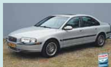
Volvo S80 2.4 Comfort 1999 163.038 KM € 4.950,- Autobedrijf Groot JebbinWorden / Zutphen