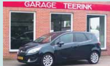
Opel Meriva 1.4 Turbo Cosmo 2014 28.457 KM € 16.500,- Garagebedrijf Teerink Doetinchem