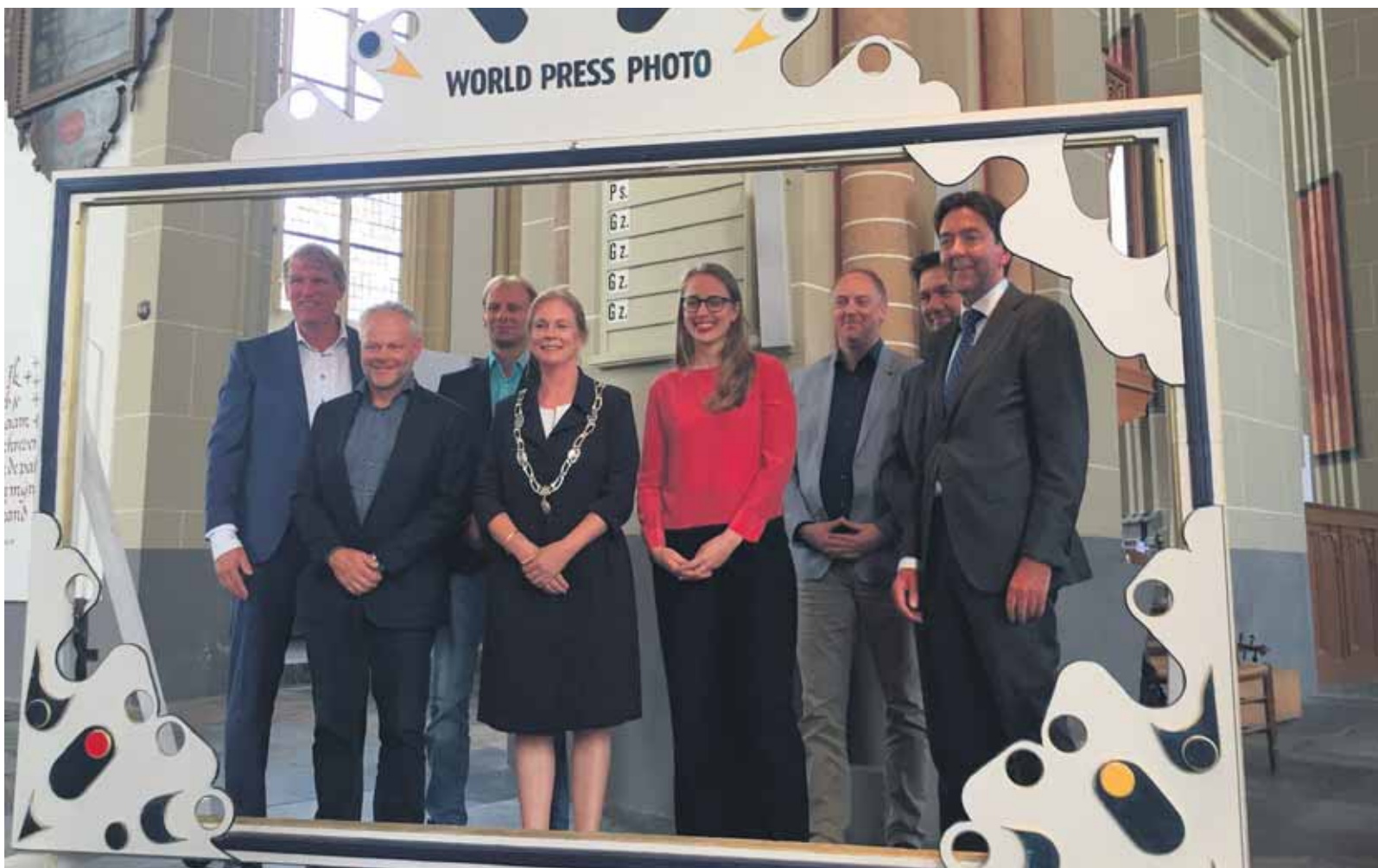
De officiële openingshandeling was, hoe kan het ook anders, het maken van een foto.

Perspectief Zutphen is overgaan tot afstoting van haar peutervoorzieningen vanwege wetswijzigingen in de kinderopvang. In overleg met de gemeente Zutphen heeft Perspectief Zutphen besloten de voorzieningen, inclusief de leiders, te laten overnemen door een bestaande kinderopvangorganisatie. Stichting Archipel en Kindercentrum.nl hebben hiervoor de handen ineen geslagen en zijn trots dat ze de peutergroepen van Perspectief mogen voortzetten in de Zuidwijken en bij basisschool De Waaier in het Waterkwartier.