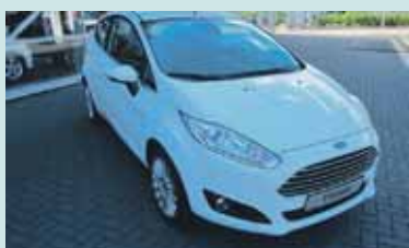
Ford Fiesta 1.0 100PK 3Deurs 2016 10 KM € 15.473,- Ford Zutphen Zutphen