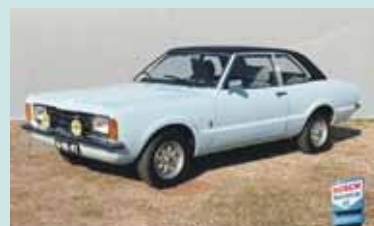
Ford TAUNUS 1600L 1976 20.736 KM € 7.245,- Autobedrijf Groot JebbinWorden / Zutphen