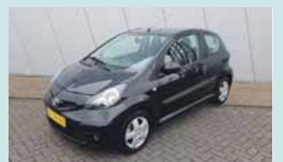
Toyota Aygo 1.0 AUTOMAT 2008 25.260 KM € 5.999,- Automobilbedrijf Nijendijk Zutphen