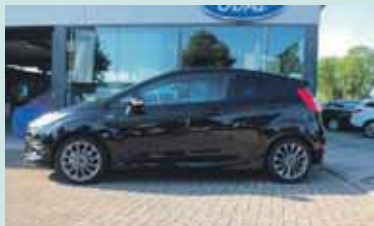
Ford Fiesta 1.0 125PK 3Deurs 2017 10 KM € 18.495,- Ford Zutphen Zutphen

Het vlaggenschip van Audi is opgebouwd uit veel aluminium en composiet materialen en wordt geleverd met flinke motoren. Van V6 (voor de instap diesel- en benzineversie), via V8 (benzine & diesel) tot aan W12. In Duitsland wordt de auto een paar duizend euro's duurder, van 84.000 euro naar 90.600 euro. Bij ons kostte de goedkoopste A8 101.905 euro. (BJK)