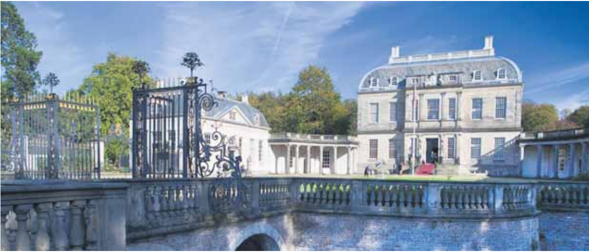
Huis De Voorst.

bevolen. Start 14.00 uur op de parkeerplaats bij Huis ‘t Velde, Rijksstraatweg 127 in Warnsveld. Deelname 5 euro (kinderen 4 t/m 12 jaar 2,50 euro). Donateurs Gel-