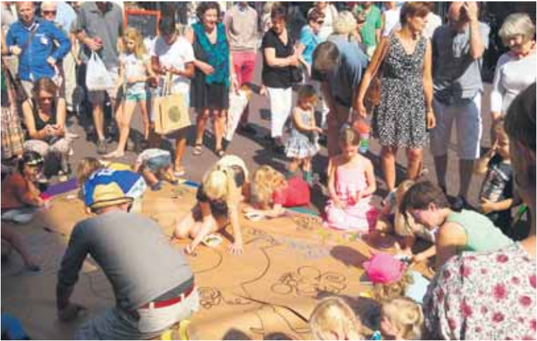
Kleurfeest Cellofestival Zutphen.