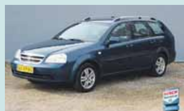
Chevrolet Nubira Station Wagon 2007 189.554 KM € 3.450,- Autobedrijf Groot JebbinWorden / Zutphen