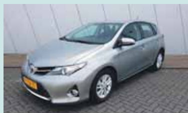
Toyota Auris 1.8 FULL HYBRID 2014 41.385 KM € 19.599,- Automobilbedrijf Nijendijk Zutphen