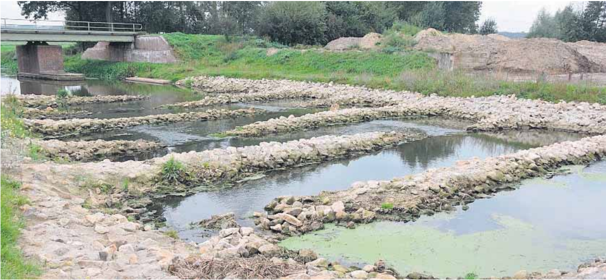
De stuw bij Warken.

De tocht gaat verder naar de stuw bij Warken. De vispassage die hier