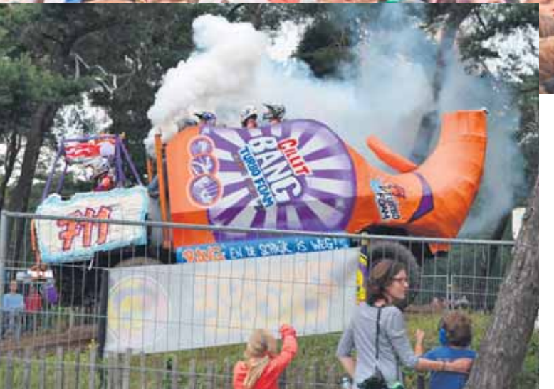
Spektakel op de crossbaan.