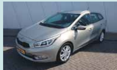
KIA Ceed SW 1.6 GDI 2015 47.222 KM € 18.599,- Automobilbedrijf Nijendijk Zutphen