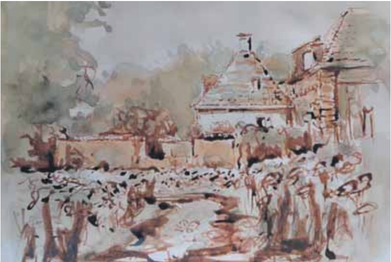
Tekening ‘Huisje op de Bleek’ van Jan Baggen.

Jan Baggen: “Tekenpen en aquarel-blokje en voor olieverf een handig klein Pochade-kistje zijn vanwege