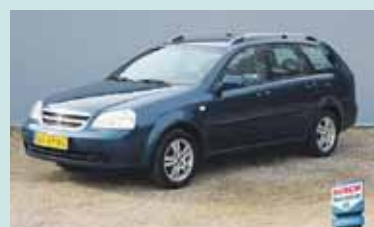
Chevrolet Nubira Station Wagon 2007 189.554 KM € 3.450,- Autobedrijf Groot JebbinWorden / Zutphen

Wilt u als Bovag-autodealer ook op deze pagina staan?