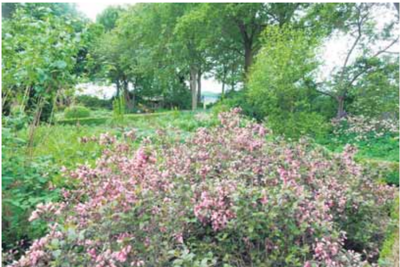
Een van de tuinen in Gorsel.

Bos, uiterwaarden en coulisse­landschap verbindt alle zes de tuinen binnen een straal van vijf kilometer. Goed te bereiken met de auto en een extra ervaring door de route te fietsen. Alle tuinei­genaren zullen u graag ontvangen en vertellen over het wel en wee van hun tuin.