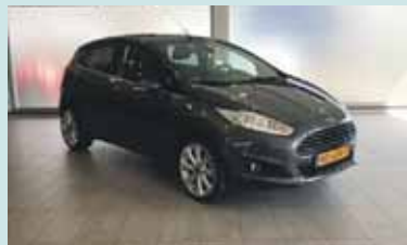
Ford Fiesta 1.0 100PK 5dr 2016 10.627 KM € 16.440,- Ford Zutphen Zutphen