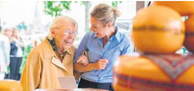
Afgelopen week bezochten bewoners van Huis Welgelegen de markt in Zutphen.

W. vertelt: “Vroeger genoot ik al van alle verse waren op de markt en kocht ik producten om lekker te koken, nu geniet ik vooral van het uitstapje zelf. “Na het struinen over de markt, waarbij de dames behoorlijk doorstappen om de hele markt te kunnen zien, genieten de bewoners van een cappuccino met appeltaart en slagroom bij ‘t Volkshuis.