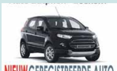
Ford ECOSPORT 1.0EcoBoost 2017 10 KM € 23.567,- Ford Zutphen Zutphen