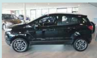
Ford ECOSPORT 1.0EcoBoost 2017 10 KM € 24.555,- Ford Zutphen Zutphen