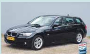
BMW 3-Touring 318i Luxury 2011 99.800 KM € 16.895,- Autobedrijf Groot JebbinWorden / Zutphen