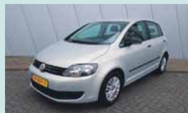
Volkswagen Golf Plus 1.2 TSI 7-DSG 2010 105.205 KM € 14.499,- Automobilbedrijf Nijendijk Zutphen