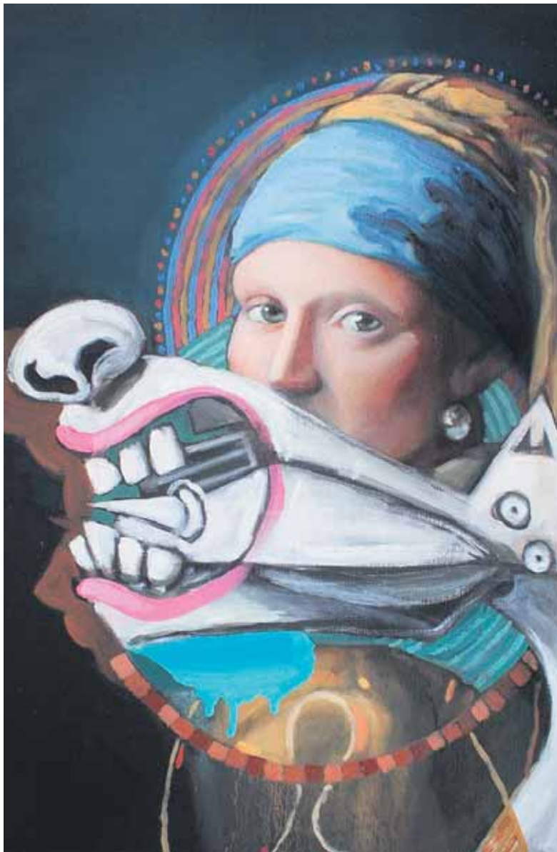
'Meisje met de paardenbek' van Dewi Hoppe.

In en rondom Het Koelhuis in Zutphen, laten talenten van de AKI Academie of Art & Design en gerenommeerde kunstenaars unieke