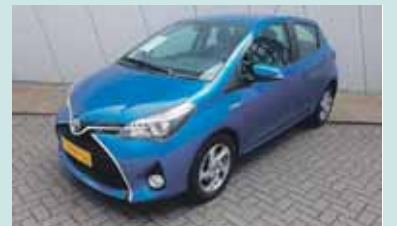
Toyota Yaris 1.5 FULL HYBRID 2014 25.346 KM € 16.999,- Automobilbedrijf Nijendijk Zutphen