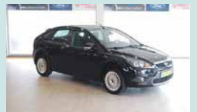
Ford Focus 1.6i 16v Titanium 2008 106.927 KM € 8.400,- Ford Zutphen Zutphen