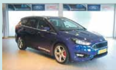
Ford 1.0 ECOBOOST 125PK 2016 18.106 KM € 22.890,- Ford Zutphen Zutphen