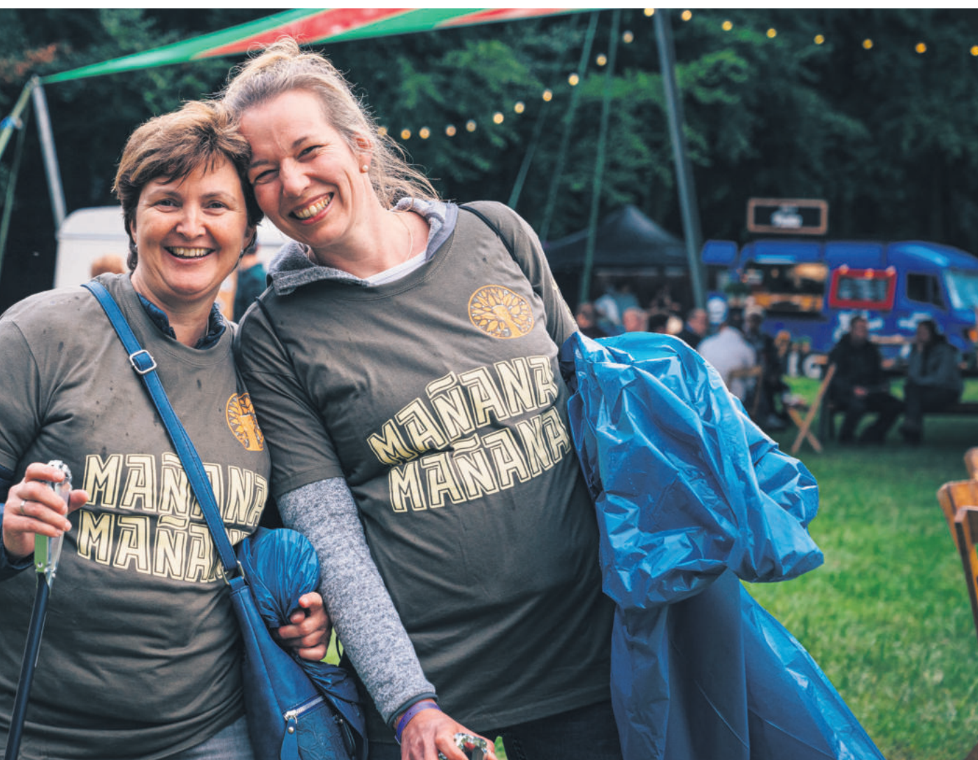
Voor veel medewerkers is werken op de Zwarte Cross en Mañana Mañana een feest op zich.