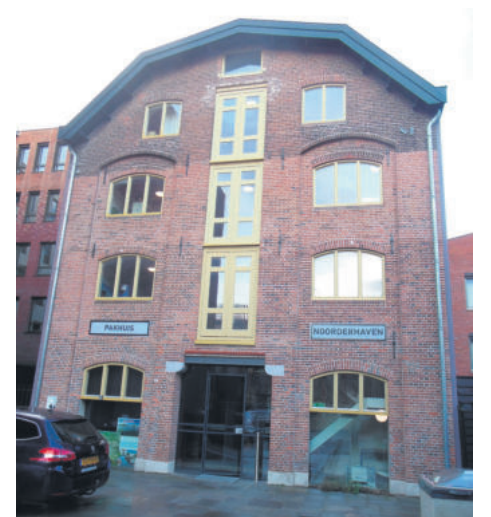
Het oude Pakhuis op het voormalige bedrijventerrein De Mars in Zutphen, waarin sinds 2013 het Cleantech Center is gevestigd.