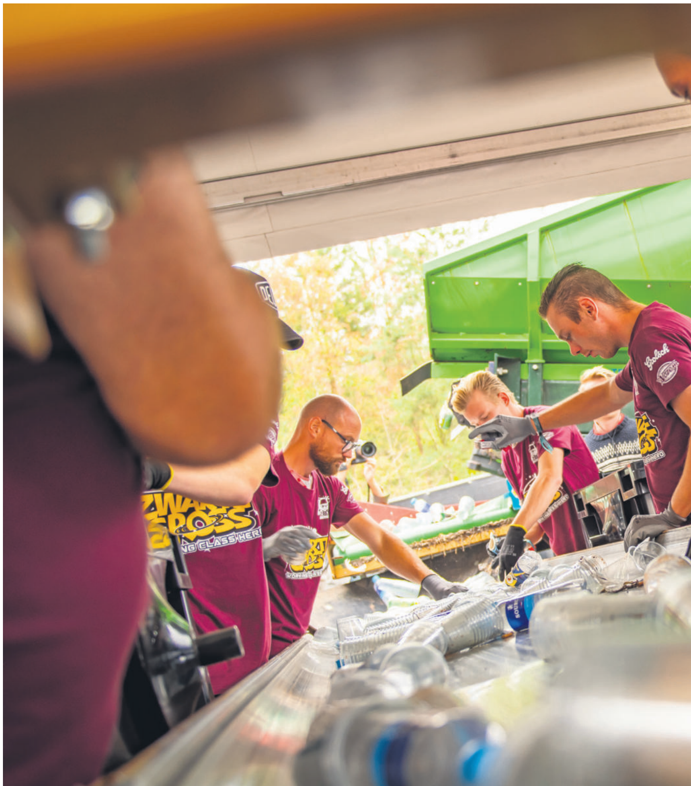
De Feestfabriek heeft duurzaamheid hoog in het vaandel. Onder het motto 'scheiden was nog nooit zo makkelijk' wordt het afval gescheiden ingezameld op het terrein. Het nascheiden van de afvalbakken gebeurt op de milieuplaats die op het terrein is ingericht.