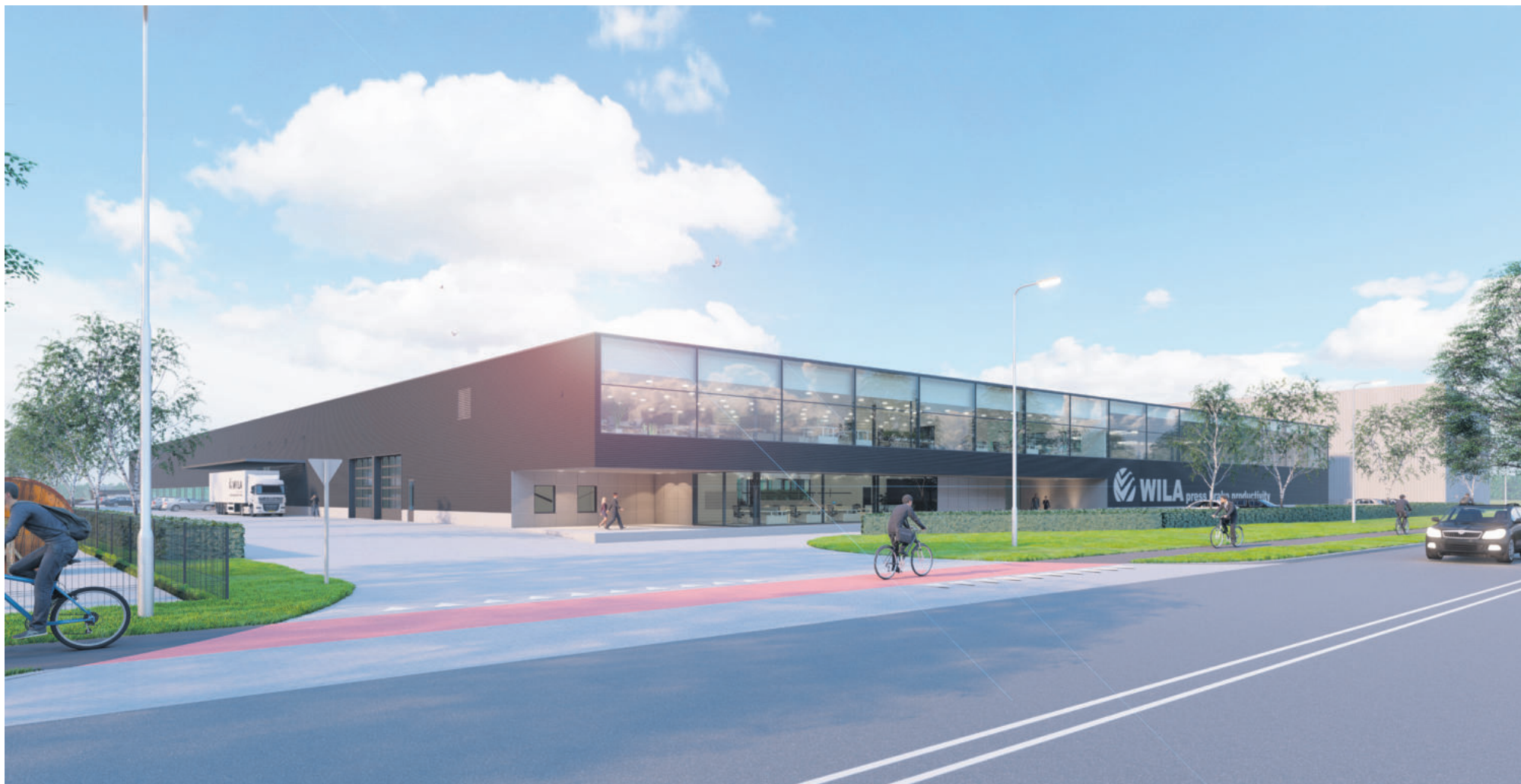
Het nog te bouwen pand aan de Kwinkweerd in Lochem dat 'de Tool' gaat heten. Artist impression: Maas Architecten Lochem

LOCHEM - Wila Press Brake Productivity uit Lochem is wereldwijd bekend als leverancier van kantpersgereedschap en -houders. Sinds 2012 maakt het bedrijf een enorme groei door. In dat jaar werkten 200 mensen bij Wila. Anno 2019 zijn dat er 400. Het managen van die onstuimige groei is een klus op zich.